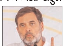
महिलाएं, मजदूर और छोटे व्यापारी सब रो रहे हैं, प्रधानमंत्री हंसते हुए रील बना रहे हैं तथा भाजपा वाले ताली बजा रहे हैं। यह नेतृत्व नहीं, नौटंकी है।

नई दिल्ली। कांग्रेस नेता राहुल गांधी ने प्रधानमंत्री नरेंद्र मोदी के इटली दौरे को लेकर उन पर जमकर निशाना साधा और कहा कि देश आर्थिक चुनौतियों से जूझ रहा है, वहीं श्री मोदी विदेश में टॉफी बांटने और रील बनाने में व्यस्त हैं।