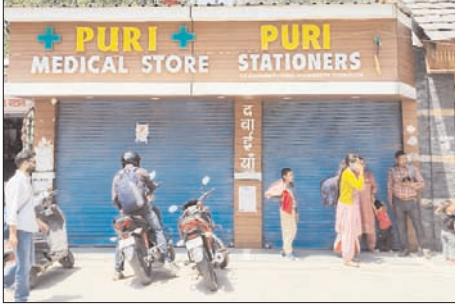
गंगोत्री से आराकोट तक केमिस्टों का प्रदर्शन मरीजों की सुरक्षा और नकली दवाओं पर उठाए सवाल

शाह टाइम्स संवाददाता उत्तरकाशी। ऑनलाइन दवा बिक्री के खिलाफ जिले भर में भी गंगोत्री से लेकर आराकोट तक सभी मेडिकल स्टोर बंद रहे। बुधवार को दवा बिक्रीताओं ने अखिल भारतीय केमिस्ट एवं ड्रगिस्ट संगठन (एआईओसीडी) द्वारा घोषित देशव्यापी आंदोलन के समर्थन में केमिस्ट्री की दुकानें बंद रखीं। जिले भर में मेडिकल स्टोर बंद रहने से आम लोगों को दवाइयों की उपलब्धता को लेकर परेशानी का सामना करना पड़ा, हालांकि केमिस्ट संगठनों ने आपातकालीन जरूरतों के लिए वैकल्पिक व्यवस्था बनाए रखने का दावा किया।