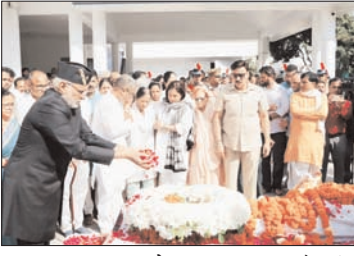
देहरादून। उपराष्ट्रपति सीपी राधाकृष्णन, राज्यपाल लेफ्टिनेंट जनरल गुरमीत सिंह (से.नि) एवं पूर्व मुख्यमंत्री पुष्कर सिंह धामी ने