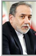
इसमें हफ्तों चले इस संघर्ष के दौरान अमेरिकी वायुसेना को हुए भारी नुकसान की बात स्वीकार की गई

तेहरान। ईरान के विदेश मंत्री अब्बास अराघची ने बुधवार को चेतावनी दी कि बिना किसी उकसावे के अगर अमेरिका ने उनके खिलाफ फिर से आक्रामक रुख अपनाया तो अमेरिका को देने के लिए उनके पास 'कई और बड़े झटके' तैयार हैं। इसके साथ ही उन्होंने अमेरिकी कांग्रेस (संसद) की एक रिपोर्ट का हवाला दिया। इसमें हफ्तों चले इस संघर्ष के दौरान अमेरिकी वायुसेना को हुए भारी नुकसान की बात स्वीकार की गई है।