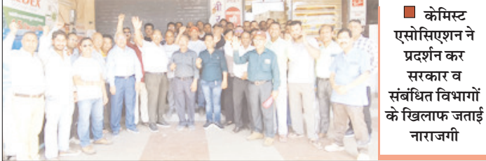
केमिस्ट एसोसिएशन ने प्रदर्शन कर सरकार व संबंधित विभागों के खिलाफ जताई नाराजगी

शाह टाइम्स संवाददाता विकासनगर। अपनी विभिन्न मांगों को लेकर पछवाड़न क्षेत्र में बुधवार को केमिस्ट एसोसिएशन के आह्वान पर मेडिकल स्टोर बंद रहे। इस दौरान विकासनगर में केमिस्ट एसोसिएशन के पदाधिकारियों और सदस्यों ने प्रदर्शन कर सरकार और संबंधित विभागों के खिलाफ नारा जगी जताई। प्रदर्शन में बड़ी संख्या में दवा व्यापारियों ने भाग लेते हुए अपनी मांगों के समर्थन में आवाज बुलंद की। प्रदर्शन के दौरान दवा व्यापारियों ने कहा कि लंबे समय से उनकी विभिन्न समस्याएं और मांगें लंबित हैं, लेकिन अब तक उनका समाधान