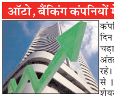
ऑटो, बैंकिंग कंपनियों में लिवाली

नई दिल्ली, वाता ऑटो और बैंकिंग कंपनियों में लिवाली से घरेलू शेयर बाजार बुधवार को शुरुआती गिरावट से उबरते हुए अंत में बढ़त के साथ बंद हुए। बीएसई का 30 शेयरों वाला संवेदी सूचकांक संसेक्स 117.54 अंक (0.16 प्रतिशत) की मजबूती के साथ 75,318.39 अंक पर पहुंच गया। बाजार में आज 877 अंक का उतार-चढ़ाव रहा। बीच कारोबार में संसेक्स नीचे 74,529 अंक और ऊपर 75,406 अंक तक गया। नेशनल स्टॉक एक्सचेंज (एनएसई) का निफ्टी 50 सूचकांक की 41 अंक यानी 0.17 प्रतिशत चढ़कर 23,659 अंक पर बंद हुआ। वृहत बाजार भी सुबह लाल निशान में रहने के बाद में हरे निशान में चला गया। निफ्टी मिडकैप-50 सूचकांक 0.49 प्रतिशत और स्मॉलकैप-100 सूचकांक 0.04 प्रतिशत ऊपर बंद हुआ। तेल एंड गैस, ऑटो, बैंकिंग और रिटलेंटो सेक्टरों में तेजी रही, जबकि मीडिया, एफएमसीजी और आईटी सेक्टर दबाव में रहे। एनएसई में जिन 3,372 कंपनियों के शेयरों में कारोबार हुआ उनमें से 1,720 के शेयर हरे निशान में और 1,542 के लाल निशान में रहे। अन्य 100