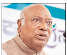
कहा: आम जनता आर्थिक नीतियों से पैदा हुई 'मुश्किलों' के बीच जीवनयापन करने को मजबूर

नई दिल्ली, वाता कांग्रेस अध्यक्ष मल्लिकार्जुन खड़गे ने कहा है कि देश गंभीर आर्थिक संकट में है लेकिन प्रधानमंत्री नरेंद्र मोदी तथा उनके नेतृत्व वाली सरकार सिर्फ आत्म प्रचार में व्यस्त है और इसी का परिणाम है कि देश में महंगाई, बेरोजगारी और आर्थिक संकट गंभीर रूप से बढ़ा है और जनता पर आर्थिक बोझ थोपा गया है। खड़गे ने सोशल मीडिया एक्स पर बुधवार को लिखा कि श्री मोदी जनता को भाषणों की 'मिठास' सुनाना चाहते हैं, जबकि आम जनता उनकी सरकार की आर्थिक नीतियों से पैदा हुई 'मुश्किलों' के बीच जीवनयापन करने को मजबूर है। उन्होंने दावा किया कि पिछले 11 वर्षों में प्रत्येक भारतीय पर औसत कर्ज कई गुना बढ़ा है, जबकि चुनिंदा उद्योगपतियों की संपत्ति में तेजी से इजाफा हुआ है। कांग्रेस अध्यक्ष ने