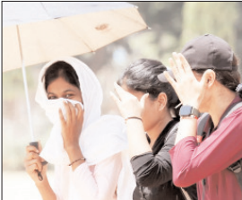
अगले पांच दिनों तक भीषण गर्मी और लू का प्रकोप जारी रहने की संभावना: मौसम विभाग