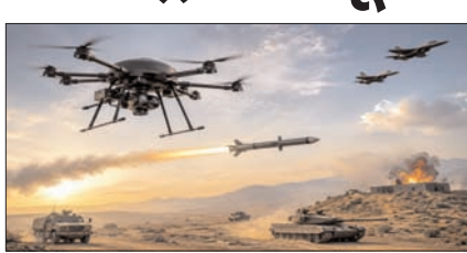
टैंक, हेलीकॉप्टर और दूसरे ड्रोन को निशाना बना सकेगी, डीआरडीओ ने स्वदेशी कंपनियों के साथ बनाया

नई दिल्ली। भारत की डिफेंस रिसर्च एंड डेवलपमेंट ऑर्गनाइजेशन (डीआरडीओ) ने ड्रोन से दागी जाने वाली मिसाइल का ट्रायल पूरा कर लिया है। इस मिसाइल का नाम यूएलपीजीएम- वी3 है। यह हवा से हवा और हवा से जमीन दोनों तरह के टारगेट पर सटीक हमला कर सकती है। हवा में दुरमन के हेलीकॉप्टर, ड्रोन और दूसरे हवाई टारगेट को मार गिरा सकती है। वहीं जमीन पर टैंक, सैन्य वाहन और बंकर को निशाना बना सकती है। रक्षा मंत्रालय के मुताबिक, मिसाइल का परीक्षण आंध्र प्रदेश के कुर्नूल स्थित डीआरडीओ टेस्ट रेंज में किया गया। इसमें इंटीग्रेटेड ग्राउंड कंट्रोल सिस्टम का इस्तेमाल किया गया, जो लॉन्च और कमांड सिस्टम को कंट्रोल करता है। रक्षा मंत्री राजनाथ सिंह ने कहा कि इस मिसाइल को बनाने में मिली सफलता रक्षा क्षेत्र में