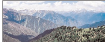
रजदान पास बना आकर्षण का केंद्र सम्पादकीय