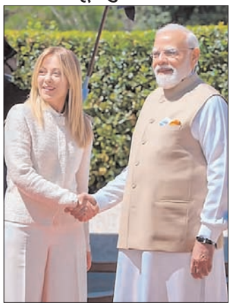
अरब रुपये) के द्विपक्षीय व्यापार को साल 2029 तक बढ़ाकर 20 बिलियन यूरो यानी करीब 2,241.85 अरब रुपये तक पहुंचाना है। यह एक बेहद महत्वाकांक्षी लक्ष्य है, जिसे भारत और यूरोपीय संघ के बीच हस्ताक्षरित मुक्त व्यापार

भारत और इटली ने अपने द्विपक्षीय संबंधों में एक नए स्वर्णिम अध्याय की शुरुआत कर दी है। पीएम मोदी की इटली की पहली द्विपक्षीय यात्रा के दौरान दोनों देशों ने अपने रिश्तों को सर्वोच्च स्तर पर ले जाते हुए विशेष रणनीतिक साझेदारी में अप्रैल कर दिया है। रोम में आयोजित इस ऐतिहासिक शिखर सम्मेलन के दौरान इतालवी प्रधानमंत्री जोर्जिया मेलोनी ने पीएम मोदी का गर्मजोशी से स्वागत किया। मेलोनी ने कहा कि वर्ष 2000 के बाद, यानी पूरे 26 साल बाद किसी भारतीय प्रधानमंत्री को यह पहली द्विपक्षीय इटली यात्रा है, जो दोनों देशों के बीच की दूरी को मिटाकर रिश्तों को एक नई ऊर्जा देगी। द्विपक्षीय वार्ता के बाद साझा प्रेस वक्तव्य में प्रधानमंत्री मेलोनी ने आर्थिक सहयोग को नई ऊंचाइयों पर ले जाने का संकल्प जताया। उन्होंने कहा कि हमारा लक्ष्य वर्तमान 14 बिलियन यूरो ( करीब 1,569.3