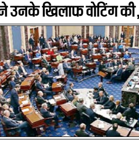
ट्रम्प की सैन्य शक्तियों को सीमित करने की कवायद, युद्ध का अधिकार संसद के पास हो: विपक्ष

वाशिंगटन। अमेरिकी संसद में राष्ट्रपति डोनाल्ड ट्रम्प की सैन्य शक्तियों को सीमित करने वाला प्रस्ताव पास हो गया है। वोटिंग में 4 रिपब्लिकन सांसदों ने भी विपक्षी पार्टी डेमोक्रेट्स का साथ दिया। हालांकि 3 रिपब्लिकन सांसद वोटिंग में शामिल नहीं हुए। यह प्रस्ताव 50.47 से पास हुआ, हालांकि इसे कानून बनाने के लिए अभी कुछ और चरणों से गुजरना होगा। अगर यह प्रस्ताव कानून बनता है, तो ट्रम्प सरकार को ईरान के खिलाफ युद्ध जारी रखने के लिए कांग्रेस की मंजूरी लेनी होगी। अभी सीनेट में इस पर अंतिम वोटिंग होनी बाकी है। इसके बाद इसे रिपब्लिकन बहुमत वाली हाउस आफ रिप्रेजेंटेटिव्स से मंजूरी लेनी होगी। हालांकि उसके बाद भी ट्रम्प इसके खिलाफ वीटो कर सकते हैं। फिर उस वीटो को रद्द करने के लिए सीनेट और हाउस दोनों में दो-तिहाई बहुमत