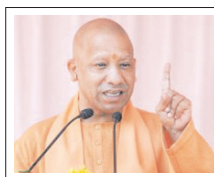
सीएम योगी ने प्रदेश की भविष्य की अर्थव्यवस्था से जुड़े तीन अहम प्रोजेक्ट्स की समीक्षा की

शाह टाइम्स ब्यूरो लखनऊ। मुख्यमंत्री योगी आदित्यनाथ ने बुधवार को अपने सरकारी आवास पर आयोजित उच्चस्तरीय बैठक में प्रदेश की भविष्य की अर्थव्यवस्था से जुड़े तीन अहम प्रोजेक्ट्स की समीक्षा की। योगी ने कहा कि यूपी डाटा सेंटर क्लस्टर परियोजना उत्तर प्रदेश के एआई मिशन की बुनियादी संरचना तैयार करेगी। उन्होंने निर्देश दिया कि डाटा सेंटर क्लस्टर केवल एनसीआर क्षेत्र तक सीमित नहीं रहना चाहिए, बल्कि प्रदेश के अन्य हिस्सों को भी इससे जोड़ा जाए। इसकी शुरुआत बुंदेलखंड औद्योगिक विकास प्राधिकरण क्षेत्र से की जा सकती है जहां बड़े पैमाने पर भूमि उपलब्ध है। सीएम योगी ने प्रदेश की भविष्य की अर्थव्यवस्था से जुड़े तीन अहम प्रोजेक्ट्स की समीक्षा की मुख्यमंत्री ने टाटा समूह समेत बड़ी टेक कंपनियों से संवाद कर लखनऊ को 'एआई सिटी' के रूप में विकसित करने पर जोर दिया। 'प्रोजेक्ट गंगा' यानी गवर्नमेंट अक्सिस्टेड नेटवर्क फॉर ग्रोथ एंड एडवांसमेंट की समीक्षा करते हुए मुख्यमंत्री ने कहा कि चुने गए डिजिटल उद्यमियों को गुणवत्तापूर्ण प्रशिक्षण दिया जाए। उन्होंने कहा कि सर्वेक्षण करने वाली कंपनियां भी इन युवाओं का उपयोग कर सकें, ऐसी व्यवस्था बनाई जाए। ऑफिशियल फाइबर नेटवर्क के तेजी से विस्तार और पारदर्शिता पर जोर देते हुए उन्होंने डिजिटल उद्यमियों को शुरूआत से ही इंस्टॉल करने को कहा। प्रोजेक्ट गंगा के तहत 10 हजार से अधिक युवाओं को डिजिटल सर्विसेस प्रोवाइडर बनाया जाएगा, जिससे 50 हजार प्रत्यक्ष और 1 लाख से अधिक अप्रत्यक्ष रोजगार सृजित होंगे। 20 लाख से अधिक घरों को फाइबर आधारित हाई-स्पीड इंटरनेट से जोड़ा जाएगा। प्रत्येक