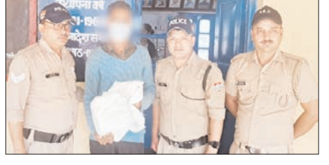
6 घंटे में बड़कोट पुलिस ने आरोपी को किया गिरफ्तार, चोरी की गई इलेक्ट्रॉनिक मोटर बरामद

शाह टाइम्स संवाददाता उत्तरकाशी। धरमसू यमुनोत्री हाई पर निगमाधीन बहुचर्चित सिलक्यारा टनल परियोजना में हुई इलेक्ट्रॉनिक मोटर चोरी की घटना का उत्तराखंड पुलिस की बड़कोट पुलिस ने महज 6-7 घंटे के भीतर खुलासा कर तेज कार्रवाई का उदाहरण पेश किया है। पुलिस ने मामले में आरोपी को गिरफ्तार करते हुए चोरी हुई मोटर भी बरामद कर ली है।