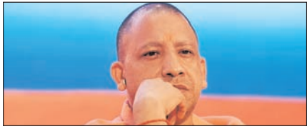
यूपी बनेगा ग्लोबल एआई हब: मुख्यमंत्री योगी पेज 2

नई दिल्ली, मुजफ्फरनगर, देहरादून, हल्द्वानी, मुगदाबाद, बरेली, मेरठ व लखनऊ से प्रकाशित