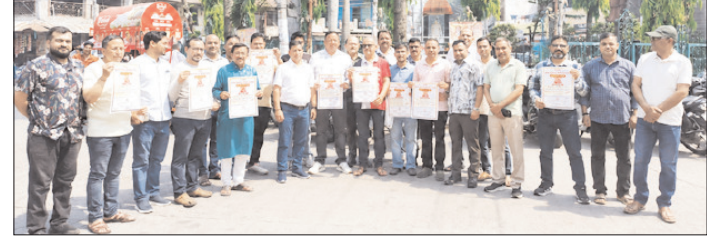
श्रीनगर, श्रीकोट सहित अधिकांश जगहों पर बंद रहे मेडिकल स्टोर

शाह टाइम्स संवाददाता श्रीनगर। ई-फार्मसी की ओर से ऑनलाइन दवाइयों की बिक्री और भारी डिस्काउंट के विरोध में बुधवार को ऑल इंडिया ऑर्गेनाइजेशन ऑफ केमिस्ट्स एंड ड्रगिस्ट्स के देशव्यापी हड़ताल का असर देखने को मिला। इस दौरान श्रीनगर, श्रीकोट सहित अन्य स्थानों पर मेडिकल स्टोर पूर्ण रूप से बंद रहे। जिससे मरीजों को दवाइयों के लिए इधर उधर भटकना पड़ा। इस दौरान स्थानीय गोला पार्क पर मेडिकल स्टोर संचालकों ने ई-फार्मसी के विरोध में प्रदर्शन किया। इस दौरान उन्होंने सरकार से