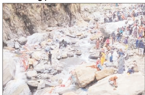
दिखाई दे रहे लगी है। स्थानीय लोगों और तीर्थ यात्रियों का कहना है कि यदि यही स्थिति जारी रही तो मां यमुना का प्राकृतिक स्वरूप प्रभावित हो सकता है। धार्मिक मान्यताओं के अनुसार श्रद्धालु मां यमुना को वस्त्र अर्पित कर अपनी मनोकामनाएं पूर्ण होने की

शाह टाइम्स संवाददाता बड़कोट/यमुनोत्री। विश्व प्रसिद्ध यमुनोत्री धाम में इन दिनों आस्था का सैलाब उमड़ रहा है। चारधाम यात्रा के तहत प्रतिदिन हजारों श्रद्धालु मां यमुना के दर्शन के लिए पहुंच रहे हैं। श्रद्धालु पूरे श्रद्धाभाव के साथ पूजा-अर्चना, स्नान और धार्मिक अनुष्ठान कर रहे हैं, लेकिन आस्था के नाम पर हो रही कुछ परंपराएं अब मां यमुना की निर्मलता और पर्यावरण के लिए गंभीर चिंता का विषय बनती जा रही हैं। धाम क्षेत्र में बड़ी संख्या में श्रद्धालु मां यमुना को साड़ियां, चुनरी, वस्त्र और अन्य पूजन सामग्री अर्पित करने के बाद उन्हें सीधे नदी में प्रवाहित कर रहे हैं। लगातार यमुना जी में डाले जा रहे कपड़े, प्लास्टिक और पूजा सामग्री के कारण यमुना जलधारा के कई हिस्सों में गंदगी