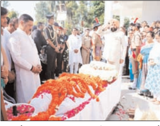
उपराष्ट्रपति राधाकृष्णन ने शोक संतप परिजनों से मुलाकात कर अपनी गहरी संवेदनाएं व्यक्त की तथा दिवंगत आत्मा की शांति के लिए प्रार्थना की।