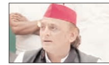
लोग संविधान के तहत गारंटीकृत अधिकारों को सुरक्षित करने के लिए अदालतों का दरवाजा खटखटाने के लिए मजबूर

शाह टाइम्स ब्यूरो लखनऊ। समाजवादी पार्टी अध्यक्ष अखिलेश यादव ने बुधवार को भारतीय जनता पार्टी सरकार पर संवैधानिक आरक्षण प्रणाली को कमजोर करने का गंभीर आरोप लगाया। उन्होंने कहा कि लोगों को संविधान के तहत गारंटीकृत अधिकारों को सुरक्षित करने के लिए अदालतों का दरवाजा खटखटाने के लिए मजबूर किया जा रहा है। लखनऊ में पार्टी मुख्यालय में प्रेस कॉन्फ्रेंस की संबोधित करते हुए अखिलेश यादव ने 'आरक्षण को लूट' से संबोधित 'पीडीए ऑर्डर' नामक एक दस्तावेज जारी किया। उन्होंने कहा कि इस रिपोर्ट को और अधिक डेटा और तथ्यों के साथ अपडेट किया जाता रहेगा। भाजपा पर निशाना साधते हुए सपा प्रमुख ने कहा कि अगर छात्रों और