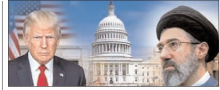
अमेरिकी संसद में ईरान जंग रोकने वाला प्रस्ताव पास पेज 12