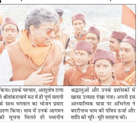
श्रद्धालुओं और उनके प्रशंसकों में खासा उत्साह देखा गया। अपनी इस आध्यात्मिक यात्रा पर अभिनेता ने बदरीनाथ धाम पर अतिरिक्त दर्शन की सूचना मिलते ही स्थानीय शांति की भूरि-भूरि सराहना की।