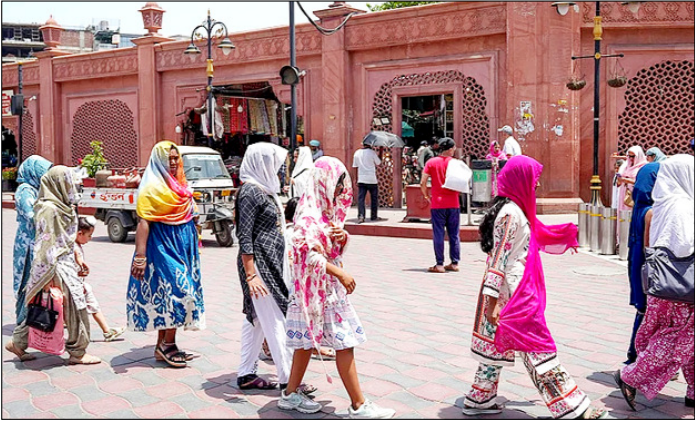
अमृतसर। गर्मी के मौसम में भीषण गर्मी के बीच खुद को ठंडक कर चलते लोग।

एशियाई उत्पादकता संगठन की तीन दिवसीय बैठक राजधानी में गुरुवार से नई दिल्ली। एशियाई उत्पादकता संगठन (एपीओ) के अधिशासी मंडल (जीवी) की तीन दिवसीय 68वीं बैठक यहां भारत मंडल में गुरुवार को शुरू होगी। भारत की अध्यक्षता में इस बैठक में एपीओ के 20 सदस्य देशों के 60 से अधिक प्रतिनिधि भाग लेंगे। बुधवार को जारी आधिकारिक