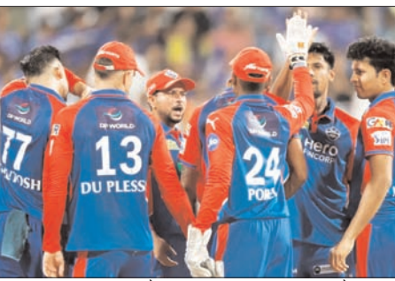
जायेगी। दूसरी तरफ एक ओर हार दिल्ली की उम्मीदों पर करारा प्रहार करेगी। डीसी टॉप ऑर्डर बनाम जोफ्रा आर्चर इस सीजन पावरप्ले में सबसे ज्यादा विकेट लेने वाले गेंदबाज जोफ्रा आर्चर के सामने डीसी का मजबूत टॉप

जयपुर, वार्ता। आईपीएल 2026 के 43वें मैच में राजस्थान रॉयल्स (आआर) का सामना दिल्ली कैपिटल्स (डीसी) से होगा। लगातार तीन हार झेल चुकी डीसी को पिछले दो मैचों में बेहद करारी हार मिली है। टीम अब आत्मविश्वास वापस हासिल करके अपने अभियान को परती पर लाने की कोशिश करेगी। पिछले तीन में से दो मैच जीत चुकी आआर की लय अच्छी चल रही है और वे इसे ही जारी रखना चाहेंगे। राजस्थान नौ मैचों में 12 अंकों के साथ तालिका में चौथे स्थान पर है जबकि दिल्ली आठ मैचों में छह अंकों के साथ सातवें स्थान पर है। राजस्थान जीत के साथ प्लेऑफ के करीब पहुंच जायेगी। दूसरी तरफ एक ओर हार दिल्ली की उम्मीदों पर करारा प्रहार करेगी। डीसी टॉप ऑर्डर बनाम जोफ्रा आर्चर इस सीजन पावरप्ले में सबसे ज्यादा विकेट लेने वाले गेंदबाज जोफ्रा आर्चर के सामने डीसी का मजबूत टॉप