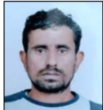
डिस्ट्रीली कोतवाली क्षेत्र के गांव हरियाना स्थित साबरी इंटरनेशनल

शाह टाइम्स ब्यूरो जोधा। डिस्ट्रीली कोतवाली क्षेत्र में गुरुवार सुबह एक दर्दनाक सड़क हादसे में बाइक डेली सवार युवक की मौत हो गई। वहीं, जबकि उसका साथी गंभीर रूप से घायल हो गया। हादसा उस समय हुआ जब सामने से आ रहे स्कूल टैम्पो ने बाइक डेली को टक्कर मार दी। टक्कर के बाद टैम्पो चालक मौके से फरार हो गया। पुलिस ने शव को कब्जे में लेकर घायल को अस्पताल में भर्ती कराया है और मामले की जांच कर रही है।