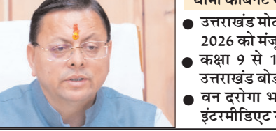
धामी कैबिनेट में 18 प्रस्तावों पर लगी मुहर

शह टाइम्स ब्यूरो देहरादून। मुख्यमंत्री पुष्कर सिंह धामी की अध्यक्षता में हुई मंत्रिमंडल की बैठक संपन्न हो गई है। बैठक में 18 महत्वपूर्ण प्रस्तावों पर मुहर लगी है। मुख्य रूप से कृषि मंत्रालय के विधायक और अस्थायी कार्यों के लिए कुंभ मेला अधिकारी और गढ़वाल कमिश्नर के वित्तीय पावर दी गई है। इसके अलावा परिवहन निगम को 250 नई बसों के खरीदने का मंजूरी मिली है। खास बात यह है कि वन दरोगा भर्ती के लिए पहले शैक्षिक अर्हता इंटरमीडिएट थी, लेकिन अब इसे बढ़ाकर स्नातक कर दिया गया है। कक्षा 1 से 8 तक के चार सौ मदरसों को अब जिला