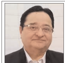
मांग थी कि आरक्षण में ही आरक्षण दिया जाए जिससे सबको भागीदारी सुनिश्चित हो सके। सदन में उन्होंने हमेशा सां. प्रदायिकता के खिलाफ आवाज उठाई और हिंदुस्तान को गंगा जमुनी तहजीब का गवारा बताया।

शाह टाइम्स ब्यूरो लखनऊ। विधानसभा सत्र के दौरान मुख्यमंत्री योगी आदित्यनाथ ने महिला आरक्षण व अन्य मुद्दों पर चर्चा करते हुए जहां आजम खान अबू आजमी और वही मुरादाबाद के पूर्व सांसद डाक्टर एसटी हसन का भी नाम लिया। मुरादाबाद के डाक्टर एसटी हसन को पूर्व मुख्यमंत्री अखिलेश यादव ने नेता सदन मनोनीत किया था और नेता सदन मनोनीत होने पर डाक्टर एसटी हसन ने तमाम सामाजिक मुद्दे उठाए थे जिसमें उनका प्रमुख मुद्दा महिलाओं को 50: आरक्षण देना भी शामिल था। महिला आरक्षण के लिए उनकी