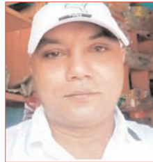
एक माह पूर्व पेड़ से लटका मिला था शव

शाह टाइम्स संवाददाता चांदपुर। ग्राम फजलपुर