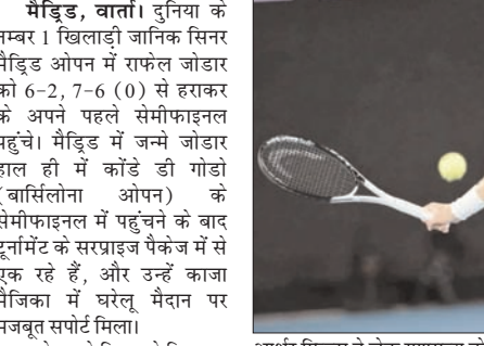
आर्थर फिल्स ने चेक गणराज्य के जिरी लेहेका को 6-3, 6-4 से हराकर सिनर के खिलाफ सेमीफाइनल में जगह बनाई। महिलाओं में, अनस्तासिया पोटापोवा ने पूर्व दुनिया के नम्बर 1 खिलाड़ी कैरोलिना प्लिसकोवा को 6-1, 6-7 (4), 6-3 से हराया, जबकि 26वीं सीड मार्टा

मैड्रिड, वार्ता। दुनिया के नम्बर 1 खिलाड़ी जानिक सिनर मैड्रिड ओपन में राफेल जोडार को 6-2, 7-6 (0) से हराकर के अपने पहले सेमीफाइनल पहुंचे। मैड्रिड में जन्मे जोडार हाल ही में कॉडे डी गोडो (बार्सिलोना ओपन) के सेमीफाइनल में पहुंचने के बाद टूर्नामेंट के सरप्राइज पैकेज में से एक रहे हैं, और उन्हें काजा मैजिका में घरेलू मैदान पर मजबूत सपोर्ट मिला। जोडार ने सिनर के खिलाफ सात ब्रेक पॉइंट बनाए, लेकिन इटैलियन खिलाड़ी ने एक घंटे, 55 मिनट की जीत में उन सभी को बचा लिया, जिससे बुधवार को उनकी जीत का सिलसिला 21 मैचों तक पहुंच गया। बाद में पुरुषों के एक और क्वार्टर फाइनल में, फंस के