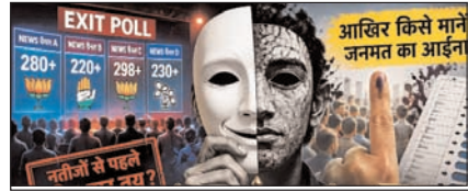
एग्जिट पोल की सच्चाई: लोकतंत्र का आईना सम्पादकीय