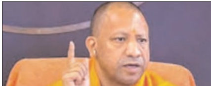
विधानसभा में मुख्यमंत्री योगी का विपक्ष पर तीखा हमला

नई दिल्ली, मुजफ्फरनगर, देहरादून, हल्द्वानी, मुगदाबाद, बरेली, मेरठ व लखनऊ से प्रकाशित