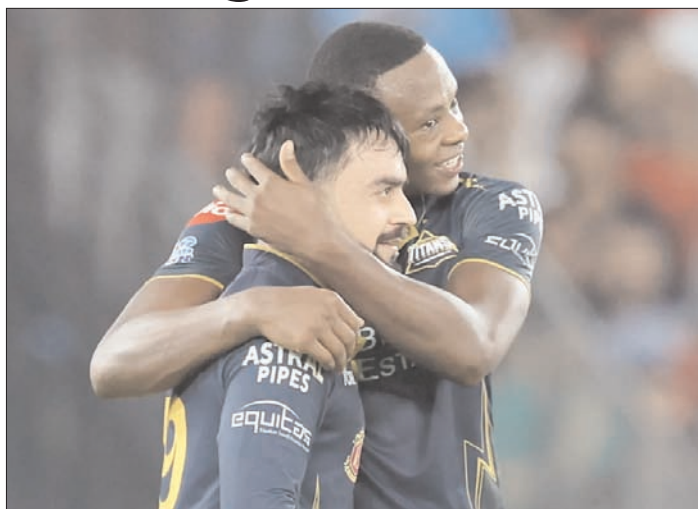
रबाड़ा की गेंद पर कोहली का कैच लेने के बाद राशिद खान को गले लगाते रबाड़ा। हली 28 और कप्तान रजत पाटीदार 19 रन बनाकर आउट हुए। अरशद खान ने 3 विकेट झटके। जेसन होल्डर और राशिद खान को 2-2 विकेट मिले। सिराज-रबाड़ा को एक-एक

जवाबी पारी में गुजरात ने एक ओवर में बिना नुकसान के 12 रन बना लिए हैं। साई सुदर्शन और कप्तान शुभमन गिल क्रीज पर हैं। गिल ने भुवनेश्वर के पहले ओवर में एक चौका और एक छक्का लगाया। टॉस हारकर बैटिंग कर रही बेंगलुरु को ओर से कोई बैट फिफ्टी नहीं लगा सका। बेंगलुरु के देवदत्त पडिक्कल ने सबसे ज्यादा 40 रन बनाए। विराट को