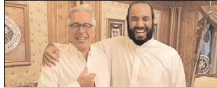
सऊदी क्राउन प्रिंस का सलाहकार बनना चाहता था एपस्टीन