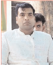
लेकिन बात बढ़ते-बढ़ते विवाद में बदल गई।

शाह टाइम्स संवाददाता हल्द्वारी। बैंकेट हॉल में आयोजित शादी समारोह उस समय विवाद का कारण बन गया, जब दूल्हा शराब के नशे में चूर होकर बारात चढ़ते के दौरान नाचने लगा। दूल्हे की इस हरकत पर वधु पक्ष के लोगों ने आपत्ति जताई, जिससे दोनों पक्षों के बीच तीखी नोकझोंक हो गई और माहौल तनावपूर्ण बन गया।