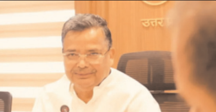
विकास के लिए 40 लाख रुपये, नूरपुर में स्थित प्राचीन झंडेवाला बाबा मंदिर के लिए 30 लाख रुपये तथा बिजनौर में स्थित विदुष कृती स्थल का समेकित विकास के लिए 04 करोड़ रुपये की धन. राशि स्वीकृत की गयी है। यह कार्य सीएनडीएस संस्था द्वारा कराया जायेगा। पर्यटन मंत्री ने बताया कि नगीना स्थित श्रीराम लीला बाग मंदिर का पर्यटन विकास के लिए 111 लाख रुपये, नहटौर में अड्डेवाला बाबा के पर्यटन विकास के लिए 87 लाख रुपये, धामपुर में केंडीवाले बाबा के पर्यटन विकास के लिए 50 लाख रुपये तथा धामपुर के अंतर्गत विकासखण्ड अल्लेहपुर

मुहम्मद जान तुर्की लखनऊ। पर्यटन विभाग द्वारा वित्तीय वर्ष 2025-26 में राज्य योजना के अंतर्गत मुरादाबाद मण्डल के जनपद बिजनौर की विधानसभाओं में पर्यटन विकास की 08 परियोजनाओं के लिए 909 लाख रुपये की धराराशि स्वीकृत की गयी है। इस धराराशि से विभिन्न विधानसभाओं में धार्मिक स्थलों का सौन्दर्यीकरण एवं उसके आसपास बुनियादी सुविधाएं सुलभ कराई जायेगी। इस कार्य के लिए यूपीएसटीडीसी को कार्यदायी संस्था नामित किया गया है। कार्यदायी संस्था को निर्देश दिये गये हैं कि सभी कार्यों को गुणवत्ता और समय के साथ पूरा करें। यह जानकारी प्रदेश के पर्यटन एवं संस्कृति मंत्री ने बताया कि बिजनौर जनपद की बदायुँ विधानसभा क्षेत्र के अंतर्गत प्राचीन संत शिरोमणि रविदास मंदिर के पर्यटन विकास के लिए 44 लाख रुपये, सरदर विधानसभा क्षेत्र के अंतर्गत प्राचीन उमा महेश आश्रम निजामतपुरा गंज का पर्यटन