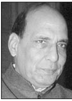
राजनाथ सिंह, रक्षा मंत्री

ऑपरेशन सिंदूर ने दुनिया को स्पष्ट संदेश दिया है कि भारत अपने भूभाग पर आतंकवादी हमलों के बाद अब केवल कूटनीतिक बयान जारी करने की पुरानी मानसिकता तक सीमित नहीं है, बल्कि आगे बढ़कर निर्णायक कार्रवाई के लिए प्रतिबद्ध है, सरकार ने स्पष्ट रुख अपनाया है कि किसी भी परिस्थिति में आतंकवाद का कोई भी कृत्य सहन नहीं किया जाएगा, आतंकवाद एक विकृत और विक्षिप्त मानसिकता से उत्पन्न होता है, यह मानवता पर एक काला धब्बा है, आतंकवाद के खिलाफ लड़ाई केवल राष्ट्रीय सुरक्षा का मामला नहीं है, यह मूल रूप से मानवता के मूल्यों की रक्षा की लड़ाई है, यह एक बर्बर विचारधारा के खिलाफ संघर्ष है जो हर मानवीय मूल्य के सीधे विरोध में खड़ी है, हमने इस भारतीय दृष्टिकोण को देश के भीतर और विदेशों में स्पष्ट रूप से प्रस्तुत किया है।