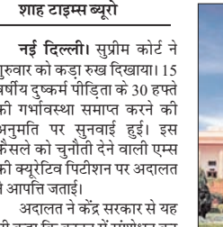
शह टाइम्स ब्यूरो

कि 30 हफ्ते में ध्रुण एक जीवित शिशु के रूप में विकसित हो चुका है, जिसमें गंभीर विकृतियां हो सकती हैं। साथ ही नाबालिग मां को जीवनभर स्वास्थ्य संबंधी समस्याएं हो सकती हैं और भविष्य में वह मां नहीं बन पाएगी। उन्होंने सुझाव दिया कि बच्चे को जन्म के बाद गोद दिया जा सकता है। इस पर सुप्रीम कोर्ट ने दोहराया कि गर्भपात का निर्णय पीड़िता और उसके माता-पिता को इच्छा पर निर्भर करेगा और एम्स की