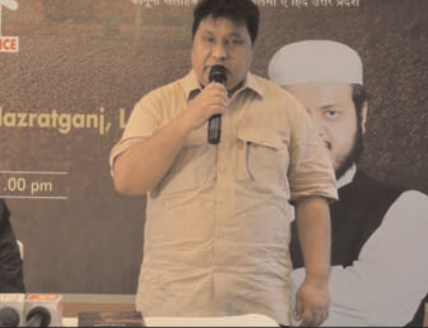
मद्रसों के बच्चों को कानूनी तथा संवैधानिक अधिकारों और कर्तव्यों के बारे में भी जानकारी मिलेगी। एसे मार्ग प्रशस्त किया जा सके जो न सिर्फ संवैधानिक हों, बल्कि गरिमा और संतुलन का आदाना भी हो।