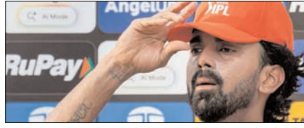
केएल राहुल ऑरेंज कैप तालिका में तीसरे स्थान पर रहे बरकरार