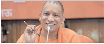
उत्तर प्रदेश में मंत्रिमंडल का विस्तार आज!

नई दिल्ली, मुजफ्फरनगर, देहरादून, हल्द्वानी, मुगदाबाद, बरेली, मेरठ व लखनऊ से प्रकाशित