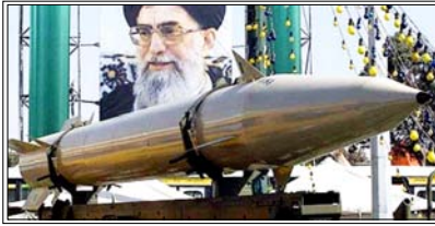
सीआईए सहित सभी अमेरिकी खुफिया एजेंसियां इस बात पर सहमत थीं कि ईरान परमाणु हथियार विकसित नहीं कर रहा था: केंट

वाशिंगटन। अमेरिका के पूर्व राष्ट्रीय आतंकवाद निरोधक केंद्र (एनसीसी) प्रमुख जो केंट ने दावा किया है कि हालिया युद्ध से पहले अमेरिकी खुफिया एजेंसियों का आकलन था कि ईरान परमाणु हथियार विकसित नहीं कर रहा था। केंट ने सोशल मीडिया मंच 'एक्स' पर एक पोस्ट में कहा कि सीआईए सहित सभी अमेरिकी खुफिया एजेंसियां इस बात पर सहमत थीं कि ईरान परमाणु हथियार विकसित नहीं कर रहा था। उन्होंने कहा कि किसी भी हमले की स्थिति में यह आशंका थी कि ईरान क्षेत्र में अमेरिकी टिकानों को निशाना बनाएगा और होर्मुज जलडमरूमध्य को बाधित करेगा। उन्होंने लिखा कि इस युद्ध की कई त्रासदियों में से एक यह है कि युद्ध शुरू होने से पहले अमेरिकी खुफिया एजेंसियां इस बात पर सहमत थीं कि ईरान परमाणु हथियार नहीं बना रहा, जिसमें सीआईए भी शामिल है। केंट ने आरोप लगाया कि इजरायल ने अमेरिकी नीति निर्धारण को प्रभावित किया और इजरायल ने बहस