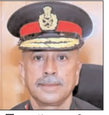
वाइस एडमिरल स्वामीनाथन एडमिरल दिनेश के त्रिपाठी की जगह नए नौसेना प्रमुख नियुक्त किए गए

मौजूदा सीडीएस अनिल चौहान का कार्यकाल 30 मई को खत्म हो रहा है। एनएस राजा सुब्रमणि देश के तीसरे सीडीएस होंगे। एनएस राजा सुब्रमणि करीब 39 साल की सर्विस के बाद 31 जुलाई 2025 को वाइस चीफ ऑफ आर्मी स्टाफ के पद से रिटायर हुए थे। एनएस राजा सुब्रमणि ने दिसम्बर 1985 में गढ़वाल राइफल्स से सेना में