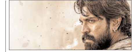
भोपाल में 16 मई को होगा 'पेड्डी' का ग्रैंड ट्रेलर लॉन्च