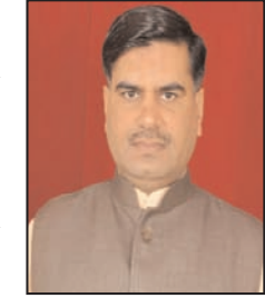
खुलेआम खिलवाड़ होना प्रतीत होता है। स्वास्थ्य विभाग रामपुर से आग्रह है कि वह तहसील क्षेत्र मिलक में एक सघन अभियान चलाकर जो भी अवैध रूप से हॉस्पिटल, लैब या मेडिकल स्टोर पर स्वयं को डॉक्टर बताकर आम जनता के जीवन से खुलेआम खिलवाड़ कर रहे हैं उनके खिलाफ कठोरतम कार्यवाही अमल में लाई जाए। जिससे कि भविष्य में होने वाली किसी भी अनहोनी से बचा जा सके।