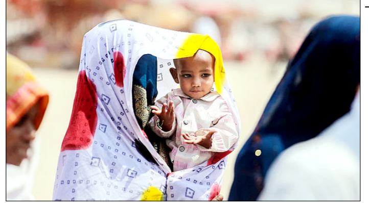
प्राणराज। भीषण गर्मी में कपड़ा ढककर अपने बच्चे को घुप से बचाती महिला।

तात्कालिक खतरा नहीं था और कुछ राजनीतिक शक्तियों ने बाहरी प्रभाव में आकर अमेरिका को युद्ध में धकेला। उन्होंने अमेरिकी विदेश नीति की भी आलोचना करते हुए कहा कि राजनीतिक नैरेटिव के कारण खुफिया सूचनाओं को कमजोर किया गया और युद्ध को इजरायल तथा उसके समर्थकों के दबाव में आगे बढ़ाया गया। उन्होंने आशंका जताई कि यह संघर्ष अमेरिका को एक और लंबे परिचय एशिया युद्ध में धकेल सकता है और युद्ध तक पहुंचने वाली निर्णय प्रक्रिया को पुनर्समीक्षा की जरूरत है। उन्होंने लिखा कि जून 2025 तक आप समझते थे कि मध्य-पूर्व के युद्ध एक जाल है, जिन्होंने अमेरिका के सैनिकों की जान ली और देश की समृद्धि को नुकसान पहुंचाया। उन्होंने ट्रम्प के पहले कार्यकाल में कासिम सुलेमानी की हत्या और थाई बमबारी के खिलाफ कार्रवाई का उल्लेख करते हुए कहा कि उस समय सैन्य शक्ति का उपयोग बिना लंबे युद्ध में फंसे किया गया था।