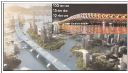
सिंचाई विभाग ने बैराज के पुराने और क्षतिग्रस्त वर्टिकल गेटों को बदलने का कार्य शुरू कर दिया। बेहतर बनाया जाएगा जल सुरक्षा, बाढ़ नियंत्रण और पर्यावरणीय संतुलन को भी नई तकनीक से।