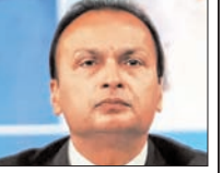
27337 करोड़ के घोटाले में सीबीआई ने की कार्रवाई

देश के बैंकिंग सेक्टर और भारतीय जीवन बीमा निगम (एलआईसी) को 27 हजार करोड़ रुपये से अधिक का चूना लगाने वाले कथित घोटाले में सीबीआई ने एक बड़ी कार्रवाई की है। शनिवार को अनिल अंबानी के नेतृत्व वाले रिलायंस एडीए ग्रुप की कंपनियों और उनके निदेशकों के खिलाफ मुंबई में 17 ठिकानों पर ताबड़तोड़ छापेमारी की गई। यह कार्रवाई कॉर्पोरेट गवर्नेंस और बैंक फंड को हेराफेरी के बड़े मामलों पर जांच एजेंसियों के कई रुख को दर्शाती है। सीबीआई के प्रवक्ता के अनुसार, यह सच आपरेशन रिलायंस टेलीकॉम लिमिटेड, रिलायंस कमर्शियल फाइनेंस लिमिटेड और रिलायंस होम फाइनेंस लिमिटेड और उनके निदेशकों के खिलाफ दर्ज तीन अलग-अलग मामलों के तहत किया गया है। इसके साथ ही उन विचोल्या कंपनियों के दफ्तरों को भी खंगाला गया, जिनके खातों का इस्तेमाल कथित तौर पर बैंक फंड को डायवर्ट (हेराफेरी) करने के लिए किया गया था। शुक्रवार को