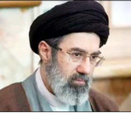
अमेरिका से समझौते के राजनयिक प्रयासों का मार्गदर्शन करने में गहराई से लगे हुए

वाशिंगटन। ईरान के सर्वोच्च नेता मुजतबा खामेनेई संघर्ष के दौरान देश की युद्ध रणनीति को आकार देने और युद्ध समाप्त करने के लिए अमेरिका के साथ राजनयिक बातचीत में शामिल अधिकारियों को निर्देशित करने वाले प्रमुख चेहरे के रूप में उभरे हैं। ईरान पर अमेरिका-इजरायल के हमले के पहले ही दिन उनके पिता और ईरान के तत्कालीन सर्वोच्च नेता अयातुल्ला अली खामेनेई और कई वरिष्ठ ईरानी सैन्य कमांडर मारे गए थे। अमेरिकी खुफिया अधिकारियों के आकलन के अनुसार, उसी हमले में गंभीर रूप से घायल होने के बावजूद मुजतबा का कथित तौर पर ईरान की युद्धकालीन रणनीति बनाने, सैन्य अभियानों का निर्देशन करने और अमेरिका से समझौते के राजनयिक प्रयासों का मार्गदर्शन करने में गहराई से लगे हुए हैं। सीएनएन की रिपोर्ट के अनुसार, मुजतबा के चेहरे, हाथ, घड़ और पैर काफी ज्यादा झुलस गए थे। अमेरिकी खुफिया एजेंसी का मानना है कि वह सार्वजनिक नजरों से दूर रहकर स्वस्थ होने के साथ-साथ अत्यंत महत्वपूर्ण भूमिका के साथ-साथ अत्यंत महत्वपूर्ण भूमिका निभा रहे हैं। वह किसी भी प्रकार के इलेक्ट्रॉनिक संचार से जानबूझकर बच रहे हैं और केवल व्यक्तिगत मुलाकातों या संदेशवाहकों के जरिए हस्तालिखित दोनों से ही