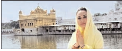
आईपीएल के अहम मुकाबले से पहले प्रीति जिंटा ने गोलडन टेम्पल में माथा टेका