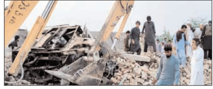
आत्मघाती हमले से दहला पाक, विस्फोटक से भरी गाड़ी चेकपोस्ट से टकराई