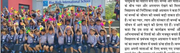
मदर्स डे पर बच्चों ने माताओं को दिये उपहार। बच्चों को माताओं को दिये उपहार में शामिल करने का उद्देश्य है कि बच्चे अपनी माताओं को बेहतर ढंग से जान सकें। विद्यालय परिसर में बनाए गए सल्लोकी वृक्ष पर

ब्लू बर्ड्स इंटरनेशनल स्कूल में दिखा भातुक माहौल