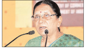
जनभवन के अधिकारियों व कर्मचारियों के चिंतन शिविर में बोली राज्यपाल आनंदीबेन पटेल

शाह टाइम्स ब्यूरो लखनऊ। उत्तर प्रदेश की राज्यपाल आनंदीबेन पटेल की अध्यक्षता में जनपद रायबरेली स्थित आधुनिक रेल डिब्बा कारखाना में जन भवन के अधिकारियों एवं कर्मचारियों के लिए चिंतन शिविर का आयोजन किया गया। शिविर में अधिकारियों एवं कर्मचारियों ने अपनी कार्य दक्षता, कार्य प्रणाली, कार्यों में आने वाली समस्याओं, आपसी समन्वय तथा टीमवर्क से संबंधित विषयों पर खुलकर विचार-विमर्श किया। राज्यपाल ने विभिन्न सत्रों में आयोजित इस चिंतन शिविर को संबोधित करते हुए ने कहा कि हम अपने अनुभवों का उपयोग समाज कल्याण के लिए करना चाहिए। उन्होंने गुजरात में आयोजित चिंतन शिविरों के अनुभव साझा करते हुए कहा कि ऐसे आयोजन व्यवहारिक परिवर्तन लाने में महत्वपूर्ण भूमिका निभाते हैं, जिसका सकारात्मक प्रभाव कार्य संस्कृति एवं कार्य निष्पादन पर स्पष्ट रूप से दिखाई देता है। उन्होंने अन्न की बर्बादी रोकने पर विशेष बल