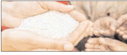
अनाज के ढेर पर बैठी भूखी दुनिया सम्पादकीय