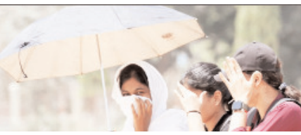
दक्षिण भारत में अगले सात दिन तक भारी बारिश होने की संभावना, किसानों को जारी किया परामर्श

नई दिल्ली, वार्ता मौसम विभाग ने उत्तर-पश्चिमी भारत के कई राज्यों में अगले पांच दिनों के दौरान गरज-चमक के साथ 40 से 60 किलोमीटर प्रति घंटे की रफ्तार से तेज हवाओं के चलने की संभावना जताई है। जम्मू-कश्मीर तथा लद्दाख में 11 और 12 मई को मौसम अधिक खराब रह सकता है, जबकि हिमाचल प्रदेश एवं उत्तराखंड में 12 और 13 मई को ओलावृष्टि होने की भी आशंका जताई गई है। मौसम विभाग की ओर से जारी बुलेटिन के अनुसार, दक्षिण पश्चिमी बंगाल की खाड़ी में अगले 48 घंटों के भीतर एक निम्न दबाव का क्षेत्र बनने के आसार हैं। इसके प्रभाव से दक्षिण भारत के राज्यों, विशेषकर केरल, तमिलनाडु, पुदुचेरी और केरळ में अगले सात दिनों तक भारी वर्षा होने की संभावना है। लक्षद्वीप में भी रविवार को भारी बारिश का अनुमान है। हालांकि, दिल्ली-एनसीआर में 11 से 13 मई के बीच शाम या रात के समय हल्की बारिश और धूल भरी आंधी चलने से तापमान में मामूली गिरावट आ सकती है। मौसम विभाग ने ओलावृष्टि और तेज हवाओं को देखते हुए कृषि क्षेत्र के लिए पहाड़ी राज्यों के फल उत्पादकों को सुझाव दिया गया है कि वे अपने बागानों को ओलों से बचाने के लिए 'हेलेंट' का प्रयोग करें। तेज हवाओं के दौरान पशुओं को सुरक्षित स्थानों पर रखने और कटी हुई फसलों को ढककर रखने की सलाह दी है। मछुआरों को 15 मई तक बंगाल की खाड़ी और अरब सागर के हिस्सों में न जाने की हिदायत दी गई है।