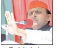
योगी मंत्रिपरिषद विस्तार पर सपा का तंज

शाह टाइम्स ब्यूरो लखनऊ। उत्तर प्रदेश में हुए मंत्रिपरिषद विस्तार को लेकर समाजवादी पार्टी के राष्ट्रीय अध्यक्ष अखिलेश यादव ने भारतीय जनता पार्टी सरकार और मुख्यमंत्री योगी आदित्यनाथ पर तीखा हमला बोला है। श्री अखिलेश यादव ने सोशल मीडिया पर पोस्ट करते हुए कहा कि मंत्रिपरिषद विस्तार में मुख्यमंत्री को कोई भूमिका नहीं रह गई है और फैसेल 'ऊपर से आने वाली परिचियों' के आधार पर हो रहे हैं। सपा प्रमुख ने व्यंग्य करते हुए लिखा, 'समय बिताने के लिए करना है कुछ काम। वैसे भी मंत्रिमंडल के विस्तार में तो इनका कोई काम है नहीं। उधर से पच्ची आएगी, यहाँ तो सिर्फ पढ़ी जाएगी। भाजपा राज में वैसे भी सकारात्मक बदलाव देखने को मिले। दरअसल योगी आदित्यनाथ रविवार को पूरी मंत्रिमंडल के साथ शाम को लोकभवन में कृष्णावतरम फिल्म देखेंगे। यादव ने नैतिकता और आत्ममंथन का संदेश भी दिया। उन्होंने लिखा कि मूल रूप से व्यक्ति नहीं, बल्कि उसका लालच और लोभ बुरा होता है, जो धीरे-धीरे दुराचरण का रूप ले लेता है। इस के विपरीत जब व्यक्ति स्वार्थ छोड़कर परमार्थ के मार्ग पर चलता है, तो सकारात्मक परिवर्तन संभव होता है। महाकाव्यों का संदेश भी यही है कि अच्छाई अंततः बुराई पर विजय प्राप्त करती है। अपनी गलतियों और दुर्भावनाओं के लिए प्रायश्चित्त का कोई निश्चित स्थान नहीं होता, बल्कि इसके लिए भीर के प्रकाश की आवश्यकता होती है।