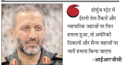
होर्मुज स्ट्रेट में ईरानी तेल टैंकरों और व्यापारिक जहाजों पर फिर हमला हुआ, तो अमेरिकी ठिकानों और सैन्य जहाजों पर भारी हमला किया जाएगा -आईआरजीसी

संयुक्त राष्ट्र में अमेरिका को प्रस्ताव को बहरीन एवं अन्य देशों का समर्थन मिलने की रिपोर्टों के बीच दी चेतावनी