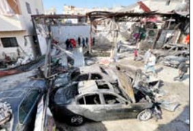
पिछले सप्ताह इजरायली हमलों में पूरे देश में 120 से अधिक लोग मारे गए जिनमें महिलाएं और बच्चे भी शामिल

बेरूत। लेबनान के स्वास्थ्य मंत्रालय ने कहा कि इजरायल द्वारा लेबनान में किए गए भीषण हमलों में 39 लोग मारे गए। यह जानकारी बीबीसी ने रविवार को दी।