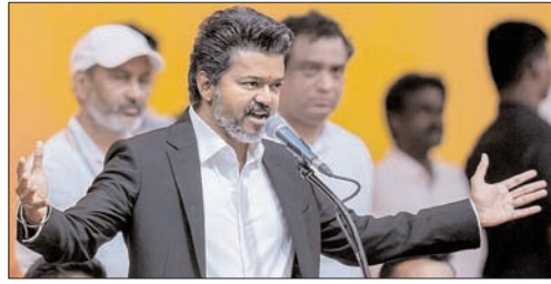
नौ अन्य मंत्री भी मंत्रिमंडल में शामिल, सभी ने तमिल भाषा में ईश्वर के नाम पर शपथ ग्रहण की

तमिलनाडु की राजनीति में एक नया अध्याय लिखते हुए, नवगठित पार्टी 'तमिलनाडु वेत्री कथगम' (टीवीके) के संस्थापक और अभिनेता-राजनेता सी. जोसेफ विजय ने रविवार को राज्य के 13वें मुख्यमंत्री के रूप में शपथ ली। उन्होंने इस राज्य में कई दशकों से शासन की बागडोर संभालने वाले दलों द्रविड़ मुनेत्र कथगम (द्रमुक) और अन्नाद्रमुक को हरा कर यह मुकाम हासिल किया। उन्होंने चुनाव में शानदार प्रदर्शन करते हुए इन दोनों पार्टियों के लगभग 60 साल पुराने एकाधिकार को समाप्त कर दिया। रविवार सुबह करीब दस बजे, जवाहरलाल नेहरू इंडोर स्टेडियम में आयोजित एक सादे समारोह