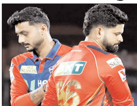
मैचों में बहुत ही कांटे का मुकाबला रहा है, जिसमें पीबीकेएस ने 18 जबकि डीसी ने 17 मैच जीते हैं। धर्मशाला में हुए दोनों टीमों के बीच चार मैचों में भी मुकाबला बराबरी का रहा है और दोनों टीमों ने दो-दो मैच जीते हैं। 2023 से धर्मशाला में हुए पांच

धर्मशाला, वार्ता। आईपीएल 2026 में सोमवार को दिल्ली कैपिटल्स (डीसी) का सामना पंजाब क्रिकेट (पीबीकेएस) से धर्मशाला में होगा। यह इस सीजन धर्मशाला का पहला मैच है, जो कि पीबीकेएस का दूसरा घरेलू मैदान है। दोनों टीमों हार से इस मैच में उतर रही हैं।