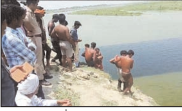
बाद वह बाहर ही न कला। आस पास के सभी लोगों में चौंका मच गई, सभी ने खोजा कि युवक का

शाह टाइम्स संवाददाता बदायूं म्याऊं। अंत्योष्टि कराने के लिए राम गंगा घाट पर आए एक युवक की नहाते समय डूबने से मौत हो गई। यह घटना उस समय हुई जब अंत्योष्टि क्रिया कर सभी लोग नहाने के लिए हजरत पुर राम गंगा घाट पर आए। कल उसावां थाना क्षेत्र के गांव नगरिया अभय में एक व्यक्ति ने आत्महत्या कर ली थी, उसी की अंत्योष्टि क्रिया करने युवक साथ आया था।