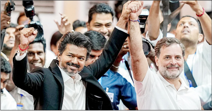
चेन्नई। जवाहरलाल नेहरू स्टेडियम में अपने शपथ ग्रहण समारोह के दौरान लोकसभा में विपक्ष के नेता राहुल गांधी के साथ हाथ मिलाते तमिलनाडु के नवनिर्वाचित मुख्यमंत्री (टीवीके) प्रमूख विजय।