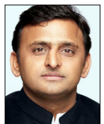
-अखिलेश यादव, अध्यक्ष, समाजवादी पार्टी

उप्र में मंत्रिपरिषद विस्तार में मुख्यमंत्री की कोई भूमिका नहीं रह गई है और फंसले ऊपर से आने वाली परिषदों के आधार पर हो रहे हैं, समय बिताने के लिए करना है कुछ काम, वैसे भी मंत्रिमंडल के विस्तार में तो इनका कोई काम है नहीं, उधर से पच्ची आरंगी, यहां तो सिर्फ पढ़ी जाएगी, भाजपा राज में वैसे भी सीएम का मतलब बस यही रह गया है, कूरियर मैसेंजर, जनता पूछ रही है कि फिल्म सबसे आगे बैठकर देखेंगे या पीछे बैठकर साथ ही उन्हीं यह भी कहा कि फिल्म ध्यान से देखिएगा, हो सकता है कर्मफल-कंसफल का सिद्धांत समझ में आए और कुछ सकारात्मक बदलाव देखने को मिले, मूल रूप से व्यक्ति नहीं, बल्कि उसका लालच और लोभ बुरा होता है, जो दुराचरण का रूप ले लेता है।