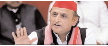
अखिलेश यादव ने योगी मंत्रिपरिषद विस्तार पर कसा तंज

नई दिल्ली, मुजफ्फरनगर, देहरादून, हल्द्वानी, मुद्राबाद, बरेली, मेरठ व लखनऊ से प्रकाशित