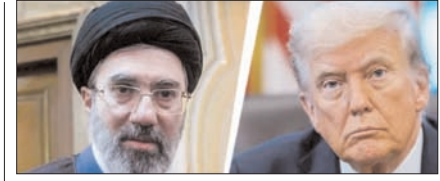
ईरान ने अमेरिकी योजना को किया खारिज पेज 12