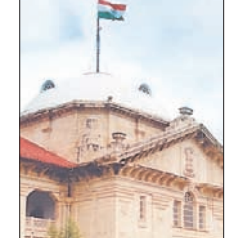
नाराजगी जताई कि जिला जज की अध्यक्षता में होने वाली मासिक मानिटरिंग सेल की बैठकों में जिला पुलिस प्रमुख और पुलिस कमिश्नर खुद शामिल नहीं होते, बल्कि अपने प्रतिनिधियों को भेज देते हैं।