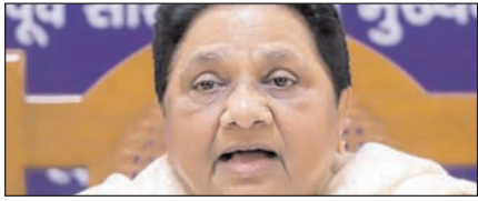
मंत्रिमंडल विस्तार का सकारात्मक असर आमजन के जीवन पर पड़े, तो बेहतर: माया पेज 2

नई दिल्ली, मुजफ्फरनगर, देहरादून, हल्द्वानी, मुगदाबाद, बरेली, मेरठ व लखनऊ से प्रकाशित