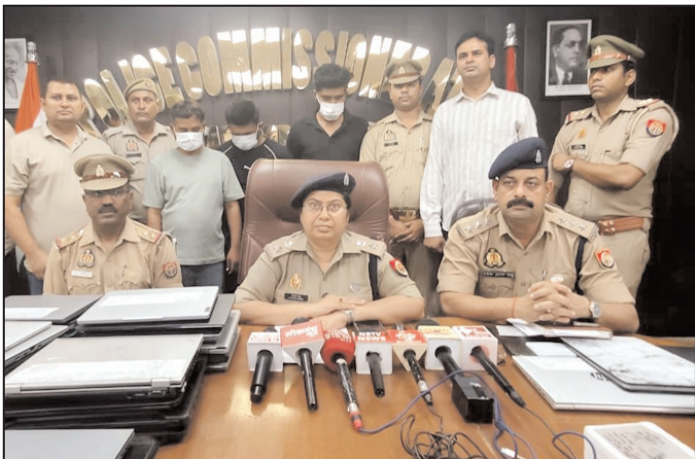
गोपनीय सूचना के आधार पर तीनों को सोरखा से गिरफ्तार किया है।