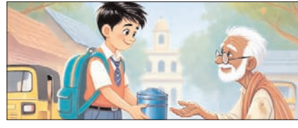
दयालुता मानवता का सबसे बड़ा सौंदर्य, इसे बनाए रखें सम्पादकीय