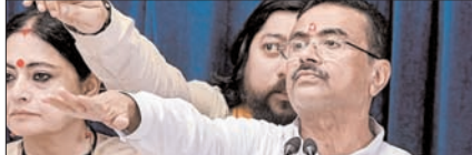
सुबेंदु सरकार का फैसला, नए आपराधिक कानून लागू होंगे, आयुष्मान पर भी काम शुरू

कोलकाता, वार्ता पश्चिम बंगाल के मुख्यमंत्री सुबेंदु अधिकारी ने भारत-बांग्लादेश बॉर्डर पर फेंसिंग के लिए बीएसएफ को जमीन देने की प्रक्रिया शुरू कर दी है। मुख्यमंत्री ने कहा कि अबैध चुसपैठ से निपटने के लिए 45 दिन के भीतर यह जमीन गृह मंत्रालय को सौंप दी जाएगी।