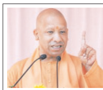
■ भारत की चेतना में बसता है सनातन और चेतना अजर-अमर है सोमनाथ देश की जड़ों को जोड़ने का प्रयास

वाराणसी, वार्ता सोमनाथ योगी ने कहा कि द्वादश ज्योतिर्लिंगों में से एक सोमनाथ महादेव के स्वाभिमान पर्व के कार्यक्रम में प्रधानमंत्री नरेंद्र मोदी की प्रेरणा से 'एक भारत, श्रेष्ठ भारत' की संकल्पना को साकार होते देख रहा है। उन्होंने कहा कि इसका साकार रूप भगवान सोमनाथ महादेव के भव्य मंदिर की पुनर्प्रतिष्ठा, सुंदरीकरण और वहां आयोजित कार्यक्रमों के साथ ही काशी में श्री काशी विश्वनाथ धाम, महाकाल में महालोक की स्थापना, श्री अयोध्या धाम में श्री राम जन्मभूमि पर भव्य राम मंदिर के निर्माण समेत अनेक सनातन परंपरा से जुड़े पवित्र तीर्थ स्थलों को अपने वैभव के साथ विकास