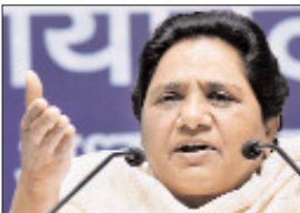
■ मामला ताकत की बजाय कानूनी तरीके से सुलझाए

शाह टाइम्स ब्यूरो लखनऊ। बहुजन समाज पार्टी अध्यक्ष मायावती ने सहारनपुर जिले के लालवाला गांव में हुई हिंसा पर चिंता जताते हुए निष्पक्ष कार्रवाई की मांग की है। सुश्री मायावती ने सोमवार को एकस्य पर लिखा, सहारनपुर के एक गांव में एक भूमि पर मृत्ति रखने को लेकर दो पक्षों के बीच विवाद हुआ, जो बाद में संघर्ष में बदल गया। उन्होंने आरोप लगाया कि इस घटना में दलित समाज के कई लोग घायल हुए हैं। बसपा अध्यक्ष ने पुलिस और प्रशासन से मामले में तत्काल तथा निष्पक्ष कार्रवाई करने की मांग करते हुए कहा कर्प प्रशासन को हालात पर पूरी तरह नियंत्रण रखते हुए शांति व्यवस्था बनाए रखने के लिए प्रभावी कदम उठाने चाहिए। बसपा सुप्रीमो ने दोनों पक्षों से भी संयम बरतने और आपसी सौहार्द बनाए रखने की अपील की। उन्होंने कहा कि मामले को ताकत के बजाय कानूनी तरीके से सुलझाया जाना चाहिए, ताकि क्षेत्र में तनाव न बढ़े और शांति कायम रह सके। गौरतलब है कि सहारनपुर के देवबंद क्षेत्र के लालवाला गांव में 9-10 मई को लगभग दो बीघा जमीन पर कब्जे और कथित तौर पर महाराणा प्रताप की मूर्ति लगाने को लेकर दो समुदायों के बीच हिंसक झड़प हुई। पत्थरबाजी और लाठीचार्ज में तीन महिलाओं समेत आठ लोग घायल हो गए। पुलिस ने घटना के बाद गांव में सुरक्षा बलों को तैनात कर निगरानी बढ़ा दी है। प्रशासनिक अधिकारी स्थिति पर नजर बनाए हुए हैं।