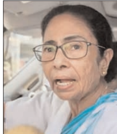
टीएमसी का हवाला दिया, जिसमें कहा गया था कि अगर जीत का अंतर हटाए गए वोटों से कम है, तो अदालत शिकायतों पर विचार कर सकती है। चुनाव आयोग अधिवक्ता डीएस नायडू ने कहा कि इसका उपाय चुनाव याचिका

दीदी की दलील ■ यहां जीत का अंतर एसआईआर में कटे वोटों से कम ■ सुप्रीम कोर्ट ने कहा नई याचिकाएं लगाएं