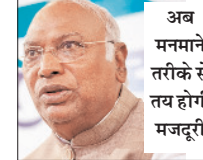
अब मनमाने तरीके से तय होगी मजदूरी

नई दिल्ली, वार्ता कांग्रेस पार्टी के राष्ट्रीय अध्यक्ष मल्लिकार्जुन खड्गे ने मोदी सरकार पर पांच राज्यों के विस चुनाव खत्म होने के तुरंत बाद चार श्रम संहिताओं (लेबर कोड) को लागू करने का आरोप लगाते हुए कहा कि सरकार ने कायदापूर्ण तरीके से 8 और 9 मई 2026 को गजट अधिसूचनाओं के जरिए इन श्रमिक विरोधी कानूनों को लागू किया। खड्गे ने सोमवार को बयान जारी कर कहा कि ये कानून करोड़ों मजदूरों के लिए हाथ पर एंड फायर, रोजगार और यूनियन अधिकारों में कटीती का रास्ता खोलते हैं। उन्होंने आरोप लगाया कि मोदी सरकार ने बिना किसी व्यापक चर्चा और श्रमिक संगठनों से सलाह-मशविरा किए इन कानूनों को लागू किया। उन्होंने