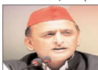
■ भाजपाई अपनी कमाई के स्वर्णकरण में लगे

बीजेपी पर सपा मुखिया अखिलेश यादव ने बोला तीखा हमला शाह टाइम्स ब्यूरो लखनऊ। उत्तर प्रदेश के पूर्व मुख्यमंत्री और समाजवादी पार्टी के राष्ट्रीय अध्यक्ष अखिलेश यादव ने भारतीय जनता पार्टी पर तीखा हमला बोलते हुए सोमवार को कहा कि चुनाव खत्म होते ही सरकार को 'संकट' याद आ गया। उन्होंने कहा कि देश के लिए सबसे बड़ा संकट भाजपा ही है और केंद्र सरकार की हालिया अपीलें उसकी आर्थिक व नीतिगत विफलताओं को उजागर करती हैं। सपा प्रमुख ने कहा कि यदि इतनी पाबंदियां लगानी पड़ रही हैं, तो पांच ट्रिलियन डॉलर की जुमलाई अर्थव्यवस्था कैसे बनेगी। आरोप लगाया कि भाजपा सरकार के हाथ से आर्थिक व्यवस्था की लगाम छूट चुकी है। डॉलर लगातार मजबूत हो रहा है और रुपया कमजोर होता जा रहा है। यादव ने सोने की खरीद को लेकर सरकार को अपील पर भी कटाक्ष किया। जनता तो वैसे भी डेढ़ लाख तोले का सोना खरीदने की स्थिति में नहीं है, बल्कि भाजपा के लोग ही अपनी काली कमाई का स्वर्णकरण करने में लगे हैं। इसकी जानकारी लखनऊ से लेकर गोरखपुर और अहमदाबाद से लेकर गुवाहाटी तक ली जा सकती है।