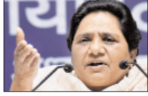
मध्य पूर्व एशिया में व्याप्त तनाव बोली बसपा प्रमुख

शाह टाइम्स ब्यूरो लखनऊ। बहुजन समाज पार्टी की मुखिया मायावती ने मध्य पूर्व एशिया में व्याप्त तनाव पर चिंता व्यक्त करते हुए केंद्र और राज्यों से जन हित में उचित कदम उठाने की अपील की है। सुश्री मायावती ने प्रधानमंत्री नरेंद्र मोदी द्वारा देशवासियों से 'संयम' बरतने की अपील का हवाला देते हुए कहा कि इससे साफ है कि भारत के सामने संकट केवल पेट्रोल, डीजल और रसोई गैस जैसे पेट्रोलियम पदार्थों तक सीमित नहीं रहेगा, बल्कि यह एक बड़े आर्थिक संकट का रूप ले सकता है। उन्होंने आशंका जताई कि इस संकट से करोड़ों भारतीयों का जीवन प्रभावित होगा और स्थिति के और बिगड़ने की भी संभावना है। बसपा प्रमुख ने अपने बयान में कहा कि कोरोना काल की मार के बाद देश की लगभग