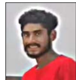
■ दुसाफ की मांग लेकर बिते दिन एम्पी टास्कर पहुंची थी बहन

शाह टाइम्स संवाददाता नौगांवा सादत। दुकानों के सनरीनरज मुकदमे के बीच पीड़िता के भाई द्वारा उदारगु ग्वा खींचफाटक कमरे में पूरे लाइनों को तिला तिला सोनार सुबह पीड़िता के भाई का शव घर के कमरे में फंदे से लटका मिलने पर परिवार में चीख-पुकार मच गई। पुलिस के साथ कथित दरिंदगी और ब्लैकमेलिंग के आरोपों से पहले ही नवान में चल रहे परिवार पर इस घटना ने दुःख का पहाड़ तोड़ दिया। सूचना मिलते ही पुलिस और फोरेंसिक टीम मौके पर पहुंच गई, जबकि गांव में घटना को लेकर खतर-खतर की चर्चाएं हो रही हैं।