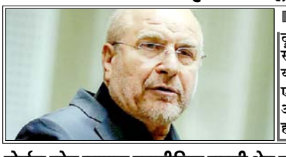
कोई भी अन्य दृष्टिकोण पूरी तरह से बेनतीजा रहेगा, यह एक के बाद एक असफलता के अलावा कुछ नहीं होगा।

तेहरान/दोहा। ईरानी संसद के अध्यक्ष मोहम्मद बाघर गालिबफ ने कहा कि पश्चिमी एशिया संघर्ष को सुलझाने के लिए ईरान के 14-सूत्रीय योजना का कोई विकल्प नहीं है। गालिबफ ने सोशल मीडिया एक्स पर कहा कि ईरानी लोगों के अधिकारों को स्वीकार करने के अलावा कोई विकल्प नहीं है, जैसा कि 14-सूत्रीय प्रस्ताव में बताया गया है।