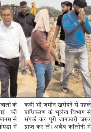
विना अवैध निर्माण करने वालों के खिलाफ कड़ी कार्रवाई की जाएगी। एसीओ ने जनमानस से अपील की है कि ग्रेटर नोएडा में