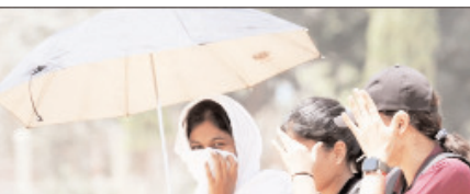
पश्चिम यूपी में 50 से 60 किलोमीटर प्रति घंटा की रफ्तार से चलेंगी तेज हवाएं

शाह टाइम्स ब्यूरो लखनऊ। उत्तर प्रदेश में एक बार फिर मौसम का मिजाज बदलने से पश्चिमी इलाकों में गर्मी से फौरी राहत मिली है जबकि पूर्वी क्षेत्र में अगले 24 घंटों के दौरान कई जिलों में गरज-चमक, तेज आंधी, वज्रपात और ओलावृष्टि के आसार हैं। अमरौहा, मुरादाबाद, संभल और अलीगढ़ समेत पश्चिमी उत्तर प्रदेश विशेष रूप से तराई और पश्चिमी जिलों में तेज हवाओं के साथ बारिश हुई जिससे लोगों को गर्मी से फौरी राहत मिली। मौसम विज्ञान विभाग के लखनऊ केंद्र द्वारा जारी प्रभाव आधारित पूर्वानुमान एवं चेतावनी के अनुसार 12 मई को पश्चिमी और पूर्वी उत्तर प्रदेश के कई हिस्सों में गरज-चमक के साथ बौछारें पड़ सकती हैं। पश्चिमी उत्तर प्रदेश में 50 से 60 किलोमीटर प्रति घंटा की रफ्तार से चलने वाली तेज हवाएं झांको में 70 किलोमीटर प्रति घंटा तक पहुंच सकती हैं। वहीं पूर्वी उत्तर प्रदेश में 40 से 50 किलोमीटर प्रति घंटा की रफ्तार से तेज हवाएं चलने का अनुमान है। मौसम विभाग के अनुसार श्रावस्ती, बहराइच, लखीमपूर खीरी में 13 मई को पश्चिमी उत्तर प्रदेश में मौसम शुष्क रहने की संभावना है, जबकि पूर्वी उत्तर प्रदेश के देवरिया, गोरखपुर, संतकबीरनगर, बस्ती, कुशीनगर, महाराजगंज,