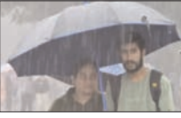
यूपी-बिहार समेत पांच राज्यों में आंधी-बारिश का अलर्ट को तेजी से आगे बढ़ा रहा है। यूपी-बिहार समेत 5 राज्यों में

नई दिल्ली। देश में मानसून तय समय से 4 दिन पहले दस्तक दे सकता है। आमतौर पर केरल में मानसून एक जून तक पहुँचता है, लेकिन इस बार 25 से 27 मई के बीच केरल तट पर पहुँचने की संभावना है। बंगाल की खाड़ी के दक्षिण-पश्चिम हिस्से में एक सिस्टम बन गया है, जो अगले 48 घंटे में और मजबूत हो सकता है। इससे दक्षिण भारत के कई राज्यों में बारिश बढ़ेगी। यह सिस्टम मानसून