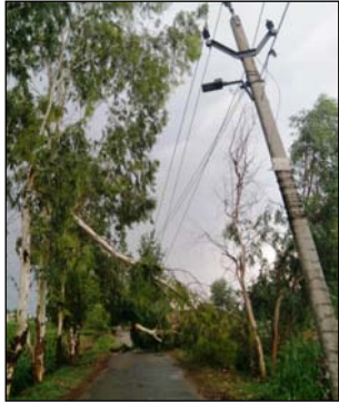
शाह टाइम्स ब्यूरो असमान ने काले बादल छाने से अंधेरा हो गया। मौसम ने अचानक

कलट ली और तेज रफ्तार से हवा चलने के साथ गरज, चमक के साथ बारिश शुरू हो गई। तेज आंधी व बारिश के कारण कई स्थानों बिजली के खंभे और ट्रांसफार्मर टूट