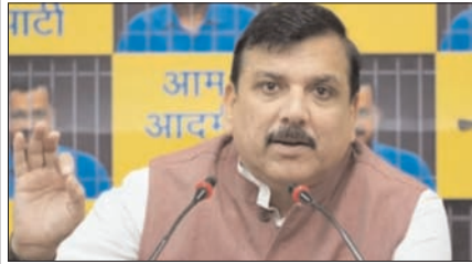
कहा: शिक्षा माफिया और सत्ता के गठजोड़ से खतरे में पड़ रहा है देश के युवाओं का भविष्य

शाह टाइम्स ब्यूरो लखनऊ। आप राज्यसभा सांसद संजय सिंह ने नीट पेपर लीक मामले को लेकर भाजपा सरकार पर निशाना साधते हुए कहा कि शिक्षा माफिया और सत्ता के गठजोड़ से युवाओं का भविष्य खतरे में है। भाजपा युवाओं के साथ खिलवाड़ कर रही है। भाजपा सरकार ने माफियाओं से साठ गाठ कर रखी है जिसके चलते आप दिन पेपर लीक होते रहते हैं। उन्होंने आरोप लगाया कि बार-बार पेपर लीक होने से लाखों छात्रों की मेहनत और सपने प्रभावित हो रहे हैं। मंगलवार को नीट परीक्षा पेपर लीक मामले को लेकर भाजपा सरकार पर बड़ा हमला बोलते हुए राज्य सभा सांसद संजय सिंह ने कहा कि भारतीय जनता पार्टी शिक्षा