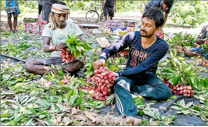
पश्चिम बंगाल। नाटिया में गर्मी के दिन बाजार में भेजने से पहले तोड़ी गई लीफियों को छोटते किसान।