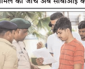
तीन मई को हुई थी नीट यूजी परीक्षा, मामले की जांच अब सीबीआई करेगी

नई दिल्ली। केंद्र सरकार ने नीट यूजी 2026 को परीक्षा रद्द कर दी है। सरकार ने कहा है कि परीक्षा की नई तारीखें जल्द ही घोषित की जाएगी। नीट परीक्षा आयोजित कराने वाली एजेंसी एनटीए ने एक बयान जारी कर बताया कि केंद्र सरकार की मंजूरी मिलने के बाद नीट यूजी 2026 परीक्षा को रद्द करने का फैसला किया गया है।