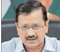
पेट्रोल डीजल वाले बयान पर बोली 'आप'

नई दिल्ली, वार्ता आम आदमी पार्टी के राष्ट्रीय संयोजक अरविंद केजरीवाल ने कहा है कि प्रधानमंत्री नरेंद्र मोदी को इस बारे में स्थिति स्पष्ट करनी चाहिए कि इस समय देश की अर्थव्यवस्था कैसी है और एक साल बाद अर्थव्यवस्था कैसी रहने वाली है। श्री केजरीवाल ने आज यहां संवाददाता सम्मेलन में कहा कि पश्चिम एशिया संकट का प्रभाव दुनिया भर में है लेकिन प्रधानमंत्री ने जिस प्रकार देशवासियों से सात आह्वान किया है उस प्रकार के कदम किसी देश में नहीं उठाए। प्रधानमंत्री ने सिर्फ मध्यम वर्ग से ही कुर्बानी देनी की अपील की है जो बहुत दुखद है। अगर सबसे अधिक कुर्बानी देनी थी, तो सरकार को अपने खर्चों में कटौती