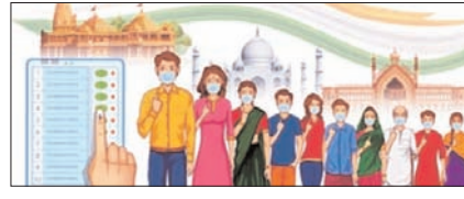
2027 में योगी को हराने का सपना देखना छोड़ दे विपक्ष सम्पादकीय