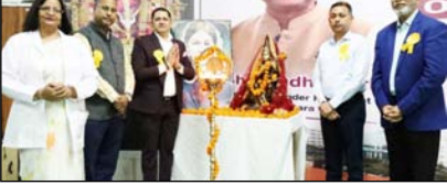
शाह टाइम्स संवाददाता अमरोहा। श्री वेक्टेडशरा विश्वविद्यालय में अंतर्राष्ट्रीय नर्सस दिवस पर राष्ट्रीय सेमिनार, ओथ सेमिनारों में नर्सस सम्मान समारोह का आयोजन किया गया। कार्यक्रम में अवर नर्सस-अरुण पट्टर, एमपीओ नर्सस-सह लक्ष्मि विषय पर सौगोठी आयोजित हुई। जिसमें नर्सस प्रोफेशनल की महत्ता और स्वास्थ्य सेवाओं में उसकी भूमिका पर विस्तार से चर्चा की

अंतर्राष्ट्रीय नर्सस दिवस पर वेक्टेडशरा में राष्ट्रीय सेमिनार