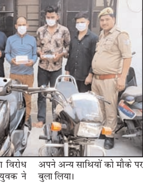
दी। युवक ने जब इसका विरोध किया तो स्कूटी सवार युवक ने अपने अन्य साथियों को मौके पर बुला लिया।