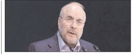
ईरान की 14-सूत्रीय योजना का कोई विकल्प नहीं: गालिबफ पेज 12