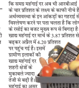
कि समग्र महंगाई दर अब भी आरबीआई के चार प्रतिशत के लक्ष्य के काफी नीचे है। अर्थव्यवस्था के इन आंकड़ों का गहराई से विश्लेषण करने पर पता चलता है कि लोगों के रसाई का बजट मुख्य रूप से बिगड़ा है। खाद्य महंगाई दर मार्च के 3.8 प्रतिशत से बढ़कर अप्रैल में 4.20 प्रतिशत पर पहुँच गई है। इसमें ग्रामीण इलाकों को खाद्य महंगाई दर शहरी क्षेत्रों के मुकाबले ज्यादा तेजी से बढ़ी है। महंगाई का असर

मैं है। भारत ने 1 अप्रैल 2026 से 31 मार्च 2031 तक के पांच वर्षों के लिए अपनी खुदरा महंगाई दर का लक्ष्य 4 प्रतिशत (2 प्रतिशत से 6 प्रतिशत के दायरे में) पर बरकरार रखा है। एक सर्वे में खुदरा महंगाई के 3.8 प्रतिशत तक जाने का अनुमान जताया गया था, ऐसे में मौजूदा 3.48 प्रतिशत का आंकड़ा अनुमानों से काफी बेहतर है।