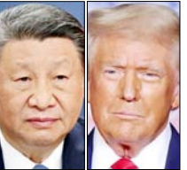
ट्रंप का 2021 के बाद यह पूर्वी एशियाई देश का पहला दौरा है

वाशिंगटन/बीजिंग। अमेरिकी राष्ट्रपति डोनाल्ड ट्रंप चीनी राष्ट्रपति शी जिनिपिंग से मुलाकात के लिए बीजिंग रवाना हो गए हैं, जहां दोनों वैश्विक नेता व्यापार, युद्ध कूटनीति और ताइवान पर गंभीर चर्चा करेंगे। ट्रंप का 2017 के बाद यह पूर्वी एशियाई देश का पहला दौरा है। इस दौरान एशकों में सबसे अहम अमेरिका-चीन सम्मेलन होने की संभावना है।