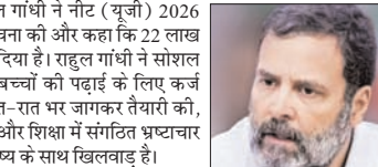
लोक की जांच सीबीआई द्वारा की जाएगी। 3 मई को आयोजित नीट (यूजी) 2026 परीक्षा होने के बाद

नई दिल्ली। लोकसभा में विपक्ष के नेता राहुल गांधी ने नीट (यूजी) 2026 परीक्षा रद्द होने पर केंद्र सरकार की तीखी आलोचना की और कहा कि 22 लाख से अधिक छात्रों को मेहनत पर सरकार ने पानी फेर दिया है। राहुल गांधी ने सोशल मीडिया पर जारी बयान में कहा कि किसी पिता ने बच्चों की पढ़ाई के लिए कर्ज लिया, किसी माँ ने गहने बेचे और लाखों छात्रों ने रात-रात भर जागरण तैयारी की, लेकिन बदले में उन्हें पेपर लीक, सरकारी लापरवाही और शिक्षा में संगठित भ्रष्टाचार मिला। यह सिर्फ नकामी नहीं, बल्कि युवाओं के भविष्य के साथ खिलवाड़ है।