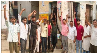
शाह टाइम्स संवाददाता हुसैनपुर। ग्राम भदौरा में पिछले एक माह से पेयजल आपूर्ति ठप होने के कारण ग्रामीणों का धैर्य जाकबंद न गया। जल जीवन मिशन के तहत हो रही