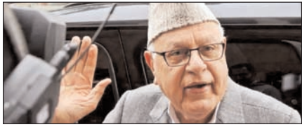
केंद्र राजस्व की भरपाई कर दे, तो उमर सरकार शराब पर प्रतिबंध लगा सकती है: फारुक पेज 2

नई दिल्ली, मुजफ्फरनगर, देहरादून, हल्द्वानी, मुगदाबाद, बरेली, मेरठ व लखनऊ से प्रकाशित