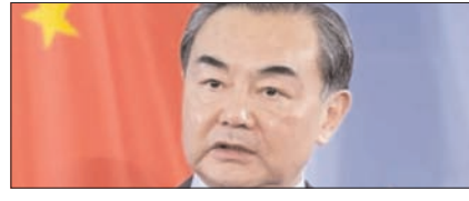
चीनी विदेश मंत्री वांग ई ने ट्रम्प को दी कड़ी चेतावनी पेज 11