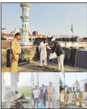
के अनुरूप संचालन सुनिश्चित कराया गया।