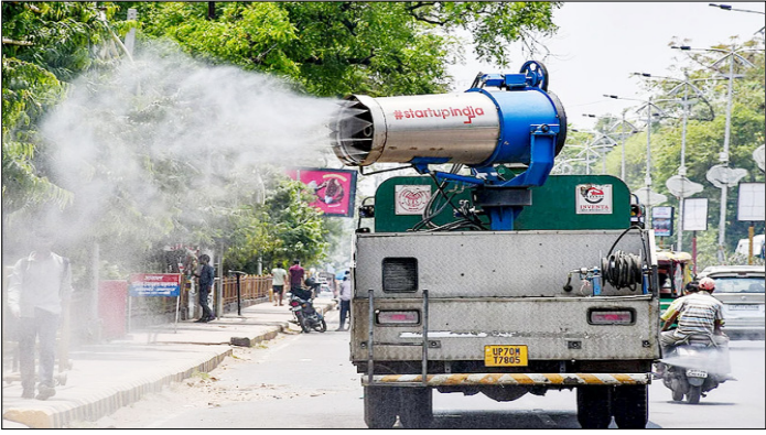
प्रयागराज। भीषण गर्मी के दिन में लोगों को राहत देने के लिए पानी का छिड़काव करता नगर निगम का वाटर स्पिकलर ट्रक।