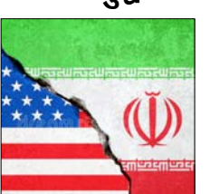
■ अधिकारियों ने माना कि ऐसा ऑपरेशन बेहद जोखिम भरा होगा

50 हजार सैनिक और युद्धपोत तैनात, ट्रम्प के फैसले का इंतजार