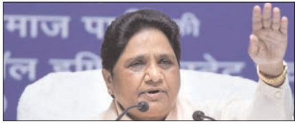
आंधी-तूफान पीड़ितों की पूरी उदारता से मदद करे सरकार: मायावती पेज 2

नई दिल्ली, मुजफ्फरनगर, देहरादून, हल्द्वानी, मुगदाबाद, बरेली, मेरठ व लखनऊ से प्रकाशित