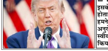
■ मैं वास्तव में इसके पक्ष में नहीं हूँ, लेकिन हमने इसे पाक के अनुरोध को स्वीकार करते हुए किया: ट्रम्प

एयर फोर्स वन। अमेरिकी राष्ट्रपति डोनाल्ड ट्रम्प ने कहा है कि पश्चिम एशिया में शत्रुता को समाप्त करने के लिए राजनयिक मार्ग खोलने के उद्देश्य से ईरान के साथ किया गया युद्धविराम समझौता 'पाकिस्तान के अनुरोध पर' किया गया था।