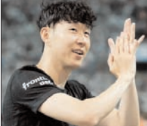
ही-चान और साथी ब्रिटिश-बेस्ड मिडफील्डर वे जून-हो डस्टोक्रेड, पैक सेउंग-हो डबर्मिथम, सेंट्रिक के यांग ह्यून-जून और स्वानसी के इओम जी-सुंग भी शामिल हैं। गोलकीपर: जो ह्योन-वू (उल्सान), किम सेउंग-म्यू (एफसी टोक्यो), सॉन बम-क्यून (जियोनवुक)। डिफेंडर: किम मून-ह्यान (डेजॉन), किम मिन-जे (बायर्न म्यूनिख), किम ताए-ह्योन (काशिमा एंटल्स), पार्क

सियोल, वार्ता। टोटेनहम हॉटस्पर के पूर्व फॉरवर्ड सोन ह्युंग-मिन को चौथी बार दक्षिण कोरिया की विश्वकप फुटबॉल टीम का कप्तान चुना गया है। 33 साल के सोन ने पिछले वर्ष स्पर्स छोड़ दिया था और अब मेजर लीग सांकर टीम लॉस एंजिल्स एफसी के लिए खेलते हैं। दक्षिण कोरिया फीफा विश्व कप 2026 में अपना अभियान 12 जून को चेक रिपब्लिक के खिलाफ शुरू करेगा और फिर 19 जून को सह मेजबान मेक्सिको का सामना करेगा, दोनों मैच ग्वाडलुपारा में होंगे, और फिर 25 जून को मॉन्ट्रेल में दक्षिण अफ्रीका के खिलाफ अपना ग्रुप ए शेंडलुल खत्म करेगा। सोन कोच होंग म्युंग-बो द्वारा चुनी गई एक अनुभवी टीम का हिस्सा हैं, जिसमें वॉल्क्स के फॉरवर्ड ह्यांग