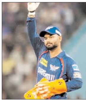
लखनऊ सुपर जायंट्स के कप्तान ऋषभ पंत पर आईपीएल के 59वें मुकाबले में चेन्नई सुपर किंग्स के खिलाफ धीमी ओवर गति के लिए 12 लाख रुपये का जुर्माना लगाया गया है।

मुंबई, वार्ता। लखनऊ सुपर जायंट्स (एलएसजी) के कप्तान ऋषभ पंत पर आईपीएल के 59वें मुकाबले में चेन्नई सुपर किंग्स के खिलाफ धीमी ओवर गति के लिए 12 लाख रुपये का जुर्माना लगाया गया है। आईपीएल के एक बयान के मुताबिक कि न्यायिक यह आईपीएल के कोड ऑफ कंडक्ट के आर्टिकल 2-22 के तहत उनकी टीम का इस सीजन का पहला उल्लंघन था, जो न्यूनतम ओवर-गति अपराधों से जुड़ा है, इसलिए ऋषभ पंत पर 12 लाख रूपए का जुर्माना लगाया गया। इस रोमांचक मुकाबले के शुरू होने से पहले दोनों टीमों काली पट्टी बांधकर मैदान पर उतरीं और उत्तर प्रदेश में आई भयानक ओलावृष्टि के पीड़ितों को श्रद्धांजलि देने के लिए एक मिनट का मौन रखा।