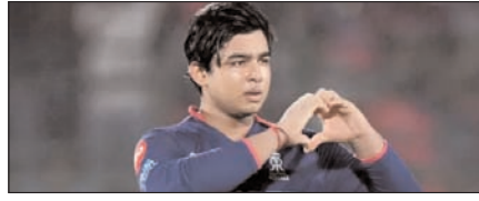
डीसी की प्लेऑफ की उम्मीदों को सूर्यवंशी से खतरा खेल टाइम्स