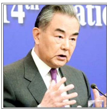
■ दुनिया की दो सबसे बड़ी अर्थव्यवस्थाएँ होने के नाते चीन और अमेरिका एक-दूसरे के बिना काम नहीं कर सकते ■ चीन और अमेरिका के बीच संबंधों में स्थिरता चाहिए, न कि लगातार उतार-चढ़ाव वाले रोलर कोस्टर की तरह ■ शी और ट्रम्प के बीच लगातार नौ घंटे की बातचीत हुई

चीन-अमेरिका टकराव दोनों देशों और पूरी दुनिया के लिए विनाशकारी साबित हो सकता है: वांग इं