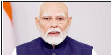
■ भारत आज 'असीम आकांक्षाओं' और 'असीम प्रयासों' के साथ दुनिया की अग्रणी अर्थव्यवस्था बनने की दिशा में तेजी से आगे बढ़ रहा है: पीएम

भारतीय समुदाय को संबोधित करते हुए उन्होंने उन लोगों को दोनों देशों के संबंधों की असली ताकत तथा जीवंत सेतु करार दिया और कहा कि सरकार ने सूरीनामी हिंदुस्तानी समाज के लिए ओसीआईआई कार्ड पात्रता चौथी पीढ़ी से बढ़ाकर छठी पीढ़ी तक कर दी है। मोदी ने आर्थिक, प्रौद्योगिकी क्षेत्र और लो. कर्तांत्रिक उपलब्धियों को रेखांकित किया तथा उन लोगों से भारत-नीदरलैंड संबंधों को नई ऊंचाई देने का आह्वान किया। उन्होंने कहा कि भारत आज 'असीम आकांक्षाओं' और 'असीम प्रयासों' के साथ दुनिया की अग्रणी अर्थव्यवस्था बनने की दिशा में तेजी से आगे बढ़ रहा है। उन्होंने कहा कि नीदरलैंड के