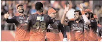
बेंगलुरु आईपीएल-2026 के प्लेऑफ में पहुंचने वाली पहली टीम खेल टाइम्स