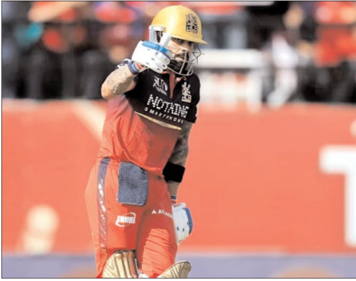
विराट कोहली ने मनाया अपना अर्धशतक।

जवाब में पंजाब 8 विकेट खोकर 199 रन ही बना सकी। इस जीत के साथ बैंगलुरु के 18 पाइंट्स हो गए और टीम इस सीजन में प्लेऑफ में पहुंचने वाली पहली टीम बन गई। वहीं, पंजाब की यह लगातार छठी हार रही। पंजाब की शुरुआत बेहद खराब रही और उसने 19 रन तक 3 विकेट गंवा दिए। बाद में कूपर कोनोली, मार्कस स्टोयनिस और शशांक सिंह ने संघर्ष जरूर