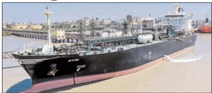
शाह टाइम्स ब्यूरो

नई दिल्ली। पश्चिम एशिया में जारी भारी तनाव के बीच भारत के लिए रूसी गैस की आपूर्ति को लेकर अच्छी खबर आई है। मार्शल आइलैंड्स के झंडे वाला एलपीजी मालवाहक जहाज 'सिमी' रविवार सुबह गुजरात के कांडला स्थित दीनदयाल बंदरगाह पर सफलतापूर्वक पहुंच गया।