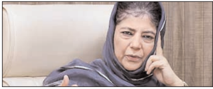
कश्मीर के लिए संवाद ही एकमात्र रास्ता : महबूबा मुफ्ती पेज 2

नई दिल्ली, मुजफ्फरनगर, देहरादून, हल्द्वानी, मुगदाबाद, बरेली, मेरठ व लखनऊ से प्रकाशित