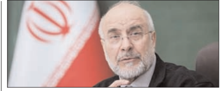
ढल रहा पश्चिमी देशों का वर्चस्व: गालिबाफ पेज 12