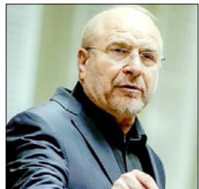
वैश्विक स्तर पर एक ऐतिहासिक परिवर्तन तेजी से आगे बढ़ रहा है: गालिबफ

तेहरान। ईरान के संसद अध्यक्ष मोहम्मद बाकर गालिबफ ने रविवार को वैश्विक राजनीति को लेकर बड़ा बयान दिया है। उन्होंने कहा कि अंतर्राष्ट्रीय व्यवस्था अब एक नई विश्व व्यवस्था के मुहाने पर खड़ी है, जहां पश्चिमी देशों का परंपरिक दबदबा तेजी से कमजोर हो रहा है और ग्लोबल साउथ का प्रभाव बढ़ रहा है। गालिबफ ने दावा किया कि यह बदलाव एक बहुध्रुवीय विश्व व्यवस्था की ओर संकेत करता है, जिसमें शक्ति का केंद्र अब कुछ पश्चिमी देशों तक सीमित नहीं रहेगा। सोशल मीडिया प्लेटफॉर्म एक्स पर पोस्ट करते हुए गालिबफ ने कहा कि वैश्विक स्तर पर एक ऐतिहासिक परिवर्तन तेजी से आगे बढ़ रहा है। उन्होंने चीन के राष्ट्रपति शी जिंपिंग के एक बयान का हवाला देते हुए कहा कि दुनिया एक ऐसे दौर में प्रवेश कर रही है जो पिछले सौ वर्षों में सबसे बड़ा बदलाव साबित हो सकता है। उन्होंने यह भी दावा किया कि ईरान का 70 दिनों का प्रतिरोध इस वैश्विक बदलाव को तेज करने वाला कारक बना है। ईरानी स्पीकर के बयान में अप्रत्यक्ष रूप से अमेरिका और पश्चिमी देशों की भूमिका पर सवाल उठाए गए हैं। उन्होंने कहा कि वैश्विक दक्षिण के देश अब वैकल्पिक व्यवस्था की ओर देख रहे हैं, जहां आर्थिक और राजनीतिक स्वतंत्रता को प्राथमिकता दी जा रही है। ईरानी राज्य मीडिया प्रेस टीवी के