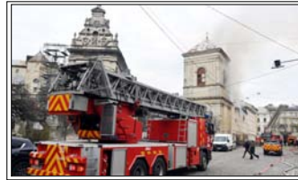
अभी तक मारे गए और घायल लोगों की पहचान सार्वजनिक नहीं की गई है

मास्को। यूक्रेन ने शनिवार रात को रूस के कई इलाकों पर 1000 से ज्यादा ड्रोन से हमला किया। रिपोर्ट्स के मुताबिक इसमें कम से कम 4 लोगों की मौत हो गई है। इसमें 1 भारतीय मजदूर भी शामिल है। रूस में भारतीय दूतावास ने इसकी पुष्टि की है। दूतावास के मुताबिक 3 भारतीय घायल भी हैं। अधिकारियों ने हमले की जगह का दौरा किया और अस्पताल में भर्ती घायलों से मुलाकात भी की। अभी तक मारे गए और घायल लोगों की पहचान सार्वजनिक नहीं की गई है। रूस के अधिकारियों ने बताया कि हमले में मास्को इलाके में तीन लोगों की मौत हुई, जबकि यूक्रेन सीमा से लगे बेलगोरोद इलाके में एक और व्यक्ति की जान गई। मास्को में कुल 12 लोग घायल हुए हैं। इनमें तेल रिफाइनरी में काम करने वाले मजदूर