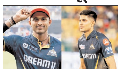
लगने के बाद 13 गेंदों पर 23 रन बनाकर रिटायर्ड हर्ट हो गए थे। लेकिन 17वें ओवर में, जब गिल आउट हुए, तब वह दोबारा बल्लेबाजी करने लौटे और फिर 15 गेंदों पर 30 और रन जोड़कर 28 गेंदों पर नाबाद 53 रन के स्कोर पर समाप्त किया। इस पारी के

कोलकाता, वार्ता। कोलकाता नाइट राइडर्स (केकेआर) ने शनिवार को इंडन गार्डन्स में गुजरात टाइटंस (जीटी) की मेजबानी की और उन्हें 29 रन से हरा दिया। अंक तालिका में नम्बर 8 पर मौजूद टीम ने नम्बर 2 को मात दी। मैच के बाद आईपीएल 2026 की पर्पल कैप सूची में तो कोई बड़ा बदलाव नहीं हुआ, लेकिन ऑरेंज कैप तालिका पूरी तरह बदल गई। ऑरेंज कैप लीडरबोर्ड जीटी मैच हार गई, लेकिन उनके ओपनर्स बी साई सुदर्शन और शुभमन गिल ने केकेआर के 247 रन के स्कोर का पीछा करने की पूरी कोशिश की। सुदर्शन तीसरे ओवर में कार्तिक त्यागी की गेंद