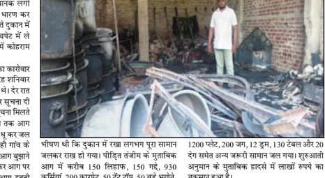
पीषण थी कि दुकान में रखा लगभग पूरा सामान जलकर राख हो गया। पीहित तंजीम के मुताबिक देर समेत अन्य जरूरी सामान जल गया। शुरुआती आग में करीब 150 लिटरा, 150 गै, 930 कुर्सियां, 200 कारसेट, 50 टैट, 50 बेंट भंगाने,

शाह टाइम्स ब्यूरो रहर। धाना क्षेत्र के गांव बांसका कलां में देर रात एक टेंट हाउस की दुकान में अचानक सगी आग ने कुछ ही देर में विकराल रूप धारण कर लिया। आग की लपटों ने देखते ही देखते दुकान में रखा लाखों रुपये का सामान अपनी चपेट में ले लिया। घटना के बाद पीहित परिवार में कोहाम मचा हुआ है।