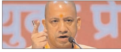
राष्ट्रवाद के भाव से आचरण ही भाजपा कार्यकर्ता की पहचान: योगी पेज 2