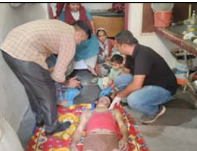
शाह टाइम्स ब्यूरो अमरोहा। पत्नी को प्रेमी के साथ देखने के बाद एक युवक ने एंसा कर्तृनाक कदम उठा लिया, जिसेस पूरे परिवार में कोहाम मचा गया। शारीरुदा जिनगी में लंबे समय से चल रहे विवाद और तनाव के बीच युवक ने घर पहुंचकर फरार से लटककर आत्महत्या कर ली। घटना

पत्नी व उसके प्रेमी के खिलाफ मुकदमा, परिजनों में मचा कोहराम