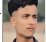
शाह टाइम्स सैदापुरा बंटी धरनी। मीषण गर्मी के बीच नहर में नहाने गया एक किशोर तेज बहाव की चपेट में आकर डूब गया। घटना धाना क्षेत्र के गांव शाहपुर रोड़ा की है। सूचना मिलते पर पुलिस और प्रशासनिक अधिकारियों को पत्र पहुंचे। रेश शमक मोताबेकर नहर में किशोर को तलाश में जुटे रहे।

देर साय तक चलता राह सवर् अभियान, परिजनों का रो रोक बुरा हाल