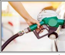
पाक सरकार पिछले कुछ समय से हर हफ्ते शुक्रवार रात को पेट्रोलियम कीमतों की समीक्षा कर रही है

इस्लामाबाद। पाकिस्तान सरकार ने पेट्रोल और डीजल की कीमतों में 5 रुपये लीटर (पाकिस्तानी रुपया) की कटौती की है। इसके बाद अब पाकिस्तान में पेट्रोल की कीमत 409.78 रुपये प्रति लीटर और हाई-स्पीड डीजल (एचएसडी) की कीमत 409.58 रुपये प्रति लीटर पर आ गई है। नई कीमतें आज यानी 16 मई से लागू हो गई हैं। हाल के दिनों में लगातार बढ़ती कीमतों के बाद इस कमी से मध्यम और निम्न-मध्यम वर्ग के बजट को थोड़ा सहारा मिलने की उम्मीद है, क्योंकि पेट्रोल का सीधा असर मोटरसाइकिल, रिक्शा और छोटी गाड़ियों पर पड़ता है। पाकिस्तान सरकार पिछले कुछ समय से हर हफ्ते शुक्रवार रात को पेट्रोलियम