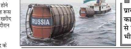
जानकारी देने के लिए बुलाए गए संवाददाता सम्मेलन में सवालों के जवाब में यह बात कही। उन्होंने कहा कि देश में कच्चे तेल की कोई कमी नहीं है और विभिन्न स्रोतों से खरीद के माध्यम से तेल की आपूर्ति

तेल खरीद रहा है यानी छूट से पहले भी, छूट के दौरान भी और अब भी। संयुक्त सचिव ने कहा कि भारत में तेल कहां से खरीदा जाना है इसका निर्णय बाजार की स्थिति को ध्यान में रखकर लिया जाता है। उन्होंने कहा कि देश में कच्चे तेल की आपूर्ति बराबर सुनिश्चित की जा रही है और यह छूट हो या न हो इससे प्रभावित नहीं होती। उल्लेखनीय है कि अमेरिका ने भारत के रूस से तेल खरीदने पर प्रतिबंध लगा रखा है, लेकिन पश्चिम एशिया संकट के देखते हुए अमेरिका ने इन प्रतिबंधों में छूट दी थी जो 16 मई को समाप्त हो गई।