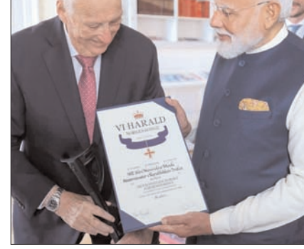
यूरोप भारत में 100 अरब डॉलर निवेश करेगा

आरोपी को बेल देना नियम है और जेल अपवाद (यूएपीए) मामलों में जमानत दे सकती हैं। कोर्ट ने कहा कि खालिद को जमानत याचिका खारिज करते समय कोर्ट ने इस फैसले पर ध्यान नहीं दिया था। 2019 से 2023 के बीच पूरे भारत में यूएपीए मामलों में सिर्फ 1.5 प्रतिशत-4 फीसदी लोगों को सजा हुई। यानी लगभग 94 प्रतिशत मामलों में बरी होने की संभावना होती है। दिल्ली दंगा का आरोपी उमर खालिद जेएनयू का पूर्व छात्र है। वह सितम्बर 2020 से जेल में है। सुनवाई के दौरान कोर्ट ने कहा कि जब कोई बड़ी बेंच फैसला सुना देती है, तो छोटी बेंच को उसे