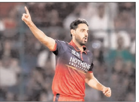
तीसरे ओवर में ही आउट कर दिया। उन्होंने 38 रन देकर दो विकेट लिए। जहाँ उनकी इस सीजन इकानमी 7-70 है तो वहीं इस मैच में उन्होंने 9-50 की इकानमी से रन खर्च किए। इन दो विकेटों के साथ उनके इस सीजन 24 विकेट हो गए हैं जो दूसरे स्थान पर मौजूद कागिसो रबाडा से तीन अधिक हैं। इसके अलावा वह

धर्मशाला, वार्ता। इंडियन प्रीमियर लीग (आईपीएल) 2026 के रॉयल चैलेंजर्स बनारस क्रिस तथा दिल्ली कैपिटल्स और राजस्थान रायल्स के बीच रविवार खेले गए मुक. अबलों के दौरान जहाँ भुवनेश्वर कुमार ने पंजाब क्रिस के दो विकेट झटके कर पर्पल कैप तालिका में अपनी बढ़त मजबूत कर ली है।