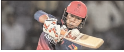
सूर्यवंशी एक सीजन में सबसे ज्यादा सिक्स लगाने वाले भारतीय