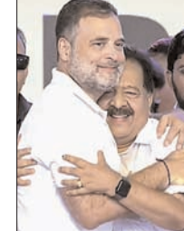
64 साल बाद राज्य में किसी सीएम ने पूरी कैबिनेट के साथ शपथ ली

तिरुवनंतपुरम। कांग्रेस नेता वीडी सतीशन सोमवार को केरलम के 13वां मुख्यमंत्री बने। राज्यपाल राजेंद्र विश्वनाथ आर्लेकर ने उनके अलावा पूरी कैबिनेट (20 मंत्रियों) को शपथ दिलाई। ऐसा 64 साल के बाद हुआ। इससे पहले राज्य के तीसरे कांग्रेसी मुख्यमंत्री रहे आर शंकर ने 1962 में पूरी कैबिनेट के साथ शपथ ली थी, लेकिन 1964 में अविश्वास प्रस्ताव के बाद उनकी सरकार गिर गई थी। कार्यक्रम में राहुल और प्रियंका गांधी के अलावा पूर्व मुख्यमंत्री पी विजयन, बीजेपी नेता राजीव चंद्रशेखर समेत सभी कांग्रेस शासित राज्यों के सीएम भी कार्यक्रम में शामिल हुए। शपथ लेने के बाद जब सतीशन राहुल के पास गए, तो उन्होंने गले लगाकर बधाई दी और कान में कुछ कहा। राहुल गांधी से मिलने के बाद सतीशन खड़े हुए, सीएम सिद्धारमैया, सीएम रवंत रेड्डी, वेणुगोपाल, पिनराई विजयन, सीएम सुक्कु और डीके शिवकुमार से मुलाकात की। केरलम की कैबिनेट में 14