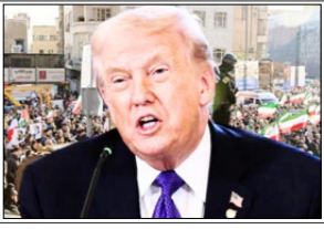
ट्रम्प ने इजरायल के पीएम नेतन्याहू से फोन पर बात करने के तुरंत बाद यह पोस्ट साझा की

वाशिंगटन। अमेरिकी राष्ट्रपति डोनाल्ड ट्रम्प के ईरान को निशाना बनाकर सोमवार को सोशल मीडिया पर साझा किए गए एक नक्शे से दोनों देशों के बीच फिर से जुबानी जंग तेज हो गई है। पश्चिमी एशिया के इस नक्शे पर अमे. रिकी झंडा लगा हुआ था और कई दिशाओं से लाल रंग के तीर ईरान की तरफ इशारा कर रहे थे। ट्रम्प द्वारा अपने सोशल मीडिया में 'दुश्म सोशल' पर साझा किए गए नक्शे के साथ हालांकि कोई स्पष्टीकरण नहीं दिया गया था, लेकिन इस दृश्य को रणनीतिक दबाव बनाने के संदेश के रूप में देखा जा रहा है। इसमें कई लाल तीर ईरान की तरफ बढ़ते दिख रहे हैं, जिसका सीधा मतलब ईरान को चारों तरफ से घेरने का संकेत देना है। यह भड़काऊ तस्वीर ट्रम्प द्वारा रविवार को दुश्म सोशल पर साझा किए गए एक संदेश के बाद आई है, जिसमें उन्होंने लिखा था कि ईरान के