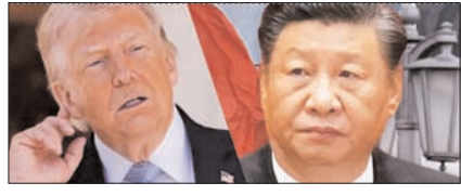
चीन से खाली हाथ लौटे ट्रंप, नहीं बोल पा रहे हैं खुलकर