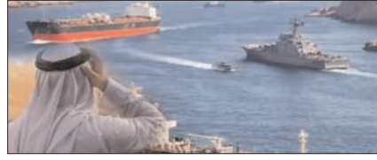
होर्मुज स्ट्रेट बंद होने से कतर का गैस निर्यात ठप