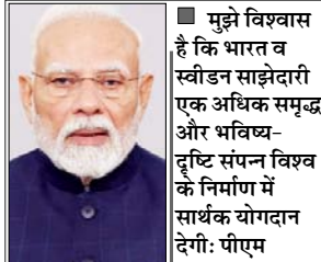
मुझे विश्वास है कि भारत व स्वीडन साझेदारी एक अधिक समृद्ध और भविष्य-दृष्टि संपन्न विश्व के निर्माण में सार्थक योगदान देगी: पीएम

गोथेनबर्ग (स्वीडन)। प्रधानमंत्री नरेंद्र मोदी ने कहा है कि भारत और स्वीडन के बीच सुरक्षा, आर्थिक, प्रौद्योगिकी और नवाचार सहित छह क्षेत्रों में हुए समझौतों और घोषणाओं से भारत-स्वीडन संबंधों को नई ऊर्जा और गति मिलेगी। स्वीडन की यात्रा पर गए मोदी ने रविवार देर रात स्वीडन के प्रधानमंत्री उल्फ क्रिस्टर्सन के साथ द्विपक्षीय वार्ता की जिसके बाद दोनों देशों ने छह क्षेत्रों में सहयोग की घोषणा और समझौते किए। मोदी ने सोमवार को सोशल मीडिया पर एक पोस्ट में विश्वास व्यक्त किया कि भारत-स्वीडन साझेदारी एक अधिक समृद्ध और भविष्य-दृष्टि संपन्न विश्व के निर्माण में सार्थक योगदान देगी। इन समझौतों और घोषणाओं के तहत दोनों देशों ने अपने संबंधों को रणनीतिक साझेदारी के स्तर तक ले जाने का निर्णय लिया है। इसके अंतर्गत स्थिरता और सुरक्षा के लिए दोनों देश रणनीतिक संवाद करेंगे। उनके बीच अगली पीढ़ी की आर्थिक