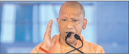
उप में पंचायत चुनाव के लिए पिछड़ा वर्ग आयोग गठित

नई दिल्ली, मुजफ्फरनगर, देहरादून, हल्द्वानी, मुगदाबाद, बरेली, मेरठ व लखनऊ से प्रकाशित