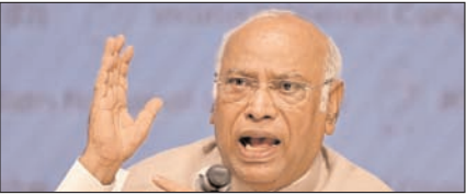
केन्द्र सरकार मनरेगा को बहाल करे और न्यूनतम मजदूरी बढ़ाए: खड़गे

नई दिल्ली, मुजफ्फरनगर, देहरादून, हल्द्वानी, मुतादाबाद, बरौली, मेरठ व लखनऊ से प्रकाशित