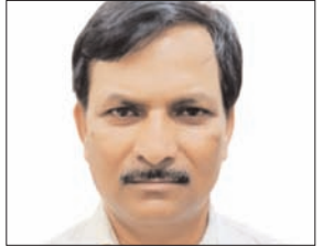
इ-चौदहवां संसोधन किया गया है कि अगर चतुर्थी श्रेणी कर्मी न हो तो मृतक आश्रित में उसका परिवारजन भी चतुर्थी श्रेणी में ही समायोजित होगा अगर वह प्रेजेंट है। पेंशन में मिलने के कारण कर्मचारियों को समाजिक विभागीय भर्ती में सरकार द्वारा स्वीकृत देय राशि में बंदरवांट हो जाती है। कर्मी को मेहनत के अनुरूप भुगतान नहीं होता है। चतुर्थी श्रेणी कर्मचारियों की नियमावली में 14वां