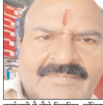
कर्मचारी है जैसे नियमित, सॉलवा, आउट सोर्स है वह भी एजेंसियों के बंधुआ मजदूर के नाम के युग बदलने के साथ समय का चक्र विभक्तियों के साथ ही आया है, क्योंकि नाम ही मनुष्य का सबसे प्रभावी होता है। नाम ही नहीं रहा तो अब वह ना तो उपस्थित रहे न मजदूर रहे और न ही अब कोई क्रांति भी आने वाली है।