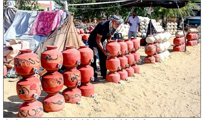
बीकानेर। राजस्थान में गर्मी के दिनों में मिट्टी के बर्तनों को बिक्री के लिए सजाता विक्रेता।

तेहरान। ईरान की लगभग नौ करोड़ की आबादी पिछले दो महीनों से इंटरनेट पर भारी पाबंदियों का सामना कर रही है। यह 'ब्लैकआउट' दुनिया के सबसे लंबे और सख्त प्रतिबंधों में से एक बन गया है, जिसने देश की ऑनलाइन अर्थव्यवस्था को पूरी तरह तबाह कर दिया है। इंटरनेट बंद होने का सबसे बुरा असर छोटे और मध्यम उद्योगों पर पड़ा है। फेशन, फिटनेस, विज्ञापन और खुदरा व्यापार जैसे क्षेत्रों से जुड़े कारोबारियों की आय पूरी तरह खत्म हो गई है। गौरतलब है कि ईरान की ऑनलाइन अर्थव्यवस्था ने लंबे समय तक सरकारी पाबंदियों और अंतर्राष्ट्रीय प्रतिबंधों के बावजूद खुद को संभाला रखा था लेकिन अब यह चरमराम पर है। अमेरिका और इजरायल के साथ हुए अस्थिर और नाजुक समझौते के बावजूद, ईरान के शासकों ने इंटरनेट सेवा बहाल करने से इनकार कर दिया है।