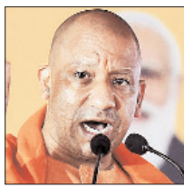
श्रमवीर गौरव कार्यक्रम में बोले सीएम पहले होता था श्रमिकों का शोषण, अब नहीं

शाह टाइम्स ब्यूरो लखनऊ। अंतर्राष्ट्रीय मजदूर दिवस के अवसर पर मुख्यमंत्री योगी आदित्यनाथ ने श्रमिकों के हितों को लेकर सख्त रुख अपनाते हुए फैक्ट्री मालिकों और ठेकेदारों को स्पष्ट चेतावनी दी। उन्होंने कहा कि अब श्रमिकों से काम लेकर भुगतान में टालमटोल या कटौती बर्दाश्त नहीं की जाएगी। उन्होंने कहा कि यदि श्रमिक ने काम किया है, तो उसे उसका पूरा दाम मिलना ही चाहिए, अन्यथा सरकार सख्त कार्रवाई करेगी। लखनऊ स्थित इंदिरा गांधी प्रतिष्ठान में आयोजित 'श्रमवीर गौरव कार्यक्रम' को संबोधित करते हुए मुख्यमंत्री ने