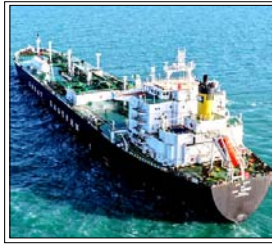
शांति के प्रयासों को झटका यूएई बोला: होर्मुज के मुद्दे पर ईरान पर नहीं किया जा सकता है भरोसा

लंदन/दुबई। पश्चिम एशिया में बढ़ते तनाव के कारण रणनीतिक होर्मुज जलडमरूमध्य से जहाजों की आवाजाही में भारी कमी आई है। समुद्री सुरक्षा अधिकारियों के आकलन के अनुसार, संघर्ष शुरू होने के बाद से यातायात 90 फीसदी से अधिक घट गया है। यह गिरावट अमेरिका और इजरायल के ईरान पर हमलों तथा तेहरान की जवाबी कार्रवाई के बाद हुई है।