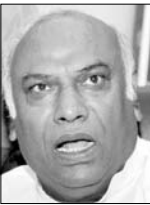
-मल्लिकार्जुन खड़गे, अध्यक्ष, कांग्रेस

बढ़ती बेरोजगारी सरकार की नीतियों का परिणाम है और सरकार ने जो श्रम संहिता लागू की है, उससे कामगारों की स्थिति कमजोर हुई है, इसके अलावा ठेका श्रमिक व्यवस्था तथा हायर एंड फायर जैसी नीतियों को बढ़ावा दिया गया है, इन श्रम कानूनों को समीक्षा की जानी चाहिए, मनरेगा को कमजोर कर दिया गया है और मजदूरी के खर्च का बड़ा हिस्सा राज्यों पर डाल दिया गया है, जिससे राज्यों के लिए योजना को प्रभावी ढंग से चलाना कठिन हो गया है, सरकार की नीतियों के कारण श्रमिकों को असंगठित और गिग कार्य की ओर धकेला जा रहा है, जहां बड़ी संख्या में लोग न्यूनतम मजदूरी से कम पर काम करने को मजबूर हैं, महंगाई को ध्यान में रखा जाए तो पिछले वर्षों में मजदूरी वृद्धि बहुत कम रही है।