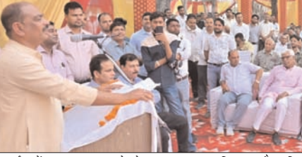
कार्यालयों का चक्कर काटने के लिए व्यर्थ ही परेशान न होना पड़े, इसके लिए लाभार्थी को सरकारी