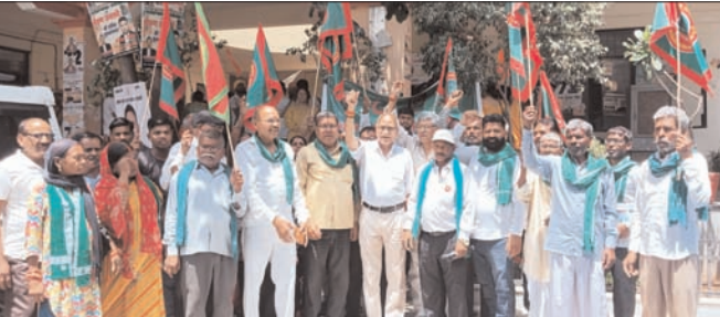
भी कमजोर करेगा। निजीकरण के प्रतिगामस्वरूप बिजली दरों में वृद्धि, सेवाओं की गुणवत्ता में गिरावट तथा कर्मचारियों के अधिकारों पर प्रतिकूल प्रभाव पड़ना तय है। मई दिवस, जो श्रमिक एकता, अधिकारों और

शाह टाइम्स ब्यूरो लखनऊ। मई दिवस के अवसर पर विद्युत कर्मचारी संयुक्त संघर्ष समिति, उत्तर प्रदेश के आ जवान पर प्रदेश भर के बिजली कर्मियों, अभियंताओं एवं कर्मचारियों ने एकजुट होकर पूर्वोक्त विद्युत वितरण निगम एवं दक्षिणांचल विद्युत वितरण निगम के प्रस्तावित निजीकरण के विरुद्ध किसी भी प्रकार का बलिदान देने का दृढ़ संकल्प लिया। संघर्ष समिति ने स्पष्ट किया कि बिजली जैसे अत्यंत महत्वपूर्ण और जनजीवन से जुड़े क्षेत्र का निजीकरण न केवल लाखों उपभोक्ताओं के हितों के खिलाफ है, बल्कि यह सामाजिक न्याय और सस्ती विश्वव्यापी बिजली उपलब्ध कराने की अवधारणा को भी कमजोर करेगा। निजीकरण के प्रतिगामस्वरूप बिजली दरों में वृद्धि, सेवाओं की गुणवत्ता में गिरावट तथा कर्मचारियों के अधिकारों पर प्रतिकूल प्रभाव पड़ना तय है। मई दिवस, जो श्रमिक एकता, अधिकारों और