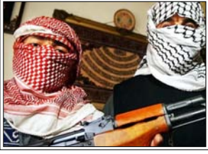
पाक सरकार पश्चिमी देशों के करीब जा रही है, जिससे क्षेत्रीय हित प्रभावित हो रहे हैं: अल कायदा

इस्लामाबाद। पाकिस्तान ईरान और अमेरिका के बीच मध्यस्थता कराने की कोशिश में घरेलू मोर्चे पर धिरता जा रहा है। दरअसल खुफिया रिपोर्टों में पता चला है कि खूंखार आतंकी संगठन अल-कायदा, पाकिस्तान में अशांति भड़काना चाहता है और उसने इसकी कोशिशें भी शुरू कर दी हैं।