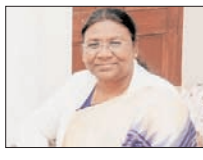
प्रशिक्षण से संबंधित विषयों पर की चर्चा