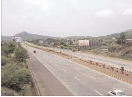
उपर को चार राज्यों की सीमा से जोड़ेगा और यह गंगा एक्सप्रेसवे से लिंक होगा, जल्द ही काम शुरू होने की उम्मीद

साथ ही व्यापार व पर्यटन की दृष्टि से भी यह काफी महत्वपूर्ण साबित होगा। यह एक्सप्रेस प्रयागराज में सोरांव, फूलपुर, हडिया तहसील के रास्ते होते हुए मिर्जापुर और सोनभद्र तक जाएगा। एक्सप्रेसवे के लिए तीन तहसीलों के जिन 84 गांवों में जमीन का अधिग्रहण किया जाना है, उनमें तहसील सोरांव के 29,