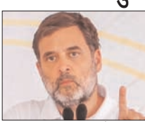
महिलाएं, मजदूर और छोटे व्यापारी सब रो रहे हैं, प्रधानमंत्री हंसते हुए रील बना रहे हैं तथा भाजपा वाले ताली बजा रहे हैं। यह नेतृत्व नहीं, नौटंकी है।

नई दिल्ली। कांग्रेस नेता राहुल गांधी ने प्रधानमंत्री नरेंद्र मोदी के इटली दौरे को लेकर उन पर जमकर निशाना साधा और कहा कि देश आर्थिक चुनौतियों से जूझ रहा है, वहीं श्री मोदी विदेश में टॉफी बांटने और रील बनाने में व्यस्त हैं।