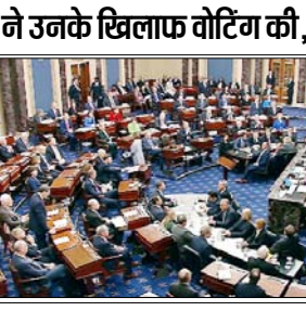
ट्रम्प की सैन्य शक्तियों को सीमित करने की कवायद, युद्ध का अधिकार संसद के पास हो: विपक्ष

वाशिंगटन। अमेरिकी संसद में राष्ट्रपति डोनाल्ड ट्रम्प की सैन्य शक्तियों को सीमित करने वाला प्रस्ताव पास हो गया है। वोटिंग में 4 रिपब्लिकन सांसदों ने भी विपक्षी पार्टी डेमोक्रेट्स का साथ दिया। हालांकि 3 रिपब्लिकन सांसद वोटिंग में शामिल नहीं हुए। यह प्रस्ताव 50.47 से पास हुआ, हालांकि इसे कानून बनाने के लिए अभी कुछ और चरणों से गुजरना होगा। अगर यह प्रस्ताव कानून बनता है, तो ट्रम्प सरकार को ईरान के खिलाफ युद्ध जारी रखने के लिए कांग्रेस की मंजूरी लेनी होगी। अभी सीनेट में इस पर अंतिम वोटिंग होनी बाकी है। इसके बाद इसे रिपब्लिकन बहुमत वाली हाउस आफ रिप्रेजेंटेटिव्स से मंजूरी लेनी होगी। हालांकि उसके बाद भी ट्रम्प इसके खिलाफ वीटो कर सकते हैं। फिर उस वीटो को रद्द करने के लिए सीनेट और हाउस दोनों में दो-तिहाई बहुमत