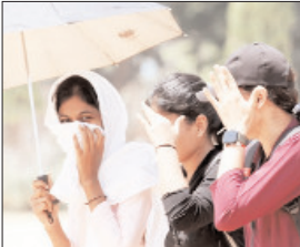
अगले पांच दिनों तक भीषण गर्मी और लू का प्रकोप जारी रहने की संभावना: मौसम विभाग

शाह टाइम्स ब्यूरो लखनऊ। समूचे उत्तर भारत में जारी प्रचंड गर्मी से इस सप्ताह राहत की कोई उम्मीद नहीं है। मौसम विभाग ने समूचे उत्तर प्रदेश में अगले तीन दिनों तक रेड अलर्ट जारी किया है लेकिन उसके बाद भी गर्मी और लू रात दिन सताएगी। मौसम विभाग द्वारा बुधवार को जारी बुलेटिन के अनुसार अगले पांच दिनों तक भीषण गर्मी और लू का प्रकोप जारी रहने की संभावना है। प्रदेश के पश्चिमी और पूर्वी दोनों हिस्सों में 24 मई तक मौसम मुख्यतः शुष्क रहेगा तथा 20 से 30 किलोमीटर प्रति घंटा की रफ्तार से तेज सतही हवाएं चल सकती हैं, जिनके झोंके 40 किलोमीटर प्रति घंटा तक पहुंचने की संभावना है। मौसम विभाग के अनुसार 20 से 24 मई के दौरान दिन के समय प्रदेश के अनेक जिलों में उष्ण लहर ( लू ) से भीषण उष्ण लहर चलने की आशंका है, जबकि कई स्थानों पर उष्ण रात्रि की स्थिति भी बनी रह सकती है। विभाग ने विशेष रूप से बुंदेलखंड, कानपुर मंडल, आगरा मंडल तथा पूर्वांचल के कई