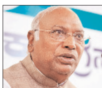
कहा: आम जनता आर्थिक नीतियों से पैदा हुई 'मुश्किलों' के बीच जीवनयापन करने को मजबूर

नई दिल्ली, वातां कांग्रेस अध्यक्ष मल्लिकार्जुन खड़गे ने कहा है कि देश गंभीर आर्थिक संकट में है लेकिन प्रधानमंत्री नरेंद्र मोदी तथा उनके नेतृत्व वाली सरकार सिर्फ आत्म प्रचार में व्यस्त है और इसी का परिणाम है कि देश में महंगाई, बेरोजगारी और आर्थिक संकट गंभीर रूप से बढ़ा है और जनता पर आर्थिक बोझ थोपा गया है। खड़गे ने सोशल मीडिया एक्स पर बुधवार को लिखा कि श्री मोदी जनता को भाषणों की 'मिठास' सुनाना चाहते हैं, जबकि आम जनता उनकी सरकार की आर्थिक नीतियों से पैदा हुई 'मुश्किलों' के बीच जीवनयापन करने को मजबूर है। उन्होंने दावा किया कि पिछले 11 वर्षों में प्रत्येक भारतीय पर औसत कर्ज कई गुना बढ़ा है, जबकि चुनिंदा उद्योगपतियों की संपत्ति में तेजी से इजाफा हुआ है। कांग्रेस अध्यक्ष ने