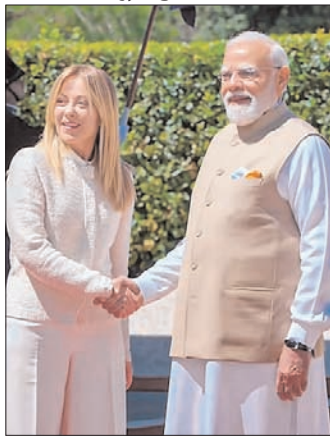
अरब रुपये) के द्विपक्षीय व्यापार को साल 2029 तक बढ़ाकर 20 बिलियन यूरो यानी करीब 2,241.85 अरब रुपये तक पहुंचाना है। यह एक बेहद महत्वाकांक्षी लक्ष्य है, जिसे भारत और यूरोपीय संघ के बीच हस्ताक्षरित मुक्त व्यापार

भारत और इटली ने अपने द्विपक्षीय संबंधों में एक नए स्वर्णिम अध्याय की शुरुआत कर दी है। पीएम मोदी की इटली की पहली द्विपक्षीय यात्रा के दौरान दोनों देशों ने अपने रिश्तों को सर्वोच्च स्तर पर ले जाते हुए विशेष रणनीतिक साझेदारी में अप्रैड कर दिया है। रोम में आयोजित इस ऐतिहासिक शिखर सम्मेलन के दौरान इतालवी प्रधानमंत्री जोर्जिया मेलोनी ने पीएम मोदी का गर्मजोशी से स्वागत किया। मेलोनी ने कहा कि वर्ष 2000 के बाद, यानी पूरे 26 साल बाद किसी भारतीय प्रधानमंत्री को यह पहली द्विपक्षीय इटली यात्रा है, जो दोनों देशों के बीच की दूरी को मिटाकर रिश्तों को एक नई ऊर्जा देगी। द्विपक्षीय वार्ता के बाद साझा प्रेस वक्तव्य में प्रधानमंत्री मेलोनी ने आर्थिक सहयोग को नई ऊंचाइयों पर ले जाने का संकल्प जताया। उन्होंने कहा कि हमारा लक्ष्य वर्तमान 14 बिलियन यूरो ( करीब 1,569.3