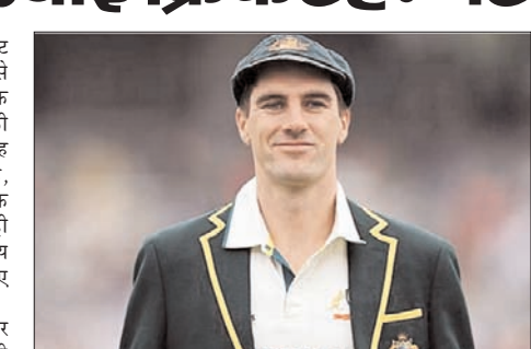
होने वाला बॉर्डर-गावस्कर ट्रॉफी और इंग्लैंड में होने वाला एशेज भी शामिल है। ऑस्ट्रेलिया के बड़े खिलाड़ियों की अंतर्राष्ट्रीय क्रिकेट और बीबीएल दोनों के प्रति प्रतिबद्धता हाल के दिनों में चर्चा का विषय रही है। पांच वरिष्ठ खिलाड़ी इस महीने की शुरुआत

होने वाला बॉर्डर-गावस्कर ट्रॉफी और इंग्लैंड में होने वाला एशेज भी शामिल है। ऑस्ट्रेलिया के बड़े खिलाड़ियों की अंतर्राष्ट्रीय क्रिकेट और बीबीएल दोनों के प्रति प्रतिबद्धता हाल के दिनों में चर्चा का विषय रही है। पांच वरिष्ठ खिलाड़ी इस महीने की शुरुआत में क्रिकेट ऑस्ट्रेलिया के शुरुआती कॉन्ट्रैक्ट प्रस्तावों से खुश नहीं थे। कमिंस भी मार्च में चर्चा के केंद्र में आ गए थे, जब उन्होंने बिजनेस ऑफ स्पोर्ट्स पॉइकास्ट पर खिलाड़ियों के बीच एक तनाव का विद्वेषण की बात कही थी।