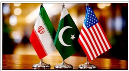
ईरान अमेरिका के साथ अच्छी नीयत से बातचीत कर रहा है, लेकिन उसे अमेरिका पर अब भी गहरा शक है: बघाई

तेहरान। अमेरिका ने पश्चिम एशिया संघर्ष को स्थाई रूप से खत्म करने के लिए पाकिस्तान के जरिये नया युद्धविराम प्रस्ताव भेजा है। अल अरबिया की रिपोर्ट के मुताबिक, इस मामले से जुड़े कूटनीतिक सूत्रों ने यह जानकारी दी है। ईरान इस प्रस्ताव की समीक्षा कर रहा है, लेकिन अब तक उसने कोई आधिकारिक जवाब नहीं दिया है। दोनों पक्षों के बीच मतभेद कम करने के लिए मध्यस्थ लगाने का प्रयास किया जा रहा है। इसी बीच, पाकिस्तान के सेना प्रमुख आसिम मुनीर ने ईरान यात्रा का प्लान बनाया है। इससे पहले ईरान के विदेश मंत्रालय के प्रवक्ता इस्माइल बघाई ने कहा था कि ईरान अमेरिका के साथ अच्छी नीयत से बातचीत कर रहा है, लेकिन उसे अमेरिका पर अब भी गहरा शक है। ईरान के सरकारी मीडिया प्रेस टीवी के मुताबिक, बघाई ने कहा कि ईरान को उसके 14 सूत्रीय प्रस्ताव पर अमेरिका का जवाब मिल गया है और उसकी समीक्षा की जा रही है। उन्होंने बताया कि पाकिस्तान के गृह मंत्री मोहसिन नकवी की तेहरान यात्रा का मकसद दोनों पक्षों के बीच बातचीत को आसान बनाना है। बघाई ने कहा कि इस समय हमारी प्राथमिकता लेबनान समेत सभी मोर्चों पर युद्ध खत्म करना है। ईरान ने अपनी मुख्य मांगों में जमा फंड जारी करने, समुद्री रास्तों में कथित