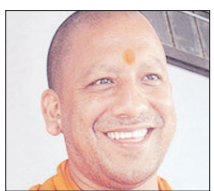
एक जनवरी 2026 से लागू होगा बढ़ा हुआ महंगाई भत्ता

शाह टाइम्स ब्यूरो लखनऊ। यूपी की योगी आदित्यनाथ सरकार ने राज्य के कर्मचारियों के महंगाई भत्ते में दो प्रतिशत इजाफा करने की घोषणा की है। वित्त विभाग के एडिशनल चीफ सिक्रेटरी दीपक कुमार ने गुरुवार को इसको लेकर आदेश जारी किया। वैश्विक संकट की वजह से पेट्रोल-डीजल और दूध के दामों में बढ़ोतरी हुई है। योगी सरकार के फैसले का लाभ राज्य के लाखों कर्मचारियों और पेंशनर्स को होगा। आदेश के मुताबिक बढ़ा हुआ महंगाई भत्ता 1 जनवरी 2026 से लागू होगा। इस संदर्भ में जारी शासनादेश में कहा गया है कि 1 जनवरी 2026