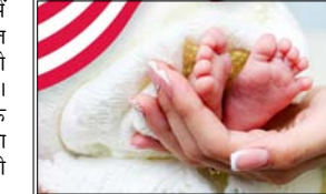
नागरिकता हासिल कर ले। साउथ कैरोलिना की सांसद मेस ने सोशल मीडिया पर बयान जारी करते हुए कहा कि उन्होंने लंबे समय से लंबित संवैधानिक संशोधन पेश किया है। उन्होंने तर्क दिया कि अमेरिका के राष्ट्रपति और उपराष्ट्रपति बनने के लिए पहले से ही नेचुरल बॉर्न सिटिजन यानी जन्म से अमेरिकी नागरिक होना जरूरी है, इसलिए यही नियम कांग्रेस, संघीय अदालतों और सीनेट से मंजूर

वाशिंगटन। अमेरिका में प्राकृतिक रूप से नागरिकता हासिल करने वाले लोगों के अधिकारों को लेकर नई बहस छिड़ गई है। रिपब्लिकन सांसद नैन्सी मेस ने एक संवैधानिक संशोधन प्रस्ताव पेश किया है, जिसमें प्राकृतिक रूप से अमेरिकी नागरिक बने लोगों को कांग्रेस सदस्य, संघीय न्यायाधीश और सीनेट की पुष्टि वाले महत्वपूर्ण पदों पर नियुक्त होने से रोकने की मांग की गई है। इस प्रस्ताव को लेकर डेमोक्रेटिक नेताओं ने तीखी प्रतिक्रिया दी है और इसे नस्लवादी, घृणित और विधेयक मूल के लोगों के खिलाफ बताया है। प्राकृतिक रूप से नागरिकता का मतलब है कि कोई व्यक्ति जन्म से उस देश का नागरिक न हो, लेकिन बाद में कानूनी प्रक्रिया पूरी करके उस देश की