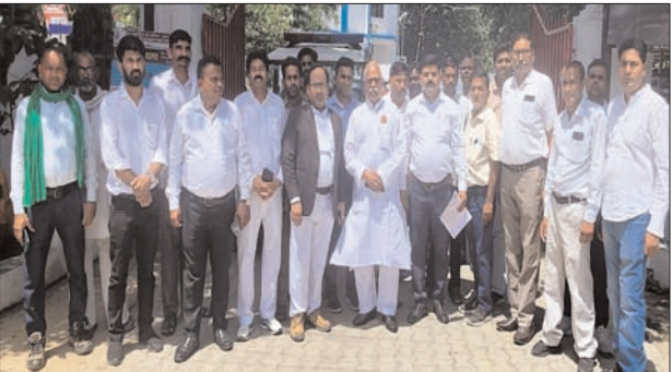
अमरोहा। राष्ट्रीय प्रजापति महासंघ ने पीड़ित परिवार को न्याय व दोषियों पर कार्रवाई की मांग को पुलिस अधीक्षक कार्यालय पर प्रदर्शन किया।