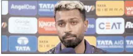
हार्दिक पंड्या पर मैच फीस का 10 फीसदी जुमाना खेल टाइम्स