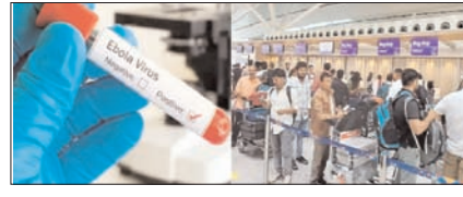
इबोला का डर: नजर रखें और सतर्क रहें सम्पादकीय