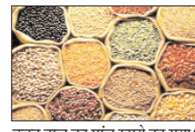
उड़द दाल का पांच रुपये टूट गया। मसूर दाल दो रुपये प्रति क्विंटल सस्ती रही। मलेशिया के बुरसा मलेशिया डेरिवेटिव एक्सचेंज में पाम ऑयल का अगस्त वायदा 126 रिगिट गिरकर 4,457 रिगिट प्रति टन रहा। बुलाई का अमेरिकी सोया तेल वायदा भी 0.23 प्रतिशत की नरमी के साथ 74.49 सेंट प्रति पौंड के भाव बढ़ा गया। स्थानीय बाजारों में पाम ऑयल की औसत कीमत 11 रुपये प्रति क्विंटल बढ़

नई दिल्ली, वार्ता घरेलू थोक जिस बाजारों में गुरुवार को चावल की औसत कीमत गिर गई। वहीं गेहूं में मजबूती देखी गई। चीनी के भाव में टिकाव रहा जबकि दालों और खाद्य तेलों में उतार-चढ़ाव का रुख रहा। औसत दर्जे के चावल की औसत कीमत तीन रुपये घटकर 3,857 रुपये प्रति क्विंटल रह गई। गेहूं 10 रुपये की तेजी के साथ 2,784 रुपये प्रति क्विंटल बढ़ा गया। आटा नौ रुपये महंगा हुआ। दाल-दलहनों में मिलाजुला रुख रहा। चना दाल की औसत कीमत 11 रुपये और मूंग दाल की छह रुपये प्रति क्विंटल बढ़ गई। तुअर दाल का भाव 27 रुपये और