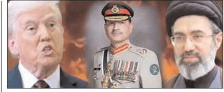
पाकिस्तान के जरिये अमेरिका का नया युद्ध विराम प्रस्ताव पेज 12