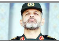
अहमद वहीदी लंबे समय से ईरान की सुरक्षा और सैन्य रणनीति का अहम चेहरा रहे हैं

मौत के बाद वहीदी को रिवोल्यूशनरी गार्ड की कमान सौंपी गई थी। अब वह ईरान को सबसे ताकतवर सैन्य ताकत का नेतृत्व कर रहे हैं, जिसके पास बैलिस्टिक मिसाइलों का बड़ा जखीरा और फारस की खाड़ी में सक्रिय नौसैनिक क्षमता है। विश्वलेखकों का मानना है कि होर्मुज जलडमरूमध्य पर दबाव बनाने और वैश्विक तेल आपूर्ति में वहीदी की अहम भूमिका है। वाशिंगटन स्थित इंस्टीट्यूट फार स्टडी ऑफ वार का कहना है कि वहीदी और उनके करीबी लोगों ने न सिर्फ युद्ध से जुड़ी सैन्य रणनीति नीतिक अमेरिका के साथ वार्ता की बल्कि भी निर्णयण मजबूत कर लिया है।