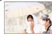
गर्मी के ताल्लख तेवरों से सामान्य जन जीवन बुरी तरह प्रभावित, पशु पक्षी भी हो रहे बेहाल

शाह टाइम्स ब्यूरो लखनऊ। प्रचंड गर्मी और ताप लहरी का सामना कर रहे उत्तर प्रदेश के लोगों को राहत मिलने के फिलहाल कोई आसार नहीं है। मौसम विभाग के अनुसार पूरे प्रदेश में भीषण गर्मी और लू का प्रकोप जारी रहेगा। पूर्वांचल के लिए मौसम विभाग ने गुरुवार को विशेष तौर पर रेड अलर्ट जारी कर लोगों को स्वास्थ्य के प्रति सतर्क रहने और सुबह 11 बजे से शाम पांच तक जरूरी काम से ही घर या दफ्तर से बाहर निकलने की सलाह दी है। गर्मी के ताल्लख तेवरों ने सामान्य जनजीवन को बुरी तरह प्रभावित किया है। गर्मी से पशु पक्षी भी बेहाल हैं। दिन चढ़ने के साथ पक्षी पेड़ की घनी शाखाओं में दुबक रहे हैं वहीं सड़कों पर सुबह से शाम तक पसरा सन्नाटा गर्मी के प्रचंड रूप की तस्वीर कर रहा है। लू से बचने के लिए लोग घर से बाहर निकलते ही गोल गमछे और तौलिए का इस्तेमाल कर रहे हैं। इसके अलावा ठंडे शीतल पेय जैसे लस्सी, छाछ, आम का पना, बेल का शरबत, गुन्ने का रस और कई प्रकार के कोल्ड ड्रिंक्स की मांग तेजी से बढ़ी है। हर सो कदम पर लोगों को इन पेय पदार्थों की जरूरत महसूस हो रही है। प्राणिक उद्यान और अन्य संरक्षित वन्यजीव क्षेत्रों में जानवरों को गर्मी से बचाने के विभिन्न उपाय किए जा रहे हैं। कहीं कूलर तो कहीं पानी की बौछार कर वन्य जीवों को राहत प्रदान की जा रही है। गर्मी के प्रकोप को देखते हुए कई जिलों में नगर निकायों ने सड़कों पर पानी की बौछार करने, पेजल की टैंकियों को ट्रेक्टर ड्राली भेजने के प्रबंध किए हैं। नोएडा, गाजियाबाद, लखनऊ समेत कई इलाकों में प्रतिष्ठित कंपनियों ने अपने कर्मचारियों को वर्क फ्रम होम की इजाजत दी है। गर्मी के कारण विद्युत मांग में करीब डेढ़ गुने का इजाफा होने से बिजली