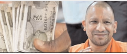
यूपी के कर्मचारियों-पेंशनरों को राहत, डीए 2 प्रतिशत बढ़ा

नई दिल्ली, मुजफ्फरनगर, देहरादून, हल्द्वानी, मुगदाबाद, बरेली, मेरठ व लखनऊ से प्रकाशित