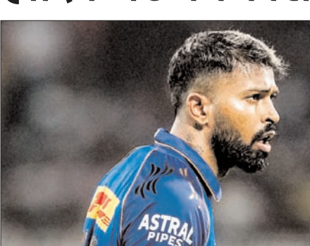
कोलकाता, वार्ता। मुंबई इंडियंस (एमआई) के कप्तान हार्दिक पंड्या पर उनकी मैच फीस का 10 प्रतिशत जुर्माना लगाया गया है और साथ ही उन्हें एक डिमिटेड पॉइंट भी दिया गया है। यह कार्रवाई बुधवार को कोलकाता के इंडन गार्डन्स में कोलकाता नाइट राइडर्स

(केकेआर) के खिलाफ खेले गए मैच नंबर 65 के दौरान, खिलाड़ियों और टीम अधिकारियों के लिए आईपीएल की आचार संहिता के लेवल 1 का उल्लंघन करने के लिए की गई है। हार्दिक पंड्या को आईपीएल की आचार संहिता के अनुच्छेद 2-2 का उल्लंघन करते हुए पाया गया। यह अनुच्छेद मैच के दौरान क्रिकेट के