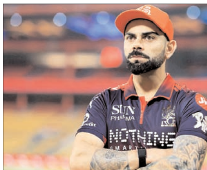
सालों की अनियमितता और करीबी हार के बाद, बेंगलुरु को इस सीजन में आधिकारिक सही संतुलन मिल गया लगता है, जिसमें उनकी बैटिंग और बॉलिंग दोनों यूनियंस से योगदान मिल रहा है। आरसीबी 18 फॉइंट्स और 1-065 के बेहतरीन नेट रन रेट के साथ इस मुकाबले में टॉप पर पहुंचने में आरस.बी की शानदार बटुत की अगुवाई की है।

हैदराबाद, वार्ता। विराट कोहली की रॉयल चैलेंजर्स बेंगलुरु और सनराइजर्स हैदराबाद की विस्फोटक बैटिंग ताकत के बीच एक ब्लॉकबस्टर मुकाबला शुक्रवार को यहां रणजी गंधी इंटरनेशनल क्रिकेट स्टेडियम में धूम मचाने के लिए तैयार है, क्योंकि आईपीएल 2026 का लीग चरण एक रोमांचक अंत की ओर बढ़ रहा है।