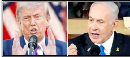
कतर, सऊदी अरब और यूएई जैसे खाड़ी देशों की अपील पर यह फैसला लिया गया: ट्रम्प

नेल अवीव/वाशिंगटन। ईरान युद्ध को लेकर अमेरिकी राष्ट्रपति डोनाल्ड ट्रम्प और इजरायली प्रधानमंत्री बेजायिन नेतन्याहू के बीच मतभेद खुलकर सामने आ गए हैं। एक रिपोर्ट के मुताबिक, नेतन्याहू चाहते हैं कि ईरान पर हमले जारी रहें, जबकि ट्रम्प फिलहाल बातचीत और डील को मौका देना चाहते हैं। रिपोर्ट के मुताबिक, मंगलवार को दोनों नेताओं के बीच करीब एक घंटे तक फोन पर बातचीत हुई। अमेरिकी अधिकारी ने बताया कि नेतन्याहू ने ट्रम्प से कहा कि ईरान पर प्रस्तावित हमले रोकना गलती है और सैन्य कार्रवाई जारी रहनी चाहिए। ट्रम्प ने नेतन्याहू को बताया था कि अमेरिका ईरान पर नए टारगेट हमले की तैयारी कर रहा है। इस ऑपरेशन को 'ऑपरेशन स्लेजहैमर' नाम दिया जाना था, लेकिन करीब 24 घंटे बाद ट्रम्प ने घोषणा कर दी कि मंगलवार के लिए तय हमलों को फिलहाल रोक दिया गया है। ट्रम्प ने कहा कि कतर, सऊदी अरब और यूएई जैसे खाड़ी देशों को