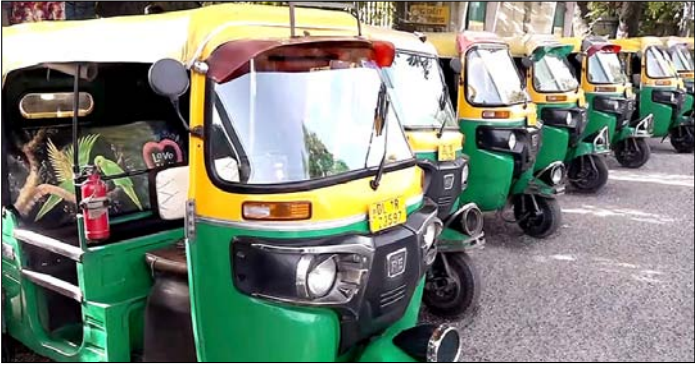
नई दिल्ली। ऑल इंडिया मोटर ट्रांसपोर्ट कांग्रेस (एआईएमटीसी) द्वारा वाणिज्यिक वाहनों पर पर्यावरण क्षतिपूर्ति उपकर बढ़ाने के फैसले के विरोध में बुलाई गई तीन दिवसीय हड़ताल के दौरान कतार में खड़े ऑटो-रिक्शा।