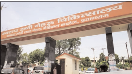
जूनियर डाक्टरों की हड़ताल तीसरे दिन खत्म, इमरजेंसी सेवा बहाल कर दी गई, ओपीडी शनिवार से संचालित होगी