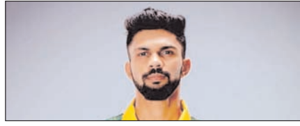
सीएसके के कप्तान गायकवाड़ पर लगा 24 लाख का जुर्माना खेल टाइम्स