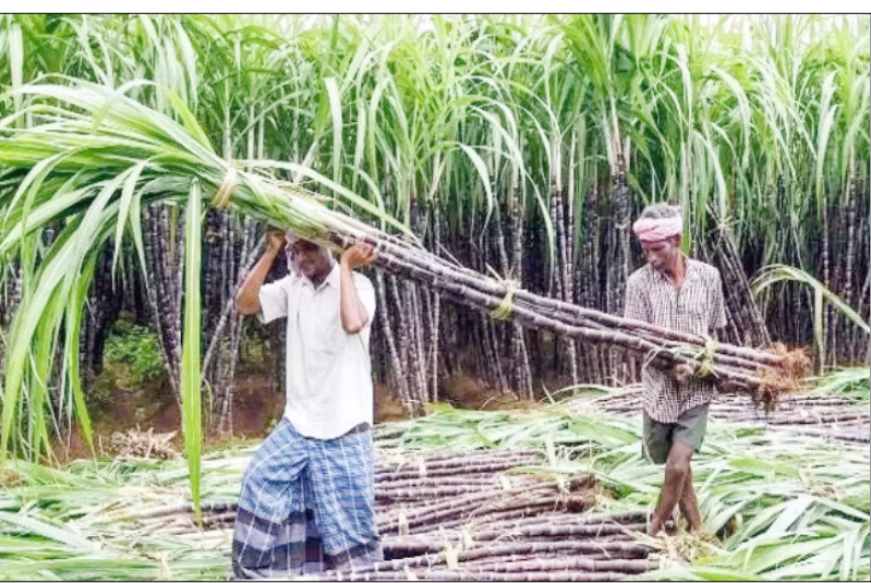
तथा उद्योग और किसानों के बीच संतुलित व्यवस्था को प्राथमिकता दी जानी चाहिए।

उर्वरकों पर खर्च करने की बारी आती है तब रिकवरी आधारित भुगतान की बात की जाती है। यह व्यवस्था किसानों के साथ न्यायसंगत नहीं कही जा सकती। बायो प्रोडक्ट उद्योग तेजी से विकसित हो रहा है। नई तकनीकों और उपयोगों के कारण गन्ने का औद्योगिक महत्व हर वर्ष बढ़ रहा है। इसलिए एक कानून स्थाई रूप से न बनाकर प्रत्येक 10 वर्ष बाद पुनः समीक्षा और संशोधन के साथ लागू किया जाना चाहिए। रिकवरी आधारित मूल्य निर्धारण किसानों के शोषण का कारण बन सकता है। वर्तमान व्यवस्था में कई मामलों में यह निर्णय उद्योगों और बाजार की आवश्यकता के अनुसार चलता है। यदि रिकवरी वास्तव में उद्योग के लिए हानिकारक होती तो देश में चीनी मिलों की संख्या लगातार ना बढ़ती और नई मिलें स्थापित करने की योजनाएं न बनती। अतः गन्ना अधिनियम 2026 बनाते समय किसानों के हितों की रक्षा, गन्ने से बनने वाले सभी उत्पादों का आर्थिक मूल्यांकन, मिट्टी की उर्वरता की वास्तविक लागत