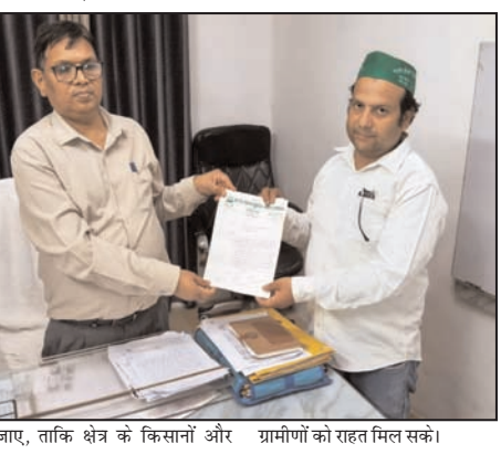
जाए, ताकि क्षेत्र के किसानों और ग्रामीणों को राहत मिल सके।