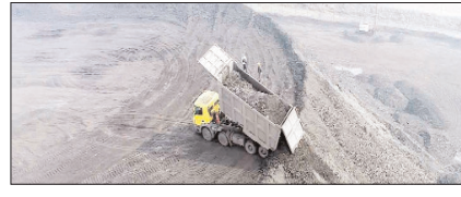
काला सोना या देश का हरा भविष्य? सम्पादकीय