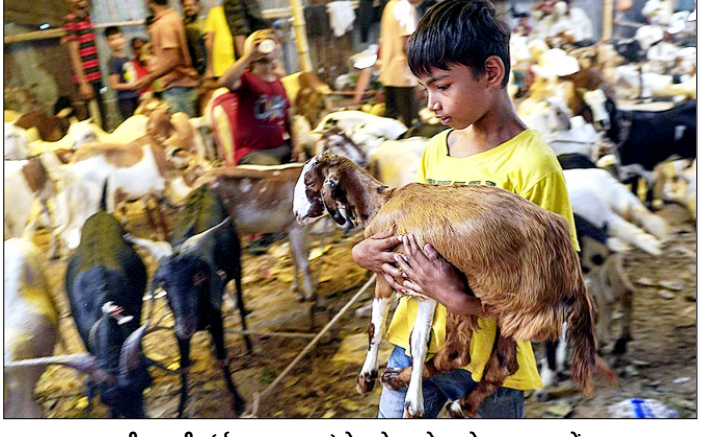
वाराणसी। बकरी (ईट-उल-अजहा) के त्योहार से पहले पशु बाजार में बकरा खरीदने के बाद उसको गोद में उठाकर ले जाता एक बच्चा।

देश पर हमला अंतर्राष्ट्रीय कानून के खिलाफ है। बचाई ने कहा कि फरवरी के अंत में ईरान पर हुआ अमेरिका-इजरायल हमला और उसके बाद का युद्ध संयुक्त राष्ट्र चार्टर का खुला उल्लंघन है। उनके मुताबिक, संयुक्त राष्ट्र चार्टर किसी भी देश को मनमाने तरीके से दूसरे संप्रभु राष्ट्र पर बल प्रयोग का अधिकार नहीं देता। उन्होंने कहा कि संयुक्त राष्ट्र चार्टर में 'आवश्यक युद्ध' जैसी किसी अवधारणा को मान्यता नहीं दी गई है और अमेरिका अपने 'मनमाने और आक्रामक फैसलों' के आधार पर किसी अन्य देश पर हमला करने का अधिकार नहीं ले सकता। ईरानी प्रवक्ता ने कहा कि अमेरिका-इजरायल हमले को केवल 'आवश्यक युद्ध' कहकर कमतर नहीं आका जा सकता। उन्होंने इसे संयुक्त राष्ट्र चार्टर के अनुच्छेद 2(4) का स्पष्ट उल्लंघन और 'संप्रभु राष्ट्र के खिलाफ आक्रामक कार्रवाई' बताया। बचाई ने कहा कि जो देश कानून के शासन और संयुक्त राष्ट्र चार्टर का सम्मान करते हैं, उन्हें इस हमले की स्पष्ट निंदा करनी चाहिए और जवाबदेही तय करने की मांग करनी चाहिए। ईरान को इस्लामिक रिवोल्यूशनरी गार्ड फोर्स (आईआरजीसी) नौसेना ने दावा किया है कि पिछले 24 घंटों में 35 जहाज, जिनमें तेल टैंकर और कंटेनर पोत शामिल हैं, होर्मुज स्ट्रेट से गुजरे। आईआरजीसी ने कहा कि यह आवाजाही उसकी अनुमति और समन्वय से हुई।