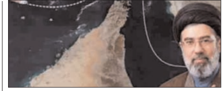
होर्मुज स्ट्रेट में जहाजों से फीस वसूलेगा ईरान पेज 12