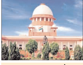
कहा: अगर संपन्न बच्चों के लिए फिर से आरक्षण मांगा जाए, तो हम कभी भी इस चक्र से बाहर नहीं निकल पाएंगे

जस्टिस बीवी नागरला और जस्टिस उज्वल भूइया की बेंच ने ये कमेंट तब किया। जब वे कर्नाटक हाईकोर्ट के एक फैसले के खिलाफ दायर याचिका पर सुनवाई कर रहे थे। याचिकाकर्ता को क्रीमी लेयर के आधार पर