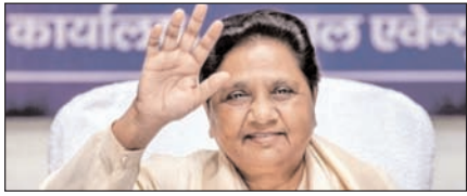
बिजली संकट से निजात दिलाने के उचित कदम उठाए सरकार: मायावती पेज 2

नई दिल्ली, मुजफ्फरनगर, देहरादून, हल्द्वानी, मुताबाद, बरेली, मेरठ व लखनऊ से प्रकाशित