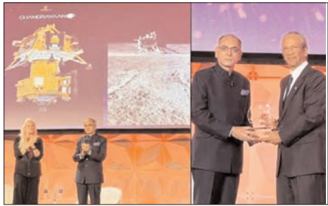
वाला दुनिया का पहला देश बना था। चंद्रमा का दक्षिणी ध्रुव वैज्ञानिक और रणनीतिक दृष्टि से बेहद महत्वपूर्ण माना जाता है। इस क्षेत्र को सतह पर इससे पहले कोई मिशन नहीं पहुंच पाया था। मिशन ने भविष्य के मानव चंद्र अभियानों के लिए अहम वैज्ञानिक आंकड़े उपलब्ध कराए। साथ ही चंद्रमा के दक्षिणी ध्रुवीय क्षेत्र की मिट्टी में कई महत्वपूर्ण रासायनिक तत्वों की मौजूदगी की पुष्टि की।

यह सम्मान 21 मई को वाशिंगटन डीसी में आयोजित कार्यक्रम के दौरान दिया गया। 23 अगस्त 2023 को चंद्रयान-3 ने इतिहास रचते हुए चंद्रमा के दक्षिणी ध्रुव के पास सफल सॉफ्ट लैंडिंग की थी। भारत ऐसा करने