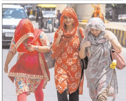
छत्तीसगढ़, हरियाणा, दिल्ली, मध्य प्रदेश, पंजाब, तेलंगाना, उत्तर प्रदेश और महाराष्ट्र में भी हीटवेव चलेगी। असम, मेघालय, कर्नाटक, नगालैंड, मणिपुर, मिजोरम, त्रिपुरा, कर्नाटक और तमिलनाडु में भारी बारिश का अनुमान है। 24 मई को बिहार, दिल्ली, हरियाणा, उत्तर प्रदेश, महाराष्ट्र, मध्य प्रदेश, छत्तीसगढ़, पंजाब, राजस्थान और तेलंगाना में हीटवेव की स्थिति बनी रह सकती है। पश्चिम बंगाल, ओडिशा और तमिलनाडु के कुछ हिस्सों में गर्म और उमसभरा मौसम बना रह सकता है -शेष पृष्ठ पर

■ यूपी के 13 शहर इनमें शामिल, 35 शहरों में रात में भी गर्म हवाएं चलीं, कई राज्य में स्कूलों के टाइम बदले गए, बांदा फिर टॉप पर