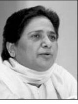
—श्री मायावती, अध्यक्ष, बसपा

सरकार को बिजली संकट से आमजन को निजात दिलाने के त्वरित उपाय करने चाहिए, बिजली संकट से गरीब, मध्यम वर्ग, किसान, छोटे व्यापारी और करोड़ों मेहनतकश लोगों का जीवन अति-कष्टदायी बन गया है, उत्तर प्रदेश जैसे विशाल आबादी वाले राज्य में भीषण गर्मी के इस मौसम में बिजली की कम आपूर्ति व कटौती आदि की आम शिकायतों को लेकर लोग विभिन्न रूपों में अपना आक्रोश भी प्रकट कर रहे हैं, जिसकी चर्चा समाचार माध्यमों में भी काफी व निरन्तर रहती है, सरकार बिजली आपूर्ति सम्बंधी लोगों के कष्ट व परेशानियों को ध्यान में रखते हुए जरूरी उपाय तत्काल सुनिश्चित करे, साथ ही, नए बिजलीघर के माध्यम से भी आगे के लिए बिजली आपूर्ति को सुधारने का प्रयास करे तो यह व्यापक जनहित में उचित होगा।