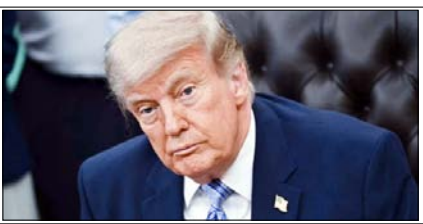
ट्रम्प बोले: मुस्लिम देश इजरायल से रिश्ते सुधारें, ये सभी देश अब्राहम समझौते में शामिल हों

वाशिंगटन। अमेरिकी राष्ट्रपति डोनाल्ड ट्रम्प ने सोमवार को कहा कि वे ईरान के साथ ओबामा जैसी डील नहीं करेंगे। उन्होंने कहा कि या तो अच्छा समझौता होगा या फिर कुछ भी नहीं होगा। ट्रम्प ने ईरान के साथ होने वाले समझौते की आलोचना करने वाले नेताओं पर नारा जगी जताई। उन्होंने सोशल मीडिया पर लिखा-जिन्हें ईरान के साथ होने वाले समझौते के बारे में कुछ भी नहीं पता है, वे भी इसकी बुराई कर रहे हैं। ट्रम्प ने कहा कि ये लोग कमजोर हैं और सिर्फ देश को बांटते हैं। ट्रम्प ने यह भी कहा कि उनका संभावित समझौता 2015 के परमाणु समझौते जैसा नहीं होगा। ट्रम्प ने ओबामा के समझौते को आपदा बताया और दावा किया कि उससे ईरान के लिए परमाणु हथियार तक पहुंचने का रास्ता खुल गया था। अभी तक अमेरिका और ईरान के बीच समझौते पर दस्तखत नहीं हो सके। इससे पहले कई मीडिया रिपोर्ट्स में दावा किया गया था कि रिविचर को ही दोनों देश सीजफायर बढ़ाने और होमरुज खोलने को लेकर समझौता कर सकते हैं। ईरान ने ओमान के जरिए अपना मौखिक संदेश अमेरिका तक पहुंचाया। ईरान के उप विदेश मंत्री काजेम गरीबावदी ने कहा है कि उन्होंने ईरान के विदेश मंत्री अब्बास अराबची का एक मैसेज ओमान के विदेश मंत्री तक पहुंचाया। ईरान के राष्ट्रपति मसूद पजशकियान ने कहा कि ईरान में कोई भी बड़ा फैसला सुप्रीम लीडर की मंजूरी के