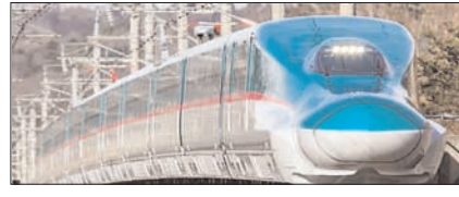
भारत की पहली बुलेट ट्रेन परियोजना: प्रगति का नया अध्याय सम्पादकीय