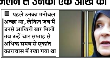
पहले उनका मनोबल अच्छा था, लेकिन जब मैं उनसे आखिरी बार मिली तब उन्हें चार सप्ताह से अधिक समय से एकांत कारावास में रखा गया था