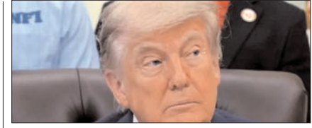
ईरान के साथ ओबामा जैसी डील नहीं करूंगा: ट्रम्प पृष्ठ 12