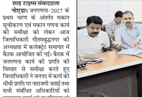
जिलाधिकारी ने कहा कि जनगणना देश का अत्यंत महत्वपूर्ण कार्य है और इसमें किसी भी प्रकार की लापरवाही स्वीकार नहीं की जाएगी। उन्होंने सभी चार्ज अधिकारियों को निर्देश दिए कि वे

शाह टाइम्स संवाददाता नोएडा। जनगणना-2027 के प्रथम चरण के अंतर्गत मकान सूचीकरण एवं मकान गणना कार्य की समीक्षा को लेकर आग जिलाधिकारी गौतमबुद्धनगर की अध्यक्षता में कलेक्ट्रेट सभागार में बैठक आयोजित की गई। बैठक में जनगणना कार्य की प्रगति की विस्तार से समीक्षा करते हुए जिलाधिकारी ने जनपद में कार्य की धीमी प्रगति पर नाराजगी जताई तथा सभी संबंधित अधिकारियों को जनगणना कार्य को प्राथमिकता के आधार पर पूरा करने के निर्देश दिए। बैठक में जनगणना कार्य उप नि. शक निदेशालय, उत्तर प्रदेश, लखनऊ अभियन्तृ सिंह द्वारा वर्तमान प्रगति से जिलाधिकारी को अवगत कराया गया।