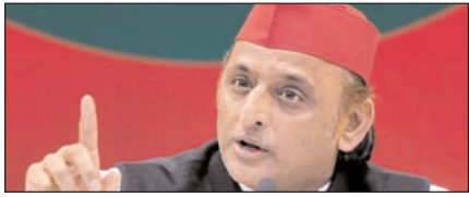
जन आक्रोश से बचने को भाजपा नेता दिखावटी चिट्ठी लिख रहे: अखिलेश पृष्ठ 2

नई दिल्ली, मुजफ्फरनगर, देहरादून, हल्द्वानी, मुरादाबाद, बरेली, मेरठ व लखनऊ से प्रकाशित