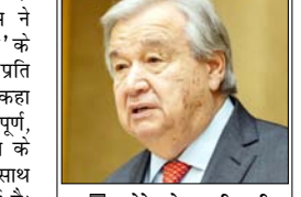
गुटेरेस ने महाद्वीप की प्रचुर ताकत, लचीलेपन और वैश्विक मंच पर इसके बढ़ते प्रभाव की सराहना की

गुटेरेस ने महाद्वीप की प्रचुर ताकत, लचीलेपन और वैश्विक मंच पर इसके बढ़ते प्रभाव की सराहना की। उन्होंने कहा कि अफ्रीका के लोगों ने गुलामी और उपनिवेशवाद के विनाशकारी परिणामों का सामना करते हुए आपदा को एकता और संकल्प में बदला है। आज यही साझा संकल्प महाद्वीप में मुक्त व्यापार, नवीकरणीय ऊर्जा (रिन्यूएबल एनर्जी) के विस्तार, नवाचार (इनावेशन) को बढ़ावा देने और स्थायी