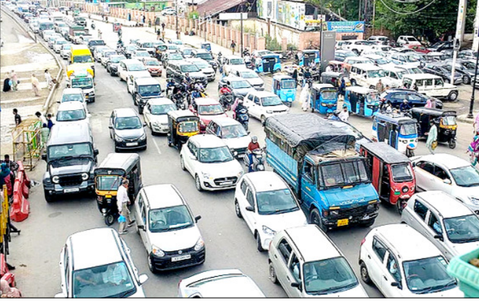
श्रीनगर। 'ईद-उल-अजहा' के त्योहार की खरीदारी को लेकर जाम में फंसे वाहन।