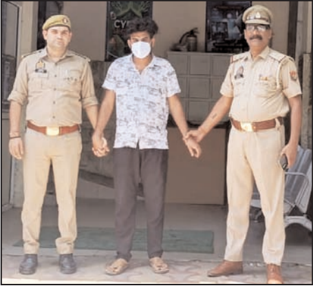
हाइबर क्राइम पुलिस ने बताया कि 10 अप्रैल को पीड़ित को एक

इस खाते के खिलाफ अलग-अलग राज्यों में आठ शिकायत दर्ज हैं। जिसमें उप्र में एक, केरल में एक, राजस्थान एक, गुजरात में एक कर्नाटक एक और महाराष्ट्र में 3 शिकायत दर्ज है। जिनकी जांच की जा रही