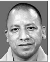
-योगी आदित्यनाथ मुख्यमंत्री, उत्तर प्रदेश

स्वास्थ्य सेवाओं में सुधार का असर सीधे आम आदमी को दिखना चाहिए, सरकारी अस्पतालों में इलाज, जांच, दवाओं और आपात सेवाओं की गुणवत्ता लगातार बेहतर की जाए, मेडिकल कॉलेजों, नर्सिंग संस्थानों और सुपर स्पेशियलिटी सेवाओं को आधुनिक तकनीक, बेहतर मानव संसाधन और प्रभावी प्रबंधन से सशक्त बनाया जाए, आयुष्मान योजना गरीब और जरूरतमंद परिवारों का सबसे बड़ा सहारा बन रही है, प्रदेश में 6480 अस्पताल योजना से जुड़े हैं और अब तक 96-75 लाख से अधिक निःशुल्क उपचार हो चुके हैं, आयुर्वेद, यूनानी और होम्योपैथी की आईपीडी सेवाएं भी योजना का हिस्सा बनेंगी।