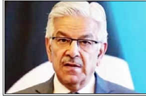
ट्रम्प ने मुस्लिम देशों से इजरायल से रिश्ते सुधारने और अब्राहम समझौते में शामिल होने की अपील की थी

इस्लामाबाद। पाकिस्तान ने इजरायल से दोस्ती करने और उसे देश की मान्यता देने से इन्कार कर दिया है। पाकिस्तान के रक्षा मंत्री ख्वाजा आसिफ ने कहा कि पाकिस्तान अपनी मौलिक विचारधाराओं से समझौता नहीं कर सकता। आसिफ ने कहा हम उन लोगों के साथ कैसे बैठ सकते हैं जिनको बात पर एक दिन के लिए भी भरोसा नहीं किया जा सकता। पाकिस्तान दुनिया का शायद इकलौता देश है, जिसके पासपोर्ट पर लिखा होता है कि यह इजरायल के लिए मान्य नहीं है। इससे पाकिस्तान का रुख पूरी तरह साफ है और इसमें कोई बदलाव नहीं होगा। दरअसल, अमेरिकी राष्ट्रपति डोनाल्ड ट्रम्प ने मुस्लिम देशों से इजरायल से रिश्ते सुधारने और अब्राहम समझौते में शामिल होने की अपील की थी। पाकिस्तान से भी कहा गया था कि अगर वह अमेरिका-ईरान शांति प्रक्रिया का हिस्सा बनना चाहता है, तो उसे इजरायल को धरतल राजनीति को भी नजरअंदाज नहीं कर सकता है। पाकिस्तान ने पिछले 78 साल में कभी इजरायल को मान्यता नहीं दी है। उसका आधिकारिक रुख यह रहा है कि जब तक