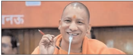
जनता का पैसा जनहित में ही लगेगा: मुख्यमंत्री योगी

नई दिल्ली, मुजफ्फरनगर, देहरादून, हल्द्वानी, मुरादाबाद, बरेली, मेरठ व लखनऊ से प्रकाशित