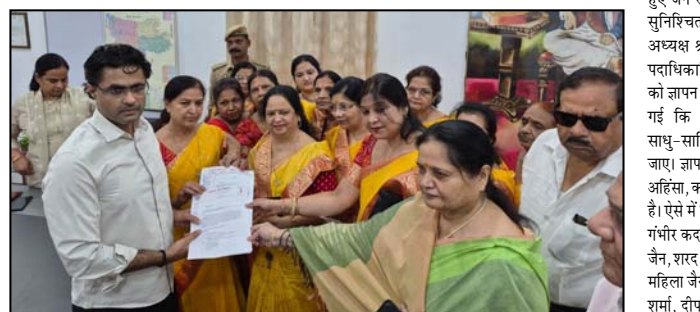
शाह टाइम्स ब्यूरो

रीवा हादसे से जैन समाज में रोष, सौंपा ज्ञापन