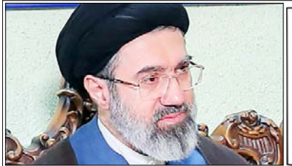
मुस्लिम देश एक ऐसे ऐतिहासिक दौर में प्रवेश कर रहे हैं, जहां क्षेत्रीय परिस्थितियां अपरिवर्तनीय रूप से बदल रही हैं

उन्होंने कहा कि मुस्लिम देश एक ऐसे ऐतिहासिक दौर में प्रवेश कर रहे हैं, जहां क्षेत्रीय परिस्थितियां अपरिवर्तनीय रूप से बदल रही हैं और अमेरिकी सैन्य प्रभाव लगातार कमजोर हो रहा है। उन्होंने कहा कि समय के पहिए को पीछे नहीं घुमाया जा सकता। क्षेत्र के देश अब अमेरिकी सैन्य ठिकानों के लिए ढाल का काम नहीं करेंगे। उन्होंने आरोप लगाया कि अमेरिका के पास अब अपनी शरारतों और क्षेत्र में सैन्य अड्डे स्थापित करने के लिए सुरक्षित ठिकाना नहीं बचेगा और वह दिन-ब-दिन अपनी पूर्व स्थिति से दूर होता जा रहा है। संदेश में क्षेत्रीय प्रतिरोध