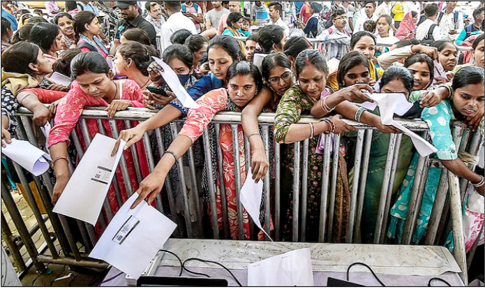
पटना। ज्ञान भवन में आयोजित राज्य स्तरीय रोजगार मेला-2026 के दूसरे दिन पंजीकरण काउंटर पर नौकरी चाहने वाली महिलाओं की भीड़।