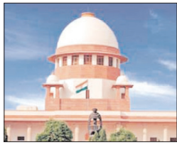
फर्जी नंबर वाले वाहनों पर कार्रवाई के निर्देश

कोर्ट ने कहा कि अवैध खनन रोकने के लिए राज्यों को निगरानी व्यवस्था मजबूत करनी होगी और खाली पड़े वन रक्षक पदों पर जल्द भर्ती करनी होगी। सुप्रीम कोर्ट की जस्टिस विक्रम नाथ और जस्टिस संदीप मेहता की पीठ ने इस मामले को सुनवाई की। अदालत ने मध्य प्रदेश के मुरैना जिले में बिना नंबर