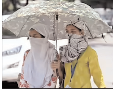
उहरना मुश्किल हो रहा था। सबसे ज्यादा दिक्कत दिहाड़ी मजदूरों, रिक्शा चालकों, पुलिसकर्मियों

शाह टाइम्स संवाददाता ग्रेंटर नोएडा। जिले में लगातार कई दिनों से पारा 40 डिग्री के पार है। मंगलवार को भी तेज धूप और लू से लोग बेहाल रहे। दिन में बाजारों, सड़कों और सार्वजनिक स्थानों पर सन्नाटा पसरा रहा। आईएमडी की वेबसाइट के अनुसार मंगलवार को गौतमबुध नगर का अधिकतम तापमान 40.9 और न्यूनतम 26.3 डिग्री सेल्सियस दर्ज किया गया। सोमवार को भी अधिकतम तापमान इतना ही था। दिनभर तेज धूप, उमस और आठ से 10 किलोमीटर प्रति घंटे की रफ्तार से चली मूसल हवा ने लोगों को बेहाल कर दिया। दोपहर में खुले आसमान के नीचे लोगों को थोड़ी देर तक