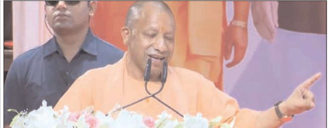
मुख्यमंत्री योगी आदित्यनाथ ने नगर निगम, लखनऊ की 413 करोड़ रुपये लागत की विभिन्न जनकल्याणकारी परियोजनाओं कार्यक्रम का लोकार्पण/ शिलान्यास किया

शाह टाइम्स ब्यूरो लखनऊ। मुख्यमंत्री योगी आदित्यनाथ ने आज नगर निगम, लखनऊ की 413 करोड़ लागत की विभिन्न जनकल्याणकारी परियोजनाओं कार्यक्रम का लोकार्पण/ शिलान्यास किया। सीएम योगी ने लखनऊ नगर निगम के एक समारोह में सरकारी संपत्ति को नुकसान पहुंचाने वालों पर तंज कसा। उन्होंने कहा, ढाई करोड़ की कार में चलने वाले नगर निगम का 45 रुपये का गमला चुराकर ले जाते हैं। सीसीटीवी कैमरे से इस तरह की चोरी की घटना देखी। हम गमला लगाते हैं, तो कोई कार से आता है और गमला उठाकर ले जाता है। जितना कार का तेल लग रहा है, उतने में नया गमला ले सकते हो। ये चोरी का नया मॉडल है। अब हर जगह