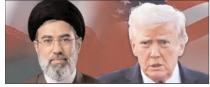
अब खाड़ी में पैर नहीं फैला सकेगा अमेरिका: मुज्तबा खामेनेई