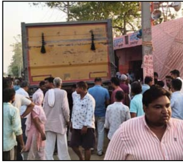
हादसे के बाद डम्पर को घेरकर खड़े ग्रामीण।