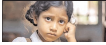
भविष्य की कीमत पर बिक रहा आज का मां-बाप