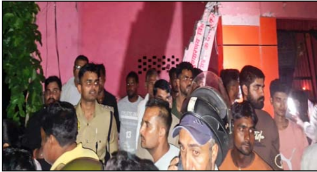
अमरोहा। हादसे के बाद मन्दिर के पास जमा लोगों की भीड़

शाह टाइम्स ब्यूरो अमरोहा। मंगलवार को कांठ रोड पर एक बड़ा दुखद हादसा हुआ। जब सड़क किनारे स्थित हनुमान मन्दिर में सुन्दरकांड का पाठ हो रहा था, जिसमें सैकड़ों