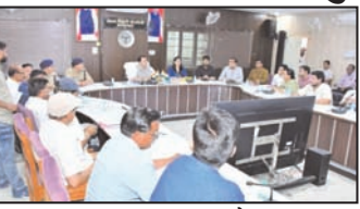
शाह टाइम्स ब्यूरो

बदायूं। जिलाधिकारी अनीश राय ने मंगलवार को जिला उद्योग बंधु की बैठक की अध्यक्षता करते हुए अधिकारियों को उद्यमियों व व्यापारियों की समस्याओं का प्राथमिकता पर निस्तारण सुनिश्चित करने के लिए कहा। उन्होंने सभी बैंकर्स से कहा कि वह शासकीय योजनाओं के क्रियान्वयन में पूर्ण सहयोग प्रदान करें तथा उत्तर प्रदेश सरकार के शासननिर्देशों का अनुपालन कराना सुनिश्चित करें, ऐसा न करने पर संबंधित बैंकर्स के विरुद्ध प्राथमिक दर्ज कराई जाएगी।