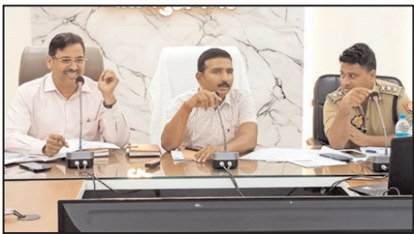
निगरानी और ठोस कदम उठाए जाएं।

बैठक में सड़क सुरक्षा को प्रशासनिक दायित्व के साथ-साथ कानूनी और सामाजिक जिम्मेदारी बताते हुए सभी संबंधित विभागों को आपसी समन्वय के साथ प्रभावी कार्रवाई सुनिश्चित करने के निर्देश दिए गए। अधिकारियों से कहा गया कि सड़क दुर्घटनाओं में कमी लाने के लिए नियमित