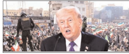
ईरान और अमेरिका के बीच फिर छिड़ सकता है युद्ध