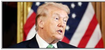
हंसी के बीच कहा: क्यूबा नामक एक स्थान है, जिस पर हम लगभग तुरंत नियंत्रण कर लेंगे

फ्लोरिडा। अमेरिका के राष्ट्रपति डोनाल्ड ट्रम्प ने क्यूबा पर 'तत्काल कब्जा' करने की घोषणा करते हुए संकेत दिया कि 'ईरान के साथ मिशन पूरा होने' के बाद अमेरिका इस कैरेबियाई राष्ट्र की ओर अपने नौसैनिक बड़े भेज सकता है।