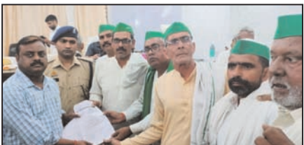
तीन का मौके पर निस्तारण किसानों के अनोखे विरोध से मचा हड़कंध घुटनों के बल तहसील पहुंचे किसान नेता वायरल हुआ प्रशासन पर लगाए अनदेखी के आरोप