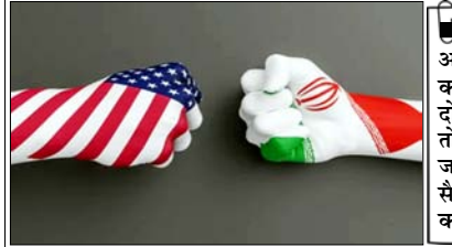
ईरानी सैन्य अधिकारियों ने कहा: यदि युद्ध दोबारा शुरू होता है तो उसका कड़ा जवाब देने के लिए सैन्य तैयारियां तेज कर दी गईं हैं

तेहरान। ईरान के सैन्य मुख्यालय ने चेतावनी जारी की है कि ईरान और अमेरिका के बीच युद्ध फिर से शुरू होने की 'प्रबल आशंका' है। मुख्यालय ने कहा कि उपलब्ध साक्ष्यों से यह स्पष्ट होता है कि अमेरिका किसी भी समझौते या संधि के प्रति प्रतिबद्ध नहीं है।