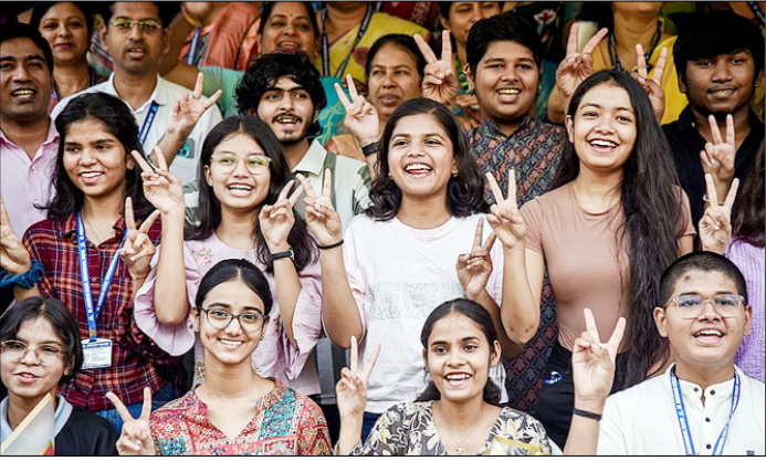
नागपुर। महाराष्ट्र स्टेट बोर्ड एचएससी कक्षा 12 के परिणाम घोषित होने के बाद जश्न मनाते छात्र।