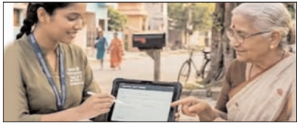
उप: जनगणना 2027: दो चरणों में होगी प्रक्रिया, घर-घर जाकर जुटाया जाएगा डेटा

नई दिल्ली, मुजफ्फरनगर, देहरादून, हल्द्वानी, मुरादाबाद, बरेली, मेरठ व लखनऊ से प्रकाशित