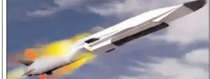
शाह टाइम्स ब्यूरो

'सुपरसोनिक ब्रह्मोस' से दोगुनी होगी रफ्तार