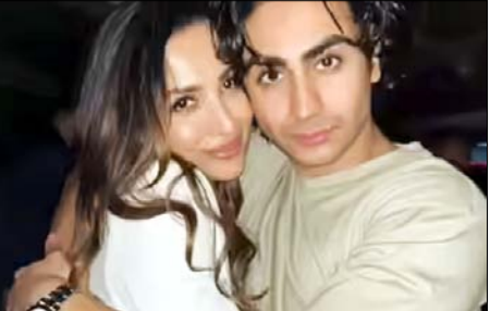
मलाइका ने माना कि बेटे की सोच उनसे अलग है। उन्होंने उसे समझाया कि जिंदगी के हर पफेज का अलग अनुभव होता है और परिवार बनाना भी उसका हिस्सा है। उन्होंने कहा कि रिश्ते बदलते रहते हैं और जिंदगी में कुछ भी स्थायी नहीं होता। इंटरव्यू में मलाइका ने सेल्फ-लव पर भी बात की। उन्होंने कहा कि वह हर दिन खुद से प्यार करने को कहती हैं।

उसने कहा कि एक्यूआई 500-1000 तक पहुंच रहा है, ऐसे माहौल में बच्चों को दुनिया में लाना सही नहीं लगता। मलाइका ने माना कि बेटे की सोच उनके अलग है। उन्होंने उसे समझाया कि जिंदगी के हर फेज का अलग अनुभव होता है और परिवार बनाना भी उसका हिस्सा है। उन्होंने कहा कि रिश्ते बदलते रहते हैं और जिंदगी में कुछ भी स्थायी नहीं होता। इंसान को परिस्थितियों के हिसाब से खुद को ढालना पड़ता है। इंटरव्यू में मलाइका ने सेल्फ-लव पर भी बात की। उन्होंने कहा कि वह हर दिन खुद से प्यार करने को कहती हैं, क्योंकि अगर इंसान खुद को स्वीकार नहीं करेगा, तो जिंदगी खुलकर नहीं जी पाएगा। मलाइका अरोड़ा की शादी 1998 में अरबाज खान से हुई थी। दोनों का 2017 में तलाक हो गया था।