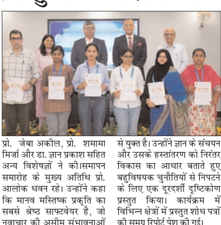
से युक्त है। उन्होंने ज्ञान के संघर्ष और उसके हस्तांतरण को निरंतर विकास का आधार बताते हुए बहुविध चर्चा-विचारों से निपटने के लिए एक दूरदर्शी दृष्टिकोण प्रस्तुत किया। कार्यक्रम में विभिन्न क्षेत्रों में प्रस्तुत शोध पत्रों की समग्र रिपोर्ट पेश की गई।

लखनऊ। यूनिटी पीजी कॉलेज द्वारा स्टूडेंट्स क्लब द्वारा आयोजित दो दिवसीय अंतर्राष्ट्रीय सम्मेलन शासन, नवाचार और समाज उभरती बहुविध चर्चा-विचारों का आज सफल समापन हो गया। यह सम्मेलन कल शुरू हुआ था, जिसमें देश-विदेश के विद्वानों, नीति निर्माताओं और छात्रों ने सक्रिय भागीदारी की। दूसरे दिन आयोजित तकनीकी सत्रों में समाज-संस्कृति और सामाजिक मानव विकास-प्रायोगिकी एवं मानव विज्ञान, नैतिकता, मानव संसाधन तथा समावेशी विकास जैसे महत्वपूर्ण विषयों पर विस्तृत चर्चा हुई। इन सत्रों की अध्यक्षता