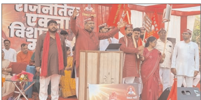
केंद्र सरकार द्वारा प्रधानमंत्री मत्स्य संपदा योजना, प्रधानमंत्री मछुआ दुर्घटना योजना और मत्स्य पालन हेतु किसान क्रेडिट कार्ड जैसी योजनाएं चलाई जा रही हैं: संजय निषाद

शाह टाइम्स ब्यूरो लखनऊ। आज की 67 वर्षों तक कांग्रेस और उनके सहयोगियों की सरकार रही, लेकिन उन्होंने मछुआ समाज के लिए मात्र तीन हजार करोड़ रुपये दिए, जबकि प्रधानमंत्री नरेंद्र मोदी के नेतृत्व में मात्र 11 वर्षों में 27 हजार करोड़ रुपये देकर मछुआ समाज को आत्मनिर्भर बनाने का कार्य किया गया। आज केंद्र सरकार द्वारा प्रधानमंत्री मत्स्य संपदा योजना, प्रधानमंत्री मछुआ दुर्घटना योजना और मत्स्य पालन हेतु किसान क्रेडिट कार्ड जैसी योजनाएं चलाई जा रही हैं, वहीं उत्तर प्रदेश में मुख्यमंत्री योगी आदित्यनाथ के नेतृत्व में, जब मैंने मत्स्य मंत्री के रूप में कार्यभार संभाला तो उस विभाग में कोई योजना नहीं थी। उक्त विचार व्यक्त करते हुए उप्र के मंत्री संजय निषाद ने आज