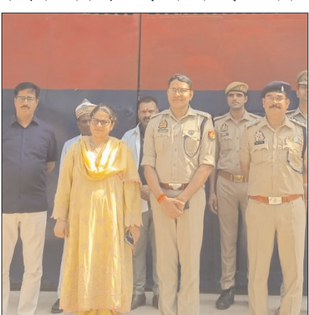
निरीक्षण किया तथा संबंधित को निर्देश दिए कि जेल में जेल मैनुअल के अनुसार कैदियों को सभी सुविधाएं मुहैया कराई जाएं। इसके साथ ही ऐसे कैदी जिनके पास वकील नहीं है उनके लिए सरकारी वकील का भी प्रबंध कराया जाय। जेल में निरुद्ध कैदियों का वरावर मेंडिकल चेकअप कराने के भी निर्देश दिए। निरीक्षण के दौरान जिलाधिकारी ने महिला बन्धियों वार्ता की, उन्होंने कहा कि यदि किसी के पास वकील नहीं है तो बता दी जाय वकील की व्यवस्था करा दी जायेगी। इस दौरान जेल अधीक्षक, डिप्टी जेलर, कारागार डाक्टर सहित अन्य अधिकारीगण उपस्थित रहे।

शाह टाइम्स ब्यूरो गोंडा। डीएम श्रीमती धीरंका निरंजन और एसपी विनीत जायसवाल ने जिला कारागार का संयुक्त रूप से निरीक्षण किया। निरीक्षण के दौरान अधिकारियों ने वहां पर कैदियों से वार्ता की तथा उन्हें जेल में दी जा रही सुविधाओं एवं उनकी समस्याओं के संबंध में जानकारी ली। निरीक्षण के दौरान कारागार अस्पताल में जाकर वहां पर भर्ती कैदियों से मुलाकात किया, साथ ही सभी भर्ती कैदियों से वार्ता कर उनकी समस्याओं के संबंध में जानकारी ली। जिलाधिकारी तथा एसपी ने स्वयं विभिन्न बैरकों, अस्पताल, भोजनालय, भंडार कक्ष, पुस्तकालय आदि का