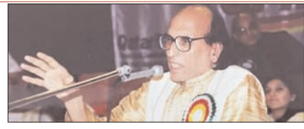
'बहुत तलाश किया, कोई आदमी ना मिला' बहुत याद आएंगे बशीर बद्र सम्पादकीय