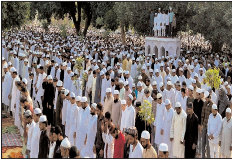
अमरोहा। ईदगाह में ईदुल अजहा की नमाज अदा करते नमाजी।