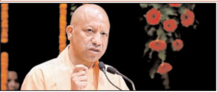
बेटी, व्यापारी को छेड़ने वाले का इंटरजार अब यमराज करते हैं: मुख्यमंत्री योगी पेज 2

shahtimes2015@gmail.com च्येठ शुक्ल पक्ष 13 विक्रमी सम्वत् 2083 12 जिलाहज्जा 1447 हिजरी नई दिल्ली, मुजफ्फरनगर, देहरादून, हल्द्वानी, मुगदाबाद, बरेली, मेरठ व लखनऊ से प्रकाशित