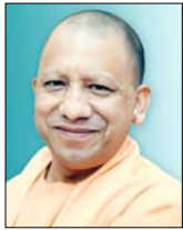
योगी आदित्यनाथ, मुख्यमंत्री, उप्र

वर्तमान सरकार के कार्यकाल में माफिया, गुंडे और बदमाश अपनी औकात में आ गए हैं तथा प्रदेश छोड़कर भाग चुके हैं। अब किसी में इतनी हिम्मत नहीं है कि बेटियों और व्यापारियों की सुरक्षा में संघ लगा सके, यदि कोई अपराधी बेटियों और व्यापारियों की सुरक्षा में संघ लगाने की सोचता भी है, तो उसका इंतजार यमराज करते हैं, पूर्ववर्ती सरकार में नेताओं की स्थिति ऐसी थी कि माफियाओं को देखकर उनके पसीने छूट जाते थे, जबकि आज माफिया प्रदेश से गायब हैं, वर्तमान समय में प्रदेश में रामलीला, श्रीकृष्ण जन्माष्टमी, रक्षाबंधन, होली, दीपावली और दशहरा जैसे सभी पर्व-त्योहार उत्साह और शांति के साथ मनाए जा रहे हैं। अब किसी गुंडे या माफिया में इतनी हिम्मत नहीं है कि वह किसी पर्व या त्योहार में विघ्न डाल सके।