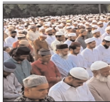
हसनपुर। ईदगाह में ईदुल अजहा की नमाज अदा करते नमाजी।