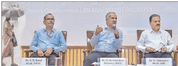
आईएमडी ने दक्षिण-पश्चिम मानसून के लिए अपना दूसरा दीर्घकालिक अनुमान किया जारी

नई दिल्ली। मौसम विज्ञान विभाग (आईएमडी) ने साल 2026 के दक्षिण-पश्चिम मानसून (जून से सितंबर) के लिए अपना दूसरा दीर्घकालिक अनुमान शुरूवार को जारी कर दिया। इसके अनुसार देश के प्रमुख कई हिस्सों में इस साल मानसून की बारिश सामान्य से कम रहने का अनुमान है। देश में बारिश के मुख्य स्रोत दक्षिण-पश्चिम मानसून के लंबी अवधि के औसत (एलपीए) का 90 प्रतिशत होने की संभावना है और इसमें चार फीसदी घट-बढ़ हो सकती है। मौसम विज्ञान विभाग ने यहां एक संवाददाता सम्मेलन में यह जानकारी दी। मौसम विभाग ने