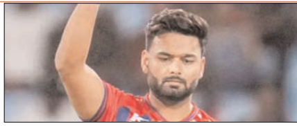
ऋषभ पंत ने लखनऊ सुपर जाइंट्स की कप्तानी छोड़ी खेल टाइम्स