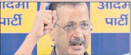
देश को अब एक शिक्षित प्रधानमंत्री की जरूरत: केंजरीवाल पेज 2

shahtimes2015@gmail.com च्येठ शुक्ल पक्ष 14 विक्रमी सम्वत् 2083 13 जिलहज्जा 1447 हिजरी नई दिल्ली, मुजफ्फरनगर, देहरादून, हल्द्वानी, मुगदाबाद, बरेली, मेरठ व लखनऊ से प्रकाशित