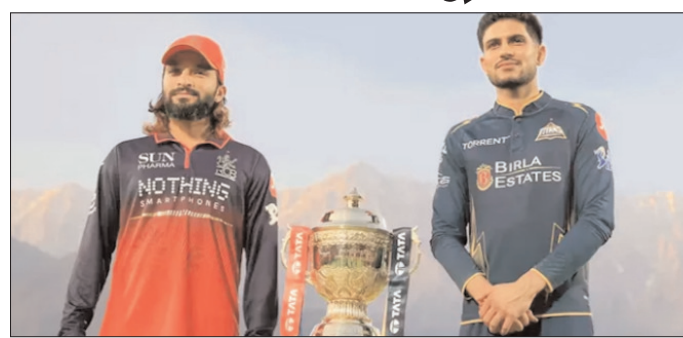
आईपीएल 2026 का फाइनल रॉयल चैलेंजर्स बंगलुरु और गुजरात टाइटंस के बीच आज खेला जाएगा, जीटी अपने किले अहमदाबाद में उतरेगी, जहां उसका जीत प्रतिशत 63 है

प्रमुख बल्लेबाज उनके खिलाफ संघर्ष करते नजर आए हैं। विराट कोहली ने टी 20 क्रिकेट में राशिद के खिलाफ 12 पारियों में 131 रन बनाए हैं, लेकिन तीन बार अपना विकेट भी गंवाया है। देवदत्त पडिक्कल का रिकॉर्ड और भी कमजोर रहा है। उन्होंने आईपीएल में राशिद के सामने नौ पारियों में सिर्फ 40 रन बनाए हैं और पांच बार आउट हुए हैं। टिम डेविड भी 17 टी 20 पारियों में राशिद के खिलाफ 70 रन ही बना सके हैं, जबकि तीन बार आउट हुए हैं। नई गेंद से आरसीबी के लिए भुवनेश्वर कुमार सबसे बड़े हथियार साबित हो सकते हैं। जीटी के दोनों प्रमुख बल्लेबाजों के खिलाफ उनका रिकॉर्ड शानदार रहा है। शुभमन गिल ने आईपीएल में भुवनेश्वर के सामने 14 पारियों में सिर्फ 80 रन बनाए हैं और छह बार अपना विकेट गंवाया है, जबकि उनका स्ट्राइक रेट भी महज 101 का रहा है। वहीं जाँस