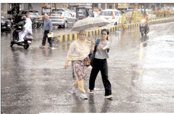
झमाझम बारिश के बीच छाता लेकर सड़क पार करती महिलाएँ।

शाह टाइम्स संवाददाता मेरठ। मेरठ में शनिवार सुबह से ही मौसम ने करवट ली और झमाझम बारिश ने शहर को भिगा दिया। बीते कई दिनों से पड़ रही भीषण गर्मी और लू से परेशान लोगों को इस बारिश ने बड़ी राहत दी है। सुबह करीब 8 बजे से शुरू हुई बारिश दोपहर तक रुक-रुक कर होती रही, जिससे तापमान में 7 डिग्री तक की गिरावट दर्ज की गई। मौसम विभाग के अनुसार आज अधिकतम तापमान 31 डिग्री और न्यूनतम 24 डिग्री सेल्सियस रहा।