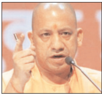
ऊर्जा विभाग से जुड़े तीन महत्वपूर्ण प्रस्ताव भी स्वीकृत