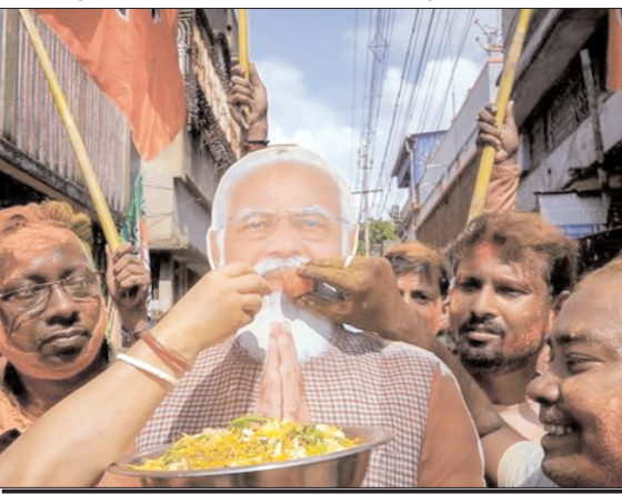
पश्चिम बंगाल में भाजपा की जीत, वर्षों की साधना सिद्ध: मोदी

उधर तमिलनाडु में अभिनेता विजय के करिश्मे के दम पर टीवीके स्पष्ट रूप से सबसे बड़ी पार्टी के रूप में उभरी है। केरल में सत्ता परिवर्तन के संकेतों के बीच एक दशक बाद कांग्रेस के नेतृत्व में संयुक्त लोकतांत्रिक मोर्चा की सरकार बनेगी। असम और पुडुचेरी में राष्ट्रीय जनतांत्रिक गठबंधन सरकार की वापसी निश्चित हो गई है। चुनाव आयोग के रूझानों के आंकड़ों के अनुसार पश्चिम बंगाल में एगजिट पोल के अनुमानों के अनुरूप भाजपा को शुरूआती रूझानों में स्पष्ट बहुमत मिल रही है और वह अकेले दम पर जबरदस्त बहुमत हासिल करने जा रही है। राज्य की 294 विधानसभा सीटों में से 284 के आरंभिक रूझानों में विपक्षी