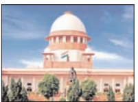
कोर्ट ने छह हफ्ते में जवाब मांगा

नई दिल्ली। सुप्रीम कोर्ट ने ट्रांसजेंडर व्यक्तित्व (अधिकारों का संरक्षण) संशोधन अधिनियम, 2026 को संवैधानिक वैधता को चुनौती देने वाली याचिकाओं पर केंद्र सरकार और सभी राज्यों/केंद्र शासित प्रदेशों को नोटिस जारी किया है। चीफ जस्टिस सूर्यकांत और जस्टिस जॉयमाल्या बागची की बेंच ने इस मामले पर 6 हफ्ते के भीतर जवाब मांगा है। अब इस