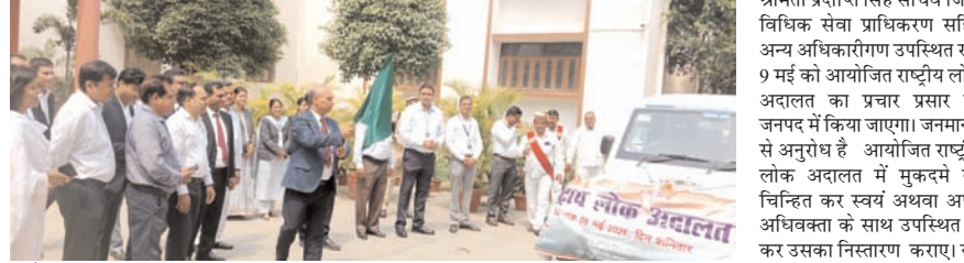
श्रीमती प्रदीपति सिंह सचिव जिला विधिक सेवा प्राधिकरण सहित अन्य अधिकारीगण उपस्थित रहे। 9 मई को आयोजित राष्ट्रीय लोक अदालत का प्रचार प्रसार पूरे जनपद में किया जाएगा। जनमानस से अनुरोध है आयोजित राष्ट्रीय लोक अदालत में मुकदमे को चिन्हित कर स्वयं अथवा अपने अधिवक्ता के साथ उपस्थित हो कर उसका निस्तारण कराए। यह जानकारी सचिव जिला विधिक सेवा प्राधिकरण ने प्रदान की है।

शाह टाइम्स ब्यूरो। जनपद न्यायाधीश, अध्यक्ष जिला विधिक सेवा प्राधिकरण प्रयागराज श्री सत्य प्रकाश त्रिपाठी द्वारा नौ मई 2026 दिन शनिवार को आयोजित होने वाली राष्ट्रीय लोक अदालत की सफलता हेतु जनपद न्यायालय परिसर, प्रयागराज से प्रचार वाहन को हरी झंडी दिखाकर रवाना किया गया। प्रचार वाहन के साथ समस्त बैंकों के प्रबंधकगण व जिला अग्रणी प्रबंधक, बैंक ऑफ बड़ौदा उपस्थित रहे। प्रचार वाहन के साथ पराविधिक स्वयंसेवक ने पूरे शहर में लोक अदालत का प्रचार प्रसार किया। इस मौके पर श्री अभय प्रताप सिंह प्रथम नोडल आफिसर लोक अदालत एडीजे व