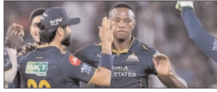
ऑरेंज कैप फिर से अभिषेक के सिर, रबाडा पर्पल कैप की दौड़ में खेल टाइम्स