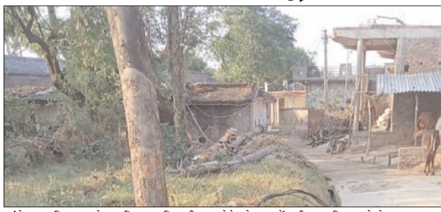
खंभे पर सुरक्षित रूप से व्यवस्थित कर दिया जाए, ताकि बाकी पूरे गांव की विद्युत आपूर्ति तत्काल चालू की जा सके। खंभे का स्थायी मरम्मत कार्य बाद में भी किया जा सकता है। ग्रामीणों के इस मौसम में

शाह टाइम्स ब्यूरो। अमेठी जगदीशपुर। ब्लॉक, जनपद अमेठी के ग्राम व पोस्ट मंगौली में 1 मई को आए आंधी-तूफान के चलते एक बिजली खंभा क्षतिग्रस्त हो गया, जिससे पूरे गांव की विद्युत आपूर्ति बाधित हो गई है। ग्रामीणों के अनुसार, टूटा हुआ खंभा ग्राम सभा के अंतिम घर के पास स्थित है और उसके आगे कोई कनेक्शन नहीं है। ऐसे में पूरे गांव की लाइन बंद होना आवश्यक नहीं है। मौके पर एबीसी ड्राइव वायर जमीन पर पड़ा हुआ दिखाई दे रहा है। ग्रामीणों की मांग है कि टूटे खंभे वाले हिस्से का कनेक्शन अस्थायी रूप से काटकर या उसे पहले वाले बिजली न होने से बच्चों की पढ़ाई, घरेलू कार्य और दैनिक जीवन पर गंभीर प्रभाव पड़ रहा है। ग्रामीणों का कहना है कि बिजली आज आवश्यक जरूरत बन चुकी है, और लंबे समय तक आपूर्ति बाधित रहने से नुकसान बढ़ता जा रहा है। ग्रामीणों ने विद्युत विभाग से शीघ्र निर्णय लेकर आंशिक रूप से ही सही, लेकिन पूरे गांव की बिजली आपूर्ति बहाल करने की अपील की है।