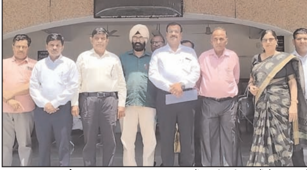
शाह टाइम्स ब्यूरो

कलेक्ट्रेट में जिलाधिकारी को सौंपा ज्ञापन