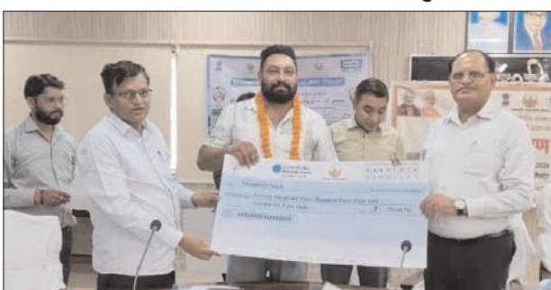
शाह टाइम्स ब्यूरो

फसल बीमा योजना का मिला लाभ, कलेक्ट्रेट में हुआ कार्यक्रम