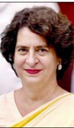
-प्रियंका गांधी वाड़ा कांग्रेस सांसद, वायनाड

केरल की जनता का भरोसा ही यूडीएफ के लिए मार्गदर्शक शक्ति बनेगा और आने वाले पांच वर्षों में इमानदारी एवं विनम्रता के साथ किए गए वादों को पूरा करने का प्रयास किया जाएगा, वायनाड में यूडीएफ को 7 में से 7 सीटों पर मिली जीत जनता के मजबूत विश्वास का प्रतीक है, क्षेत्र के विकास के लिए सभी प्रतिनिधि मिलकर काम करेंगे और जनता की उम्मीदों पर खरा उतरने की पूरी कोशिश करेंगे, यूडीएफ कार्यकर्ताओं और नेताओं के अथक प्रयासों से एकजुट और प्रगतिशील केरल का संदेश हर घर तक पहुंचा है तथा आने वाले वर्षों में जनता की सेवा का संकल्प और मजबूत होगा।