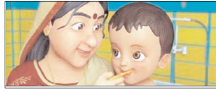
न हाथ में डिग्री फिर भी जिंदगियां देती दाईं मां सम्पादकीय