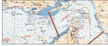
ईरान ने होर्मुज स्ट्रेट का नया नक्शा जारी किया पेज 12