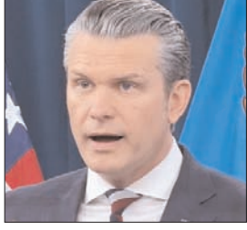
अमेरिकी रक्षा मंत्री हेगसेथ बोले- सीजफायर अभी भी लागू

वाशिंगटन/तेहरान। पश्चिम एशिया में तनाव एक बार फिर बढ़ता दिख रहा है, जहां ईरान और अमेरिका के बीच स्ट्रेट ऑफ होर्मुज को लेकर स्थिति बेहद संवेदनशील बनी हुई है। हालात ऐसे हैं कि सीजफायर की घोषणा के बावजूद दोनों पक्षों की सैन्य गतिविधियां जारी हैं। अमेरिकी रक्षा मंत्री पीट हेगसेथ ने स्पष्ट किया है कि सीजफायर अभी भी लागू है और इसे खत्म नहीं माना जा सकता। उन्होंने कहा कि स्ट्रेट ऑफ होर्मुज में जहाजों की सुरक्षा के लिए चलाया जा रहा अभियान अलग और सीमित प्रकृति का है। उन्होंने यह भी कहा कि यह ऑपरेशन केवल वाणिज्यिक जहाजों की