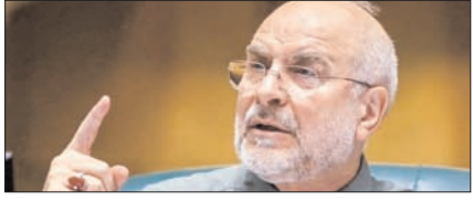
होर्मुज तनाव के बीच अमेरिकी प्रभाव कम हो जाएगा: ग़ालिबफ़