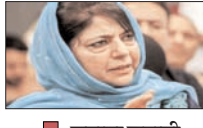
लगाया चुनावी हेराफेरी का आरोप

श्रीनगर, वार्ता जम्मू-कश्मीर की पूर्व मुख्यमंत्री एवं पीपुल्स डेमोक्रेटिक पार्टी की अध्यक्ष महबूबा मुफ्ती ने मंगलवार को चुनाव आयोग पर गंभीर आरोप लगाते हुए कहा कि यह संस्था केंद्रीय एजेंडियां के साथ मिलकर चुनावी प्रक्रिया को कमजोर कर रही है। सुश्री मुफ्ती का यह बयान पश्चिम बंगाल चुनावों में भारतीय जनता पार्टी की बड़ी जीत के एक दिन बाद आया है। उन्होंने इन परिणामों को देश की लोकतांत्रिक संस्थाओं की गिरती स्थिति के प्रति बड़ी चिंता का हिस्सा बताया। पीपीडीए अध्यक्ष ने सोशल मीडिया प्लेटफॉर्म 'एक्स' पर एक पोस्ट में कहा कि टीएन शोषण द्वारा किए गए सुधारों के बाद कभी भारत की मजबूत चुनाव प्रणाली की पूरी दुनिया में प्रशंसा होती थी और आयोग को लोकतंत्र का 'निडर