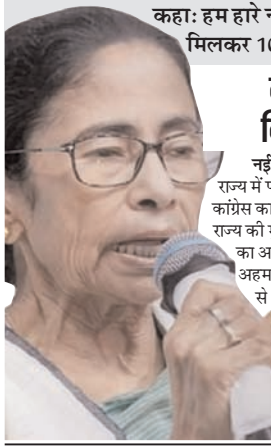
कहा: हम हारे नहीं, हराया गया, चुनाव आयोग विलेन, भाजपा से मिलकर 100 सीटें लूटीं, मैं आजाद पंछी, शेर की तरह लड़ूंगी

कोलकाता, वार्ता पश्चिम बंगाल की मुख्यमंत्री ममता बनर्जी ने मंगलवार को कोलकाता में प्रेस कॉन्फ्रेंस के दौरान कहा कि मैं सीएम पद से इस्तीफा नहीं दूंगी। हम जनता से हैं, साजिश से हारे हैं। इसलिए इस्तीफा देने राजभवन नहीं जाऊंगा। ममता ने आगे कहा कि चुनाव आयोग असली विलेन है। उसने भाजपा के साथ मिलकर 100 सीटें लूटीं। अब मेरे पास कोई इस्तीफा नहीं है, मैं आजाद पंछी हूँ। कहीं से भी चुनाव लड़ सकती हूँ, सड़कों पर लड़ूंगी। ममता ने आरोप लगाया कि भाजपा ने काउंटिंग सेंट्रों पर कब्जा कर लिया था। मेरे साथ बदसलूकी की। उम्मीदवारों और कार्यकर्ताओं के साथ अत्याचार किया। पार्टी और इंडिया गठबंधन के नेता मेरे साथ हैं। हम फिर से उभरेंगे और शेर की तरह लड़ेंगे। पश्चिम बंगाल सहित 5