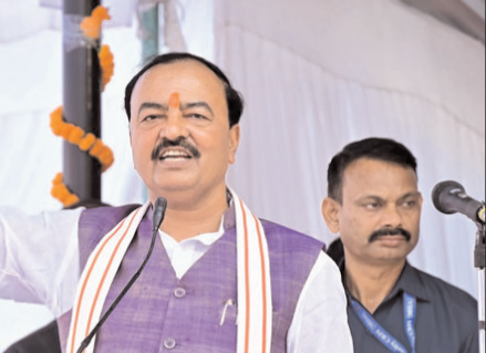
भ्रम को राजनीति के दिन अब समाप्त हो चुके हैं, जो लोग जनमत का अपमान करते हैं, उन्हें इतिहास कभी माफ नहीं करेगा: उपमुख्यमंत्री केशव प्रसाद मौर्य का विरोधियों पर निशाना

शाह टाइम्स ब्यूरो प्रयागराज। भाजपा की विकास और सुरासन की जीत की स्वीकार न करना लोकतंत्र और संविधान का अपमान है। प्रयागराज आगमन पर भाजपाईयों द्वारा पुलिस लाइन में किए गए स्वागत के दौरान पत्रकारों से बातचीत करते हुए उपमुख्यमंत्री केशव प्रसाद मौर्य ने कहा कि जनता ही सर्वोपरि है और उसका आदेश अंतिम होता है। भ्रम को राजनीति के दिन अब समाप्त हो चुके हैं। जो लोग जनमत का अपमान करते हैं, उन्हें इतिहास कभी माफ नहीं करेगा। उन्होंने कांग्रेस नेता राहुल गांधी, सपा अध्यक्ष अखिलेश यादव, तुणमूल कांग्रेस प्रमुख ममता बनर्जी और डीएमके नेता के. स्टालिन जैसे विपक्षी नेताओं की जनविरोधी राजनीति पर कटाक्ष करते हुए कहा कि यह अब अंतिम सांस ले रही है। मौर्य ने