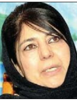
—महबूबा मुफ्ती, अध्यक्ष, पीडीपी

चुनाव आयोग केंद्रीय एजेंसियों के साथ मिलकर चुनावी प्रक्रिया को कमजोर कर रहा है, पश्चिम बंगाल चुनावों के परिणाम देश की लोकतांत्रिक संस्थाओं की गिरती स्थिति के प्रति बड़ी चिंता का हिस्सा है, टीएम शोभन द्वारा किए गए सुधारों के बाद कभी भी भारत की मजबूत चुनाव प्रणाली की पूरी दुनिया में प्रशंसा होती थी और आयोग को लोकतंत्र का निडर रक्षक माना जाता था, आज वही संस्था केंद्रीय एजेंसियों की मदद से चुनावी प्रक्रिया में बाधा डालने के आरोपों के घेरे में है, देश भले ही विश्वगुरु बनने का लक्ष्य हासिल न कर पाया हो, लेकिन चुनावी हेराफेरी की कला में जरूर महारत हासिल कर ली है, पश्चिम बंगाल के हालिया घटनाक्रम इस परेशान करने वाली वास्तविकता का ताजा उदाहरण है।