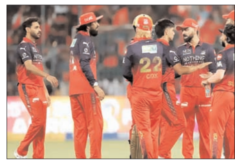
विधायकों को मैच के टिकट देने को लेकर चल रहे विवाद पर बीसीसीआई सख्त

बेंगलुरु, वार्ता। बेंगलुरु के आईपीएल 2026 फाइनल की मेजबानी करने के मौकों पर गंभीर संकट आ गया है। विधायकों को मैच के टिकट देने को लेकर चल रहे राजनीतिक विवाद के बढ़ने के बाद बीसीसीआई अब इस बड़े मैच को किसी दूसरे शहर में शिफ्ट करने के विकल्प पर विचार कर रहा है। सूत्रों ने मंगलवार को यह जानकारी दी। यह विवाद, जो कर्नाटक के विधायकों की एम चिन्नास्वामी स्टेडियम में होने वाले आईपीएल मैचों के लिए मुफ्त वीआईपी टिकटों की मांग के तौर पर शुरू हुआ था, अब एक राजनीतिक रूप से संवेदनशील मुद्दा बन गया है। इस