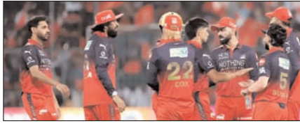
बेंगलुरु में आईपीएल फाइनल की मेजबानी के मौकों पर संकट