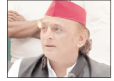
कहा: महिला आरक्षण को उत्तर प्रदेश के 2027 विधानसभा चुनाव में लागू किया जाए

शाह टाइम्स ब्यूरो लखनऊ। समाजवादी पार्टी अध्यक्ष अखिलेश यादव ने महिला आरक्षण को लेकर भाजपा सरकार पर निशाना साधते हुए मंगलवार को कहा कि पीडीए (पिछड़ा, दलित, अल्पसंख्यक) की स्पष्ट मांग है कि संसद में पारित महिला आरक्षण को उत्तर प्रदेश के 2027 विधानसभा चुनाव में लागू करने की तत्काल घोषणा की जाए। यादव ने कहा कि यह विधेयक समस्त विपक्ष के सहयोग से पारित हुआ है, ऐसे में अब भाजपा सरकार को अपनी मंशा स्पष्ट करनी चाहिए। यदि सरकार इस पर घोषणा नहीं करती है, तो उसे यह भी स्पष्ट करना चाहिए कि क्या भाजपा और