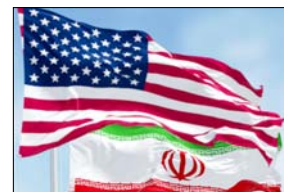
यूएई ने इस हमले की कड़ी निंदा करते हुए इसे तनाव बढ़ाने वाला कदम बताया है।

वाशिंगटन/तेहरान। ईरान और अमेरिका के बीच हुआ युद्धविराम अब होर्मुज जलडमरूमध्य को लेकर खतरे में पड़ता नजर आ रहा है। अमेरिकी राष्ट्रपति डोनाल्ड ट्रम्प की ओर से ईरान के ताजा प्रस्ताव को खारिज करने और होर्मुज से जहाजों के पारगमन में मदद के लिए 'प्रोजेक्ट फ्रीडम' शुरू करने के बाद तनाव चरम पर है।