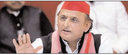
महिला आरक्षण पर भाजपा अपना रुख साफ करे: अखिलेश यादव

नई दिल्ली, मुजफ्फरनगर, देहरादून, हल्द्वानी, मुगदाबाद, बरेली, मेरठ व लखनऊ से प्रकाशित