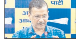
भाजपा ने जनतंत्र को हाइजेक कर लिया है, जनतंत्र की हत्या कर दी है, पूरे देश में कोई भी पार्टी जीत कर आ जाए, इन्हें कोई फर्क नहीं पड़ता

नई दिल्ली, वार्ता आम आदमी पार्टी के राष्ट्रीय संयोजक अरविंद केजरीवाल ने भारतीय जनता पार्टी पर जनतंत्र की हत्या करने का आरोप लगाते हुए कहा कि पूरे देश में कोई भी पार्टी जीत कर आ जाए, इन्हें कोई फर्क नहीं पड़ता है, क्योंकि एजेंडियां लगाकर विधायकों को तोड़कर सरकारें गिरा देते हैं। केजरीवाल ने पंजाब के मुख्यमंत्री भगवंत सिंह मान के साथ दिल्ली आए पार्टी के विधायकों के साथ कपूरथला हाउस में संवाद किया। उन्होंने इस दौरान कहा कि आज पूरे देश में बहुत बंध संकट छाया हुआ है। भाजपा ने जनतंत्र को हाइजेक कर लिया है, जनतंत्र की हत्या कर दी है। पूरे देश में कोई भी पार्टी जीत कर आ जाए, इन्हें कोई फर्क नहीं पड़ता है। इसके बाद ए ईडी-सीबीआई और पीसे से, उस पार्टी के विधायक तोड़ लेते हैं, पार्टीयां तोड़ लेते हैं, जेल भेज देते हैं और सरकारें गिरा देते हैं। जीतने के लिए ये लोग वोट काट देते हैं, अपना वोट जुड़वा देते हैं। सोमवार को पश्चिम बंगाल चुनाव का आया परिणाम कोई चुनाव नहीं था। पिछले 3-4 महीने से हम देख रहे हैं कि पश्चिम बंगाल के अंदर तांडव चल रहा है। इसी तरह इन्होंने बिहार, महाराष्ट्र में भी हत्या कर दी है। इन्होंने कहा कि जब मैं जेल गया, उससे पहले नई दिल्ली विधानसभा में 1 लाख 48 हजार वोट थे। जब मैं लौट कर आया तो 1 लाख 6 हजार वोट बचे थे। इन्होंने करीब 6 महीने के अंदर 42 हजार वोट कटवा दिया। पिछली बार नई दिल्ली विधानसभा सीट से मैं 30 हजार वोट से जीता था। इन्होंने 42 हजार