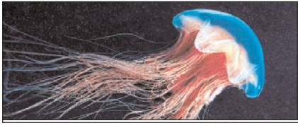
जेलीफिश मनुष्यों के समान सोती है