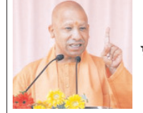
घायलों का त्वरित और समुचित इलाज तथा सभी प्रभावितों को 24 घंटे के भीतर अनुमन्य राहत राशि उपलब्ध कराई जाए: मुख्यमंत्री

शाह टाइम्स ब्यूरो लखनऊ। उत्तर प्रदेश के मुख्यमंत्री योगी आदित्यनाथ ने प्रदेश में आंधी, वर्षा और आक. शीय बिजली से हुई जनहानि को गंभीरता से लेते हुए प्रशासन को अलर्ट मोड पर रखने के निर्देश दिए हैं। मंगलवार को मुख्यमंत्री ने मृतकों के परिजनों के प्रति गहरी संवेदना व्यक्त करते हुए आंधी, शीय बिजली से हुई जनहानि को गंभीरता से लेते हुए प्रशासन को अलर्ट मोड पर रखने के निर्देश दिए हैं। उन्होंने चेतावनी दी कि राहत कार्यों में किसी भी स्तर पर लापरवाही बर्दाश्त नहीं की जाएगी और जिम्मेदार अधिकारियों के खिलाफ कार्रवाई तय होगी। उन्होंने सभी जिलाधिकारियों को निर्देश दिया है कि वे फील्ड में रहकर राहत एवं सहाय कार्यों को लगातार निगरानी करें। साथ ही, प्रभावित क्षेत्रों में आवश्यक संसाधनों की उपलब्धता सुनिश्चित करने के लिए शासन से समन्वय बनाए रखें। प्रशासन ने लोगों से अपील