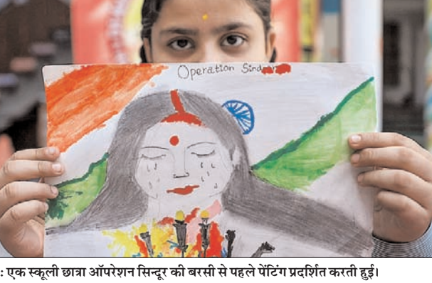
जम्मू: एक स्कूली छात्रा ऑपरेशन सिन्दूर की बरसी से पहले पेंटिंग प्रदर्शित करती हुई।

नई दिल्ली। भाजपा ने मंगलवार को केंद्रीय गृह मंत्री अमित शाह को बंगाल और केंद्रीय स्वास्थ्य एवं परिवार कल्याण मंत्री जगत प्रकाश नड्डा को असम के लिए पर्यवेक्षक बनाया। भाजपा के राष्ट्रीय महासचिव अरुण निंदासह की ओर से मंगलवार को जारी विज्ञापन में श्री शाह पश्चिम बंगाल में पार्टी के विधायक दल के नेता के चुनाव के लिए केंद्रीय पर्यवेक्षक होंगे। वहीं ओडिशा के मुख्यमंत्री मोहन चरण ओडिशा के सीएम मोहन चरण माझी सह पर्यवेक्षक बनाए गए माझी सह पर्यवेक्षक की भूमिका निभाएंगे। श्री निंदासह ने बताया कि श्री नड्डा ओडिशा में पार्टी के विधायक दल के नेता के चुनाव के लिए केंद्रीय पर्यवेक्षक होंगे। वहीं हरियाणा के मुख्यमंत्री नायब निंदासह सैनी सह पर्यवेक्षक की भूमिका निभाएंगे।