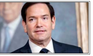
■ रूबियो ने मानवीय अनिवार्यता और वैश्विक समुद्री मार्ग को खुला रखने की रणनीतिक आवश्यकता पर बल दिया

वाशिंगटन। अमेरिकी विदेश मंत्री मार्को रूबियो ने होर्मुज जलडमरूमध्य में अमेरिका के सैन्य अभियान का पुरजोर बचाव किया है। उन्होंने जोर देकर कहा कि यह पूरी तरह से एक रक्षात्मक मिशन है, जिसे ईरान की नाकेबंदी के कारण फारस की खाड़ी में फंसे 87 देशों के लगभग 23000 नागरिकों को बचाने के लिए तैयार किया गया है। रूबियो ने मानवीय अनिवार्यता और वैश्विक समुद्री मार्ग को खुला रखने की रणनीतिक आवश्यकता पर बल दिया। उन्होंने ईरान को कड़ी चेतावनी दी कि अमेरिकी इच्छाशक्ति को परखने की किसी भी कोशिश का निर्णायक जवाब दिया जाएगा। एक ब्रीफिंग के दौरान रूबियो ने कहा कि ये विदेश मंत्री ने बताया कि 'प्रोजेक्ट फ्रीडम' राष्ट्रपति डोनाल्ड ट्रम्प के सीधे