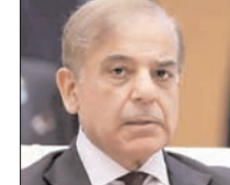
अनुरोध पर ट्रम्प की यह उदार प्रतिक्रिया इस संवेदनशील अवधि के दौरान क्षेत्रीय शांति, स्थिरता और सुलह को आगे बढ़ाने में प्रिंस मोहम्मद बिन सलमान के चाहता था। अब बीच का रास्ता निकालने की कोशिश हो रही है, जिसमें 12 से 15 साल तक की अवधि पर बात चल रही है।

न्यूक्लियर प्रोग्राम रोकने की अवधि को लेकर है। ईरान 5 साल का प्रस्ताव दे चुका है, जबकि अमेरिका 20 साल