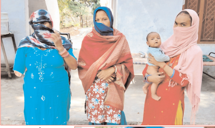
शाह टाइम्स संवाददाता

धार्मिक स्थल पर देर रात हंगामा, पुलिस और महिला पक्ष दोनों के आरोपों की जांच शुरू