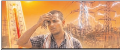
बिजली की मांग अपने सर्वोच्च स्तर पर सम्पादकीय