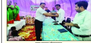
प्राथमिक विद्यालय में शिक्षा चौपाल का हुआ आयोजन। विद्यार्थियों को शिक्षा के प्रति जागरूक किया गया।

विद्यार्थियों को शिक्षा के प्रति जागरूक किया गया