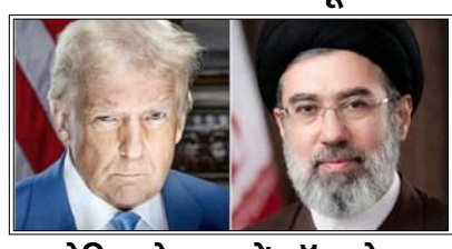
■ 28 फरवरी को ईरान के खिलाफ शुरू किए गए आक्रामक सैन्य अभियान के सभी रणनीतिक लक्ष्य प्राप्त कर लिए गए हैं

वाशिंगटन। अमेरिका ने आधिकारिक तौर पर घोषणा की है कि ईरान के खिलाफ चलाया गया प्रमुख सैन्य अभियान 'ऑपरेशन एपिक प्युरी' अब समाप्त हो गया है। वाइट हाउस में मंगलवार दोपहर 3:30 बजे के आसपास प्रेस ब्रीफिंग के दौरान विदेश मंत्री मार्को रूबियो ने स्पष्ट किया कि अमेरिका ने इस अभियान के अपने सभी सैन्य लक्ष्यों को सफलतापूर्वक प्राप्त कर लिया है। रूबियो ने स्पष्ट किया कि 28 फरवरी को ईरान के खिलाफ शुरू किए गए आक्रामक सैन्य अभियान के सभी रणनीतिक लक्ष्य प्राप्त कर लिए गए हैं।