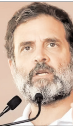
राहुल गांधी नेता विपक्ष, लोकसभा

वोट चोरी से कभी सीटें चुराई जाती हैं, कभी पूरी सरकार, लोकसभा में भाजपा के 240 सांसदों में से लगभग हर छठा सांसद वोट चोरी से जीता है, ऐसे लोगों को क्या भाजपा की भाषा में घुसपैठियाकहा जाना चाहिए, हरियाणा में तो वहां की पूरी सरकार ही 'घुसपैठिया' है, जो संस्थाओं को अपने नियंत्रण में रखते हैं और मतदाता सूचियों व चुनावी प्रक्रिया में हस्तक्षेप करते हैं, वे खुद रिमोट कंट्रोल से संचालित हैं, निष्पक्ष चुनाव होने पर सत्ताधारी दल 140 सीटों के आसपास भी नहीं पहुंच पाएगा।