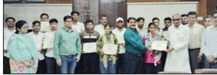
जनता वैदिक कॉलेज में आठ दिवसीय कौशल विकास कार्यक्रम का समापन हुआ।

शाह टाइम्स संवाददाता बड़ौता। जनता वैदिक कॉलेज में आठ दिवसीय कौशल विकास कार्यक्रम का समापन हुआ।