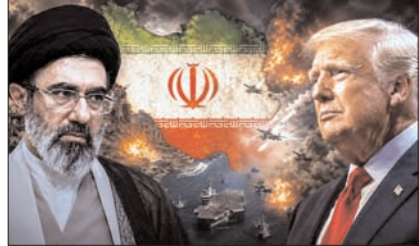
अमेरिका ईरानी प्रॉपर्टी लौटाएगा, ईरान होम्लुज स्ट्रेट खोलेगा, न्यूक्लियर प्रोग्राम रोकेगा

अमेरिका और ईरान युद्ध खत्म करने और परमाणु बातचीत का रास्ता तय करने के बेहद करीब पहुंच गए हैं। अमेरिकी वेबसाइट एक्सप्लॉसिव्स की रिपोर्ट के मुताबिक ईरान 48 घंटे के भीतर सीजफायर को लेकर सहमत दे सकता है। दोनों देशों के बीच 14 प्वाइंट वाला समझौता (एमओयू) तैयार है। हालांकि अभी यह फाइनल नहीं हुआ है, लेकिन बातचीत पहले से ज्यादा आगे बढ़ चुकी है। समझौते की अहम शर्तें, सबसे पहले युद्ध खत्म करने की घोषणा होगी, 30 दिनों तक दोनों देशों की विस्तृत बातचीत होगी, इसमें