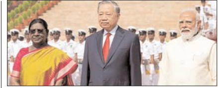
भारत-वियतनाम रणनीतिक साझेदारी होगी प्रगाढ़