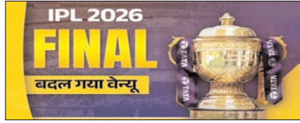
बेंगलुरु की जगह अहमदाबाद में होगा आईपीएल 2026 का फाइनल