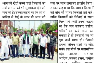
किसानों को बिजली मुक्त करने के लिए उन्होंने उद्योग एग्री क्राफ्टि उनको तीन सौ यूनिट बिजली मुक्त भी जाए।

केंद्रीय नगर में भाकिन्ड अंश, वता की मासिक बैठक हुई। जिसके किसानों को विभिन्न समस्याओं को दूर करने में मदद मिलेगी। किसानों को बिजली मुक्त करने के लिए उन्होंने उद्योग एग्री क्राफ्टि उनको तीन सौ यूनिट बिजली मुक्त भी जाए।