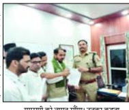
एएसपी को सौंपा ज्ञापन। सोशल मीडिया पर आपत्तिजनक पोस्ट करने वाले पर कार्रवाई हो। एआईएमआईएम के पदाधिकारियों ने एएसपी को सौंपा ज्ञापन।

शाह टाइम्स संवाददाता रामपुर। सोशल मीडिया पर आपत्तिजनक पोस्ट करने वाले पर कार्रवाई हो। एआईएमआईएम के पदाधिकारियों ने एएसपी को सौंपा ज्ञापन।