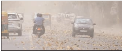
उत्तरी-पश्चिमी भारत में आंधी-तूफान के साथ बारिश की चेतावनी

नई दिल्ली, मुजफ्फरनगर, देहरादून, हल्द्वानी, मुगदाबाद, बरेली, मेरठ व लखनऊ से प्रकाशित