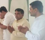
राष्ट्रीय लोकदल कार्यालय पर मनाई चौधरी अजित सिंह की पुण्यतिथि।

शाह टाइम्स संवाददाता बड़ौता। नगर में चौधरी अजित सिंह की पुण्यतिथि मनाई।