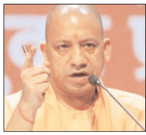
सफल संचालन के लिए 5.47 लाख कर्मचारियों की तैनाती

लखनऊ। उत्तर प्रदेश के मुख्यमंत्री योगी आदित्यनाथ ने गुरुवार को जनगणना-2027 के प्रथम चरण का औपचारिक शुभारंभ करते हुए कहा कि जनगणना केवल जनसंख्या की गणना नहीं, बल्कि समग्र, समावेशी और सुनियोजित विकास का मजबूत आधार है। मुख्यमंत्री आवास पर आयोजित कार्यक्रम में उन्होंने 'हमारी जनगणना-हमारा विकास' के संकल्प के साथ मकान सूचीकरण एवं मकानों की गणना कार्य को शुरुआत की। उन्होंने कहा कि आज का दौर डेटा आधारित निर्णयों का है और