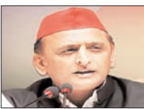
कोलकाता पहुंचकर सपा मुखिया ने ममता से की मुलाकात

बंगाल विधानसभा चुनाव में तुणमूल कांग्रेस की करारी हार के बाद समाजवादी पार्टी के प्रमुख अखिलेश यादव ने गुरुवार को कोलकाता पहुंचकर निवर्तमान मुख्यमंत्री ममता बनर्जी से मुलाकात की और कहा कि दीदी आप हारी नहीं हैं। बीजेपी और चुनाव आयोग ने लोकतंत्र को लूटा है। ममता के कालीघाट आवास पर हुई इस मुलाकात में अखिलेश ने कहा कि दीदी आप हारी नहीं हैं। उन्होंने ममता को उपहार भी भेंट किए। अखिलेश ने इस दौरान ममता के सांसद भतीजे व तुणमूल कांग्रेस के राष्ट्रीय महासचिव अभिषेक बनर्जी को गले लगाया। अखिलेश यादव ने पश्चिम बंगाल विधानसभा चुनावों में मिली करारी हार के बाद