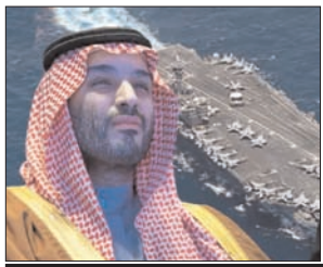
की इजाजत देने से इन्कार कर दिया। अमेरिकी अधिकारियों के हवाले से रिपोर्ट में कहा गया है कि टम्प ने अचानक सोशल

हालांकि अब यह दावा किया जा रहा है कि सऊदी अरब की वजह से अमेरिका को यह कदम उठाना पड़ा। सऊदी अरब ने इस मिशन में शामिल अमेरिकी विमानों को अपने एयरस्पेस और एयरबेस के इस्तेमाल