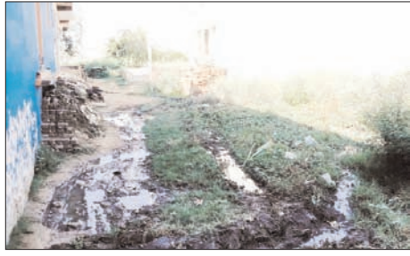
कहना है कि ग्राम पंचायत का कार्यकाल पांच वर्ष पूरा होने को है, लेकिन इस दौरान ग्राम प्रधान ने एक बार भी मोहल्ले में आकर हालात का जायजा नहीं लिया। लोगों में इस बात को लेकर काफी रोष है कि शहर के नजदीक होने के बावजूद उन्हें बुनियादी सुविधाएँ तक नसीब नहीं हो रही हैं। मोहल्ले की गलियों में न तो पक्की सड़क है और न ही समुद्र।

शाह टाइम्स संवाददाता चन्दीसौ। विकासखंड बनियाखेड़ा की ग्राम पंचायत मौलागढ़ के प्रेमनगर मोहल्ले में मूलभूत सुविधाओं का अभाव साफ तौर पर देखा जा सकता है। शहर से सटा होने के बावजूद यहां के हालात बेहद खराब हैं। गलियों में कीचड़, जलभराव और गंदगी का आलम ऐसा है कि लोगों का घर से निकलना तक दुश्पर हो गया है। मोहल्ले की कई गलियों में पानी की निकासी की कोई व्यवस्था नहीं है, जिसके चलते गंदा पानी सड़कों पर जमा रहता है। जगह-जगह बने गड्ढों में भरा पानी और कीचड़ राहगीरों के लिए बड़ी समस्या बना हुआ है। बरसात के समय हालात और भी बदतर हो जाते हैं। लोगों को मजबूरी में इसी गंदे पानी से होकर गुजरना पड़ता है, जिससे बीमारियों का खतरा भी बढ़ रहा है। स्थानीय निवासियों का