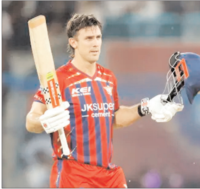
LSG के मिचेल मार्श बेंगलुरु के खिलाफ अपने आईपीएल करियर का दूसरा शतक लगाने के बाद दर्शकों का अभिवादन स्वीकार करते हुए।