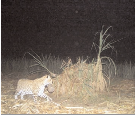
बच्चों को लेने के लिए नहीं पहुंची। मगर बीती रात मादा तेंदुआ उसे स्थान पर पहुंची जहां उनके शावक थे। लिहाजा एक-एक शावक को उठाकर मादा तेंदुआ अन्य स्थान पर ले