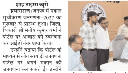
दर्ज कर सकेंगे। जनगणना के पहले चरण को दो मुख्य हिस्सों में बांटा गया है। 7 मई से 21 मई तक नागरिक स्वयं पोर्टल पर अपनी जानकारी भर सकते हैं। इसके बाद, 22 मई से 20 जून तक गणनाकर्मी घर-घर जाकर डेटा