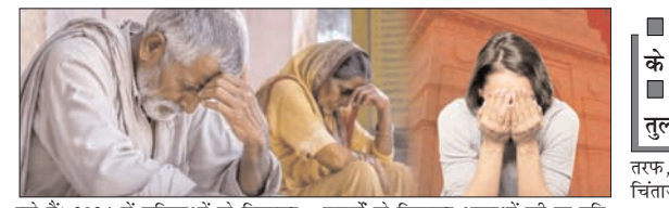
बुजुर्गों के खिलाफ अपराधों की दर प्रति लाख आबादी पर 110 मामले दर्ज, जो केंद्र शासित प्रदेशों में सबसे ज्यादा दरों में से एक रही। मध्य प्रदेश सबसे ऊपर रहा, जहां 2024 में 5,875 मामले दर्ज किए गए, यह संख्या 1,267 अपराध दर्ज किए गए। दिल्ली में

शाह टाइम्स ब्यूरो नई दिल्ली। नेशनल क्राइम रिकॉर्ड ब्यूरो (एनसीआरबी) ने साल 2024 में देश में हुए क्राइम की रिपोर्ट जारी की है। इसके मुताबिक राजधानी दिल्ली में महिलाओं और बुजुर्गों की सुरक्षा को लेकर फिर गंभीर सवाल खड़े हुए हैं। रिपोर्ट बताती है कि 2024 में मेट्रो शहरों में दिल्ली महिलाओं के खिलाफ होने वाले अपराधों के मामले में शीर्ष पर रही है। 2024 में महिलाओं के खिलाफ 13,396 मामले दर्ज किए गए, जो 2023 में 13,366 थे। तमिलनाडु में महिलाओं के खिलाफ अपराध