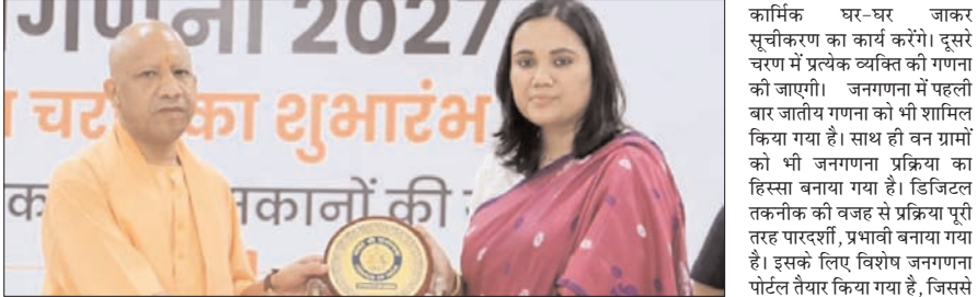
मुख्यमंत्री आवास पर आयोजित कार्यक्रम में योगी ने 'हमारी जनगणना, हमारा विकास' के संकल्प के साथ मकान सूचीकरण व मकानों की गणना कार्य की शुरुआत की

शाह टाइम्स ब्यूरो लखनऊ। मुख्यमंत्री योगी आदित्यनाथ ने गुरुवार को जनगणना-2027 के प्रथम चरण का शुभारंभ किया। मुख्यमंत्री आवास पर आयोजित कार्यक्रम में उन्होंने 'हमारी जनगणना, हमारा विकास' के संकल्प के साथ मकान सूचीकरण व मकानों की गणना कार्य की शुरुआत की। इस मौके पर मुख्यमंत्री ने कहा कि जनगणना केवल हेड काउंट नहीं, बल्कि समग्र, समावेशी और सुनियोजित विकास का मजबूत आधार है। मुख्यमंत्री योगी आदित्यनाथ ने कहा कि इस बार की जनगणना में जातीय गणना भी की जा रही है। वहीं, डिजिटल तकनीक की वजह से प्रक्रिया पूरी तरह पारदर्शी, प्रभावी बनाया गया है। मुख्यमंत्री ने कहा कि आज का समय डेटा आधारित