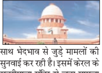
साथ भेदभाव से जुड़े मामलों की सुनवाई कर रही है। इसमें केरल के सवेरीमाला मंदिर से जुड़ा मामला और दाऊदी बोहरा समुदाय का केस भी शामिल है। सुप्रीम कोर्ट ने बुधवार को दाऊदी बोहरा समुदाय से जुड़ी 40 साल पुरानी जनहित याचिका की वैधता पर सवाल उठाया है।

नई दिल्ली। सुप्रीम कोर्ट ने गुरुवार को कहा कि अगर लोग धार्मिक प्रथाओं और धर्म के मामलों को अदालत में चुनौती देने लगे, तो इससे धर्म और समाज पर असर पड़ सकता है। कोर्ट ने कहा कि इससे सैकड़ों याचिकाएं आएंगी और हर रिवाज पर सवाल उठने लगेगा। यह डिप्टी नौ जजों की संविधान पीठ ने की, जो अलग-अलग धर्मों में धार्मिक आजादी के दायरे और महिलाओं के