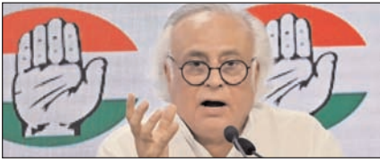
ऑपरेशन सिंदूर: कांग्रेस ने सरकार की नीतियों की आलोचना की

नई दिल्ली, मुजफ्फरनगर, देहरादून, हल्द्वानी, मुगदाबाद, बरेली, मेरठ व लखनऊ से प्रकाशित