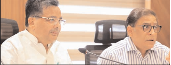
पर्यटन एवं संस्कृति मंत्री जयवीर सिंह ने कुन्दरकी विधानसभा क्षेत्र में कार्य शुरू न किए जाने पर जताई आपत्ति, सभी कार्य 20 नवम्बर तक पूरे करने के लिए निर्देश

कि गुमराह करने की आदत छोड़ें तथा अपनी जिम्मेदारी को निष्ठापूर्वक निभाते हुए गुणवत्ता एवं समयबद्धता के साथ कार्य पूरा करें। उन्होंने कहा कि आगामी चुनाव को देखते हुए निर्माणाधीन परियोजनाओं को 20 नवम्बर, 2026 तक पूरा करते हुए लोकार्पण के लिए तैयार करें, ताकि समय से इन परियोजनाओं को आम जनता को समर्पित किया जा सके। उन्होंने यह भी कहा कि नवम्बर तक परिणाम धरातल पर दिखना चाहिए। जयवीर सिंह ने समीक्षा के दौरान कुछ जनपदों से निर्माण कार्य संबंधी प्रगति की गलत जानकारी देने पर गहरी नाराजगी जाहिर की। उन्होंने कहा कि काम में तेजी लाई जाए और समय-समय पर मुख्यालय से