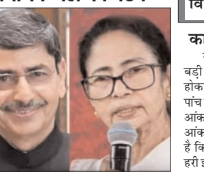
तमिलनाडु के राज्यपाल ने विजय को दूसरी बार राजभवन से वापस भेजा, 118 विधायक लाओ, तभी होगी शपथ