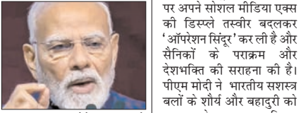
जवाब दिया, जिन्होंने पहलगाम में निर्दोष भारतीयों पर हमला करने का दुस्साहस किया था। पूरा राष्ट्र हमारे बलों के शौर्य और बहादुरी को सलाम करता है। ऑपरेशन सिंदूर ने आतंकवाद के खिलाफ भारत की दृढ़ प्रतिक्रिया और राष्ट्रीय सुरक्षा को रक्षा के प्रति अटूट प्रतिबद्धता को दर्शाया।

नई दिल्ली। पीएम मोदी ने कहा है कि ऑपरेशन सिंदूर आतंकवाद के खिलाफ भारत की दृढ़ प्रतिक्रिया और राष्ट्रीय सुरक्षा के प्रति अटूट प्रतिबद्धता को दिखाता है। पीएम मोदी ने ऑपरेशन सिंदूर को पहली वर्षगांठ पर गुरुवार को सोशल मीडिया पर एक पोस्ट में कहा कि पूरा राष्ट्र हमारे बलों के शौर्य और बहादुरी को सलाम करता है। एक वर्ष पहले हमारे सशस्त्र बलों ने ऑपरेशन सिंदूर के दौरान अद्वितीय साहस, सटीकता और दृढ़ संकल्प का प्रदर्शन किया था। उन्होंने उन लोगों को करार