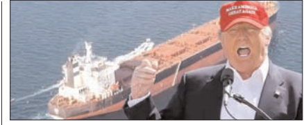
टम्प को झटका, होर्मुज में फंसे 1600 जहाज, शिपिंग कंपनियों को हो रहा नुकसान