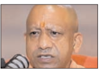
कहा : उग्र सरकार बिना भेदभाव के कर रही काम

तसलीम कुरेशी देवबन्द। मुख्यमंत्री योगी आदित्यनाथ ने कहा कि उत्तर प्रदेश अब बीमार राज्य नहीं बल्कि देश की अर्थव्यवस्था का ग्रोथ इंजन बन चुका है। सरकार बिना भेदभाव के हर वर्ग तक विकास पहुंचाने का काम कर रही है। योगी आदित्यनाथ हाईवे स्थित सिल्वर पैराडाइज के निकट जनपद सहारनपुर को 2131 करोड़ रुपये की सीमागत देते हुए 325 परियोजनाओं का लोकार्पण व शिलान्यास करने के साथ ही विभिन्न योजनाओं के लाभार्थियों को चेक व निष्पत्ति पत्र वितरित करने के उपायों विशाल जनसभा को सम्बोधित कर रहे थे। उन्होंने कहा कि जनपद सहारनपुर अब विकास रोजगार और औद्योगिक प्रगति का नया केंद्र बनने जा रहा है। यहां इंडस्ट्रियल लॉजिस्टिक हब विकसित किया जाएगा, ताकि युवाओं को रोजगार मिले और दिल्ली-देहरादून एक्सप्रेस वे, एयरपोर्ट, बेहतर कनेक्टिविटी एवं प्रस्तावित एलिवेटेड हाईवे से जनपद तस्वीर बदल जाए।