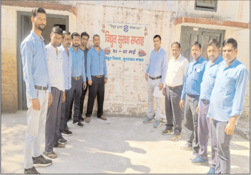
सावधानियों के बारे में विस्तार से जानकारी दी। कर्मचारियों को बताया गया कि विद्युत कार्य के