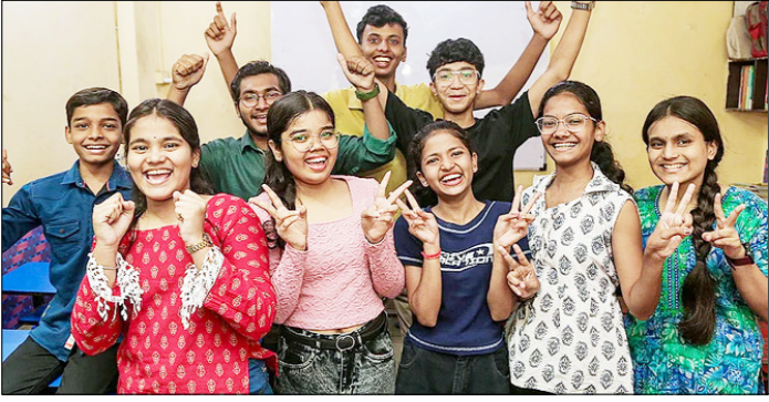
ठाणे। महाराष्ट्र राज्य माध्यमिक और उच्च माध्यमिक शिक्षा बोर्ड (एमएसबीएसएचएसई) की कक्षा 10 के परिणाम घोषित होने के बाद जश्न मनाते छात्र व छात्राएँ।