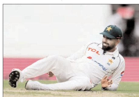
बाबर गुरुवार को अपने बाएं घुटने का स्कैन करवाने के लिए ट्रेनिंग छोड़कर चले गए थे, और बाद में पाकिस्तान क्रिकेट बोर्ड (पीसीबी) ने इसकी पुष्टि की। बोर्ड ने बताया कि यह दाएं हाथ का बल्लेबाज बांग्लादेश के खिलाफ आईसीसी वर्ल्ड टेस्ट चैपियनशिप सीरीज का पहला टेस्ट नहीं खेल पाएगा। पीसीबी ने एक बयान में कहा कि पाकिस्तान

मीरपुर, वार्ता। पाकिस्तान को एक बड़ा झटका लगा है, क्योंकि खबर आई है कि टीम के मुख्य बल्लेबाज बाबर आजम घुटने की चोट के कारण बांग्लादेश के खिलाफ यहां होने वाला पहला टेस्ट मैच नहीं खेल पाएंगे।