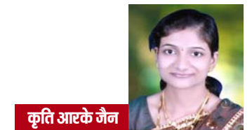
कृति आरके जैन

भी संवेदनाओं को झकझोर देती है, जब एक मां ने अपने नवजात को ठंड से बचाने के लिए स्वयं को समर्पित कर दिया। बर्फ से जमे पुल के नीचे जन्मे उस शिशु को जीवित रखने के लिए उसने अपने शरीर की आखिरी गर्मी तक उसे ओढ़ा दी। वर्षों बाद जब उस बेटे को यह सच्चाई पता चली, तो उसकी पीड़ा हर संवे. दनशील मन में गूंज उठी। यह कोई कथा नहीं, मातृत्व का वह कठोर सच है, जहां मां खुद मिटकर भी जीवन बचा लेती है। इसलिए मां की कोई तुलना संभव नहीं कू वह हर उपमा से परे है। जब बाहरी जगमगाहट बढ़ती है और भीतर की गर्माहट कम होने लगती है, तब मां का मौन संघर्ष और गहरा हो जाता है। वह घर की सीमाओं से परे, समय और समाज के हर दबाव से लड़ते हुए बच्चों का भविष्य गढ़ती है। कभी अपने सपनों और करियर को पीछे रखकर, तो कभी बीमारी में भी मुस्कान के साथ वह हर जिम्मेदारी निभाती है। कठिन परिस्थितियों में भी बच्चों की सुरक्षा उसका अडिग संकल्प रहता है। वर्षों की मेहनत से उन्हें सफलता दिलाता और अपनी पीड़ा छुपाकर उनके सपने पूरे करानाक्यूही मां की पहचान है। वह सच में ऐसी योद्धा है, जो बिना हथियार हर लड़ाई जीत लेती है। जब भावनाएं बाजार की चमक में मिमटती हैं, तब मातृ-दिवस का अर्थ धुंधला पड़ जाता है। समय के