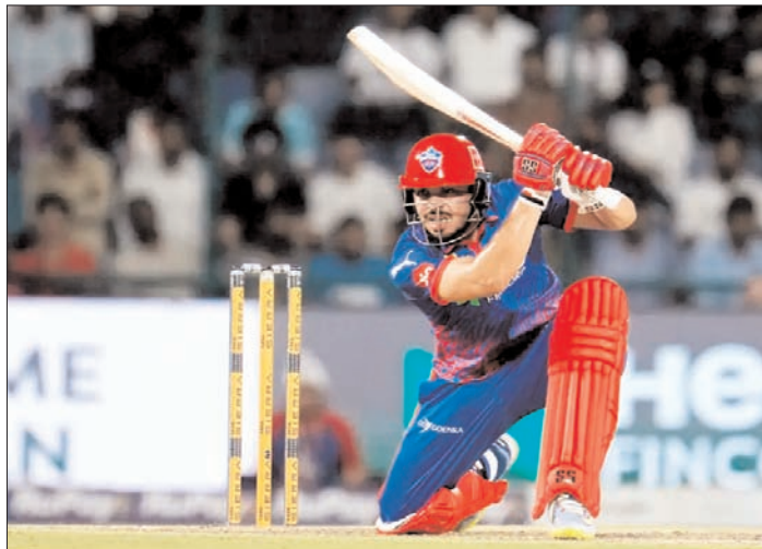
नई दिल्ली, वार्ता। दिल्ली कैपिटल्स ने आईपीएल में शुक्रवार को कोलकाता नाइट राइडर्स के खिलाफ 143 रन का टारगेट सेट किया है। अरुण जेटली स्ट्रेडियम में कोलकाता ने टॉस जीतकर गेंदबाजी चुनी। दिल्ली ने 20 ओवर में 8 विकेट पर 142 रन बनाए। जवाब में कोलकाता ने 2 ओवर में बिना नुकसान के 17 रन बना लिया है। कप्तान अजिंक्य रहाणे और फिन एलन क्रीज पर हैं। ओपनर पाथुम निसांका ने 29 बाल पर 50 रन की पारी खेली। जबकि आशुतोष शर्मा ने 39 रन का योगदान दिया। केएल राहुल ने 23 रन बनाए। कोलकाता की ओर से अनुकूल राय और कार्तिक त्यागी ने 2-2 विकेट झटकें। वैभव अरोड़ा, बैट रनआउट हुआ। कोलकाता की पारी के पहले ओवर से 6 रन आए। फिन एलन ने मिचेल स्टार्क के हाथों 5वां बाल पर स्टूट में चौका

6 ओवर में KKR ने दो विकेट खोकर बनाए 43 रन