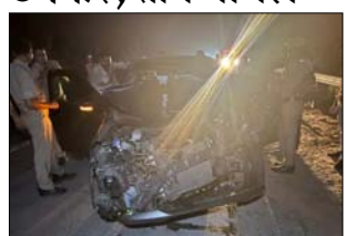
मौके पर पहुंचकर यातायात को रोकना करण। पुलिस ने घायलों के परिवारों को घटना की जानकारी दे दी है। मामले के

eHija यमुना एक्सप्रेस वे पर कार को एक ट्रक ने टक्कर मार दी। हादसे में कार सवार तीन लोग घायल हो गये। तीनों की कार सवार एक ही परिवार के हैं। ये लोग कार से आगरा से मोरघड़ा जा रहे थे। नीहडौली क्षेत्र में देर रात करीब एक बजे कार के साथ सड़क हादसा हो गया। यह दुर्घटना माइलस्टोन 61 के पास हुई। पुलिस ने क्रेन की मदद से क्षतिग्रस्त वाहन को हटाकर बाचना कच कचो की बाई में भेज दिया है।