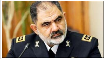
ईरानी बल किसी भी संभावित विस्तार के लिए पूरी तरह तैयार हैं लगभग 6.9 करोड़ बैरल कच्चा तेल ले जा रहे 41 तेल टैंकर अभी भी बाजारों तक पहुंचने में असमर्थ हैं

तेहरान। पश्चिम एशिया में बढ़ते तनाव के बीच ईरान के वरिष्ठ नौसैनिक कमांडर शाहराम ईरानी ने अमेरिका को कड़ी चेतावनी देते हुए कहा है कि यदि अमेरिकी सैन्य गतिविधियां और आगे बढ़ीं तो तेहरान 'त्वरित कार्रवाई' करेगा। ईरानी सरकारी मीडिया और क्षेत्रीय रिपोर्टों के अनुसार यह बयान ऐसे समय में आया है जब होर्मुज जलडमरूमध्य को लेकर सैन्य और आर्थिक टकराव लगातार गहरा रहा है। कमांडर ईरानी ने अमेरिकी त्वरित सैन्य सफलता को धारणाओं को खारिज करते हुए कहा कि ईरान के खिलाफ कुछ दिनों में युद्ध समाप्त करने की सोच अब 'सैन्य हलकों में उपहास' का विषय बन चुकी है। उन्होंने कहा कि ईरानी बल किसी भी संभावित विस्तार के लिए पूरी तरह तैयार हैं। रिपोर्टों के अनुसार ईरानी पक्ष ने संकेत दिया है कि अब तक संयम बनाए रखने का उद्देश्य कूटनीति के लिए अवसर खुला रखना था, लेकिन यदि अमेरिकी नाकेबंदी और दबाव जारी रहता है तो प्रतिक्रिया अधिक कठोर हो सकती है। दूसरी ओर, अमेरिकी केंद्रीय कमान ने दावा किया है कि उसकी समुद्री नाकेबंदी रणनीति प्रभावी रही है। अमेरिकी सैन्य अधिकारियों के अनुसार कई वाणिज्यिक जहाजों को रोका या उसका रास्ता बदला गया है और ईरानी तेल निर्यात पर महत्वपूर्ण आर्थिक दबाव डाला गया है। केंद्रीय कमान के कमांडर ब्रेड