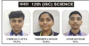
कक्षा 12th (ISC) SCIENCE विद्यार्थियों का ग्रुप फोटो।