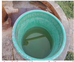
दूषित पानी से निजात पाने के लिए यूं तो सरकार की तरफ से गांव-गांव पानी की टंकी लगाने का काम भी

शाह टाइम्स संवाददाता गढ़मुक्तेश्वर। तहसील के ऐसे कई गांव हैं, जहां का पानी बहुत बुरा है। गांव में दूषित है और इस दूषित पानी के चलते कैंसर, काला पीलिया हेपेटाइटिस जैसी घातक बीमारियों ने अपनी बूढ़ी पकड़ बना रखी है। अनुपहार गंग नहर शाखा के कारण इसे दूषित पानी से युक्त फूलझार डैम होकर गुजर रहा है, जो सिंधुवाली से होकर बहने स्कूल स्थाना होकर पूरे गांव में पहुंचता है। इस फूलझार डैम के निकट से रूहली, बलौली, बालापुर, बिहारवा, चण्डी बिलवापुर, रजा, पार, बहारागढ़ संतल और अंधेक गांव हैं, जो इस दूषित पानी के कारण अंधेक बीमारियों की गिरफ्त में हैं, और हर वर्ष अनेकानेक लोगों कैंसर से होती खली आ रही हैं, इस