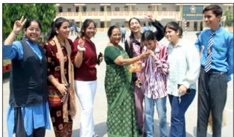
रिजल्ट आने के बाद सेंट थॉमस स्कूल में छात्र-छात्राओं को मिठाई खिलाती प्रधानाचार्या।