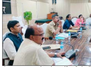
संपन कराया जाए। जनपद के 9 सेंटर व स्टेटिक मॉडलस्टैंड, केंद्र परीक्षा केंद्रों पर कुल 4125 व्यवस्थापक और अन्य संबंधित अधिकारियों को निर्देश पुरितका

बैठक में अधिकारियों को स्पष्ट निर्देश दिए गए कि परीक्षा को हर हाल में नकलविहीन, निष्पक्ष और पारदर्शी तरीके से