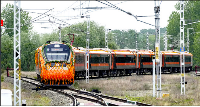
जम्मू-कश्मीर। वंदे भारत एक्सप्रेस ट्रेन को हरी झंडी दिखाकर रवाना किए जाने के समारोह के दौरान रेलवे ट्रैक पर दौड़ती हुई।