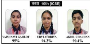
कक्षा 10th (ICSE) विद्यार्थियों का ग्रुप फोटो।

शाह टाइम्स संवाददाता मेरठ। केंद्रखेड़ा स्थित सेंट जेम्स सैनियर सेकेंडरी स्कूल का आईसीएसई (10वीं) व आईएससी (12वीं) बॉर्ड परीक्षा 2025-26 का परिणाम शत-प्रतिशत रहा। स्कूल के सभी विद्यार्थियों ने सफलतापूर्वक परीक्षाएं देकर विद्यालय का नाम रोशन किया। परिणाम घोषित होते ही विद्यालय में खुशी का माहौल रहा।