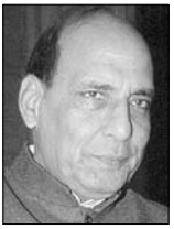
राजनाथ सिंह, रक्षा मंत्री

ऑपरेशन सिंदूर ने दुनिया को स्पष्ट संदेश दिया है कि भारत अपने भूभाग पर आतंकवादी हमलों के बाद अब केवल कूटनीतिक बयान जारी करने की पुरानी मानसिकता तक सीमित नहीं है, बल्कि आगे बढ़कर निर्णायक कार्रवाई के लिए प्रतिबद्ध है, सरकार ने स्पष्ट रुख अपनाया है कि किसी भी परिस्थिति में आतंकवाद का कोई भी कृत्य सहन नहीं किया जाएगा, आतंकवाद एक विकृत और विक्षिप्त मानसिकता से उत्पन्न होता है, यह मानवता पर एक काला धब्बा है, आतंकवाद के खिलाफ लड़ाई केवल राष्ट्रीय सुरक्षा का मामला नहीं है, यह मूल रूप से मानवता के मूल्यों की रक्षा की लड़ाई है, यह एक बर्बर विचारधारा के खिलाफ संघर्ष है जो हर मानवीय मूल्य के सीधे विरोध में खड़ी है, हमने इस भारतीय दृष्टिकोण को देश के भीतर और विदेशों में स्पष्ट रूप से प्रस्तुत किया है।