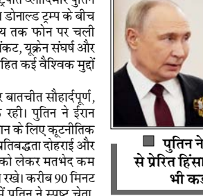
पुतिन ने राजनीतिक रूप से प्रेरित हिंसा के सभी रूपों की भी कड़ी निंदा की

ईरान संकट, यूक्रेन युद्ध और द्विपक्षीय संबंधों पर दोनों नेताओं ने की विस्तृत चर्चा