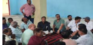
पिचनानवें हजार छठे सौ पचास हजार रूपए की आय हुई। जिसमें पांच लाख चालिस हजार दो सौ रूपए का खर्चा हुआ। इस प्रकार समिति को इस वर्ष पचपन हजार चार सौ पचास रूपए की बचत हुई है। बैठक में मौजूद लोगों ने इस वर्ष जन्मोत्सव समिति द्वारा भव्य कार्यक्रम