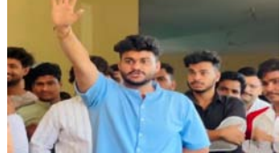
अन्य पौहान के नेतृत्व में राजपुत्र समाज के हजाराों लोग मई महौल धरान पर पहुंच गए। जहां उन्होंने धरान डेना शुरू कर दिया। इस दौरान उन्होंने बताया कि भड़काऊ पोस्ट ने नरसी युवक के समाज के प्रति सोशल मीडिया पर अप्रद टिप्पणी

मेरठ थाना शाह टाइम्स संवाददाता। सोशल मीडिया पर राजपुत्र समाज के लिए भड़काऊ वीडियो वायरल होने के बाद राजपुत्र समाज के लोगों में रोष व्यक्त हो गया है। समाज के हजाराों लोग तहसील पहुंचे और आरोपी के खिलाफ कार्रवाई की मांग की। पुलिस ने शोरा ही आरोपी का गिरफ्तार कर कार्रवाई करने का आश्वासन दिया जिसके बाद थाना खत्म हो सका।