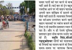
मंतीग सकती है। अलग-अलग समय पर होने वाले हादसों के बाद ही लोग जानपुखतर अपनी जान से खिलावाक कर रहे हैं। गढ़ नगर के स्थाना मात्र पर रेलवे फाटक को बंद रखते कर्मों अपनी दृष्टी के अनुसार डेन आने से पहले फाटक बंद कर देते हैं लेकिन फाटक बंद होते ही लोग इसकी अनदेखा कर रेलवे लाइन पार करने की कोशिश करने लगते हैं। कभी-कभी भी डेन आने के बाद भी मोटरसाइकिल

शाह टाइम्स संवाददाता गढ़मुक्तेश्वर। क्षेत्र में सुरक्षा के लिए पार गए रेलवे फाटक को अहमियत को दरकिनार कर लोग फाटक बंद होने पर पारफिया वाहन चालक जान जोखिम में डालकर फाटक को पार करते हैं। इन लोगों को अचानी जान की परवाह न हो पार करने को हर डेन गुजरने के दौरान लोगों को सुरक्षा के फाटक बंद किए जाते हैं। लेकिन इसके बावजूद भी कुछ लोग इन सब बातों को दरकिनार करते हुए बंद फाटक के नीचे से निकलने का प्रयास करते हैं। इनमें साइकिल, स्कूटर, बाइक सवार ही नहीं बल्कि पैदल चलने वाले बुढ़ाए, महिलाएं व स्कूली बच्चे भी शामिल होते हैं। स्थाना मात्र पर रेलवे फाटक को बंद रखते कर्मों अपनी दृष्टी के