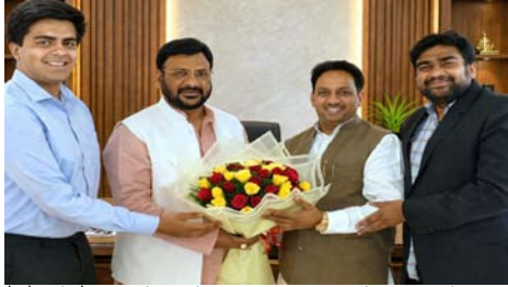
डॉ. नेहरू में मौजूद डा. मनोरंजन या प्रतिभाओं तक सीमित न रहें, बल्कि इसके साथ

शाह टाइम्स संवाददाता हापुड़। देश में आधुनिक खेल संस्कृति को नई दिशा देने की पहल तेज होती दिख रही है। इसी क्रम में एसकेवी वेंचर्स ने एक उच्चस्तरीय बैठक आयोजित कर खेलों के क्षेत्र में व्यापक बदलाव की रूपरेखा तैयार की। बैठक में खेल अकादमी, एनए, विकास, स्थानीय प्रतिभाओं को नियंत्रित और आनंद, राष्ट्रीय स्तर की प्रतियोगिताओं के आयोजन पर भी चर्चा के बीच किये गए। इस पहल को उमरगढ़ में सकारात्मक माहौल और सरकारी सहयोग भी मिल रहा है, जिससे इसे जमीन पर उतारने की प्रक्रिया को गति मिलने की उम्मीद जलाई जा रही है। बैठक में इस बात पर विशेष जोर दिया गया कि राज्य स्तर से ही खिलाड़ियों को अंतर्राष्ट्रीय स्तर के अनुभव सुनिश्चित और प्रशिक्षण उपलब्ध कराया जाए, ताकि वे वैश्विक मंच पर अपनी प्रतिभा का प्रदर्शन कर सकें। इसके लिए आधुनिक स्टेडियम, प्रशिक्षण केंद्र और खेल तकनीक को बढ़ावा देने की रणनीति बनाई गई है। इस दौरान उमरगढ़ सरकार में वहां प्रारंभिक शायद समय में कराई कि इस तरह की पहल राज्य के युवाओं के लिए बेहतर आम साबित होंगी। उन्होंने कहा कि खेल क्षेत्र विकास प्रक्रियाओं को संतुलित नहीं है, बल्कि वह अनुशासन, संस्कार और व्यक्तिगत विकास का सशक्त माध्यम है। ऐसे प्रयास न केवल उमरगढ़ बल्कि पूरे देश के लिए मिसाल बन सकते हैं।