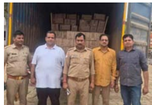
में लेकर शराब को जप्त कर लिया। इस मामले में थाना प्रभारी और सीकिंग अधिनियम के तहत मुकदमा दर्ज कर आगे की कार्रवाही कर रहे हैं। अधिनियमों का कहना है कि

eHija बंद बाड़ी के ट्रक में बने लकड़ी के बंदे बंदे बॉक्स में छिपा कर ले जाई जा रही शराब को सीकिंग के दौरान बरामद कर लिया गया। जब इन बॉक्स को खोलकर देखा गया तो उनमें अवैध रूप से छुपाकर ले जाई जा रही शराब बरामद हुई। कुल 283 पेटी शराब जब की गई, जिनमें 51 पेटी कुल शराब, 174 पेटी हाक और 58 पेटी क्वार्टर शामिल हैं। बरामद करण की कुल मात्रा 2526.12 बरक लीटर बताई जा रही है।