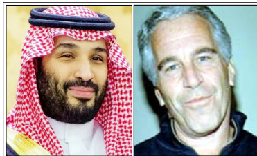
एपस्टीन ने मिडिल ईस्ट (पश्चिम एशिया) में कई साल तक अपने संबंध बनाए