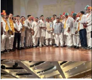
■ मेरठ में गुर्जर जनजागृति महासम्मेलन में उमड़ी समाज के सक्रिय हज़ारों लोगों की भीड़ ने दिया एकता का संदेश

शाह टाइम्स ब्यूरो मेरठ। क्रांति नायक धन सिंह कोवाल गुर्जर को नमन करते हुए मेरठ में संयुक्त गुर्जर परिषद द्वारा गुर्जर जन जागृति महासम्मेलन का ऐतिहासिक आयोजन किया गया। गुर्जर क्रांति दिवस के अवसर पर कार्यक्रम स्थल पर आयोजित गृह महासम्मेलन सामाजिक चेतना और राजनीतिक एकजुटता को मिलावत बना गया।