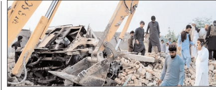
आत्मघाती हमले से दहला पाक, विस्फोटक से भरी गाड़ी चेकपोस्ट से टकराई