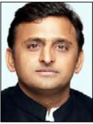
-अखिलेश यादव, अध्यक्ष, समाजवादी पार्टी

उग्र में मंत्रिपरिषद विस्तार में मुख्यमंत्री की कोई भूमिका नहीं रह गई है और फंसले ऊपर से आने वाली परिचयों के आधार पर हो रहे हैं, समय बिताने के लिए करना है कुछ काम, वैसे भी मंत्रिमंडल के विस्तार में तो इनका कोई काम है नहीं, उधर से पची आएं, यहां तो सिर्फ पढ़ी जाएगी, भाजपा राज में वैसे भी सीएम का मतलब बस यही रह गया है, कूरियर मैसेंजर, जनता पूछ रही है कि फिल्म सबसे आगे बैठकर देखेंगे या पीछे बैठकर साथ ही उन्होंने यह भी कहा कि फिल्म ध्यान से देखिएगा, हो सकता है कर्मफल-कंसफल का सिद्धांत समझ में आए और कुछ सकारात्मक बदलाव देखने को मिले, मूल रूप से व्यक्ति नहीं, बल्कि उसका लालच और लोभ बुरा होता है, जो दुराचरण का रूप ले लेता है।