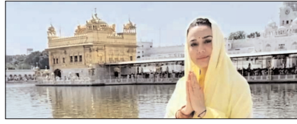
आईपीएल के अहम मुकाबले से पहले प्रीति जिंटा ने गोल्डन टेम्पल में माथा टेका