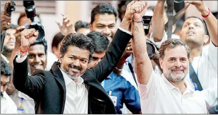
चेन्नई। जवाहरलाल नेहरू स्टेडियम में अपने शपथ ग्रहण समारोह के दौरान लोकसभा में विपक्ष के नेता राहुल गांधी के साथ हाथ मिलाते तमिलनाडु के नवनिर्वाचित मुख्यमंत्री (टीवीके) प्रमुख विजय।