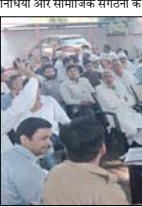
समय महत्वपूर्ण बैठक की। बैठक में भागीदार किसान युनियन सदस्य के कई गणमान्य लोग मौजूद रहे।