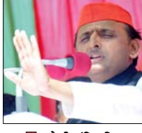
योगी मंत्रिपरिषद विस्तार पर सपा का तंज

शाह टाइम्स ब्यूरो लखनऊ। उत्तर प्रदेश में हुए मंत्रिपरिषद विस्तार को लेकर समाजवादी पार्टी के राष्ट्रीय अध्यक्ष अखिलेश यादव ने भारतीय जनता पार्टी सरकार और मुख्यमंत्री योगी आदित्यनाथ पर तीखा हमला बोला है। श्री अखिलेश यादव ने सोशल मीडिया पर पोस्ट करते हुए कहा कि मंत्रिपरिषद विस्तार में मुख्यमंत्री को कोई भूमिका नहीं रह गई है और फौजदार 'ऊपर से आने वाली परिचियों' के आधार पर हो रहे हैं। सपा प्रमुख ने व्यंग्य करते हुए लिखा, 'समय बिताने के लिए करना है कुछ काम। वैसे भी मंत्रिमंडल के विस्तार में तो इनका कोई काम है नहीं। उधर से पच्ची आएगी, यहाँ तो सिर्फ पढ़ी जाएगी। भाजपा राज में वैसे भी सकारात्मक बदलाव देखने को मिले। दरअसल योगी आदित्यनाथ रविवार को पूरी मंत्रिमंडल के साथ शाम को लोकभवन में कृष्णावतरम फिल्म देखेंगे। यादव ने नैतिकता और आत्ममंथन का संदेश भी दिया। उन्होंने लिखा कि मूल रूप से व्यक्ति नहीं, बल्कि उसका लालच और लोभ बुरा होता है, जो धीरे-धीरे दुराचरण का रूप ले लेता है। इसके विपरीत जब व्यक्ति स्वार्थ छोड़कर परमार्थ के मार्ग पर चलता है, तो सकारात्मक परिवर्तन संभव होता है। महाकाव्यों का संदेश भी यही है कि अच्छाई अंततः बुराई पर विजय प्राप्त करती है। अपनी गलतियों और दुर्भावनाओं के लिए प्रायश्चित्त का कोई निश्चित स्थान नहीं होता, बल्कि इसके लिए भीतर के प्रकाश की आवश्यकता होती है।