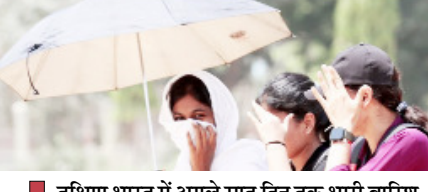
दक्षिण भारत में अगले सात दिन तक भारी बारिश होने की संभावना, किसानों को जारी किया परामर्श

नई दिल्ली, वार्ता मौसम विभाग ने उत्तर-पश्चिमी भारत के कई राज्यों में अगले पांच दिनों के दौरान गरज-चमक के साथ 40 से 60 किलोमीटर प्रति घंटे की रफतार से तेज हवाओं के चलने की संभावना जताई है। जम्मू-कश्मीर तथा लद्दाख में 11 और 12 मई को मौसम अधिक खराब रह सकता है, जबकि हिमाचल प्रदेश एवं उत्तराखंड में 12 और 13 मई को ओलावृष्टि होने की भी आशंका जताई गई है। मौसम विभाग की ओर से जारी बुलेटिन के अनुसार, दक्षिण पश्चिमी बंगाल की खाड़ी में अगले 48 घंटों के भीतर एक निम्न दबाव का क्षेत्र बनने के आसार हैं। इसके प्रभाव से दक्षिण भारत के राज्यों, विशेषकर केरल, तमिलनाडु, पुदुचेरी और कराईकल में अगले सात दिनों तक भारी वर्षा होने की संभावना है। लक्षद्वीप में भी रविवार को भारी बारिश का अनुमान है। हालांकि, दिल्ली-एनसीआर में 11 से 13 मई के बीच शाम या रात के समय हल्की बारिश और धूल भरी आंधी चलने से तापमान में मामूली गिरावट आ सकती है। मौसम विभाग ने ओलावृष्टि और तेज हवाओं को देखते हुए कृषि क्षेत्र के लिए पहाड़ी राज्यों के फल उत्पादकों को सुझाव दिया गया है कि वे अपने बागानों को ओलों से बचाने के लिए 'हेलेंट' का प्रयोग करें। तेज हवाओं के दौरान पशुओं को सुरक्षित स्थानों पर रखने और कटी हुई फसलों को ढककर रखने की सलाह दी है। मछुआरों को 15 मई तक बंगाल की खाड़ी और अरब सागर के हिस्सों में न जाने की हिदायत दी गई है।