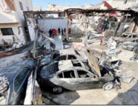
पिछले सप्ताह इजरायली हमलों में पूरे देश में 120 से अधिक लोग मारे गए जिनमें महिलाएं और बच्चे भी शामिल

बेरूत। लेबनान के स्वास्थ्य मंत्रालय ने कहा कि इजरायल द्वारा लेबनान में किए गए भीषण हमलों में 39 लोग मारे गए। यह जानकारी बीबीसी ने रविवार को दी। मंत्रालय ने कहा कि दक्षिणी शहर सकसाकियाह पर हुए एक इजरायली हमले में एक बच्चे सहित कम से कम सात लोग मारे गए। इजरायली रक्षा बलों (आईडीएफ) ने कहा कि वह लेबनानी सशस्त्र समूह हिजबुल्लाह को निशाना बना रहा था और निर्दोष नागरिकों को हानि पहुंचाने की कोशिशें कर रहे हैं। अमेरिकी राष्ट्रपति डोनाल्ड ट्रम्प द्वारा 16 अप्रैल को इजरायल और लेबनान की सरकारों के बीच युद्धविराम समझौते की घोषणा के बाद से इजरायली सेना और हिजबुल्लाह के बीच गोलीबारी जारी है। इजरायल के अधिकांश हवाई हमले दक्षिणी लेबनान में हुए हैं और आईडीएफ का कहना है कि वह इरान समर्थित मिलिशिया और राजनीतिक दल हिजबुल्लाह से जुड़ी अवसरंचना