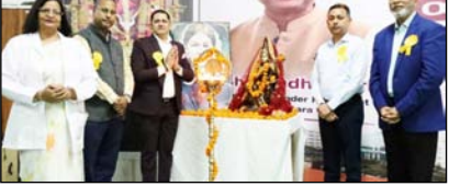
शाह टाइम्स संवाददाता अमरोहा। श्री वेकेंडश्वरा विश्वविद्यालय में अंतर्राष्ट्रीय नर्सस दिवस पर राष्ट्रीय सेमिनार, ओथ सेमिनारों में नर्सस समान समारोह का आयोजन किया गया। कार्यक्रम में अवर नर्सस-अवर प्रधर, प्रमोड नर्सस-लेड्स विषय पर सौगोठी आयोजित हुई। जिसमें नर्सस प्रोफेशनल को महत्ता और स्वास्थ्य सेवाओं में उसकी भूमिका पर विस्तार से चर्चा की

अंतर्राष्ट्रीय नर्सस दिवस पर वेकेंडश्वरा में राष्ट्रीय सेमिनार