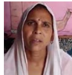
आरोपित अंशुओं से ओझल हो चुके थे। घटना को सूचना मिलते ही पुलिस मौके पर पहुंची और आरोपियों के लोगों से जानकारी जुटाई। पुलिस ने पीआरटी की तस्वीर के जंच बुद्ध कर दी है। वहीं वास्तव को धार पुलिस आरोपियों लगे सीसीटीवी कैमरा से फरार हो गए। अचानक कई घटना से महिला जवान बच गईं और और मचाया, लेकिन तब तक

शाह टाइम्स संवाददाता हापुड़ । बचपानों के होसले लगातार सुलत होने नजर आ रहे हैं। बुद्धी टोकर पर लौट रही एक पीआरटी महिला जवान से बाइक सवार बदमाशों ने मोबाइल फोन और एकटी छीनी। लो वातावरण के बाद आरोपियों मौके से फरार हो गए। घटना से क्षेत्र में दहशत का माहौल है।