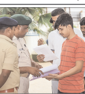
नीट परीक्षा रद्द होने पर राहुल गांधी ने की केंद्र की आलोचना नई दिल्ली। लोकसभा में विपक्ष के नेता राहुल गांधी ने नीट (यूजी) 2026 परीक्षा रद्द होने पर केंद्र सरकार की तीखी आलोचना की और कहा कि 22 लाख से अधिक छात्रों को मेहनत पर सरकार ने पानी फेर दिया है। राहुल गांधी ने सोशल मीडिया पर जारी बयान में कहा कि किसी पिता ने बच्चों की पढ़ाई के लिए कर्ज लिया, किसी मां ने गहने बेचे और लाखों छात्रों ने रात-रात भर जागरण तैयारी की, लेकिन बदले में उन्हें पेपर लीक, सरकारी लापरवाही और शिक्षा में संगठित भ्रष्टाचार मिला। यह सिर्फ नकामी नहीं, बल्कि युवाओं के भविष्य के साथ खिलवाड़ है।

तीन मई को हुई थी नीट यूजी परीक्षा, मामले की जांच अब सीबीआई करेगी