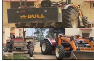
खनन अधिकारी की टीम को देखकर मौके पर मौजूद खनन माफिया बहाक डोडकर फरार हो गए। घटना के मौके से लोडर और दो ट्रैक्टर-ट्राली कब्जे में लेकर जब्त कर लिया। अधिकारियों ने जब्त वाहनों की पुलिस की निगरानी में खड़ा कर दिया है। खनन विभाग के अधिकारियों का कहना है कि अश्वे खनन करने की क्रिया पर बंदीबर्न नहीं किया जाएगा। मामले में संबंधित लोगों को पहचान कर उनके खिलाफ निरयमनुसार कार्रवाई को जाएगा।

शाह टाइम्स संवाददाता हापुड़ । जवनर में अश्वे मिट्टी खनन के खिलाफ प्रयासन ने बड़ी कार्रवाई करते हुए खनन में लगे दो लोडर और दो ट्रैक्टर-ट्राली को जब्त कर लिया। कार्रवाई के दौरान खनन माफिया मौके से फरार हो गए। अचानक हुई इस कार्रवाई से अश्वे खनन करने वालों में हडकंप मच गया। जानकारी के अनुसार बाबूबाहु थाना क्षेत्र में लंबे समय से अश्वे मिट्टी खनन की शिकायतें मिल रही थीं। शिकायतों के आधार पर खनन विभाग की टीम ने क्षेत्र में छापेमारी अभियान चलाया। कार्रवाई के दौरान खोले और खाली पट्टी जमीनों से बंद थामे पर मिट्टी का अश्वे खनन किया जा रहा था। मौके पर पेशीनों से मिट्टी की खुदाई ट्रैक्टर-ट्रालियों में भरकर सप्लाई की जा रही थी।