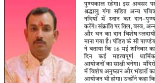
प्रदीप व्रत 14 मई गुरुवार को रखा जाएगा। इस दिन भगवान शनि की माता शनिती की विधि पूजा की जाएगी तथा शनि मंत्रालाए संयोग के विधि-विधान से पूजन कर पवित्र की सुबह-मुहूर्त की कामना करनी। उन्होंने कहा कि 15 मई शुक्रवार को वृष संक्रांति का पुषकाल रहेगा। इस अवसर पर अश्वे गंगा सदान अथ पवित्र नदियों में स्नान कर दिन-पूषक नदियों। संक्रांति पर विल, वजन, अन्न और धान वान विधि पूषकाली माना गया है। 16 मई शनिवार को व्रत कर्ष महत्त्वपूर्ण धार्मिक आयोजनों का शोभे रहेगा। मंदिरों में विशेष अनुष्ठान और भंडारों का आयोजन होगा। विसंकेतिका कि 17 मई रविवार से पुरुषोत्तम मास प्रारंभ हो जाएगा, विसंकेतिका मास की कडा जाता है। सप्तम व्रत में इस मास को भगवान विष्णु की सप्तमि माना गया है। उन्होंने लोगों से अपील की कि इस पूरे सप्ताह पवित्र की सुबह-मुहूर्त की कामना करनी। उन्होंने कहा कि 15 मई शुक्रवार को वृष संक्रांति का

है। उन्होंने कहा कि अश्वे में जो इन्हें शुभ अवसरों का साथ उठाकर शनि, वृष, जप, तप और भावना की आराधना करनी चाहिए। उन्होंने बताया कि एकादशी तिथि 12 मई को अपराह्न 2 बजेकर 52 मिनट से आरंभ होकर 13 मई की दोपहर 1 बजेकर 30 मिनट तक रहेगी। ऐसे में शरद समस्त रूप से अपरा एकादशी का व्रत 13 मई सुबह 8 बजेकर 31 मिनट तक रहेगा। प्रदीप काल में ज्योतिषी विधि प्रभाव होने के कारण