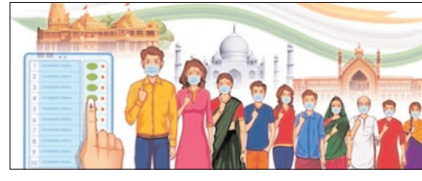
2027 में योगी को हराने का सपना देखना छोड़ दे विपक्ष सम्पादकीय