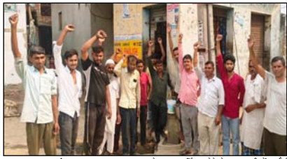
शाह टाइम्स संवाददाता हसनपुर। ग्राम भदौरा में पिछले एक माह से पेयजल आपूर्ति ठप होने के कारण ग्रामीणों का धैर्य जाकबंद दे गया। जल जीवन मिशन के तहत हो रही