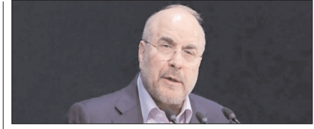
ईरान की 14-सूत्रीय योजना का कोई विकल्प नहीं: गालिबफ पेज 12