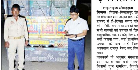
रातभर 6 ओवरलोड वाहनों को पकड़ा गया, जिन्हें सड़कल चौक कर दिया गया। साथ ही नियमों का उल्लंघन करने पर 2 बसों का स्यादाबन्दी भी किया गया।