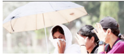
पश्चिम यूपी में 50 से 60 किलोमीटर प्रति घंटा की रफ्तार से चलेंगी तेज हवाएं

शाह टाइम्स ब्यूरो लखनऊ। उत्तर प्रदेश में एक बार फिर मौसम का मिजाज बदलने से पश्चिमी इलाकों में गर्मी से फौरी राहत मिली है जबकि पूर्वी क्षेत्र में अगले 24 घंटों के दौरान कई जिलों में गरज-चमक, तेज आंधी, वज्रपात और ओलावृष्टि के आसार हैं। अमरौहा, मुरादाबाद, संभल और अलीगढ़ समेत पश्चिमी उत्तर प्रदेश विशेष रूप से तराई और पश्चिमी जिलों में तेज हवाओं के साथ बारिश हुई जिससे लोगों को गर्मी से फौरी राहत मिली। मौसम विज्ञान विभाग के लखनऊ केंद्र द्वारा जारी प्रभाव आधारित पूर्वानुमान एवं चेतावनी के अनुसार 12 मई को पश्चिमी और पूर्वी उत्तर प्रदेश के कई