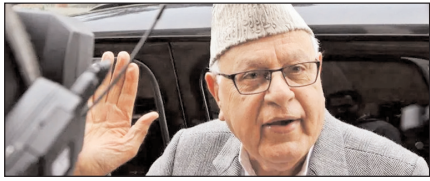
केंद्र राजस्व की भरपाई कर दे, तो उमर सरकार शराब पर प्रतिबंध लगा सकती है: फारुक पेज 2

नई दिल्ली, मुजफ्फरनगर, देहरादून, हल्द्वानी, मुगदाबाद, बरेली, मेरठ व लखनऊ से प्रकाशित