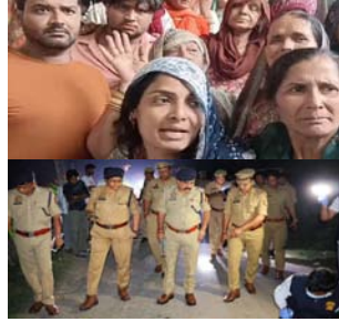
आरोपियों के अनुसार, पीआरटी महिला जवान बुद्धी गणपत करके बाद अपने घर लौट रही थीं। इसी दौरान रजिश के बाइक पर आए दो बचपानों ने उसे गिराना बना लिया। बताया गया कि मोबाइल महिला जवान के हाथ से मोबाइल फोन और एकटी छोकरन उगे गति से फरार हो गए। अचानक कई घटना से महिला जवान बच गईं और और मचाया, लेकिन तब तक