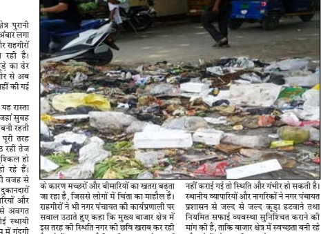
कूड़े का ढेर अक्सर अचानक ही सर्वोच्च अधिकारियों को समस्या से अवगत कराया गया, लेकिन अभी तक कोई स्थायी समाधान नहीं निकला।

(सुमित कश्यप) शाह टाइम्स संवाददाता शाहबाद। नगर के अल्प क्षेत्र पूर्ण तहसील के सामने इन दिनों गंदगी का अंबार लगा हुआ है, जिससे स्थानीय व्यापारियों और राहगीरों में भारी नाराजगी देखने को मिल रही है। कांतावली के निजिक कट्टे दिनों से कूड़े का ढेर जमा है, जिसे नगर पंचायत की ओर से अब तक सफाई की कोई प्रभावी व्यवस्था नहीं की गई है। स्थानीय दुकानदारों का कहना है कि यह रास्ता नगर के प्रमुख बाजारों में शामिल है, जहां सुबह से देर शाम तक लोगों को आवाजाही बनी रहती है। इसके बावजूद सफाई पूरी तरह बहाल नजर आ रही है। कूड़े से उठ रही तेज दुर्गंध के कारण दुकानों पर बैठना मुश्किल हो गया है और ग्राहक भी प्रभावित हो रहे हैं। व्यापारियों का कहना है कि गंदगी को बहाल से उनके व्यापार को भी असर पड़ रहा है। दुकानदारों ने बताया कि कूड़े का ढेर अक्सर अचानक ही सर्वोच्च अधिकारियों को समस्या से अवगत कराया गया, लेकिन अभी तक कोई स्थायी समाधान नहीं निकला। यमों के मौसम में गंदगी