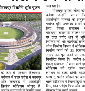
चल रहा है। गोरखपुर इसका चौथा केंद्र बनाया। उन्होंने बताया कि अंतराष्ट्रीय मानकों के अनुरूप यहाँ का स्टेडियम प्रस्तावित है गोरखपुर-वापसी शीलेनतें मार्ग पर ताल नदर और तें पृथिवि का भी। कार्यवाही संस्था कोर्स निर्माण विभाग ने स्टेडियम निर्माण कार्य को 23 सितंबर 2027 तक पूरा करने का लक्ष्य निर्धारित किया है। करीब 46 एकड़ क्षेत्रफल में बने वाले इस स्टेडियम की रररक क्षमता लगभग 30 हजार होगी। ग्रांड्सटैंड 25 फ्लोरोमांडल पर बने वाले स्टेडियम में खिलाड़ियों के लिए सार प्लेगिंग पिच और चार प्रैक्टिस पिच बनाई जाएगी।

गोरखपुर, वार्ता। उत्तर प्रदेश के मुख्यमंत्री योगी आदित्यनाथ 16 मई को पूर्वांचल के पहले और प्रवेश के चौथे अंतराष्ट्रीय क्रिकेट स्टेडियम का भूमि पूजन कर शिलान्यास करेंगे। आधिकारिक भूमि पूजन कार्यक्रम को बतौरा कि गोरखपुर वापसी सार्वजनिक पर दिखत ताल नदर में करने वाला यह अंतराष्ट्रीय क्रिकेट स्टेडियम 392-94 करोड़ रुपये की लागत से तैयार किया जाएगा। निर्माण कार्य के लिए पहली फिक्त के रूप में 63-39 करोड़ रुपये जारी किए जा चुके हैं। साथ ही एलासमंड, मिट्टी भराई, लेव, फिंग और भारी निर्माण उपकरणों को स्थानाण का काम भी शुरू हो गया है। सूत्रों के अनुसार