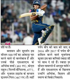
श्री पर हैं। क्लासन और सुदर्शन इस सीजन 500 रनों का आंकड़ा पार करने वाले दो बल्लेबाज हैं और उनके पीछे एसआरएच के अधिकांश शर्मा (481 रन), कंगल राहुल (दिल्ली कैपिटल्स, 477), और गुजरात टाइटेंस के कप्तान शुभमन गिल (467 रन) हैं। वहाँ

अहमदाबाद, वार्ता। गुजरात टाइटंस (टी) के सलामी बल्लेबाज साई सुदर्शन सनराइजर्स हैदराबाद (एसआरएच) के खिलाफ 61 रनों की पारी खेलते हुए 17वें ओवर में आउट होने तक वह ऑरेंज कैप अपने नाम कर ली थी। लेकिन एसआरएच के हाइनरिक क्लासन 14 रन बनाकर आउट हुए और ऑरेंज कैप पर कुछ ही देर में दुबारा कब्जा कर लिया। मंगलवार को एसआरएच के हाइनरिक क्लासन ने लक्ष्य करते हुए अपनी पारी को शुरूआत सुदर्शन के 501 रन से केवल सात रन पीछे रहते हुए की थी। पले ही क्लासन बड़ी पारी में नहीं खेल सके और केवल 14 रन बनाकर आउट हो गए, लेकिन उन्होंने ऑरेंज कैप हासिल किया। 508 रन के साथ फिलहाल वह