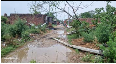
पड़ा। गनीमत यह रही कि उस वक्त कोई बड़ा वाहन पेड़ की चपेट में नहीं आया, वरना बड़ा हादसा हो सकता था। पेड़ गिरने से इसपूर से अलीगढ़ की ओर जाने वाले वाहनों को आबाजाही पूरी तरह टप हो गई। बाइक सवारों, कार चालकों और छोटे वाहन चालक खेतों और कच्चे सामान पड़ा। कई लोग सड़क को आबाजाही पूरी तरह टप हो गई। कारों को अचानक रस्ता साफ होने का इंतजार करते रहे, जबकि कुछ छाते वाहन चालक खेतों और कच्चे

शाह टाइम्स संवाददाता रहरा तेज तूफान और प्लू प्रती आंधी से जनबनाव को पूरी तरह प्रभावित कर दिया। इसपूर-अलीगढ़ मार्ग पर रहरा स्थित पेट्रोल पंप के पास अचानक एक विशाल पेड़ टूटकर सड़क पर गिर पड़ा, जिससे मौके पर अचानक-तपनी सच गई। पेड़ गिरने ही सड़क पर जाम बनने का संकेत था। राहगीरों को लंबी कतारें लगा गईं और करीब आधे घंटे तक यातायात पूरी तरह बाधित रहा।