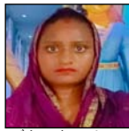
का धैर्य जवाब दे गया। परिजन वरुद उसे वहां रहकर हंगामा काटना शुरू कर दिया। डॉक्टर पर इलाज में कौताही बरतने का आरोप लगाया। हंगामों की सूचना मिलते ही पुलिस भी मौके पर पहुंच गई। और स्थिति को शांत करने का प्रयास किया। परि-

शाह टाइम्स संवाददाता हसनपुर। एक निजी अस्पताल में चिकित्सक की लापरवाही के कारण जच्चा महिला की मौत हो का आरा. प लगाते हुए परिजनों ने हंगामा खड़ा कर दिया। सोमवार को रहरा संचल बाईपास मार्ग स्थित एक नर्सिंग होम में गजरोला थाना क्षेत्र के गांव निवासी महिला को हिलीवरी हुई थी। जिसमें उसने एक स्वस्थ पुत्र को जन्म दिया। लेकिन प्रसव के कुछ समय बाद ही महिला की स्थिति बिगड़ गई। चिकित्सक बेहतर उपचार कराने के लिए उन्हें मेरठ से गये थे। वहां पर महिला की मृत्यु हो गई। महिला की मौत को खबर मिलते ही परिजन-