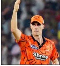
वार्ता। सनराइजर्स हैदराबाद के कप्तान पैट कमिस पर धीमे ओवर रेट के लिए 12 लाख रुपये का जुर्माना लगाया गया है। हैदराबाद की टीम ने अहमदाबाद के गैर-मोरी स्टेडियम में गुजरात टाइटें प्रीमियर लीग (आईपीएल) 2026 के 56वें मैच के दौरान भीमोरी गति बनाए रखी। चौकी आईपीएल की आकर सोनिया के अनुच्छेद 2-22 के तहत यह इस सीजन में उनकी टीम का पहला परिणाम था— जो न्यूनतम ओवर गति से बने हुए अपराधों से संबंधित है, इसलिए परिणाम पर 12 लाख रुपये का जुर्माना लगाया गया। हैदराबाद को इस मुक़ाबले में गुजरात के हार्थी 82 रन से करारी हार का सामना करना पड़ा।

अहमदाबाद, वार्ता। सनराइजर्स हैदराबाद के कप्तान पैट कमिस पर धीमे ओवर रेट के लिए 12 लाख रुपये का जुर्माना लगाया गया है। हैदराबाद की टीम ने अहमदाबाद के गैर-मोरी स्टेडियम में गुजरात टाइटंस के खिलाफ टाइटें प्रीमियर लीग (आईपीएल) 2026 के 56वें मैच के दौरान भीमोरी गति बनाए रखी। चौकी आईपीएल की आकर सोनिया के अनुच्छेद 2-22 के तहत यह इस सीजन में उनकी टीम का पहला परिणाम था— जो न्यूनतम ओवर गति से बने हुए अपराधों से संबंधित है, इसलिए परिणाम पर 12 लाख रुपये का जुर्माना लगाया गया। हैदराबाद को इस मुक़ाबले में गुजरात के हार्थी 82 रन से करारी हार का सामना करना पड़ा।