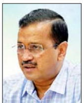
-अरविंद केजरीवाल, संयोजक, आम आदमी पार्टी

बहुत हुआ पेपर लीक, अब इस धिनौने खेल को बंद करने के लिए देश के जेन जी को सड़कों पर उतर कर शांतिपूर्ण प्रदर्शन करना पड़ेगा नेपाल और बांग्लादेश के जेन जी अपनी सरकार बदल सकते हैं, तो हमारे देश का जेन जी पेपर लीक कराने में शामिल मंत्रियों-नेताओं को जेल क्यों नहीं भिजवा सकता, हर बार पेपर लीक की जांच सीबीआई को सौंप दी जाती है, लेकिन आज तक किसी को सजा नहीं मिली, इस बार भी कुछ नहीं होने वाला है, ज्यादातर पेपर लीक भाजपा शासित राज्यों में क्यों होते हैं, क्या इस धिनौने खेल में भाजपा को नेता सीधे तौर पर शामिल है? कुछ लोग सिस्टम फेल होने की बात करते हैं, लेकिन वे लोग ऐसा कहकर अनजाने में पेपर लीक में शामिल टॉप पर बैठे व्यक्ति को बचा रहे हैं।