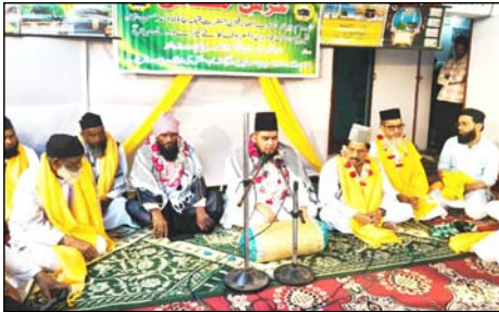
करने और अपने माता-पिता को खिब्रत करने की अपील की। मौलाना ने कहा कि अल्लाह का जिब्रक करने से दिलों को सुकून