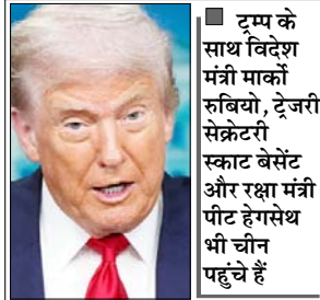
ट्रम्प के साथ विदेश मंत्री मार्को रुबियो, ट्रेजरी सिक्रेटरी स्कॉट बेसेंट और रक्षा मंत्री पीट हेगसेथ भी चीन पहुंचे हैं।

वाशिंगटन। चीन ताइवान को अपना हिस्सा मानता है, जबकि अमेरिका ताइवान को हथियार देने की तैयारी कर रहा है। ट्रम्प प्रशासन ने ताइवान के लिए 11 अरब डॉलर के हथियार पैकेज को मंजूरी दी है, हालांकि उसकी डिलीवरी अभी शुरू नहीं हुई है। ताइवान दुनिया में चिप निर्माण का बड़ा केंद्र है और आर्टिफिशियल इंटेलिजेंस उद्योग के लिए बेहद महत्वपूर्ण माना जाता है। ट्रम्प अमेरिका में चिप उत्पादन बढ़ाने के लिए ताइवान के साथ व्यापारिक सहयोग मजबूत करना चाहते हैं। इसी सिलसिले में एनवीडिया के सीओओ जेन्सेन हुआंग भी अमेरिकी प्रतिनिधिमंडल का हिस्सा बने हैं। ट्रम्प के साथ विदेश मंत्री मार्को रुबियो, ट्रेजरी सिक्रेटरी स्कॉट बेसेंट और मंत्री पीट हेगसेथ भी चीन पहुंचे हैं। इसके अलावा टेक, रक्षा, कृषि और वित्त क्षेत्र के कई बड़े कारोबारी भी प्रतिनिधिमंडल में शामिल हैं।