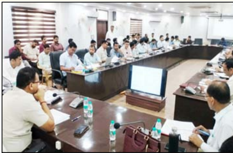
कार्यवाही संस्थाओं के अधिकारियों को निर्देशित करते हुए कहा कि जिन परियोजनाओं में हस्त प्रगति प्राप्त हो चुकी है, उनके निर्माण

बैठक में मुख्य विकास अधिकारी ने सभी विभागीय अधिकारियों एवं कार्यवाही संस्थाओं को निर्देश दिए कि निर्माण कार्यों की प्रगति पर विशेष ध्यान दिया जाए तथा गुणवत्ता में किसी भी प्रकार की कमी न रहे। उन्होंने कहा कि कार्यवाही संस्थाएं निर्माण कार्यों को गंभीरतापूर्वक देखें, निर्धारित प्रगति के अनुरूप समयबद्ध ढंग से पूर्ण करें। उन्होंने समीक्षा बैठक के दौरान