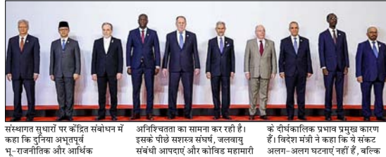
संस्थगत सुधारों को प्रोत्साहित करने के लिए भारत ने ब्रिक्स देशों को अंतर्राष्ट्रीय सुरक्षा, आर्थिक अस्थिरता और आर्थिक अस्थिरता का सामना कर रही है। इसके पीछे विश्वस्त संघर्ष, जलवायु संबंधी आपदाएं और कोविड महामारी के दीर्घकालिक प्रभाव प्रमुख कारण हैं। ब्रिक्स देशों ने कहा कि वे संकट अलग-अलग घटनाएं नहीं हैं, बल्कि

शह टाइम्स ब्यूरो नई दिल्ली। भारत ने कहा है कि बढ़ते भू-राजनीतिक तनाव, आर्थिक अस्थिरता और कमजोर होती बहुराष्ट्रीय संस्थाएं वैश्विक व्यवस्था को अधिक नाजुक बना रही हैं और ब्रिक्स देशों को स्थिरता तथा वैश्विक शासन व्यवस्था में सुधार के लिए एकजुट होकर काम करने चाहिए।