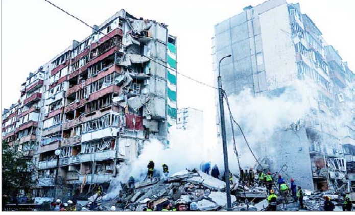
कीर्त। रूसी हमले के बाद एक आवासीय इलाके में बुरी तरह क्षतिग्रस्त हुए घर के मलबे को हटाने का काम चल रहा है।

न्यूयॉर्क। संयुक्त राष्ट्र बाल कोष (यूनिसेफ) ने कहा है कि 17 अप्रैल से लागू युद्धविराम के बाद से लेबनान में कम से कम 23 बच्चों की मौत हो चुकी है, जबकि 93 बच्चे घायल हुए हैं। यूनिसेफ ने बुधवार को जारी बयान में कहा, स्वास्थ्य मंत्रालय के अनुसार, सौजन्यपूर्ण शुरू होने के बाद से अब तक कम से कम 23 बच्चे मारे गए और 93 घायल हुए हैं। दो मार्च से अब तक कुल 200 बच्चों की मौत और 806 बच्चे घायल हुए हैं, यानी औसतन हर दिन लगभग 14 बच्चे मारे गए या फिर घायल हुए हैं। बयान में यह भी कहा गया कि पिछले सात दिनों में ही लेबनान में हमलों में मारे गए और घायल बच्चों की संख्या 59 पहुंच गई है। मंगलवार सुबह बेरूत के दक्षिण में एक कार पर हुए हमले में दो बच्चों और उनकी मां की मौत हुई है।