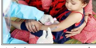
देश में खसरे के पुष्ट और संदिग्ध मामलों की कुल संख्या 60 हजार से अधिक हो गई है

मीडिया रिपोर्टों के अनुसार, पिछले 24 घंटों में कम से कम आठ और लोगों की मौत