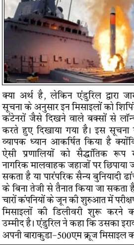
अधिकारी इस कार्यक्रम को पांच वर्षों में लगभग 12000 मिसाइलों की आपूर्ति के लिए अतिरिक्त धन की मांग कर रहे हैं

वाशिंगटन। अमेरिका ने कई संघर्षों में हथियारों के भारी इस्तेमाल के बाद गंभीर रूप से घट रहे मिसाइल भंडार को फिर से भरने के लिए व्यापक पहल की शुरुआत की है जिसके तहत 10000 से अधिक सस्ते कूज मिसाइलों और लगभग 12000 सस्ते हाइप-सोनिक हथियार हासिल करने के प्रयासों की घोषणा की गई है। इस योजना की घोषणा ऐसे समय में की गई है, जब यूक्रेन और इजरायल को बड़े पैमाने पर सैन्य सहायता देने के साथ-साथ 2025 और 2026 में ईरान में प्रत्यक्ष सैन्य अभियान चलाने के बाद अमेरिकी सैन्य आपूर्ति बहुत कम हो गई है। युद्ध विभाग के अनुसार, 'लो-कॉस्ट कंटेनराइज्ड मिसाइल्स' (एलसीसीएम) नामक एक नए कार्यक्रम के तहत एंडुरिल इंडस्ट्रीज, लेइदास, कोएस्पायर और जून 5 टेक्नोलॉजीज के साथ रूपरेखा समझौते पर हस्ताक्षर किए गए हैं। युद्ध विभाग ने हालांकि इस बारे में बहुत कम तकनीकी विवरण दिए हैं कि 'कंटेनराइज्ड' मिसाइलों का वास्तव में क्या अर्थ है, लेकिन एंडुरिल द्वारा जारी सूचना के अनुसार इन मिसाइलों की शिपिंग कंटेनरों जैसे दिखने वाले बक्सों से लॉन्च करते हुए दिखाया गया है। इस सूचना ने व्यापक ध्यान आकर्षित किया है क्योंकि ऐसे प्रणालियों को सैद्धांतिक रूप से नागरिक मालवाहक जहाजों पर छिपाया जा सकता है या पारंपरिक सैन्य बुनियादी ढांचे के बिना तेजी से तैनात किया जा सकता है। एक अलग समझौते में, युद्ध विभाग ने अगले दो वर्षों में कम से कम 500 ब्लैकबियर्ड हाइपरसोनिक मिसाइलों की खरीद के लिए अपनी बाराकूडा-500एम कूज मिसाइल की