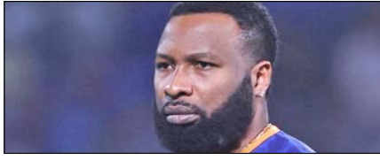
पोलार्ड पर मैच फीस का 15 फीसदी जुर्माना खेल टाइम्स