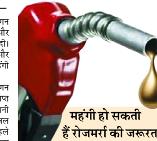
महंगी हो सकती हैं रोजमर्रा की जरूरत की चीजें

नई दिल्ली। तेल विपणन कंपनियों ने शुक्रवार को पेट्रोल और डीजल की कीमतों में बढ़ाव कर दी। साथ ही राष्ट्रीय राजधानी दिल्ली और आसपास के शहरों में सीएनजी भी महंगा हो गई है।