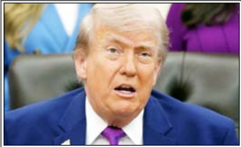
डोनाल्ड ट्रम्प ने दावा किया: चीन नहीं चाहता ईरान परमाणु हथियार हासिल करे

राष्ट्रपति ने कहा: ईरानी परमाणु सुविधाओं पर बमबारी दोहरा सकता है अमेरिका