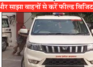
सम्पूर्ण समाधान दिवस में भी लागू होगी नई व्यवस्था, डीएम बतलें को लेकर प्रशासन सख्त