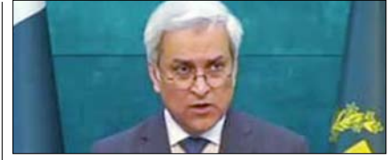
भारत में दोनों देशों के बीच संवाद की मांग उठाने का स्वागत: अंबाबी पेज 12