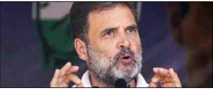
अडानी के हित में मोदी ने किया अमेरिका के साथ व्यापार समझौता : राहुल गांधी पेज 2

नई दिल्ली, मुजफ्फरनगर, देहरादून, हल्द्वानी, मुताबाद, बरेली, मेरठ व लखनऊ से प्रकाशित