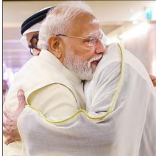
और मजबूत करने पर चर्चा की। उन्होंने ऊर्जा, व्यापार और निवेश, समुद्री अर्थव्यवस्था, तकनीकी क्षेत्र

संयुक्त अरब अमीरात (यूएई) ने भारत में पांच अरब डॉलर के निवेश की घोषणा की है इसके अलावा दोनों देशों ने ऊर्जा, रक्षा, जहाजरानी और सुपर कंप्यूटर सहित छह क्षेत्रों में सहयोग के समझौते किए हैं।