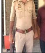
एक नफर वारंटी को क्रिया गिरफ्तार