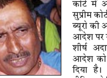
दिल्ली हाईकोर्ट का उल्टा फैसला निलंबन का फैसला किया रद्द