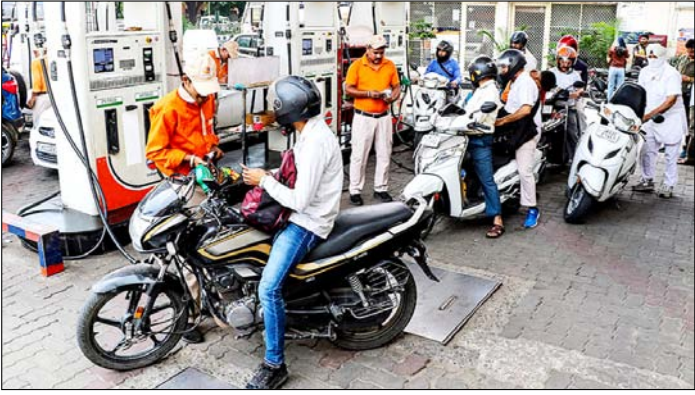
जम्मू-कश्मीर वैश्विक कच्चे तेल की बढ़ती कीमतों के बीच पेट्रोल और डीजल की कीमतों में चार साल से अधिक समय में पहली बार 3 रुपये लीटर की बढ़ोतरी के बाद पेट्रोल पंप पर यात्री।