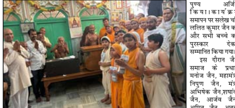
वाले संकटों को यदि कोई टाल सकता है तो वह है सिर्फ श्री जिनेन्द्र भागवान की भक्ति। सिद्ध मने से करी मीरी प्रभु भक्ति ही इस जीवन में आपका कल्याण कर सकती है। भागदकगिला पर प्रार्थना भागवान को विराजमान कर अभिषेक और शांतिप्राप्त कराया। जैन समाज के ओट छोटे बच्चों ने भागवान का अभिषेक कर