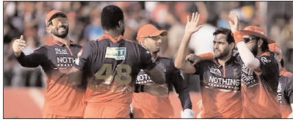
बेंगलुरु आईपीएल-2026 के प्लेऑफ में पहुंचने वाली पहली टीम खेल टाइम्स