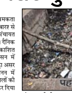
पंचायत की तीन अलग-अलग टीमों मूसरीर दिखलाई ईंधाशासी अधिकारी ईंओ को सफाई निदेश पर जेसुवती मशीनों और दर्जनों सफाई कर्मीयों को काम पर लगाया गया है। प्रशासन ने मानसुन को दस्तक से पहले सभी मुख्य नालों को पूरी तरह साफ करने का अभियान जक कर दिया है।

शाह टाइम्स संवाददाता छुटमलपुर। कालीन पर रचकका करवा और जमीन पर सफाई के अवसर से जुड़ा रही छुटमलपुर नगर पंचायत आधिकारिक पहरी सैर से जग्रा गई है। शैतिक शाह टाइम्स में प्रमुखता से खबर प्रकाशित होने के बाद नगर पंचायत प्रशासन में इडकूप मच गया। खबर का ऐसा बड़ा असर हुआ कि प्रशासन ने आसन-पानन में इरकत में आते हुए कस्में के मुख्य नालों की सफाई का काम युद्धतर पर शुरू कर दिया है। रिवार सुबह से ही कस्में के मेन चानर में पंचरनेल को देखते मी. मिनाजी की दुकान के बाल वाला मुख्त नालों की सफाई का काम शुरू करवाया गया। कल तक जो नाला सफाईकरी की बोलोली, प्रतिलोचन पालिथीन, सराव के पाचर और प्रतिलोचन से पूरी तरह पटा पड़ा था, वहाँ आज नगर