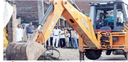
नशा तस्करो के 33 अवैध निर्माणों पर चला बुलडोजर

श्रीनगर। जम्मू-कश्मीर के सांबा जिले में नशीले पदार्थों के तस्करो और धूम्र-माफियाओं के खिलाफ प्रशासन और पुलिस ने बड़ी कार्रवाई की है। पुलिस ने 'नशा मुक्त जम्मू-कश्मीर अभियान' के तहत बड़ी कार्रवाई करते हुए विरपुर के बलोल खड्ग इलाके में लगभग 50 कनाल सरकारी जमीन पर बने 33 अवैध ढांचों (पक्के निर्माण, कुल्ले और मवेशी शेड) को ध्वस्त कर दिया है। पुलिस का दावा है कि ध्वस्त की गई जमीनों को कौमत करीब 60 करोड़ रुपये है। इनमें 8 कुख्यात नशीले पदार्थों के तस्करो के नाकों महल भी शामिल थे। पुलिस का कहना है कि अतिक्रमण करने वालों से लगभग 50 कनाल जमीन वापस ली गई, जिसकी कौमत करीब 60 करोड़ रुपये है। इस दौरान मौके पर भारी पुलिस बल तैनात रहा। पुलिस का कहना है कि इन अवैध रूप से बनाए गए ढांचों का इस्तेमाल इरोइन को जमा करने, छिपाने और उनकी सप्लाई करने के लिए किया जा रहा था। यह इलाका लगातार निगरानी में था और यहां सक्रिय कई नशीले पदार्थों के तस्करो के खिलाने 35 से ज्यादा एफआईआर दर्ज थीं। इसके बाद पुलिस और प्रशासन ने मिलकर ये कार्रवाई की है।