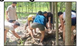
गोशाला दल पदाधिकारियों ने क्षेत्रवासियों से अपील की है कि गोशाला के घायल गाय को सुरक्षा ली जाए। घायल गाय को उपचार के लिए गोशाला भिजवाया।

शाह टाइम्स संवाददाता चिलकाना। आवाग कुत्तों के झुंड ने गाय पर हमला कर गंभीर रूप से घायल कर दिया। गोशाला दल के कार्यकर्ताओं ने मौके पर पहुंचकर गाय को गोशाला भिजवाया। बता दें कि चिलकाना क्षेत्र में आवाग कुत्तों का अनेक लगातार बढ़ता जा रहा है। जो आये दिन गोशाला को अपना शिकार बना रहे हैं। आज हमसेवा भोलादेवी मार्ग पर आवाग कुत्तों ने एक गाय पर हमला कर उसे गंभीर रूप से घायल कर दिया। घटना की सूचना मिलते ही गौ रक्षा दल के कार्यकर्ताओं ने मौके पर पहुंचकर घायल गाय को उपचार के लिए गोशाला भिजवाया।