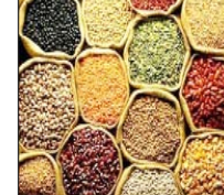
तेल 20 रुपये फिसल गया। वहीं, वनस्पति 35 रुपये और सोया तेल 29 रुपये महंगा हो गया। मीठे के बाजार में बीते सप्ताह गड़ का औसत भाव 30 रुपये प्रति क्विंटल चढ़ गया। वहीं, चीनी आठ रुपये प्रति क्विंटल सस्ती हुई। थोक भाव शनिवार को इस प्रकार रहे, दाल, दलहन: दाल चना 7666.28 रुपये, मसूर काली 8080.32 रुपये, मूंग दाल 10185.98 रुपये, उड़द दाल 10844.96 रुपये, तुअर दाल 11199.44 रुपये प्रति क्विंटल रही। अनाज: (भाव प्रति क्विंटल) गेहूं दड़ा 2772.87 रुपये और चावल 3829.05 रुपये प्रति क्विंटल और आटा (गेहूं) 3256.12 रुपये प्रति क्विंटल रहा।

नई दिल्ली, वार्ता घरेलू थोक जिन बाजारों में बीते सप्ताह चावल का औसत भाव बढ़ गया। वहीं, गेहूं और चीनी में गिरावट रही जबकि खाद्य तेलों और दालों में उतार-चढ़ाव देखा गया। सप्ताह के दौरान चावल की औसत कीमत 68 रुपये बढ़कर सप्ताहांत पर 3,829 रुपये प्रति क्विंटल पर पहुंच गई। गेहूं 12 रुपये सस्ता हुआ और 2,773 रुपये प्रति क्विंटल बोला गया। आटे का भाव भी 34 रुपये घटकर 3,256 रुपये प्रति क्विंटल रह गया। सप्ताह के दौरान मूंग दाल की औसत कीमत 24 रुपये प्रति क्विंटल बढ़ गई। चना दाल 22 रुपये और तुअर दाल पांच रुपये प्रति क्विंटल महंगी हुई। उड़द दाल पांच रुपये सस्ती हुई। मसूर दाल की कीमत लगभग अपरिवर्तित रही। बीते सप्ताह मूंगफली तेल 115 रुपये और पाम ऑयल 82 रुपये प्रति क्विंटल सस्ता हुआ। सरसों तेल 50 रुपये और सूरजमुखी तेल 20 रुपये फिसल गया। वहीं, वनस्पति 35 रुपये और सोया तेल 29 रुपये महंगा हो गया। मीठे के बाजार में बीते सप्ताह गड़ का औसत भाव 30 रुपये प्रति क्विंटल चढ़ गया। वहीं, चीनी आठ रुपये प्रति क्विंटल सस्ती हुई। थोक भाव शनिवार को इस प्रकार रहे, दाल, दलहन: दाल चना 7666.28 रुपये, मसूर काली 8080.32 रुपये, मूंग दाल 10185.98 रुपये, उड़द दाल 10844.96 रुपये, तुअर दाल 11199.44 रुपये प्रति क्विंटल रही। अनाज: (भाव प्रति क्विंटल) गेहूं दड़ा 2772.87 रुपये और चावल 3829.05 रुपये प्रति क्विंटल और आटा (गेहूं) 3256.12 रुपये प्रति क्विंटल रहा।