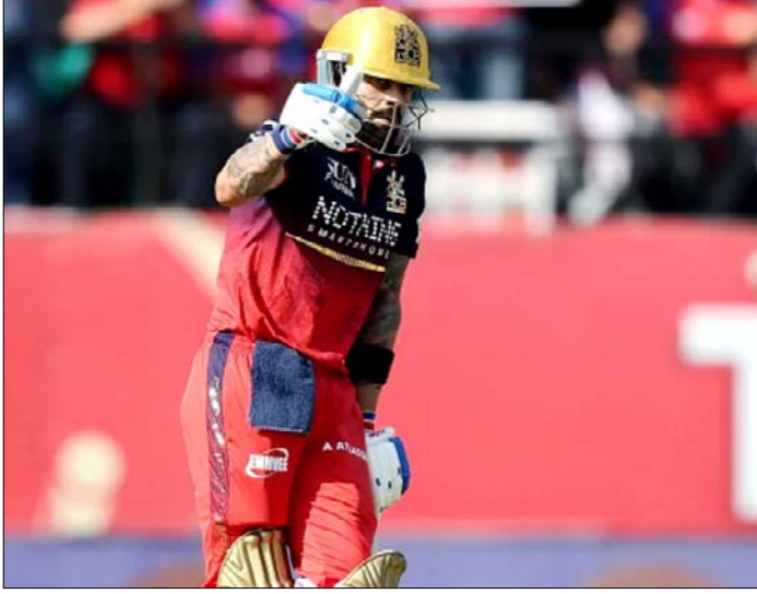
विराट कोहली ने मनाया अपना अर्धशतक।

जवाब में पंजाब 8 विकेट खोकर 199 रन ही बना सकी। इस जीत के साथ बैंगलुरु के 18 पाइंट्स हो गए और टीम इस सीजन में प्लेऑफ में पहुंचने वाली पहली टीम बन गई। वहीं, पंजाब की यह लगातार छठी हार रही। पंजाब की शुरुआत बेहद खराब रही और उसने 19 रन तक 3 विकेट गंवा दिए। बाद में कूपर कोनोली, मार्कस स्टोयनिस और शशांक सिंह ने संघर्ष जरूर