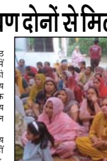
नगरी और समस्त धन संपत्ति जलकर खाक हो गई, रावण की मृत्यु पर कोई रोने वाला ही नहीं बचा था। उन्होंने कहा कि आज का मानव रावण से शक्तिशाली नहीं हो सकता फिर क्या शक्ति प्राप्त कर उसका दुरुपयोग किया है उनका हथ श्रेष्ठ कि कोई घर नहीं आ सकता कोई घर से