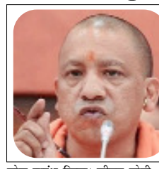
सहजनवा विस क्षेत्र स्थित तेनुआ टोल प्लाजा के समीप एक रिजॉर्ट में भाजपा के जिला प्रशिक्षण वर्ग के उद्घाटन सत्र को संबोधित करते हुए बोले सीएम योगी

गोरखपुर, वार्ता यूपी के मुख्यमंत्री योगी आदित्यनाथ ने कहा है कि राष्ट्रवाद के भाव से आचरण ही भारतीय जनता पार्टी कार्यकर्ता की पहचान है। उन्होंने कहा कि 26 नवम्बर 1949 को भारत का संविधान निर्मित हुआ और 26 जनवरी 1950 को भारत ने अपना संविधान अंगीकार किया। देश में संसदीय प्रणाली लागू हुई पर, अभी पहला आम चुनाव भी नहीं हुआ कि कांग्रेस ने तृष्टिकरण के जिन कारणों से देश का विभाजन हुआ था, उसे ही फिर से भारत की राजनीति का हिस्सा बनाना प्रारंभ कर दिया। अभी संविधान टीक ढंग से लागू होना प्रारंभ ही नहीं हुआ कि कांग्रेस ने तृष्टिकरण का खेल प्रारंभ किया। सीएम योगी रिवार को गोरखपुर के सहजनवा विधानसभा क्षेत्र स्थित तेनुआ टोल प्लाजा के समीप एक रिजॉर्ट में भाजपा के जिला प्रशिक्षण वर्ग के उद्घाटन सत्र को संबोधित कर रहे थे। उन्होंने कहा कि भाजपा का कार्यकर्ता पार्टी के संस्थापकों के मूल्यां और आदर्शों पर चलते हुए देश की एकता और अखंडता के लिए शुचिंता और पारदर्शिता से आचरण और तदनुसृत कार्य करता है। कांग्रेस, सपा, राजद, टीएमसी, डीएमके या ऐसे ही राष्ट्रीय आदर्शों के अभाव में भाजपा को सम्मान नहीं देता है, भाजपा कार्यकर्ता को समाज में सम्मान इसलिए मिलता है कि इस पार्टी कार्यकर्ता के आचरण में राष्ट्रवाद और भारतीयता का आचरण मिलता। मुख्यमंत्री ने पंडित दीनदयाल उपाध्याय प्रशिक्षण स्थित तेनुआ टोल प्लाजा के समीप एक रिजॉर्ट में भाजपा के जिला प्रशिक्षण वर्ग के उद्घाटन सत्र को संबोधित करते हुए बोले सीएम योगी