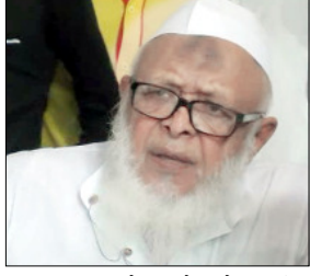
इस्लाम को मिटाने वाले खुद ही मिट गए: जमीयत उलेमा ए हिंद