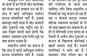
है कि प्रशासन को इस प्रभु मामलों की गंभीरता से जांच करनी चाहिए। यदि बिना लाइसेंस और नियमों के पशु कटान हो रहा है तो यह न केवल कानून व्यवस्था बल्कि स्वास्थ्य मामलों के लिए भी बड़ा खतरा बन सकता है। हाल ही में परिषदों उतर प्रदेश के कई जिलों में अनेक मीट दुकानों और कटान के खिलाफ कार्रवाई की खबरें सामने आई हैं। स्थानीय नागरिकों ने मांग की है कि प्रशासन टीम गठित कर मीट सप्लाई के तरीके जांच करे, दुकानों के लाइसेंस सत्यापित किए जाएं और अनेक कटान एवं जांच पर कड़ी कार्रवाई हो। अब देखने वाली बात होगी कि शासन-प्रशासन इस गंभीर मुद्दे पर क्या कदम उठाता है।

गोंगा। नगर और आसपास के क्षेत्रों में इन दिनों मीट कारोबार को लेकर कई सवाल उठ रहे हैं। क्षेत्र में कोई अधिकृत स्टॉलर हाउस संचालित नहीं है, इसके बावजूद बच्ची माग में मीट बाजार और दुकानों तक पहुँच रहा है। अब देखने वाली बात होगी कि शासन-प्रशासन इस गंभीर मुद्दे पर क्या कदम उठाता है। स्थानीय लोगों का कहना है कि क्षेत्र में कोई अधिकृत स्टॉलर हाउस संचालित नहीं है, इसके बावजूद बच्ची माग में मीट बाजारों और दुकानों तक पहुँच रहा है। ऐसे में सवाल खड़ा हो रहा है कि अधिकृत यह मीट कहाँ से आ रहा है? क्षेत्रवासियों ने आश्चर्य व्यक्त है कि कहाँ अनेक कटान का खेल तो नहीं चल रहा। लोगों का कहना