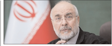
ढल रहा पश्चिमी देशों का वर्चस्व: गालिबाफ पेज 12