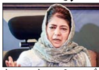
से खुलने चाहिए और जम्मू-कश्मीर से सुलह-सफाई की प्रक्रिया फिर से शुरू होनी चाहिए। उन्होंने नियंत्रण रेखा के पार व्यापार और यात्रा को फिर से शुरू करने का आह्वान किया, जिसमें विशेष रूप से मुजफ्फराबाद, उरी और रावलकोट के व्यापारियों को शामिल करने की बात कही गई। उन्होंने विश्वास बहाली के उपाय के तौर पर ईद से पहले हिरासत में लिए गए लोगों की रिहाई की मांग की। सुश्री मुफ्ती ने नागरिक क्षेत्रों में सुरक्षा बलों की मौजूदगी कम करने और एनएचपीसी को सौंपे गए विजली प्रोजेक्ट्स को वापस लौटाने की भी मांग की।

श्रीनगर, वार्ता पीपुल्स डेमोक्रेटिक पार्टी (पीडीपी) की अध्यक्ष महबूबा मुफ्ती ने रिवार को पाकिस्तान के साथ नए सिरे से बातचीत की पुर्जोर वकालत की। उन्होंने जम्मू-कश्मीर के लोगों के साथ जुड़ने की सलाह करते हुए कहा कि अब समय आ गया है जब इस क्षेत्र के जख्मों को भर जाए और लोगों के बीच विश्वास बहाल किया जाए। श्रीमती मुफ्ती ने श्रीनगर में संवाददाताओं से बातचीत करते हुए पाकिस्तान के साथ बातचीत के आशय को भी स्पष्ट किया। उन्होंने कहा कि प्रारंभिक जांच में सामने आया है कि आरोपी विदेश में बैठे एक हेंडलर के निर्देशों पर काम कर रहे थे।