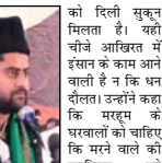
को दिली सुकून मिलता है। यही चीज आखिरत में इंसान के काम आने वाली है। न कि धन दौलत। उन्होंने कहा कि मरूम को बखाली को चाहिए कि मरने वाली को मारफिरत करआन की जितनाज करत, मरौती की मरत कर, पुरां को खाना खिलाएं, वे सहाज को को सहाज देने का काम करे जिक मरूम को राह आसान हो सके। मजलिस में निजानत अजावर, मरिफिया खानी तावीर हुदैन व गाजी ने की। सोमार तमाम अहली अहवाल, बियावर के लोग व अजीब रिश्तेदार रहे।

चिलकाना। बड़े इमाम बाराह मजहर कब्राला में संदेह देवता हेतु एक मजलिस का आयोजन किया गया। रिवार को मोहल्ला होमिद हसन स्थित बड़े इमाम बाराह में आयोजित मजलिस को खिजाज करते हुए मोहल्ला सैयद इंदर मोहम्मद बराह, मीने शहाज कि ईसाज को खिजाज कि बह गृह और बहूई के रास्ते से बकर अहमद के रास्ते पर चले। अल्लाह की खुब बदाहत जैसे कि नमाज गन आदि करे। वहीं खुश, सरका व जकात देहा रहे। उन्होंने बताया कि बदाहत ही एक ऐसी चीज है जिससे ईसाज