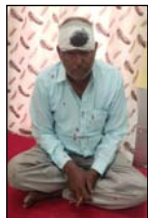
घायलों को सीएचसी ले जाया गया वहीं पुलिस ने ट्रक को कब्जे में लेकर कार्रवाई शुरू कर दी।

शाह टाइम्स संवाददाता नवीना। हरिद्वार जा रहे श्रद्धालुओं के वाहन से ट्रक कि जोरदार टक्कर होने से एक महिला श्रद्धालु की मौत हो गई जबकि दर्जनों श्रद्धालु घायल हो गए। घायलों को सीएचसी ले जाया गया वहीं पुलिस ने ट्रक को कब्जे में लेकर कार्रवाई शुरू कर दी।