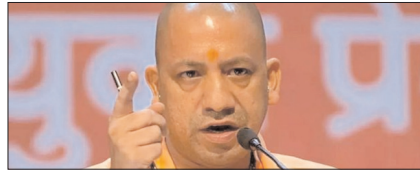
राष्ट्रवाद के भाव से आचरण ही भाजपा कार्यकर्ता की पहचान: योगी पेज 2