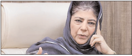
कश्मीर के लिए संवाद ही एकमात्र रास्ता : महबूबा मुफ्ती पेज 2

नई दिल्ली, मुजफ्फरनगर, देहरादून, हल्द्वानी, मुरादाबाद, बरेली, मेरठ व लखनऊ से प्रकाशित