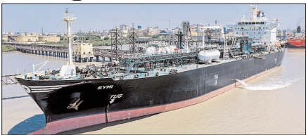
शाह टाइम्स ब्यूरो

नई दिल्ली। पश्चिम एशिया में जारी भारी तनाव के बीच भारत के लिए रूसी गैस की आपूर्ति को लेकर अच्छी खबर आई है। मारशल आईलैंड्स के झंडे वाला एलपीजी मालवाहक जहाज 'सिमी' रविवार सुबह गुजरात के कांडला स्थित दीनदयाल बंदरगाह पर सफलतापूर्वक पहुंच गया।