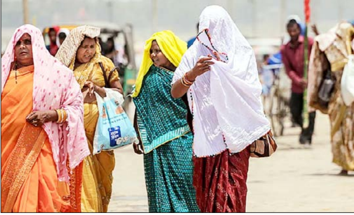
प्रयागराज। भीषण गर्मी के बीच सिर पर पल्लू डालकर तेज धूप से खुद को बचाती महिलाएं।