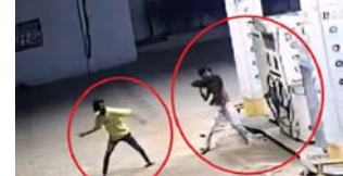
कर उनको तलाश शुरू कर दी है। तोड़फोड़ की इस घटना में करीब 50 हजार रुपये के नुकसान का बिल सामने आये हैं। पुलिस अधिकारियों का कहना है कि बरामद वीडियो और सोसिटीवी फुटेज के आधार पर बरामद की गयी है और सोसिटीवी फुटेज के आधार पर आरोपियों को पकड़ना जाएगा।