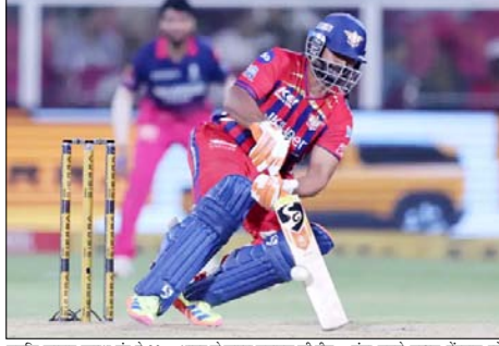
जबकि कप्तान ऋषभ पंत ने 23 गेंदों में 35 रन की तेज पारी खेली। आखिरी ओवरों में लगातार रन आउट के कारण लखनऊ की टीम 230 के पार नहीं पहुंच सकी। राजस्थान की ओर से यश राज पुंजा सबसे सफल गेंदबाज रहे। उन्होंने 4 ओवर में 35 रन देकर 2 विकेट लिए। जोष आंचर को एक विकेट मिला। वहाँ, लखनऊ के दो बल्लेबाज रन आउट हुए। आखिरी ओवर में राजस्थान रायल्स ने शानदार वापसी करते हुए लखनऊ सुपर जायंट्स को लगातार झटके दिए। ओवर की पहली गेंद पर ऋषभ पंत रन आउट हो गए। पंत स्ट्राइक अपने पास रखना चाहते थे, लेकिन मिचेल मार्श ने उन्हें बायस भेज दिया। ऋषभ जुरेल के ब्री पर जोष आंचर ने सीधे स्ट्रेप पर गिराया था और पंत 23 गेंदों में 35 रन बनाकर रन आउट हो गए। पंत स्ट्राइक अपने पास रखना चाहते थे, लेकिन मिचेल मार्श ने उन्हें बायस भेज दिया। ऋषभ जुरेल के ब्री पर जोष आंचर ने सीधे स्ट्रेप पर गिराया था और पंत 23 गेंदों में 35 रन बनाकर रन आउट हो गए। पंत स्ट्राइक अपने पास रखना चाहते थे, लेकिन मिचेल मार्श ने उन्हें बायस भेज दिया। ऋषभ जुरेल के ब्री पर जोष आंचर ने सीधे स्ट्रेप पर गिराया था और पंत 23 गेंदों में 35 रन बनाकर रन आउट हो गए।

आखिरी ओवरों में राजस्थान ने लखनऊ को बड़े स्कोर से रोका जयपुर, वार्ता। आईपीएल में लखनऊ सुपर जायंट्स ने राजस्थान रायल्स को 221 रन का टारगेट दिया है। जयपुर के सवाई रामचंद्र स्टेडियम में राजस्थान ने जीतकर बालिंग चुनी। लखनऊ ने 20 ओवर में 5 विकेट खोकर 220 रन बनाए। लखनऊ के लिए मिचेल मार्श शतक से चूके 96 रन दूर रह गए और 57 गेंदों में 96 रन बनाकर रन आउट हुए। उनकी पारी में 11 चौके और 5 छक्के शामिल रहे।