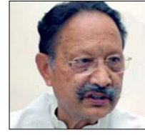
काफी समय से मैक्स अस्पताल में चल रहा था इलाज, सीएम धामी ने जताया दुख

शाह टाइम्स ब्यूरो देहरादून। उत्तराखंड के पूर्व मुख्यमंत्री भुवन चंद्र खंडूजी का मंगलवार को निधन हो गया। वे काफी समय से अस्वस्थ होने के कारण देहरादून के मैक्स अस्पताल में भर्ती थे। सीएम पुष्कर सिंह धामी ने पूर्व मुख्यमंत्री के निधन पर शोक व्यक्त किया है। देहरादून स्थित मैक्स सुपर स्पेशलिस्ट हॉस्पिटल में उनका पिछले तकररीन एक माह से इलाज चल रहा था। बताया जा रहा है कि खंडूजी हृदय संबंधी दिक्कतों से जूझ रहे थे। 91 साल की उम्र में उनका निधन हुआ। वे