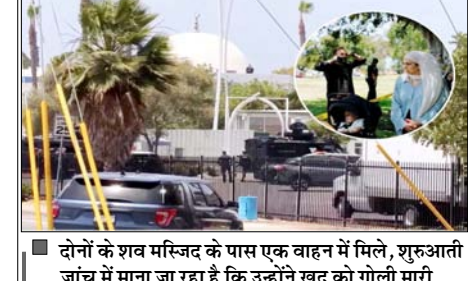
दोनों के शव मस्जिद के पास एक वाहन में मिले, शुरुआती जांच में माना जा रहा है कि उन्होंने खुद को गोली मारी

वाशिंगटन। अमेरिका के सैन डिएगो स्थित मस्जिद में गोलीबारी में 5 लोगों की मौत हो गई। इनमें एक सिक्सोरीटी गार्ड और दो संदिग्ध शामिल हैं। पुलिस के मुताबिक, दोनों संदिग्ध किशोर थे। एक की उम्र 17 साल और दूसरे की 19 साल थी। दोनों के शव मस्जिद के पास एक वाहन में मिले। शुरुआती जांच में माना जा रहा है कि उन्होंने खुद को गोली मारी। इस मामले की जांच हेतु फ्रांसिस के एंगल से की जा रही है। हालांकि, हमले के पीछे की वजह पर फिलहाल ज्यादा जानकारी शेर नहीं की गई है। यह हमला इस्लामिक सेंटर ऑफ सैन डिएगो में हुआ। यह सैन डिएगो काउंटी की सबसे बड़ी मस्जिद है। परिसर में एक स्कूल भी है, जहां बच्चों को अरबी भाषा, इस्लामिक