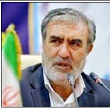
द टेलीग्राफ की रिपोर्ट के मुताबिक 500 करोड़ से ज्यादा का इनाम दे सकता है ईरान ईरानी संसद का राष्ट्रीय सुरक्षा आयोग इस बिल की तैयारी कर रहा है

तेहरान/वाशिंगटन। ईरान की संसद अमेरिकी राष्ट्रपति डोनाल्ड ट्रम्प और इजराइली प्रधानमंत्री बेंजामिन नेतन्याहू की हत्या करने वालों को 500 करोड़ से ज्यादा इनाम देने वाला बिल ला सकती है। द टेलीग्राफ की रिपोर्ट के मुताबिक, ईरानी संसद का राष्ट्रीय सुरक्षा आयोग इस बिल की तैयारी कर रहा है। आयोग के प्रमुख इब्राहिम अजीजी ने कहा कि 'इस्लामिक रिपब्लिक की सैन्य और सुरक्षा बलों की जवाबी कार्रवाई' नाम से बिल तैयार किया जा रहा है। ईरानी संसद महमूद नवाविजन ने कहा कि संसद जल्द इस बिल पर वॉटिंग कर सकती है, जो ट्रम्प और नेतन्याहू को जहन्यम पहुंचाने वालों को इनाम देगा। रिपोर्ट में कहा गया है कि ईरान के सर्वोच्च