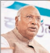
मल्लिकार्जुन खड़गे, कांग्रेस अध्यक्ष

सरकार ने 15 मई के बाद आज सुबह अचानक फिर पेट्रोल और डीजल के दाम बढ़ा दिए, अब स्पष्ट हो गया है कि देश संकट में है और श्री मोदी को इसका जवाब देना चाहिए, दाम बढ़े चार ही दिन हुए कि मोदी सरकार ने पेट्रोल-डीजल के दाम फिर बढ़ा दिए, पूरी भूमिका बनाकर, बचत का उपदेश देकर अपनी नाकामियों का बोझ जनता पर डालने का कार्य प्रगति पर है, आम जनता की लूट और उद्योग पति गौतम अडानी को अमेरिका से छूट, यही मोदी जी का कम्प्रोमाइज्ड मॉडल है। प्रधानमंत्री ने अमेरिका से हाथ-पैर जोड़कर रूसी तेल खरीदने की अनुमति की अर्थात् एक महीने के लिए बढ़वाई है और इससे देश के स्वाभिमान को ठेस पहुंची है। उन्होंने कहा कि यदि सरकार के अनुसार रूसी तेल खरीदने की अनुमति मिल गई है, तो पेट्रोल-डीजल की कीमतों का बोझ आम जनता पर क्यों डाला जा रहा है।