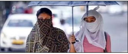
उत्तर प्रदेश में प्रचंड गर्मी से आम जनजीवन प्रभावित

नई दिल्ली, मुजफ्फरनगर, देहरादून, हल्द्वानी, मुरादाबाद, बरेली, मेरठ व लखनऊ से प्रकाशित