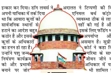
7 नवम्बर 2025 के अपने आदेश में बदलाव और उसे वापस लेने की मांग वाली सभी याचिकाओं को सुप्रीम कोर्ट ने खारिज कर दिया।

शाह टाइम्स ब्यूरो नई दिल्ली। सुप्रीम कोर्ट ने आवादा कुत्तों के पुनर्वास और नसबंदी से जुड़े 7 नवम्बर 2025 के अपने आदेश में बदलाव और उसे वापस लेने की मांग वाली सभी याचिकाओं को खारिज कर दिया है। शीर्ष अदालत ने भारतीय पशु कल्याण बोर्ड (एडव्यूबीआई) द्वारा आवादा जानवरों को लेकर जारी मानक संचालन प्रक्रिया (एसओपी) की वैधता को चुनौती देने वाली याचिकाएँ भी खारिज कर दीं। जस्टिस विक्रम नाथ, जस्टिस संदीप मेहता और जस्टिस एनवी अंजारिया की पीठ ने सुनवाई की। अदालत ने शैक्षणिक संस्थानों, बस स्टैंडों, रेलवे स्टेशनों, खेल परिसरों, अस्पतालों आदि जगहों से आवादा कुत्तों को हटाने के अपने फैसले को चुनौती देने वाले याचिकाओं को खारिज कर दिया है। अदालत ने नाराजगी जाहिर करते हुए कहा कि आवादा कुत्तों को बढ़ती आबादी से निपटने के लिए राज्यों और केंद्रशासित प्रदेशों को और से लंबे समय तक टोस प्रयास नहीं किए जा सकते, जहाँ बच्चे, यात्री और