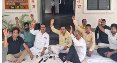
प्रकरण की निष्पत्ति जांच कराई जाए और जांच पूरी होने तक संबंधित अधिकारी को पदमुक्त