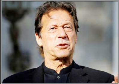
इमरान खान ने 24 फरवरी 2022 को मास्को में रूसी राष्ट्रपति व्लादिमीर पुतिन से मुलाकात की थी मुलाकात के बाद ठीक उसी दिन रूस ने यूक्रेन पर हमला शुरू किया था

इस्लामाबाद/वाशिंगटन। पाकिस्तान के पूर्व प्रधानमंत्री इमरान खान की सरकार गिरने को लेकर नया दावा सामने आया है। अमेरिकी मीडिया आउटलेट ड्रॉप साइट न्यूज की रिपोर्ट में कहा गया है कि इमरान को कुर्सी सिर्फ अविश्वास प्रस्ताव से नहीं गई थी। इसके पीछे अमेरिकी साजिश और पाक सेना की भूमिका थी। रिपोर्ट के मुताबिक, इमरान खान ने 24 फरवरी 2022 को मास्को में रूसी राष्ट्रपति व्लादिमीर पुतिन से मुलाकात की थी। ठीक उसी दिन रूस ने यूक्रेन पर हमला शुरू किया था। अमेरिका इस यात्रा से नाराज था। वह चाहता था कि पाकिस्तान यूक्रेन युद्ध पर रूस की खुलकर आलोचना करे, लेकिन इमरान सरकार ने तटस्थ रुख अपनाया।