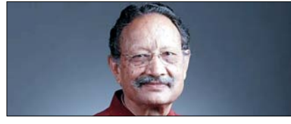
भुवन चंद्र खंडूजी का निधन: उत्तराखंड की सियासत के एक युग का अंत