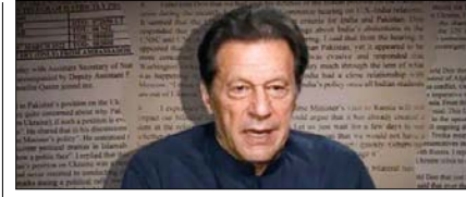
अमेरिकी साजिश थी इमरान खान का तख्तापलट