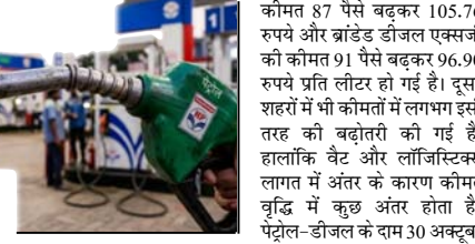
पेट्रोल 98.64 व डीजल 91.58 रुपये में एक लीटर मिलेगा

पेट्रोल 87 पैसे व डीजल के दामों में 91 पैसे प्रति लीटर की वृद्धि