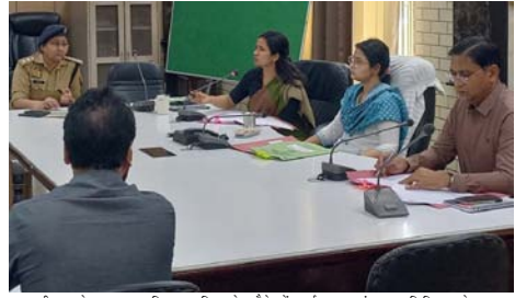
नाराजगी जाता है, कहा कि प्लास्टिक वेस्ट मैनेजमेंट पर्यावरण संरक्षण अभियान को अनुरूप

सापेक्ष शाह-प्रतिशत भूमि विकास और अभियान समूह सम्यक् से पूरा करने के निर्देश दिए। साथ ही जनपद में विशिष्ट वन स्थापित करने की योजना पर भी जोर देते हुए अधिकारियों से निर्धारित प्रारूप में वृक्षारोपण कार्ययोजना शीघ्र प्रस्तुत करने को कहा। बैठक में बढ़ती गंभीर और होट वेव को देखते हुए जिलाधिकारी ने सभी विभागों को अपने कार्यालयों एवं कार्यस्थलों पर लू से बचाव के पर्याप्त इंतजाम सुनिश्चित करने के निर्देश दिए। उन्होंने पशु-पक्षियों के निपटारे भी उपाय-योजनाएं और होर कारनर उभरने वाली प्रकृतियों की व्यवस्था करने को कहा। पर्यावरण संप्रदाय को लेकर जिलाधिकारी ने सख्त