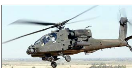
भारतीय सैन्य ताकत होगी और मजबूत

वाशिंगटन, वार्ता भारत और अमेरिका के बीच रक्षा सहयोग लगातार मजबूत होता जा रहा है। इसी कड़ी में अमेरिका ने भारत को अपाचे हेलीकॉप्टर और एम777ए2 अल्ट्रा-लाइट हॉवित्जर तोपों के लिए सपोर्ट सर्विस और संबंधित उपकरणों की संभावित बिक्री को मंजूरी दे दी है। अमेरिकी विदेश विभाग ने इस फैसले की आधिकारिक जानकारी दी। अमेरिका के अनुसार, अपाचे हेलीकॉप्टरों के लिए सपोर्ट सर्विस डील की अनुमानित कीमत करीब