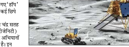
वैज्ञानिक आधार और आवास निर्माण की योजनाओं के लिए आवश्यक है। यह अध्ययन इस प्रकार का पहला अतृट उदाहरण है। उल्लेखनीय है कि चंद्रयान-3 का विक्रम लैंडर

चेन्नई। भारत के तीसरे चंद्र मिशन चंद्रयान-3 के विक्रम लैंडर द्वारा किए गए 'हॉप' प्रयोग के दक्षिणी ध्रुव से जुड़े कई छिपे रहस्यों का खुलासा किया है। वैज्ञानिकों ने इस प्रयोग के जरिये चंद्र सतह की रेगोलिथ विषयमता (रेगोलिथ हेटेरोजेनिटी) का पता लगाया है, जो भविष्य के चंद्र अभियानों के लिए बेहद महत्वपूर्ण माना जा रहा है। इन निष्कर्षों से चंद्रमा के दक्षिणी ध्रुवीय क्षेत्र में सतही अभियानों को लेकर नई जानकारी मिली है। वैज्ञानिकों का कहना है कि स्थानीय स्तर पर सतह की विविधता को समझना भविष्य में चंद्रमा पर