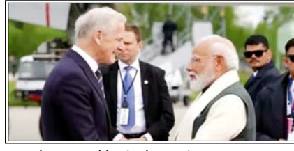
व्यापार और संस्थागत सहयोग के तहत भी कई महत्वपूर्ण समझौतों को अंतिम रूप दिया गया

ओस्लो। भारत और नार्वे ने द्विपक्षीय संबंधों को नई दिशा देते हुए अपने संबंधों को ग्रीन स्ट्रेटजिक पार्टनरशिप के स्तर तक उन्नत करने के साथ-साथ समुद्री सहयोग, हरित प्रौद्योगिकी, अंतरिक्ष, स्वास्थ्य, डिजिटल विकास और वैज्ञानिक अनुसंधान सहित कई क्षेत्रों में सहयोग को मजबूत करने के उद्देश्य से नौ समझौतों और तीन पहलों की घोषणा की है।