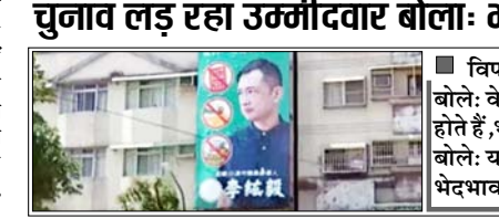
विपक्षी सांसद बोले: वे अपराधी होते हैं, भारतीय बोले: यह नस्लीय भेदभाव है