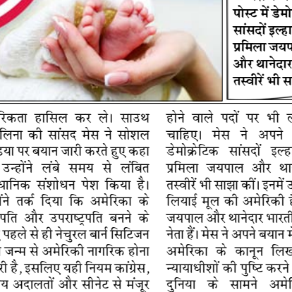
मेस ने अपने पोस्ट में डेमोक्रेटिक सांसदों इल्हान उमर, प्रमिला जयपाल और थानेदार की तस्वीरें भी साझा कीं

वाशिंगटन। अमेरिका में प्राकृतिक रूप से नागरिकता हासिल करने वाले लोगों के अधिकारों को लेकर नई बहस छिड़ गई है। रिपब्लिकन सांसद नैन्सी मेस ने एक संवैधानिक संशोधन प्रस्ताव पेश किया है, जिसमें प्राकृतिक रूप से अमेरिकी नागरिक बने लोगों को कांग्रेस सदस्य, संघीय न्यायाधीश और सीनेट की पुष्टि वाले महत्वपूर्ण पदों पर नियुक्त होने से रोकने की मांग की गई है। इस प्रस्ताव को लेकर डेमोक्रेटिक नेताओं ने तीखी प्रतिक्रिया दी है और इसे नस्लवादी, घृणित और विदेशी मूल के लोगों के खिलाफ बताया है। प्राकृतिक रूप से नागरिकता का मतलब है कि कोई व्यक्ति जन्म से उस देश का नागरिक न हो, लेकिन बाद में कानूनी प्रक्रिया पूरी करके उस देश की