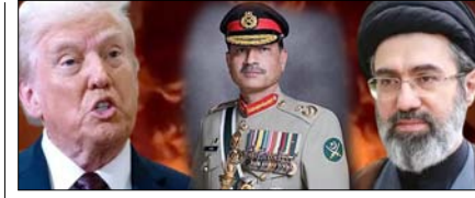
पाकिस्तान के जरिये अमेरिका का नया युद्ध विराम प्रस्ताव पेज 12