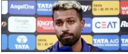
हार्दिक पंड्या पर मैच फीस का 10 फीसदी जुमाना खेल टाइम्स