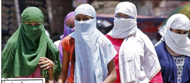
बांदा से ज्यादा तापमान मिस्त्र के असवान में 49.4 डिग्री और सऊदी के अराफात में 48.4 डिग्री सेल्सियस रहा

दुनियाभर में सबसे ज्यादा तापमान वाले टॉप-5 शहरों में खजुराहो 47.4 डिग्री सेल्सियस के साथ चौथे नंबर पर रहा। इधर, बलरामपुर में भीषण गर्मी के कारण कस्तूरबा गांधी आवासीय विद्यालय में पढ़ाई के दौरान 8 छात्राएं बेहोश हो गईं। सभी को उल्टी, सिरदर्द और बेहोशी जैसी शिकायतें -शेष पृष्ठ दो पर