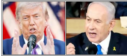
कतर, सऊदी अरब और यूएई जैसे खाड़ी देशों की अपील पर यह फैसला लिया गया: ट्रम्प

नेल अवीव/वाशिंगटन। ईरान युद्ध को लेकर अमेरिकी राष्ट्रपति डोनाल्ड ट्रम्प और इजरायली प्रधानमंत्री बेजायिन नेतन्याहू के बीच मतभेद खुलकर सामने आ गए हैं। एक रिपोर्ट के मुताबिक, नेतन्याहू चाहते हैं कि ईरान पर हमले जारी रहें, जबकि ट्रम्प फिलहाल बातचीत और डील को मौका देना चाहते हैं। रिपोर्ट के मुताबिक, मंगलवार को दोनों नेताओं के बीच करीब एक घंटे तक फोन पर बातचीत हुई। अमेरिकी अधिकारी ने बताया कि नेतन्याहू ने ट्रम्प से कहा कि ईरान पर प्रस्तावित हमले रोकना गलती है और सैन्य कार्रवाई जारी रहनी चाहिए। ट्रम्प ने नेतन्याहू को बताया था कि अमेरिका ईरान पर नए टारगेट हमले की तैयारी कर रहा है। इस ऑपरेशन को 'ऑपरेशन स्लेजहैमर' नाम दिया जाना था, लेकिन करीब 24 घंटे बाद ट्रम्प ने घोषणा कर दी कि मंगलवार के लिए तय हमलों को फिलहाल रोक दिया गया है। ट्रम्प ने कहा कि कतर, सऊदी अरब और यूएई जैसे खाड़ी देशों को