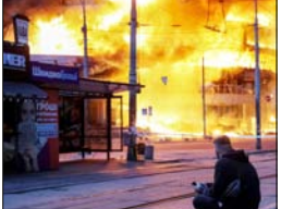
यह हमला यूक्रेनी हमलों के जवाब में किया गया: रूस

चार मरे, मिसाइल परमाणु हथियार ले जाने में सक्षम, जेलोस्की बोले: रूसी पागल हो चुके हैं कीव। रूस ने रविवार को यूक्रेन पर कई मिसाइलों और ड्रोनों से हमला किया जिसमें कम से कम 4 लोगों की मौत हो गई और कई दर्जन लोग घायल हैं। हमलों का निशाना यूक्रेन की राजधानी कीव के आसपास के इलाके थे। रूस ने कहा कि यह हमला यूक्रेनी हमलों के जवाब में किया गया। रूसी रक्षा मंत्रालय के मुताबिक हमलों में ओरेलिनक हाइपरसोनिक मिसाइल का भी इस्तेमाल हुआ। यह मिसाइल परमाणु हथियार ले जाने में भी सक्षम है। यूक्रेन राष्ट्रपति वोलोदिमिर जेलोस्की ने रूस पर जानबूझकर नागरिक इलाकों को निशाना बनाने का आरोप लगाया। उन्होंने टेलीग्राम पर लिखा कि रूसी हमलों में पानी सप्लाई करने वाली एक फैसिलिटी को नुकसान पहुंचा, एक बाजार जल गया और कई घरों व स्कूलों पर हमला