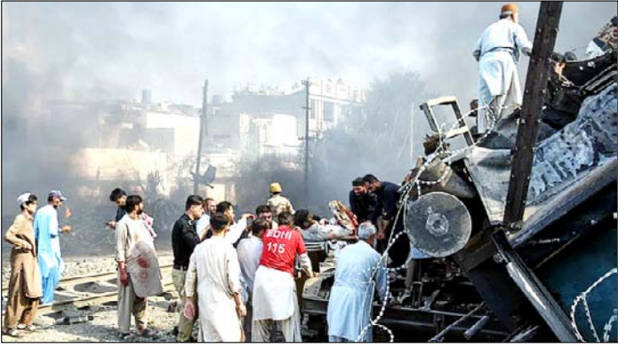
पाकिस्तान। क्वेटा में बम विस्फोट स्थल पर रेलवे ट्रैक पर पलटी हुई ट्रेन के डिब्बे से घायल व्यक्ति को बाहर निकालते पुलिस अधिकारी और स्वयंसेवक।

खालिस्तानी गतिविधियों ने सिख समुदाय की छवि को पहुंचाया नुकसान ओटावा। खालिस्तानी गतिविधियों ने पिछले कुछ वर्षों में दुनिया भर में सिख समुदाय की अच्छी छवि को काफी नुकसान पहुंचाया है। एक नई रिपोर्ट में बताया गया कि, विदेशों में होने वाले हिंसक प्रदर्शनों, भारत विरा, धी नारां और धार्मिक स्थलों के बाहर उग्र विरोध ने पूरी दुनिया में विवाद पैदा किया है। कट्टरपंथी तत्वों ने अलगाववादी अभियानों के जरिए माहौल खराब किया है। खालसा वाक्सर की एक रिपोर्ट के अनुसार, हाल के वर्षों में कनाडा, ब्रिटेन, अमेरिका और ऑस्ट्रेलिया जैसे देशों में ऐसी कई घटनाएं सामने आई हैं। इन देशों में खालिस्तान समर्थक समूह लोकतांत्रिक आजादी का बहाना बनाकर कट्टरपंथ और उग्रवाद को बढ़ावा दे रहे हैं।