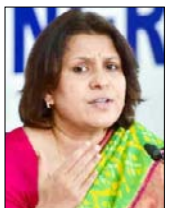
—सुप्रिया श्रीनेत, चैयरेमैन, कांग्रेस सोशल मीडिया विभाग

उप्र के सभी 75 जिलों में बिजली कटौती से विकराल स्थिति उत्पन्न हो गई है, जनता तकलीफें झेलने को मजबूर है, देश के 50 सबसे गर्म शहरों में से 26 शहर उत्तर प्रदेश के हैं, लेकिन भीषण गर्मी के बीच लोगों को 24 घंटे में केवल सात-आठ घंटे ही बिजली मिल पा रही है, मेरठ से लेकर बलिया तक लोग बिजली संकट से परेशान हैं और कई जगहों पर लोग रात में घरों से निकलकर सड़कों पर सोने को मजबूर हैं, राजधानी लखनऊ तक में घंटों बिजली गुल रहने से अस्पतालों की सेवाएं प्रभावित हो रही हैं, एक्स-रे और स्कैन जैसी सुविधाएं ठप पड़ गई हैं, कानपुर देहात के मेडिकल कॉलेज के छात्रों को देर रात तक बिजली नहीं मिलने के कारण घर पर बैठना पड़ा।