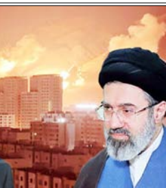
ट्रम्प सरकार ने ईरान वार्ता में इजरायल की भूमिका सीमित कर दी, जिससे प्रधानमंत्री नेतन्याहू को बड़ा राजनीतिक झटका लगा

कहा: मौजूदा शुरुआती समझौते में परमाणु मुद्दा शामिल ही नहीं