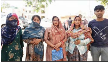
शाह टाइम्स संवाददाता