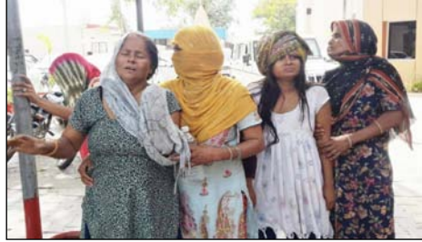
शाह टाइम्स संवाददाता

पुलिस से की कार्रवाई किए जाने की मांग, दोनों पक्ष के कई लोग घायल, पुलिस जांच जारी