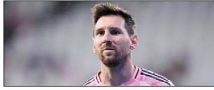
फीफा विश्वकप से पहले मेसी के पैर में लगी चोट खेल टाइम्स