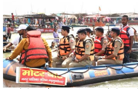
श्रद्धालुओं की सुरक्षा और सुविधा प्रदान करने के लिए अलग से महिला पुलिसकर्मियों की तैनाती की गई है। हमारा उद्देश्य है कि श्रद्धालु पूरी श्रद्धा और सुरक्षित माहौल में गंगा स्नान कर सकें।