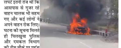
आग लगने का मुख्य कारण बन रही हैं। पुराने और बिना सर्विस वाले वाहनों में यह खतरा और अधिक बढ़ जाता है। ऑटोमोबाइल जानकरी का कहना है कि गर्मी में लंबे समय तक लगातार वाहन चलाने से इंजन पर अतिरिक्त दबाव पड़ता है। पिलखुवा हाईवे की यह घटना लोगों के लिए चेतावनी बनकर सामने आई है कि भीषण गर्मी में जरा सी लापरवाही बड़ा हादसा बन सकती है।