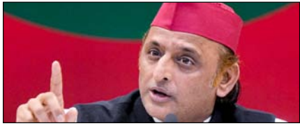
जन आक्रोश से बचने को भाजपा नेता दिखावटी चिट्ठी लिख रहे: अखिलेश पृष्ठ 2

नई दिल्ली, मुजफ्फरनगर, देहरादून, हल्द्वानी, मुरादाबाद, बरेली, मेरठ व लखनऊ से प्रकाशित