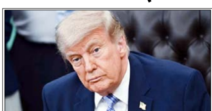
ट्रम्प बोले: मुस्लिम देश इजरायल से रिश्ते सुधारें, वे सभी देश अब्राहम समझौते में शामिल हों