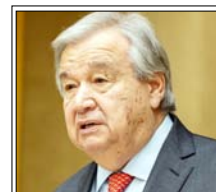
गुटेरेस ने महादीप की प्रचुर ताकत, लचीलेपन और वैश्विक मंच पर इसके बढ़ते प्रभाव की सराहना की

जेनेवा। संयुक्त राष्ट्र के महासचिव एंटोनियो गुटेरेस ने सोमवार को 'अफ्रीका दिवस' के अवसर पर अफ्रीकी देशों के प्रति अपनी प्रतिबद्धता दोहराते हुए कहा कि संयुक्त राष्ट्र को एक शांतिपूर्ण, समृद्ध और टिकाऊ भविष्य के निर्माण के लिए अफ्रीका के साथ मिलकर काम करने पर गर्व है। 'अफ्रीकी संघ' की 63वीं वर्षगांठ के अवसर पर जारी अपने संदेश में संयुक्त राष्ट्र प्रमुख ने कहा कि आज और हर दिन, संयुक्त राष्ट्र उन सभी अफ्रीकी देशों के साथ काम करने में गर्व महसूस करता है जो एक ऐसे शांतिपूर्ण, समृद्ध और टिकाऊ भविष्य का निर्माण कर रहे हैं जिसके हकदार न केवल सभी अफ्रीकी नागरिक हैं, बल्कि हमारी पूरी दुनिया है।