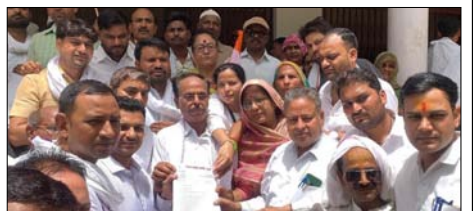
एक नीट की तैयारी कर रही छात्रा के साथ कोचिंग से लौटते समय अपहरण कर 16 दिनों तक बंदक बनाकर उसके साथ अत्याचार किए गए तथा उसे गंभीर यातनाएं दी गई और दबाव में शादी कराने की कोशिश की गई। उन्होंने इस घटना को