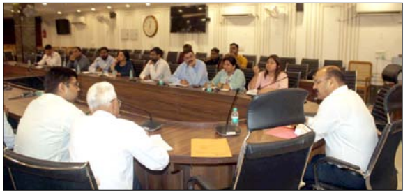
मासिक रूप से, मुख्य विकास अधिकारी मेरठ एवं एलडीएम मेरठ की अध्यक्षता में साप्ताहिक रूप से बैठक कराना सुनिश्चित करें साथ ही सहयोग न करने वाले बैंक के विरुद्ध एस.एल.बी.सी को सूचित करें। प्रभारी यूपीनेडा को निर्दिष्ट किया गया कि यूपीनेडा पोर्टल एवं जन-समर्थ पोर्टल पर प्रदर्शित ऋण आवेदन की संख्या के अन्तर् में सम्बन्ध में आवश्यक कार्यवाही सुनिश्चित करें।