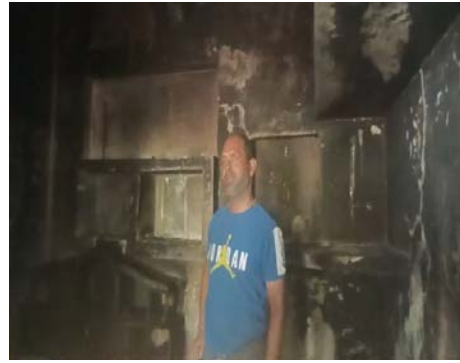
ग्रामीणों ने पीड़ित परिवार को सलाह देते हुए प्रशासन से आर्थिक सहायता दिलाने की मांग की है। गांव के लोगों का कहना है कि गरीब परिवार के लिए यह नुकसान बहुत बड़ा है और प्रशासन को तत्काल राहत उपलब्ध करानी चाहिए।

दौरान घर के अंदर अचानक शॉर्ट सर्किट हुआ और आग लग गई। देखते ही देखते आग ने पूरे कमरे को अपनी चपेट में ले लिया। घर से उठती आग की लपटें देखकर आसपास के ग्रामीण मौके पर पहुंचे और बाल्टियों व अन्य साधनों से आग बुझाने में जुट गए। काफी प्रयासों के बाद आग पर काबू पाया जा सका, लेकिन तब तक घर में रखा सामान पूरी तरह जल चुका था। हादसे में बेटी की शादी के लिए खरीदे गए कपड़े, आभूषण, घरेलू सामान, बिस्तर और करीब 30 हजार रुपये की नकदी जलकर राख हो गई। परिवार के लोगों का कहना है कि यह सामान उन्होंने वर्षों की मेहनत और बचत से जुटाया था। घटना के बाद परिवार का रो-रोकर बुरा हाल है।