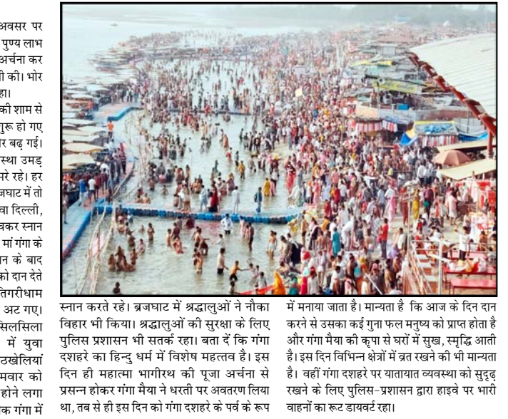
स्नान करते रहे। ब्रजघाट में श्रद्धालुओं ने नौका विहार भी किया। श्रद्धालुओं की सुरक्षा के लिए पुलिस प्रशासन भी सतर्क रहा। बता दें कि गंगा दशहरे का हिन्दू धर्म में विशेष महत्त्व है। इस दिन ही महात्मा पागीरथ की पूजा अर्चना से प्रसन्न होकर गंगा मैया ने धरती पर अवतरण लिया था, तब से ही इस दिन को गंगा दशहरे के पर्व के रूप में मनाया जाता है। मान्यता है कि आज के दिन दान करने से उसका कई गुना फल मनुष्य को प्राप्त होता है और गंगा मैया की कृपा से घरों में सुख, स्मृद्धि आती है। इस दिन विभिन्न क्षेत्रों में बतखों की भी मान्यता है। वहीं गंगा दशहरे पर यात्रायात्रा व्यवस्था को सुदृढ़ रखने के लिए पुलिस-प्रशासन द्वारा हाइवे पर भारी वाहनों का रूट डायवर्ट रहा।

शाह टाइम्स संवाददाता, गजरोला। ज्येष्ठ गंगा दशहरे के अवसर पर श्रद्धालुओं ने भारी संख्या में गंगा स्नान कर पुण्य लाभ अर्जित किया तो वहीं गंगा मैया की पूजा अर्चना कर अपने घर परिवार को स्मृद्धि की कामना भी की। भोर से प्रारंभ हुआ गंगा स्नान शाम तक चलता रहा। गंगा दशहरे पर स्नान के लिए रविवार की शाम से ही श्रद्धालु तिवरी व ब्रजघाट में पहुंचना शुरू हो गए थे। मध्य रात्रि में श्रद्धालुओं की संख्या और बढ़ गई। भोर से स्नान प्रारंभ होते ही घाटों पर आस्था उमड़ पड़ी। गंगा घाट श्रद्धालुओं से खचाखच भरे रहे। हर ओर श्रद्धालु ही श्रद्धालु दिखाई दे रहे थे। ब्रजघाट में तो स्नान के लिए स्थानीय नागरिकों के अलावा दिल्ली, पंजाब, हरियाणा तक के लोगों ने भी पहुंचकर स्नान किया। स्नान के दौरान हर-हर महादेव, जय मां गंगा के उद्घोषों से स्नान घाट भी गुंज उठा। स्नान के बाद श्रद्धालु घाटों पर पुरोहितों व निधन लोगों को दान देते नजर आए। उधर, विकास खंड के गांव तिवरीधाम में भी श्रद्धालुओं की भीड़ से गंगाघाट अलमल मचा। यहाँ भी भोर से शुरू हुआ स्नान का सिलसिला दोपहर तक जारी रहा। तपती धूप में युवा श्रद्धालुओं ने गंगा के शीतल पानी में अंठखेलियां करते हुए खूब मौज-मस्ती की। सोमवार को भीषण गर्मी का महसूस सुबह से ही होने लगा था। ऐसे में श्रद्धालु काफी-काफी देर तक गंगा में