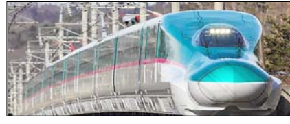
भारत की पहली बुलेट ट्रेन परियोजना: प्रगति का नया अध्याय सम्पादकीय