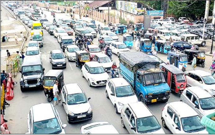
श्रीनगर। 'ईद-उल-अजहा' के त्योहार की खरीदारी को लेकर जाम में फंसे वाहन।