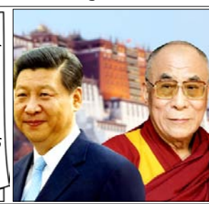
चीनी दूतावास ने भारत को तिब्बत पर अपने पुराने रुख की याद भी दिलाई।