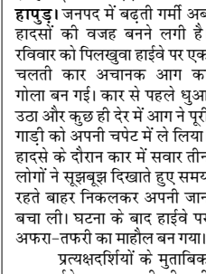
लपटें इतनी तेज थीं कि आसपास से गुजर रहे वाहन चालक भी सहम गए और कई लोगों ने अपने वाहन रोक लिए। घटना की सूचना मिलते ही पिलखुवा पुलिस और दमकल विभाग की टीम मौके पर पहुंच गई। दमकल कर्मियों ने काफी मशक्कत के बाद आग पर काबू पाया, लेकिन तब तक कार पूरी तरह जल चुकी थी। गनीमत रही कि हादसे में कोई हताहत नहीं हुआ। भीषण गर्मी के चलते वाहनों में आग लगने की घटनाएं लगातार बढ़ रही हैं। विशेषज्ञों के अनुसार अत्यधिक तापमान में इंजन ओवरहीट होना, वायरिंग में शॉर्ट सर्किट, बैटरी का अधिक गर्म होना और ईंधन रिसाव जैसी समस्याएं

शाह टाइम्स संवाददाता हापुड़। जूनपद में बढ़ती गर्मी अब हादसों की वजह बनने लगी है। रविवार को पिलखुवा हाईवे पर एक चलती कार अचानक आग का गोला बन गई। कार से पहले धुआं उठा और कुछ ही देर में आग ने पूरी गाड़ी को अपनी चपेट में ले लिया। हादसे के दौरान कार में सवार तीन लोगों ने सूझबूझ दिखाते हुए समय रहते बाहर निकलकर अपनी जान बचा ली। घटना के बाद हाईवे पर अफरा-तफरी का माहौल बन गया। प्रत्यक्षदर्शियों के मुताबिक कार हाईवे पर गुजर रही थी तभी बोनट से धुआं निकलता दिखाई दिया। चालक कुछ समझ पाता उससे पहले आग तेजी से फैल गई। देखते ही देखते कार धुं-धुं कर जलने लगी और उसमें से धमाके जैसी आवाजें आने लगीं। आग की