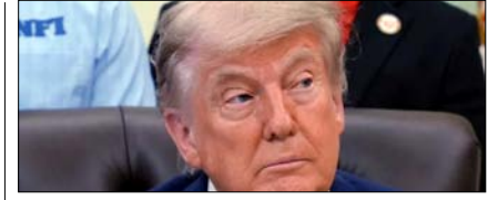
ईरान के साथ ओबामा जैसी डील नहीं करूंगा: ट्रम्प पृष्ठ 12