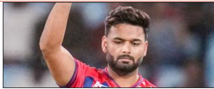
ऋषभ पंत ने लखनऊ सुपर जाइंट्स की कप्तानी छोड़ी खेल टाइम्स