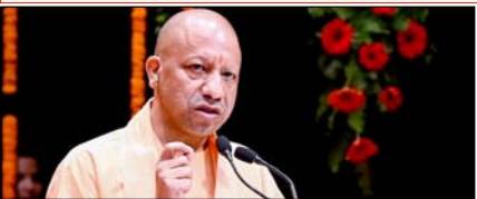
बेटी, व्यापारी को छेड़ने वाले का इंतजार अब यमराज करते हैं: मुख्यमंत्री योगी पेज 2

shahtimes2015@gmail.com च्येठ शुक्ल पक्ष 13 विक्रमी सम्वत् 2083 12 जिलाहिज्जा 1447 हिजरी नई दिल्ली, मुजफ्फरनगर, देहरादून, हल्द्वानी, मुगदाबाद, बरेली, मेरठ व लखनऊ से प्रकाशित