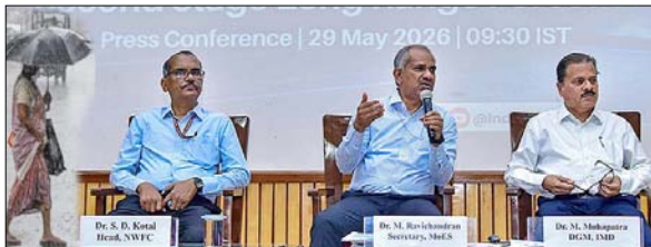
आईएमडी ने दक्षिण-पश्चिम मानसून के लिए अपना दूसरा दीर्घकालिक अनुमान किया जारी

नई दिल्ली। मौसम विज्ञान विभाग (आईएमडी) ने साल 2026 के दक्षिण-पश्चिम मानसून (जून से सितंबर) के लिए अपना दूसरा दीर्घकालिक अनुमान शुरुआत को जारी कर दिया। इसके अनुसार देश के प्रमुख कई हिस्सों में इस साल मानसून की बारिश सामान्य से कम रहने का अनुमान है। देश में बारिश के मुख्य स्रोत दक्षिण-पश्चिम मानसून के लंबी अवधि के औसत (एलपीए) का 90 प्रतिशत होने की संभावना है और इसमें चार फीसदी घट-बढ़ हो सकती है। मौसम विज्ञान विभाग ने यहां एक संवाददाता सम्मेलन में यह जानकारी दी। मौसम विभाग ने