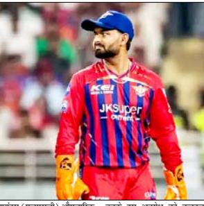
लखनऊ, वाता। आईपीएल 2026 में खराब प्रदर्शन के बाद ऋषभ पंत ने लखनऊ सुपर जायंट्स (एलएसजी) की कप्तानी छोड़ दी है। पंत को 2025 के सीजन से पहले मेगा नीलामी में एलएसजी ने खरीदा था और उन्हें टीम का कप्तान नियुक्त किया गया था। हालांकि पंत की कप्तानी में एलएसजी लगातार दूसरी बार चलेआगे में नहीं पहुंच पाए।

पंत को 2025 के सीजन से पहले मेगा नीलामी में एलएसजी ने खरीदा था