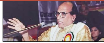
'बहुत तलाश किया, कोई आदमी ना मिला' बहुत याद आएंगे बशीर बद्र सम्पादकीय