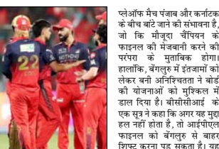
लेओफ फंज बांध और कर्नाटक के बीजेपी ने मेजबानी के लिए मीठादा चैंपियन के फाइनल को मुंबानी करने की परंपरा को प्रभावित होगा। हालांकि, बेंगलुरु में इंतजामों का लेवल नीचे आनेवाला है। बीसीसीआई के एक सूत्र ने कहा कि अगर यह मुद्दा नहीं होता है, तो आईपीएल फाइनल को बेंगलुरु से बाहर स्थान करना पड़ सकता है। यह विचार आईपीएल 2026 के पहले मैच से ठीक पहले शुरू हुआ था। यह मैच टैयल चैलेंजर्स वेल्स (आयरलैंड) और सगरनास इंटरनैशनल (एसआरएच) के बीच होगा था।

बेंगलुरु, बार्ता। बेंगलुरु के आईपीएल 2026 फाइनल की मेजबानी करने के मौकों पर गंभीर संकट आ गया है। विधायकों के लिए एक अछूता संकेत है, क्योंकि 12 नए से इलेक्ट्रॉन और वेल्स में आईसीसी महिला टी20 वर्ल्ड कप शुरू होने वाला है। पाकिस्तान का ग्रुप 1 में खरा गया है और उसे ऑस्ट्रेलिया, बांग्लादेश, भारत, नीदरलैंड्स और दक्षिण अफ्रीका के खिलाफ मैच खेलने हैं। जिम्बाब्वे के खिलाफ वनडे सीरीज के अगले दो मैच बुधवार और शनिवार को करलची में खेले जाएंगे। इसके बाद, टी20 वर्ल्ड कप से पहले, पाकिस्तान मैचों के खिलाफ तीन मैचों की टी20 सीरीज खेलेगा। यह विचार, जो कर्नाटक के विधायकों की एम विधानसभा में बनें वारे आईपीएल मैचों के लिए मुफ्त वीआओपी टिकटों की मांग के तौर पर शुरू हुआ था, एक राजनीतिक रूप से संवेदनशील मुद्दा बन गया है। इस