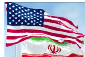
यूएई ने इस हमले की कड़ी निंदा करते हुए इसे तनाव बढ़ाने वाला कदम बताया है।

वाशिंगटन/तेहरान। ईरान और अमेरिका के बीच हुआ युद्धविराम अब होर्मुज जलडमरूमध्य को लेकर खतरे में पड़ता नजर आ रहा है। अमेरिकी राष्ट्रपति डोनाल्ड ट्रम्प की ओर से ईरान के ताजा प्रस्ताव को खारिज करने और होर्मुज से जहाजों के पारगमन में मदद के लिए 'प्रोजेक्ट फ्रीडम' शुरू करने के बाद तनाव चरम पर है।