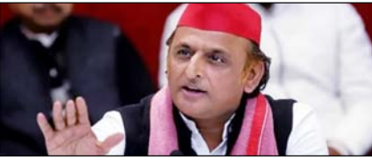
महिला आरक्षण पर भाजपा अपना रुख साफ करे: अखिलेश यादव

नई दिल्ली, मुजफ्फरनगर, देहरादून, हल्द्वानी, मुगदाबाद, बरेली, मेरठ व लखनऊ से प्रकाशित