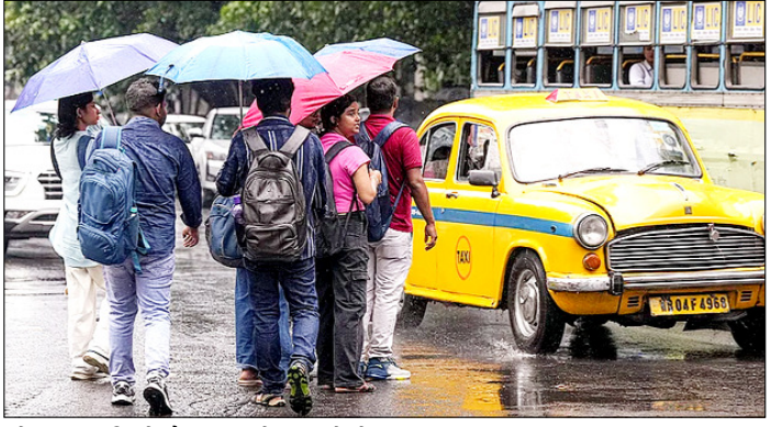
कोलकाता। बारिश के दौरान छाता लेकर चलते लोग।