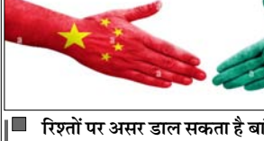
रिश्तों पर असर डाल सकता है बांग्लादेश का कदम

बीजिंग। बांग्लादेश की नई सरकार ने तीस्ता नदी परियोजना को लेकर चीन का समर्थन औपचारिक रूप से मांग लिया है। यह कदम भारत और बांग्लादेश के रिश्तों पर असर डाल सकता है।