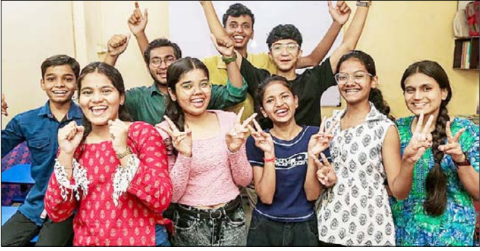
ठाणे। महाराष्ट्र राज्य माध्यमिक और उच्च माध्यमिक शिक्षा बोर्ड (एमएसबीएसएचएसई) की कक्षा 10 के परिणाम घोषित होने के बाद जश्न मनाते छात्र व छात्राएँ।