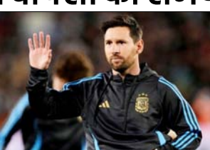
उस समय से इस साल सभी प्रतियोगिताओं में वह सिर्फ 12 मैच ही खेल पाए हैं, जबकि 2025 में उन्होंने 28 मैच खेले थे। मेसी ने 'लो डेल पांको' शो में कहा कि हम चाहते हैं कि सबसे बेहतरीन खिलाड़ी (वर्ल्ड कप में) मौजूद हों और नेमार, चारें उनकी फॉर्म कैसी भी हो, हमेशा उन बेहतरीन खिलाड़ियों में से एक रहेंगे। वर्ल्ड कप में उन्हें खेलते देखा बहुत शानदार होगा,

ब्यूस आरस, बार्ना। लिक्वोर मेसी का मानना है कि नेमार अभी भी फुटबॉल के बेहत, रीन खिलाड़ी हैं जो से एक हैं और उन्होंने उम्मीद जताई कि बाजील का यह फोरहैंड अहम पहलू होने वाले फ्रीफा वर्ल्ड कप के लिए सही है और उन्होंने चार लेंग कर लेना। बाजील के अब एक के सबसे ज्यादा गोल करने वाले खिलाड़ी बनाने में अक्टूबर 2023 के बाद से अपने देश के लिए कोई मैच नहीं खेलेंगे।