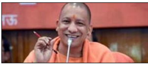
उत्तर प्रदेश में मंत्रिमंडल का विस्तार आज!

नई दिल्ली, मुजफ्फरनगर, देहरादून, हनुमान, मुदाबाद, बेली, मेरठ व लखनऊ से प्रकाशित