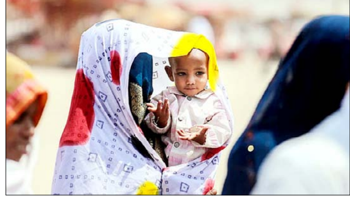
प्रयागराज। भीषण गर्मी में कपड़ा ढक्कर अपने बच्चे को घुप से बचाती महिला।

तात्कालिक खतरा नहीं था और कुछ राजनीतिक शक्तियों ने बाहरी प्रभाव में आकर अमेरिका को युद्ध में धकेला। उन्होंने अमेरिकी विदेश नीति की भी आलोचना करते हुए कहा कि राजनीतिक नैरेटिव के कारण खुफिया सूचनाओं को कमजोर किया गया और युद्ध को इजरायल तथा उसके समर्थकों के दबाव में आगे बढ़ाया गया। उन्होंने आशंका जताई कि यह संघर्ष अमेरिका को एक और लंबे परिचय एशिया युद्ध में धकेल सकता है और युद्ध तक पहुंचने वाली निर्णय प्रक्रिया को पुनर्समीक्षा की जरूरत है। उन्होंने लिखा कि जून 2025 तक आप समझते थे कि मध्य-पूर्व के युद्ध एक जाल है, जिन्होंने अमेरिका के सैनिकों की जान ली और देश की समृद्धि को नुकसान पहुंचाया। उन्होंने ट्रम्प के पहले कार्यकाल में कासिम सुलेमानी की हत्या और थाई बमबारी के खिलाफ कार्रवाई का उल्लेख करते हुए कहा कि उस समय सैन्य शक्ति का उपयोग बिना लंबे युद्ध में फंसे किया गया था।