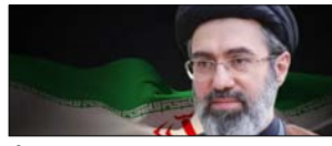
ईरान में प्रमुख ताकत बनकर उभरे मुजतबा खानेनेई