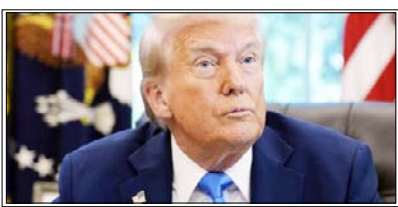
इस समझौते से न केवल सैन्य अभियान रुकेंगे बल्कि युद्ध शुरू होने के बाद से कैदियों की सबसे बड़ी अदला-बदली भी होगी: डोनाल्ड

वाशिंगटन। अमेरिका के राष्ट्रपति डोनाल्ड ट्रम्प ने विजय दिवस के उपलक्ष्य में आयोजित समारोहों दौरान रूस और यूक्रेन के बीच तीन दिनों के युद्धविराम और 1000 कैदियों की अदला-बदली की घोषणा की है। यह समारोह द्वितीय विश्व युद्ध में नाजी जर्मनी पर सोवियत संघ की विजय दिवस के उपलक्ष्य में आयोजित किया जाता है। उन्होंने कहा कि इस समझौते से न केवल सैन्य अभियान रुकेंगे बल्कि युद्ध शुरू होने के बाद से कैदियों की सबसे बड़ी अदला-बदली भी होगी। रूसी राष्ट्रपति के सहयोगी यूरी उशाक। ने ने कहा कि रूस ने यूक्रेन के साथ नौ से 11 मई तक युद्धविराम करने और इस अवधि के दौरान यूक्रेन के साथ 'हजारों कैदों को बतलाने' का अदला-बदली करने की ट्रम्प की पहल पर सहमति व्यक्त की है। यह अस्थायी युद्धविराम नौ मई से 11 मई तक रहेगा और यह चार साल से अधिक समय से चल रहे युद्ध को समाप्त करने के