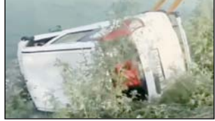
शाह टाइम्स संवाददाता भागपत। शहर कोतवाली क्षेत्र के सुबहपुर महतवा गांव में शनिवार सुबह एक बड़ा हादसा टल गया। नौएडा से शरी समारोह से लौट रही एक तेज रफ्तार वैनान कार अनियंत्रित होकर तालाब में जा गिरी। कार में सवार तीनों युवकों को गहरी गहराई में सुरक्षित बाहर निकाल लिया।