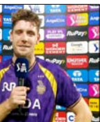
पूछा गया, तो उन्होंने कहा कि मुझे लगता है कि सपोर्ट स्टाफ ने मुझ पर कभी कोई दबाव नहीं डाला। मुझे लगता है कि पहले दिन से ही वे मेरे साथ बहुत अच्छे रहे हैं। उन्होंने कहा कि मुझे यह महसूस नहीं करनी चाहिए कि टीम के किसी खिलाड़ी के मुकाबले मुझ पर कोई दबाव रहा है। ग्रीन ने अपनी गतिविधि को लेकर जहाँ जहाँ जाती चिंताओं से भी दूर करते हुए कहा कि वह बार ओवर गेंदबाजी करने के लिए 100 फोर्सरी तैयार है।

नई दिल्ली, बार्ना। दिल्ली की कैप्टनस को उसी के मैदान में आईपीएल मुकाबले में आठ विकेट से पराजित करने के बाद कोलकाता नाइट राइडर्स के कैमरून ग्रीन ने कहा कि टूर्नामेंट में निराशाजनक शुरुआत के बावजूद टीम का आत्मविश्वास कभी कम नहीं हुआ था। केकेआर टीसी समथ पर अपनी बेहतरीन फॉर्म में आती दिख रही है। टूर्नामेंट की शुरुआत उनके लिए काफी मुश्किल रही, पहले छह मैचों में उन्हें कोई जीत नहीं मिली, लेकिन अब उन्होंने प्रदर्शन पकड़ ली है और लगातार चार मैच जीत लिए हैं। ग्रीन ने मैच के बाद शुक्रवार को कहा कि मुझे नहीं लगता कि हमारा आत्मविश्वास कभी कम हुआ था, जोहिर है, मैं चाहूंगा कि वह वर्ल्ड कप में खेलें और उनके साथ सब कुछ अच्छा हो, क्योंकि वह जिस तरह का इंसान है, क्योंकि वह जिस तरह का इंसान है।