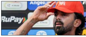
केएल राहुल औरेंजर कैप तालिका में तीसरे स्थान पर रहे बरकरार