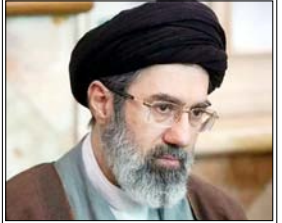
अमेरिका से समझौते के राजनयिक प्रयासों का मार्गदर्शन करने में गहराई से लगे हुए

वाशिंगटन। ईरान के सर्वोच्च नेता मुजतबा खामेनेई संघर्ष के दौरान देश की युद्ध रणनीति को आकार देने और युद्ध समाप्त करने के लिए अमेरिका के साथ राजनयिक बातचीत में शामिल अधिकारियों को निर्देशित करने वाले प्रमुख चेहरे के रूप में उभरे हैं। ईरान पर अमेरिका-इजरायल के हमले के पहले ही दिन उनके पिता और ईरान के तत्कालीन सर्वोच्च नेता अयातुल्ला अली खामेनेई और कई वरिष्ठ ईरानी सैन्य कमांडर मारे गए थे। अमेरिकी खुफिया अधिकारियों के आकलन के अनुसार, उसी हमले में गंभीर रूप से घायल होने के बावजूद मुजतबा का कथित तौर पर ईरान की युद्धकालीन रणनीति बनाने, सैन्य अभियानों का निर्देशन करने और अमेरिका से समझौते के राजनयिक प्रयासों का मार्गदर्शन करने में गहराई से लगे हुए हैं। सीएनएन की रिपोर्ट के अनुसार, मुजतबा के चेहरे, हाथ, घड़ और पैर काफी ज्यादा झुलस गए थे। अमेरिकी खुफिया एजेंसी का मानना है कि वह सार्वजनिक नजरों से दूर रहकर स्वस्थ होने के साथ-साथ अत्यंत महत्वपूर्ण भूमिका के साथ-साथ अत्यंत महत्वपूर्ण भूमिका निभा रहे हैं। वह किसी भी प्रकार के इलेक्ट्रॉनिक संचार से जानबूझकर बच रहे हैं और केवल व्यक्तिगत मुलाकातों या संदेशवाहकों के ज़रिए हस्तालिखित नोटों से ही