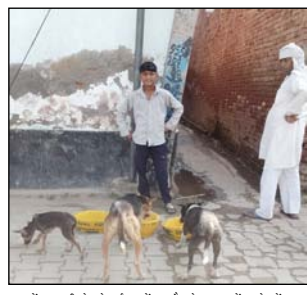
स्थानों पर पानी से भरे बर्तन रखें