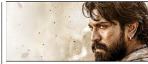
भोपाल में 16 मई को होगा 'पेड्डी' का बैंड ट्रेलर लॉन्च