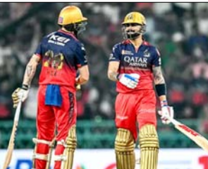
अभियान में थोड़ी बेचैनी पैदा कर रही है, जैसे-जैसे टूर्नामेंट अपने निर्णायक दौर की ओर बढ़ रहा है, वेंगुड को टीम के लिए एक महत्वपूर्ण भूमिका है, लगातार दो विकेट खूब को एक जगह तक खेले गए हैं, हालांकि उनके आगे बढ़ने की गणितीय संभावनाएं बहुत कम हैं, आरसीबी को बचाने और इस

रायपुर, बार्ना। महलकांक्षा और गौरव के बीच होने वाले एक रोमांचक मुकाबले में, रॉबल वेल्डेंडर वेंगुड (आरसीबी) शनिवार को बार्ना प्रोबल की शानदार विड ऑपनिंग क्रिकेट स्टेडियम में इंडियन प्रीमियर लीग 2026 के 54वें गेम में मुंबई इंडियंस (संसाधन) से निर्याती। आरसीबी की नजर प्लेऑफ में जगह बनाने की दिशा में एक अहम कदम उठाने पर है, जबकि मुंबई अपने विभाजनक अभियान में मुजबूत रूप से आगे गीच और प्रतिलोप विवर खेल रही।