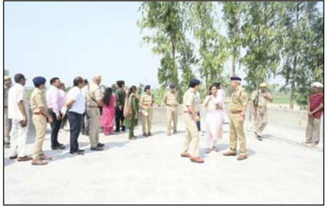
शाह टाइम्स संवाददाता भागपत। मंडलमंत्रियों के संघमित भ्रमण कार्यक्रम के दृष्टिकोण में मंडल आयुक्त मातु चंद्र गोस्वामी,

मंदिर परिसर व आसपास के क्षेत्रों में निरीक्षण के दौरान अधिकारियों ने संबंधितों को दिए सख्त निर्देश