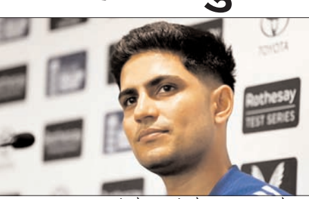
गंवाया जब वह 14 रन पर थे और फिर मोहम्मद सिराज ने 33 रन पर लॉन्ग-ऑन पर उनका आसान कैच छोड़ दिया। एलन ने 35 गेंदों पर 93 रन की जबरदस्त पारी खेली, जिससे केकेआर ने 247 रन बनाए, जो आईपीएल में जीटी के खिलाफ अब तक का सबसे बड़ा स्कोर है। यहां तक कि कैमरून ग्रीन का भी 23 रन पर अरशद खान ने कैच छोड़ा, जबकि अंगकू रघुवंशी को वाशिगटन सुंदर ने फाइन लेंग पर कैच टपका दिया। दोनों बैट्समैन ने नाबाद फिफ्टी बनाई। गिल ने कहा कि पिच अच्छी थी। कुछ गेंदें रुक रही

कोलकाता, वार्ता। शुभमन गिल ने गुजरात टाइटंस (जीटी) के फील्डिंग पर निशाना साधते हुए कहा कि हम जीतने के लायक नहीं थे, जब जीटी ने कोलकाता नाइट राइडर्स (केकेआर) के खिलाफ चार मौके गंवाए, जिनमें से तीन आसान थे। गिल ने जीटी के केकेआर से 29 रन से हारने के बाद कहा कि विकेट को देखकर, हमें लगा कि 200-220 एक बराबर स्कोर होगा। लेकिन हमने बहुत सारे कैच छोड़े और जब आप एक गेम में तीन से चार कैच छोड़ते हैं, तो बॉलर्स के लिए यह कभी आसान नहीं होता। फिन एलन का दो बार कैच छूटा, एक बार जेसन होल्डर ने कवर्स में एक मुश्किल मौका