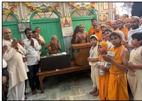
वाले संकटों को यदि कोई टाल सकता है तो वह है सिर्फ श्री जिनेन्द्र भगवान की भक्ति। सच्चे मन से करी गयी प्रभु भक्ति ही इस जीवन में आपका कल्याण कर