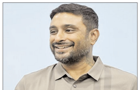
उनके 200वें आईपीएल मैच में प्लेयर ऑफ द मैच चुने जाने के बाद रायडू ने कहा कि गेंद से मैच विनर, बल्ले से भी मैच विनर। आईपीएल में कई महान खिलाड़ी उभरे हैं, लेकिन यह खिलाड़ी हमेशा सबसे अलग दिखता है। मेरे

कोलकाता, वार्ता। पूर्व भारतीय क्रिकेटर अंबाती रायडू का मानना है कि सुनील नारायण उनके हिंसा से आईपीएल के सर्वकालिक सबसे बेहतरीन खिलाड़ी हैं। यह बयान तब आया जब नारायण ने गुजरात टाइटंस (जीटी) के खिलाफ अपने चार ओवरों में 29 रन देकर 2 विकेट लिए और कोलकाता नाइट राइडर्स (केकेआर) को आईपीएल 2026 में 29 नंबर की जीत में अहम भूमिका निभाई।