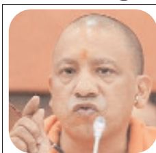
सहजनवा विस क्षेत्र स्थित तेनुआ टोल प्लाजा के समीप एक रिजॉर्ट में भाजपा के जिला प्रशिक्षण वर्ग के उद्घाटन सत्र को संबोधित करते हुए बोले सीएम योगी

यूपी के मुख्यमंत्री योगी आदित्यनाथ ने कहा है कि राष्ट्रवाद के भाव से आचरण ही भारतीय जनता पार्टी कार्यकर्ता की पहचान है।