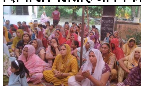
नगरी और समस्त धन संपत्ति जलकर खाक हो गई, रावण की मृत्यु पर कोई रोने वाला ही नहीं बचा था। उन्होंने कहा कि आज का मानव रावण से शक्तिशाली नहीं हो सकता फिर क्यों अधिकाधिक संपन्न होने के लिए अनेक तरह के अत्याचार अनाचार