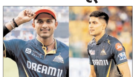
लगने के बाद 13 गेंदों पर 23 रन बनाकर रिटायर्ड हर्ट हो गए थे। लेकिन 17वें ओवर में, जब गिल आउट हुए, तब वह दोबारा बल्लेबाजी करने लौटे और फिर 15 गेंदों पर 30 और रन जोड़कर 28 गेंदों पर नाबाद 53 रन के स्कोर पर समाप्त किया। इस पारी के

ऑरेंज कैप लीडरबोर्ड जीटी मैच हार गई, लेकिन उनके ओपनर्स बी साई सुदर्शन और शुभमन गिल ने केकेआर के 247 रन के स्कोर का पीछा करने की पूरी कोशिश की। सुदर्शन तीसरे ओवर में कार्तिक त्यागी की गेंद