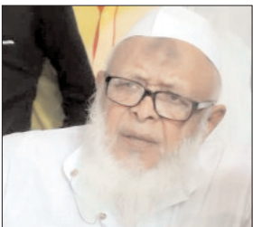
इस्लाम को मिटाने वाले खुद ही मिट गए: जमीयत उलेमा ए हिंद