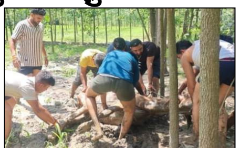
गौरक्षा दल पराधिकारियों ने क्षेत्रवासियों से अपील की है कि गोवंश की सुरक्षा के लिए सभी लोग सहयोग करें, कहीं पर भी घायल या असाहाय गोवंश दिखाई देने पर तुरंत उन्हें सूचना दें, ताकि समय रहते उनका उपचार कराया जा सके। इस दौरान जिला

शाह टाइम्स संवाददाता चिलकाना। आवा कूत्तों के झुंड ने गाय पर हमला कर गंभीर रूप से घायल कर दिया। गोरक्षा दल के कार्यकर्ताओं ने मौके पर पहुंचकर गाय को गोशाला भिजवाया। बता दें कि चिलकाना क्षेत्र में आवा कूत्तों का आतंक लगातार बढ़ता जा रहा है। जो आये दिन गोवंश को अपना शिकार बना रहे हैं। आज दुमझेड़ा धोलाहेड़ी मार्ग पर आवा कूत्तों ने एक गाय पर हमला कर उसे गंभीर रूप से घायल कर दिया। घटना की सूचना मिलते ही गो रक्षा दल के कार्यकर्ताओं ने मौके पर पहुंचकर घायल गाय को उपचार के लिए गोशाला भिजवाया।