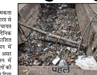
पंचायत की तीन अलग-अलग टीमों मुस्तेद दिखाई दें अधिशासी अधिकारी ईओ के समक्ष निर्देश पर जेसीबी मशीनों और दर्जनों सफाई कर्मचारियों को काम पर लगाया गया है। प्रशासन ने मानसून की दस्तक से पहले सभी मुख्य नालों को पूरी तरह साफ करने के अभियान तेज कर दिया है।