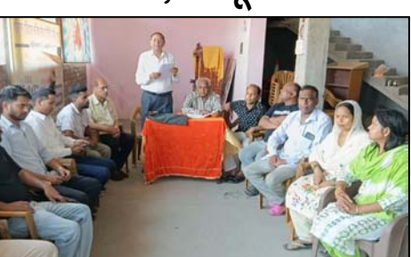
प्रचार-प्रसार तैयारी में जुट गए हैं। चुनाव को शांतिपूर्ण एवं निष्पक्ष ढंग से संपन्न कराने के लिए समिति द्वारा आवश्यक तैयारियों की जा रही है।