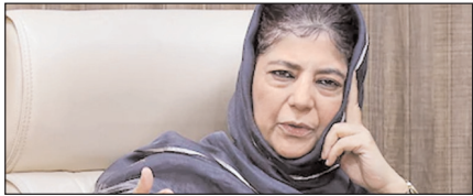
कश्मीर के लिए संवाद ही एकमात्र रास्ता : महबूबा मुफ्ती पेज 2

नई दिल्ली, मुजफ्फरनगर, देहरादून, हल्द्वानी, मुरादाबाद, बरेली, मेरठ व लखनऊ से प्रकाशित