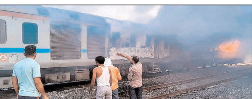
कोच से बाहर निकाला गया। करीब 15 मिनट में पूरा कोच खाली करा लिया गया।

कोटा। केरल के त्रिवेन्द्रम से हजरत निजामुद्दीन आ रही राजधानी एक्सप्रेस (12431) के दो कोच में आग लग गई। यह घटना कोटा रेल मंडल के लुणी रिच्चा और विक्रमगढ़ आलोट रेलवे स्टेशन के बीच हुआ। जैसे ही आग लगने की खबर आई, सभी यात्रियों को सुरक्षित ट्रेन से उतार लिया गया। यह घटना रविवार (17 मई 2026) को सुबह करीब 5:15 बजे हुई। आग ट्रेन के बी-1 कोच में और उसके पीछे लगे संकंड लगेज कम वार्ड वैन में लगी थी। ट्रेन में आग लगने के समय कुल 68 यात्री सवार थे और राहत की बात यह रही कि सभी यात्री सुरक्षित हैं। कोई भी यात्री घायल नहीं हुआ है। आग लगने के बाद गाई ने तुरंत लोको पायलट को सूचना दी, जिसके बाद ट्रेन को रोक दिया गया और सभी यात्रियों को तेजी से कोच से बाहर निकाला गया। करीब 15 मिनट में पूरा कोच खाली करा लिया गया।