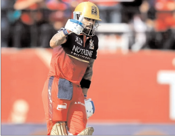
विराट कोहली ने मनाया अपना अर्धशतक।

जवाब में पंजाब 8 विकेट खोकर 199 रन ही बना सकी। इस जीत के साथ बैंगलुरु के 18 पाइंट्स हो गए और टीम इस सीजन में प्लेऑफ में पहुंचने वाली पहली टीम बन गई। वहीं, पंजाब की यह लगातार छठी हार रही। पंजाब की शुरुआत बेहद खराब रही और उसने 19 रन तक 3 विकेट गंवा दिए। बाद में कूपर कोनोली, मार्कस स्टोयनिस और शशांक सिंह ने संघर्ष जरूर