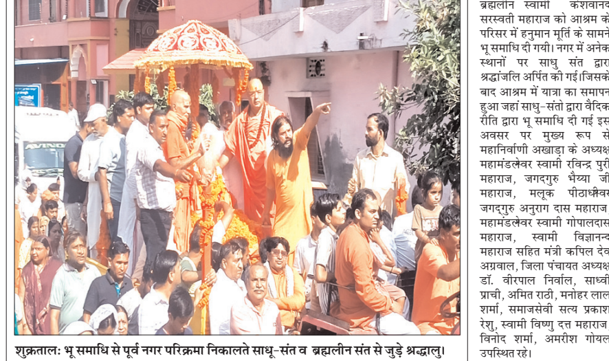
शुक्रताल: भू समाधि से पूर्व नगर परिक्रमा निकालते साधु-संत व ब्रह्मलीन संत से जुड़े श्रद्धालु।

बताया था, लेकिन यहाँ आकर पता लगा कि ऐसा कुछ नहीं है। महिला ने मारपीट और अन्य गंभीर आरोप लगाते हुए कहा कि पति ने तीन माह पूर्व मयके भेज दिया था। उस वक्त उसका जल्द घर लाने का आश्वासन दिया था, लेकिन आरोप है कि अब ससुराल के लोग उसे अपने साथ रखने से इंकार कर रहे हैं। महिला का कहना है कि वह परेशान होकर ससुराल के दरवाजे के बाहर गेट पर धरने पर बैठ गई है। महिला का कहना है कि उसको देखने के बाद ससुराल के लोगों ने गेट बंद कर लिया है। पीड़िता ने बताया कि उसने दरवाजा खुलवाने का प्रयास किया, लेकिन उसको अंदर जाने की एंट्री नहीं दी जा रही।