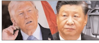
चीन से खाली हाथ लौटे ट्रंप, नहीं बोल पा रहे हैं खुलकर सम्पादकीय