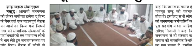
शाह टाइम्स संवाददाता नकुड़। आगामी जनगणना को लेकर जनमत उल्लेख ए हिन्दू के बैनर तले एक महत्वपूर्ण बैठक का आयोजन किया गया जिसमें गांव के सामाजिक संस्थाओं के प्रतिनिधियों एवं गणमान्य लोगों ने भाग लेते हुए जनगणना पर जोर दिया। बैठक में लोगों से अपील की गई कि जनगणना अधिकारियों एवं कर्मचारियों द्वारा पूछे जाने वाले प्रश्नों को सही एवं सचतापूर्वक उत्तर दिए जाएं, ताकि योजनाओं का लाभ सास्त्विक ढंग से पहुंच सके।