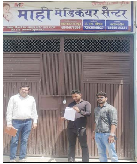
अस्पताल को सील करते स्वास्थ्य विभाग के अधिकारी।