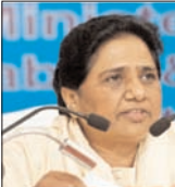
श्रीश्री मायावती, अध्यक्ष बहुजन समाज पार्टी

सरकारों को ऐसा कुछ नहीं करना चाहिए, जिससे संकीर्ण राजनीति, धार्मिक भेदभाव या जातीय द्वेष का आरोप लगे, भारत की दुनिया भर में अच्छी और अनोखी मानवतावादी पहचान बाबा साहेब डा. भीमराव अम्बेडकर के संविधान से है, जो पूरी तरह धर्मनिरपेक्षता के सिद्धांत पर आधारित है। संविधान सभी धर्मों के लोगों को एक-समान आदर-सम्मान, जान-माल और मजहब की आजादी की सुरक्षा सुनिश्चित करता है, उच्च न्यायालय के निर्देशों के बाद सरकारों को अराजकता के विरुद्ध सख्त हो जाना चाहिए, ताकि किसी भी सरकार पर संकीर्ण राजनीति, धार्मिक भेदभाव, जातीय द्वेष व पक्षपात का दोष न लगे। यह अति-चिंता की बात होनी चाहिए, जनहित में बनाए गए कानूनों का अनुपालन सभी धर्मों के लोगों पर एक समान रूप से होना चाहिए, संविधान और कानून की मान-मर्यादा बनाए रखना जरूरी है।