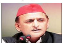
बीजेपी दारुवादी पार्टी आपस में करवाती है झगड़ा

महाराणा प्रताप की जयंती पर दो दिन का अवकाश घोषित करेंगे: सपा शाह टाइम्स ब्यूरो लखनऊ। यूपी की राजधानी लखनऊ में शनिवार को सपा जवादी पार्टी कार्यालय में महाराणा प्रताप की जयंती मनाई गई। इस दौरान पार्टी के मुखिया और पूर्व मुख्यमंत्री अखिलेश यादव ने एक प्रसन्न-मनो कार्यक्रम का आयोजन किया। अखिलेश यादव ने दो दिन का अवकाश घोषित किया जाएगा। इसके साथ ही उन्होंने बीजेपी पर जमकर निशाना साधा। अखिलेश ने बीजेपी को दारुवादी करार दिया और कहा कि बीजेपी के लोग दारुवादी हैं, आपस में झगड़ा करवाने वाले लोग हैं। उन्होंने कहा कि बीजेपी के पास कोई काम नहीं है, ये लोग बस नकारात्मकता फैलाते हैं और एक-दूसरे के बीच लड़ाई लगावते हैं। सपा प्रमुख ने कहा कि हमको कल एक विकसित देश में बँटने से वॉट डाले गए, बँटने से वॉट पड़े, ये मांग हमारी रहेगी। वहीं एनसीआरवी के आंकड़ों पर अखिलेश यादव ने कहा कि उत्तर प्रदेश के जो आंकड़े हैं एनसीआरवी के वो सरकार के ही हैं। उन्होंने कहा कि महिलाएं और बेटियां प्रदेश में असुरक्षित हैं, उनमें डर का माहौल है। उन्होंने कहा कि जो जीरो टॉलरेंस की बात करते हैं उन्होंने ला एंड ऑर्डर जारी कर दिया। सपा प्रमुख ने कहा कि आने वाले समय में जब भी समाजवादी पार्टी की सरकार होगी, तो महाराणा प्रताप की जयंती पर दो दिन का अवकाश घोषित किया जाएगा। उन्होंने कहा कि गोमती रिबर फ्रंट पर पार्टी महाराणा प्रताप की ध्वज प्रतिमा लगाएगी, जिसमें चेतक भी होगा, सोने का भाला भी होगा।