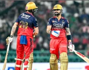
अभियान में थोड़ी बेचैनी पैदा कर रही है, जैसे-जैसे टूर्नामेंट अपने निर्णायक दौर की ओर बढ़ रहा है, वेंगुडु की टीम के लिए समीक्षा की रही है, लगातार जीत हासिल कर, वर्या प्लेऑफ में जगह बनाने की कड़ी दौड़ में पिछड़ने का जोखिम उठाए। इसके

आरसीबी, जो पाँचवें टेबल में तीसरे स्थान पर आउट से बेटी है, ने निरंतर टॉप-2 में जगह बनाने की अनुशासित गेंदाजी के साथ निष्पक्षता की है, लगातार जीत हासिल कर, वर्या प्लेऑफ में जगह बनाने की कड़ी दौड़ में पिछड़ने का जोखिम उठाए। इसके