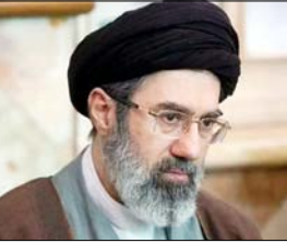
अमेरिका से समझौते के राजनयिक प्रयासों का मार्गदर्शन करने में गहराई से लगे हुए

वाशिंगटन। ईरान के सर्वोच्च नेता मुजतबा खामेनेई संघर्ष के दौरान देश की युद्ध रणनीति को आकार देने और युद्ध समाप्त करने के लिए अमेरिका के साथ राजनयिक बातचीत में शामिल अधिकारियों को निर्देशित करने वाले प्रमुख चेहरे के रूप में उभरे हैं। ईरान पर अमेरिका-इजरायल के हमले के पहले ही दिन उनके पिता और ईरान के तत्कालीन सर्वोच्च नेता अयातुल्ला अली खामेनेई और कई वरिष्ठ ईरानी सैन्य कमांडर मारे गए थे। अमेरिकी खुफिया अधिकारियों के आकलन के अनुसार, उसी हमले में गंभीर रूप से घायल होने के बावजूद मुजतबा का कथित तौर पर ईरान की युद्धकालीन रणनीति बनाने, सैन्य अभियानों का निर्देशन करने और अमेरिका से समझौते के राजनयिक प्रयासों का मार्गदर्शन करने में गहराई से लगे हुए हैं। सीएनएन की रिपोर्ट के अनुसार, मुजतबा के चेहरे, हाथ, घड़ और पैर काफी ज्यादा झुलस गए थे। अमेरिकी खुफिया एजेंसी का मानना है कि वह सार्वजनिक नजरों से दूर रहकर स्वस्थ होने के साथ-साथ अत्यंत महत्वपूर्ण भूमिका के साथ-साथ अत्यंत महत्वपूर्ण भूमिका निभा रहे हैं। वह किसी भी प्रकार के इलेक्ट्रॉनिक संचार से जानबूझकर बच रहे हैं और केवल व्यक्तिगत मुलाकातों या संदेशवाहकों के जरिए हस्तालिखित दोनों से ही