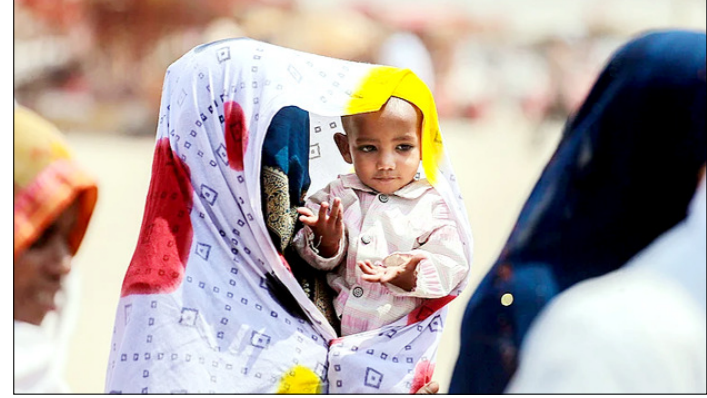
प्राणराज। भीषण गर्मी में कपड़ा ढक्कर अपने बच्चे को घुप से बचाती महिला।

तात्कालिक खतरा नहीं था और कुछ राजनीतिक शक्तियों ने बाहरी प्रभाव में आकर अमेरिकी युद्ध में धकेला। उन्होंने अमेरिकी विदेश नीति की भी आलोचना करते हुए कहा कि राजनीतिक नैरेटिव के कारण खुफिया सूचनाओं को कमजोर किया गया और युद्ध को इजरायल तथा उसके समर्थकों के दबाव में आगे बढ़ाया गया। उन्होंने आशंका जताई कि यह संघर्ष अमेरिका को एक और लंबे परिचय एशिया युद्ध में धकेल सकता है और युद्ध तक पहुंचने वाली निर्णय प्रक्रिया को पुनर्समीक्षा की जरूरत है। उन्होंने लिखा कि जून 2025 तक आप समझते थे कि मध्य-पूर्व के युद्ध एक जाल है, जिन्होंने अमेरिका के सैनिकों की जान ली और देश की समृद्धि को नुकसान पहुंचाया। उन्होंने ट्रम्प के पहले कार्यकाल में कासिम सुलेमानी की हत्या और आर्इएसआईएस के खिलाफ कार्रवाई का उल्लेख करते हुए कहा कि उस समय सैन्य शक्ति का उपयोग बिना लंबे युद्ध में फंसे किया गया था।