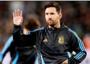
इस वजह से इस साल सभी प्रतियोगिताओं में वह सिर्फ 12 मैच ही खेल पाए हैं। जबकि 2025 में उन्होंने 28 मैच खेले थे। मेसी ने 'लो डेल पांको' शो में कहा कि हम चाहते हैं कि सबसे बेहतरीन खिलाड़ी (वर्ल्ड कप में) मौजूद हों और नेमार, चारों उनकी फॉर्म कैसी भी हो, हमेशा उन बेहतरीन खिलाड़ियों में से एक रहेंगे। वर्ल्ड कप में उन्हें खेलते देखना बहुत मनाना होगा,

ब्यूस आरमस, बार्ना। लिक्वान मेसी का मानना है कि नेमार अभी भी फुटबॉल के बेहतरीन खिलाड़ी हैं। उन्होंने उम्मीद जताई कि बाजील का यह फॉरवर्ड अगले पहरी होने वाले फ्रीफा वर्ल्ड कप के लिए समय पर वापसी कर लेगा। बाजील के अब तक के सबसे ज्यादा गोल करने वाले खिलाड़ी नेमार ने अक्टूबर 2023 के बाद से अपने देश के लिए कोई मैच नहीं खेले हैं।