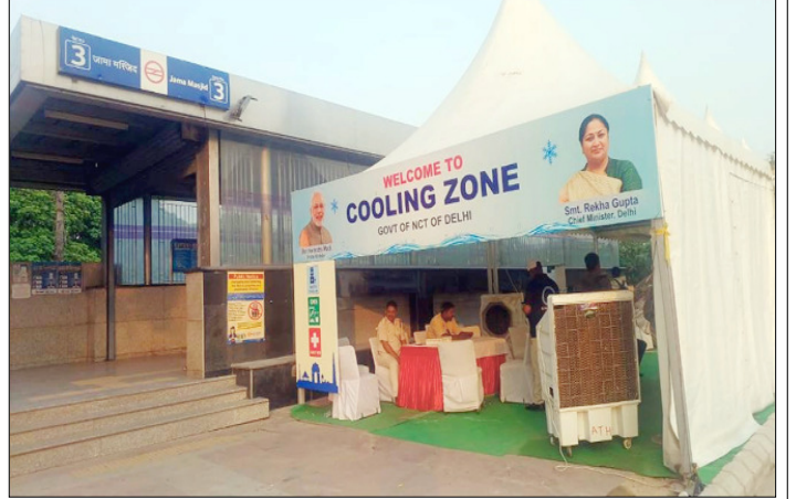
पुरानी दिल्ली क्षेत्र में जामा मस्जिद मेट्रो स्टेशन के पास आम लोगों की सुविधा व राहत के लिए विशेष कूलिंग जोन तैयार किया गया।