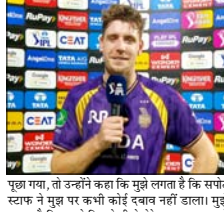
पूछा गया, तो उन्होंने कहा कि मुझे लगता है कि सपोर्ट स्टाफ ने मुझ पर कभी कोई दबाव नहीं डाला। मुझे लगता है कि पहले दिन से ही वे मेरे साथ बहुत अच्छे रहे हैं। उन्होंने कहा कि मुझे यह महसूस नहीं कराया कि टीम के किसी खिलाड़ी के मुकाबले मुझ पर कोई दबाव रहा है। ग्रीन ने अपनी गतिविधि को लेकर जहाँ जहाँ जाती चिंताओं को भी दूर करते हुए कहा कि वह बार ओवर गेंदाजी करने के लिए 100 फोर्सरी तैयार है।

केकेआर टीसी समथ पर अपनी बेहतरीन फॉर्म में आती दिख रही हैं। टूर्नामेंट की शुरूआत उनके लिए काफी मुश्किल रही, पहले छह मैचों में उन्हें कोई जीत नहीं मिली, लेकिन अब उन्होंने प्रदर्शन पकड़ ली है और लगातार चार मैच जीत लिए हैं। ग्रीन ने मैच के बाद शुक्रवार को कहा कि मुझे नहीं लगता कि हमारा आत्मविश्वास कभी कम हुआ था, जोरिह है। मैं चाहूँ कि वह वर्ल्ड कप में खेलें और उनके साथ सब कुछ अच्छा हो, क्योंकि वह जिस तरह का इंसान है, क्योंकि वह जिस तरह का इंसान है।