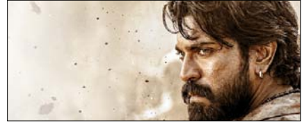
भोपाल में 16 मई को होगा 'पेड्डू' का ग्रैंड ट्रेलर लॉन्च बॉलीवुड