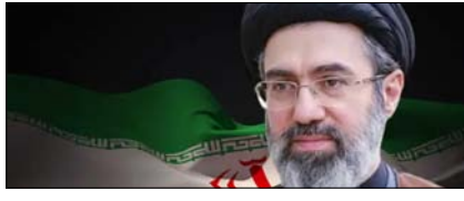
ईरान में प्रमुख ताकत बनकर उभरे मुजतबा खामेनेई पेज 11