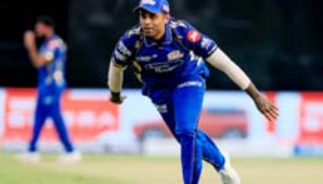
रायपुर पहुंचने को उम्मीद है। क्या टी20 विश्व कप जीतने वाले यह कप्तान रविवार को फिर से टीम की कप्तानी करेंगे, यह निश्चित नहीं है। हालांकि, क्रिकेबल इस बात की पुष्टि कर सकता है कि सूर्यकुमार-जो भारत के टी20आई कप्तान हैं और जिन्होंने 4 मई को पिछले मैच में मुंबई इंडियंस को अपनी उपलब्धता के बारे में बता दिया है। उनके जन्म ही

जिसके चलते थोड़ी अनिश्चिन्ता थी कि क्या वह अपने परिवार में पर सदस्य के आने के ठीक 48 घंटे बाद समय पर रायपुर पहुंच पाएंगे या नहीं। हालांकि, क्रिकेबल इस बात की पुष्टि कर सकता है कि सूर्यकुमार-जो भारत के टी20आई कप्तान हैं और जिन्होंने 4 मई को पिछले मैच में मुंबई इंडियंस को अपनी उपलब्धता के बारे में बता दिया है। उनके जन्म ही