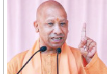
कैबिनेट विस्तार और संगठन में फेरबदल तथा आयोगों, निगमों और बोर्डों में खाली पदों पर नियुक्तियां जल्द