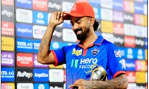
ओपनर भी साई सुदर्शन और शुभमन गिल भी रस में तेजी से आगे बढ़ सकते हैं। सूर्यवंशी फलहाल 404 रन के साथ पांचवें स्थान पर हैं, जबकि साई सुदर्शन 385 रन के साथ सातवें और गिल 378 रन के साथ दसवें स्थान पर हैं। ऑरेंज कैप तालिका में कार्तिक