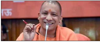
उत्तर प्रदेश में मंत्रिमंडल का विस्तार आज! पेज 2

नई दिल्ली, मुजफ्फरनगर, देहरादून, हल्द्वानी, मुगदाबाद, बरेली, मेरठ व लखनऊ से प्रकाशित