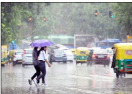
14 मई तक सामान्य से कम बारिश होने की संभावना