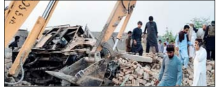
आत्मघाती हमले से दहला पाक, विस्फोटक से भरी गाड़ी चेकपोस्ट से टकराई