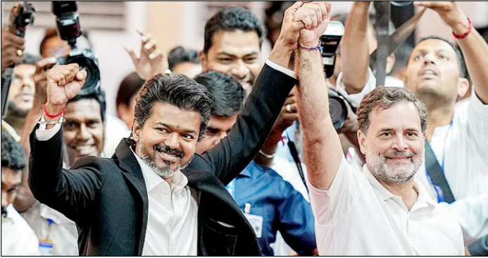
चेन्नई। जवाहरलाल नेहरू स्टेडियम में अपने शपथ ग्रहण समारोह के दौरान लोकसभा में विपक्ष के नेता राहुल गांधी के साथ हाथ मिलाते तमिलनाडु के नवनिर्वाचित मुख्यमंत्री (टीवीके) प्रमुख विजय।