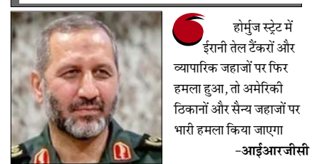
होर्मुज स्ट्रेट में ईरानी तेल टैंकरों और व्यापारिक जहाजों पर फिर हमला हुआ, तो अमेरिकी ठिकानों और सैन्य जहाजों पर भारी हमला किया जाएगा -आईआरजीसी

संयुक्त राष्ट्र में अमेरिका के प्रस्ताव को बहरीन एवं अन्य देशों का समर्थन मिलने की रिपोर्टों के बीच दी चेतावनी