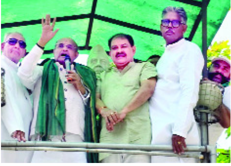
जाकर उनकी समस्याओं का समाधान कराए। उन्होंने कहा कि पूर्व प्रधानमंत्री भारत रत्न स्व चौधरी चरण सिंह जी ने लोक-

शाह टाइम्स संवाददाता मोदीनगर/गाजियाबाद। रा.ल. द. में शामिल होने के बाद जनपद गाजियाबाद में प्रथम बार आमजन पर पूर्व सांसद के सी त्यागी का यूपी गेट से लेकर मोदीनगर तक कई जगहों पर रालोद कार्यक्रमों में उनका भव्य स्वागत किया गया। पार्टी कार्यालय पर कार्यकर्ताओं को सम्बोधित करते हुए उन्होंने कहा कि उत्तर प्रदेश में रालोद मजबूत होगा तो एनडीए मजबूत होगा। उन्होंने कहा कि 2027 के उत्तर प्रदेश में होने वाले विधानसभा चुनाव में एनडीए प्रचंड बहुमत से सरकार बनाएगा। रालोद कार्यकर्ताओं से कहा कि वो जनता के बीच