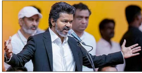
नौ अन्य मंत्री भी मंत्रिमंडल में शामिल, सभी ने तमिल भाषा में ईश्वर के नाम पर शपथ ग्रहण की

तमिलनाडु की राजनीति में एक नया अध्याय लिखते हुए, नवगठित पार्टी 'तमिलनाडु वेत्ती कथगम' (टीवीके) के संस्थापक और अभिनेता-राजनेता सी. जोसेफ विजय ने रविवार को राज्य के 13वें मुख्यमंत्री के रूप में शपथ ली। उन्होंने इस राज्य में कई दशकों से शासन की बागडोर संभालने वाले दलों द्रविड़ मुनेत्र कथगम (द्रमुक) और अन्नाद्रमुक को हरा कर यह मुकाम हासिल किया। उन्होंने चुनाव में शानदार प्रदर्शन करते हुए इन दोनों पार्टियों के लगभग 60 साल पुराने एकाधिकार को समाप्त कर दिया। रविवार सुबह करीब दस बजे, जवाहरलाल नेहरू इंडोर स्टेडियम में आयोजित एक सादे समारोह