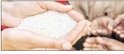
अनाज के ढेर पर बैठी भूखी दुनिया सम्पादकीय