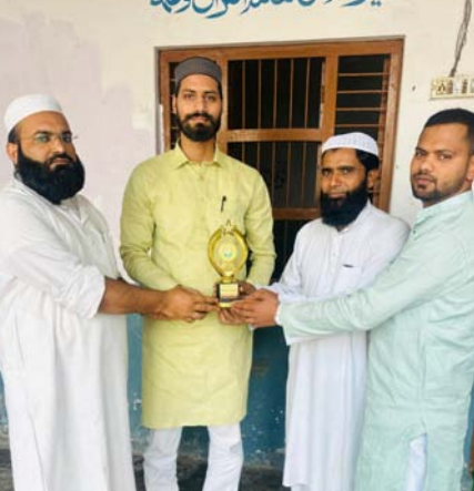
अच्छे संस्कार और शिक्षा देकर समाज का जिम्मेदार नागरिक बनाएं। कार्यक्रम में उस समय खास रौनक देखने को मिली जब दो बच्चों के हाफिज-ए-कुरआन मुकम्मल होने पर उनकी दस्तारबंदी की गई। वहीं 20 बच्चों ने नाजरा मुकम्मल किया, जिनकी