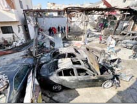
■ पिछले सप्ताह इजरायली हमलों में पूरे देश में 120 से अधिक लोग मारे गए जिनमें महिलाएं और बच्चे भी शामिल

बेरूत। लेबनान के स्वास्थ्य मंत्रालय ने कहा कि इजरायल द्वारा लेबनान में किए गए भीषण हमलों में 39 लोग मारे गए। यह जानकारी बीबीसी ने रविवार को दी। मंत्रालय ने कहा कि दक्षिणी शहर सक्सकियाह पर हुए एक इजरायली हमले में एक बच्चे सहित कम से कम सात लोग मारे गए।