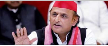
अखिलेश यादव ने योगी मंत्रिपरिषद विस्तार पर कसा तंज

नई दिल्ली, मुजफ्फरनगर, देहरादून, हल्द्वानी, मुरादाबाद, बरेली, मेरठ व लखनऊ से प्रकाशित