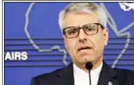
■ बकाई ने अपनी पोस्ट में 'हॉलीवुड फिल्म 'डा. स्ट्रेंजलव' का उल्लेख करते हुए अमेरिकी बयानबाजी का उपहास भी उड़ाया

इरान के विदेश मंत्रालय के प्रवक्ता इस्माइल बकाई ने सोशल मीडिया मंच एक्स पर कहा कि यह 'विकृत विडंबना' है कि अमेरिका एक ओर शांति और परमाणु संकट रोकने को बात करता है और दूसरी ओर 'एक बड़ी चमक' जैसी भाषा का इस्तेमाल कर सैन्य धमकी देता है। बकाई ने अपनी पोस्ट में 'हॉलीवुड फिल्म 'डा. स्ट्रेंजलव' का उल्लेख करते हुए अमेरिकी बयानबाजी का उपहास भी उड़ाया। यह प्रतिक्रिया ट्रम्प के उस बयान के बाद आई जिसमें उन्होंने कहा था कि यदि इरान के साथ युद्धविराम समाप्त होता है तो आपका जानने की जरूरत नहीं पड़ेगी, बस इरान से उठती एक बड़ी चमक दिखाई देगी। उन्होंने यह भी कहा था कि इरान को समझौते पर जल्द हस्ताक्षर कर देने चाहिए, अन्यथा उसे 'काफी दर्द' झेलना पड़ेगा। इस बीच,