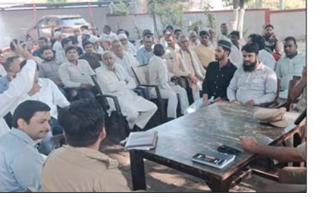
साथ महत्वपूर्ण बैठक की। बैठक में भारतीय किसान यूनियन सहित क्षेत्र के कई गणमान्य लोग मौजूद रहे।