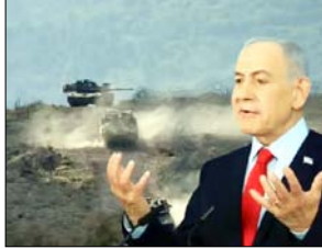
■ वॉल स्ट्रीट जर्नल का अमेरिकी अधिकारियों सहित अन्य स्रोतों के हवाले से खुलासा

तेहरान। इजरायली अधिकारियों ने इरान के खिलाफ हवाई हमले शुरू करने के लिए इराकी रिंगिस्तान में गुप्त सैन्य अड्डा स्थापित किया है। यह जानकारी रविवार को वॉल स्ट्रीट जर्नल ने अमेरिकी अधिकारियों सहित अन्य स्रोतों के हवाले से दी। सूत्रों के अनुसार, इजरायली सेना ने विशेष बलों को रखने के लिए एक ठिकाना बनाया है। यह बेस इजरायली वायु सेना के लिए रसद केंद्र के रूप में भी काम करता है। सूत्रों का दावा है कि इस बेस की स्थापना इरान के खिलाफ सैन्य कार्रवाई शुरू होने के ठीक पहले हुई थी। प्रकाशन ने स्पष्ट किया कि वहां खोज और बचाव दल भी तैनात किए गए हैं ताकि विमान गिरने पर इजरायली पायलटों की तलाश की जा सके। एक अनाम सूत्र ने बताया कि इजरायली वायु सेना के विशेष बल, जिन्हें दुश्मन के इलाके में तोड़फोड़ की कार्रवाई का प्रशिक्षण दिया गया है, वे भी इस बेस पर तैनात हैं। सूत्रों ने वॉल स्ट्रीट जर्नल को बताया कि इराकी रिंगिस्तान में स्थित यह इजरायली बेस का पता लगभग मार्च में लगा था। अखबार ने अनाम इराकी सरकारी मीडिया का हवाला देते हुए