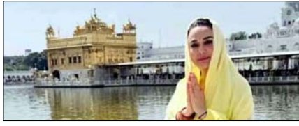
आईपीएल के अहम मुकाबले से पहले प्रीति जिंटा ने गोलडन टेम्पल में माथा टेका