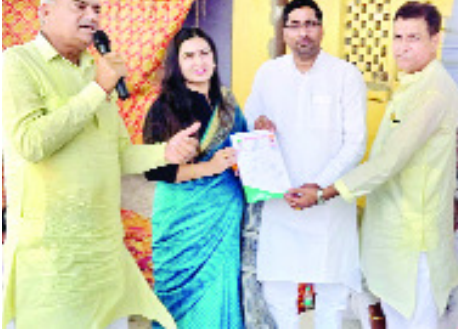
ने कहा कि अब जाट आरक्षण केंद्रीय सेवाओं में लेकर रहेंगे। अगर केंद्रीय सेवा में आरक्षण नहीं मिला तो सरकार