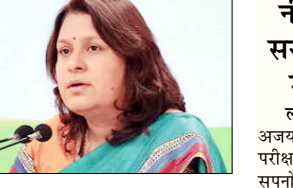
नीट परीक्षा रद्द होने पर सुप्रिया श्रीनेत ने बोला हमला

नई दिल्ली, वार्ता कांग्रेस ने नीट यूजी 2026 परीक्षा रह होने पर केंद्र सरकार की आलोचना की और केंद्रीय शिक्षा मंत्री धर्मेश प्रधान से इस्तीफा देने की मांग की है। कांग्रेस की सोशल मीडिया, डिजिटल प्लेटफॉर्म चेयरपर्सन सुप्रिया श्रीनेत ने पेपर लीक मामले को लेकर केंद्र की भारतीय जनता पार्टी सरकार और केंद्रीय शिक्षा मंत्री पर गंभीर आरोप लगाए हैं। उन्होंने कहा कि इस बार करीब 22 लाख छात्रों ने नीट परीक्षा दी थी। छात्रों ने दिन-रात मेहनत कर तैयारी की, अभिभावकों ने कोचिंग और परीक्षा से जुड़े खर्च उठाए, लेकिन अंत में उन्हें पेपर लीक और परीक्षा रह होने का सामना करना पड़ा। उन्होंने कहा कि शायद फजी डिग्री वालों से शिक्षा के संबंध में गंभीरता की आशा ही बेमानी है। केंद्रीय शिक्षा मंत्री धर्मेश प्रधान को अपने पद पर बने रहने का कोई हक नहीं है। कांग्रेस नेता ने आरोप लगाया कि सरकार शिक्षा व्यवस्था को संभालने में पूरी तरह विफल रही है। मंत्री और सरकार देश के छात्रों के भविष्य को लेकर गंभीर नहीं हैं और एक इतिहास भी