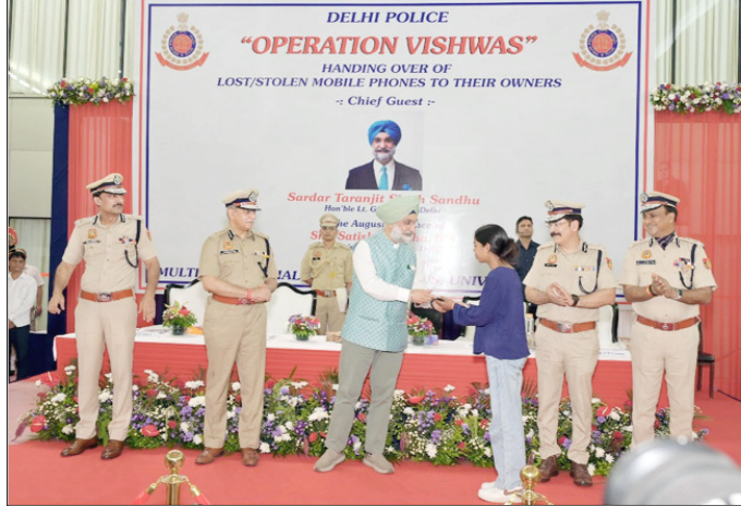
दिल्ली पुलिस की विशेष पहल 'ऑपरेशन विश्वास' के तहत बरामद किए गए चोरी व गुप्त हुए मोबाइल फोन एक समारोह में उनके असली मालिकों को सौंपते हुए।

पुलिस टीम ने उसको मौके पर ही पकड़कर तलाशी में पिस्टल और कारतूस बरामद किया। पूछताछ करने पर पता चला कि वह टिल्लू गैंग का सदस्य है और सात वारदातों में शामिल रहा है। उसके पास से शम्भू हथियार उसने राहिंगी इलाके में रहने वाले एक युवक से लिये थे। जिसको पकड़ने की कोशिश की जा रही है।