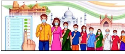
2027 में योगी को हराने का सपना देखना छोड़ दे विपक्ष सम्पादकीय