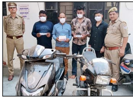
दी। युवक ने जब इसका विरोध किया तो स्कूटी सवार युवक ने अपने अन्य साथियों को मौके पर बुला लिया।