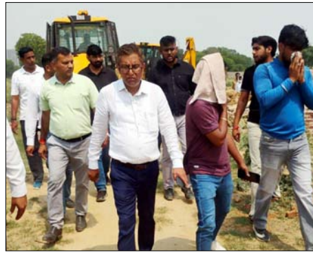
विना अवैध निर्माण करने वालों को खिलाफ कड़ी कार्रवाई की जाएगी। एसीओ ने जनमानस से अपील की है कि ग्रेटर नोएडा में