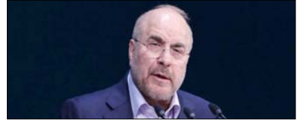
ईरान की 14-सूत्रीय योजना का कोई विकल्प नहीं: गालिबफ पेज 12