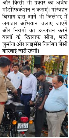
और किसी भी प्रकार का अवैध मॉडीफिकेशन न कराएं। परिवहन विभाग द्वारा आगे भी जिलेभर में लगातार अभियान चलाए जाएंगे और नियमों का उल्लंघन करने वालों के खिलाफ सीज, भारी जुर्माना और लाइसेंस निलंबन जैसी कार्रवाई जारी रहेगी।

कठोर चेतावनी दी। इसके अलावा अभियान के दौरान छह अन्य वाहनों का भी मॉडीफाई साइलेंसर लगाने पर चालान किया गया। अधिकारियों ने स्पष्ट किया कि ऐसे वाहन चालकों को के ड्राइविंग लाइसेंस निलंबित करने की कार्रवाई भी की जाएगी। उन्होंने कहा कि कई बार ऐसे साइलेंसर से निकलने वाली तेज आवाज से बुजुर्ग, बच्चे और मरीज प्रभावित होते हैं, वहीं सड़क पर चल रहे अन्य वाहन चालक भी अचानक घबराकर हाइसे का शिकार हो सकते हैं। उन्होंने वाहन चालकों से अपील करते हुए कहा कि सभी लोगों का जुर्माना लगाते हुए भविष्य में इस तरह का कार्य दोबारा न करने की