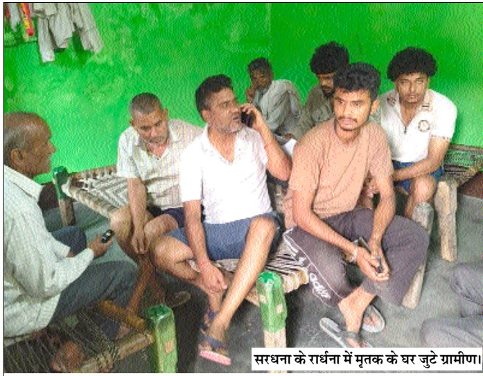
सरधना के राधना में मृतक के घर जुटे ग्रामीण।

शाह टाइम्स संवाददाता सरधना। क्षेत्र के राधना गांव निवासी एक युवक की दुबई के शहराह में संदिग्ध परिस्थितियों में मौत हो जाने से परिवार पर दुखों का पहाड़ टूट पड़ा। विदेश से फोन पर मिली मौत की सूचना के बाद घर में चीख-पुकार मच गई, जबकि पूरे गांव में शोक की लहर दौड़ गई। परिजनों ने युवक की मौत को संदिग्ध बताते हुए हत्या की आशंका जताई है। साथ ही भारत सरकार और विदेश मंत्रालय से शव को जल्द भारत लाने तथा मामले की निष्पक्ष जांच करवाने की मांग की है।