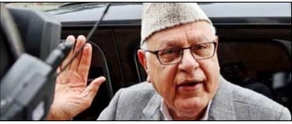
केंद्र राजस्व की भरपाई कर दे, तो उमर सरकार शराब पर प्रतिबंध लगा सकती है: फारुक पेज 2

नई दिल्ली, मुजफ्फरनगर, देहरादून, हल्द्वानी, मुगदाबाद, बरेली, मेरठ व लखनऊ से प्रकाशित