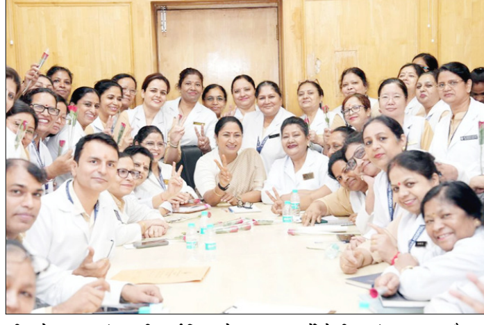
सीएम रेखा गुप्ता अंतरराष्ट्रीय नर्स दिवस के अवसर पर नर्सों के बीच पहुंचकर उनका हौसला बढ़ाती हुईं।

धैर्य हम सभी के लिए प्रेरणा है। उन्होंने अस्पताल में कार्यरत विभिन्न राज्यों के (केरल, राजस्थान, पंजाब आदि) के नर्सिंग स्टाफ से विशेष तौर पर बात की। उन्होंने कहा कि दिल्ली की विश्वस्तरीय स्वास्थ्य सेवाओं की सफलता के पीछे देश के कोने-कोने से आए इन जांबाज स्वास्थ्यकर्मियों का महत्वपूर्ण योगदान है। मुख्यमंत्री ने संवाद के दौरान बताया कि दिल्ली सरकार ने 27 साल का लंबा इंतजार खत्म करते हुए नर्सिंग इंटरर्स के स्टूडेंट्स में 27 गुना की रिकॉर्ड वृद्धि की है।