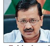
पेट्रोल डीजल वाले बयान पर बोली 'आप'

नई दिल्ली, वार्ता आम आदमी पार्टी के राष्ट्रीय संयोजक अरविंद केजरीवाल ने कहा है कि प्रधानमंत्री नरेंद्र मोदी को इस बारे में स्थिति स्पष्ट करनी चाहिए कि इस समय देश की अर्थव्यवस्था कैसी है और एक साल बाद अर्थव्यवस्था कैसी रहने वाली है। श्री केजरीवाल ने आज यहां संवाददाता सम्मेलन में कहा कि पश्चिम एशिया संकट का प्रभाव दुनिया भर में है लेकिन प्रधानमंत्री ने जिस प्रकार देशवासियों से सात आह्वान किया है उस प्रकार के कदम किसी देश में नहीं उठाए। प्रधानमंत्री ने सिर्फ मध्यम वर्ग से ही कुर्बानी देनी की अपील की है जो बहुत दुखद है। अगर सबसे अधिक कुर्बानी देनी थी, तो सरकार को अपने खर्चों में कटौती