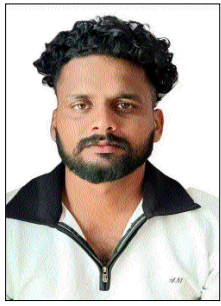
मृतक का फाइल फोटो।

विदेश से आई मौत की खबर के बाद राधना गांव में पसरा मातम, शव भारत लाने की उठी मांग