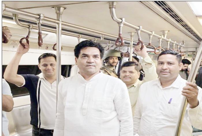
कला, संस्कृति एवं भाषा मंत्री कपिल मिश्रा परिवहन के लिए दिल्ली मेट्रो का प्रयोग करते हुए।

कपिल मिश्रा ने कहा कि वैश्विक संकट के बीच प्रधानमंत्री नरेंद्र मोदी के आह्वान का पालन करते हुए ईंधन बचाना एवं ऊर्जा का संरक्षण करना हम सबका राष्ट्रीय कर्तव्य है।