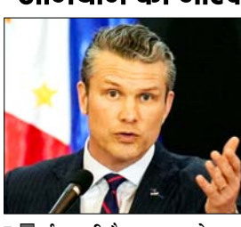
ईरान की सैन्य ताकत को बढ़ा नुकसान पहुंचाया गया है, हेगसेथ

सवाल उठाए। सीनेटर क्रिस कुन्स ने कहा कि यह युद्ध बिना किसी स्पष्ट लक्ष्य और अंत की योजना के लड़ा जा रहा है, जिसकी कीमत अमेरिकी जनता चुका रही है। वहीं सीनेटर पैटी मरे ने बढ़ती ईंधन और खाद्य कीमतों के बीच भारी रक्षा खर्च पर सवाल उठाए। पेंटागन के मुताबिक ईरान संघर्ष पर अब तक करीब 29 अरब डॉलर खर्च हो चुके हैं, हालांकि अमेरिकी सैन्य ठिकानों को हूए नुकसान का पूरा आकलन अभी बाकी है। सुनवाई के दौरान सबसे बड़ा