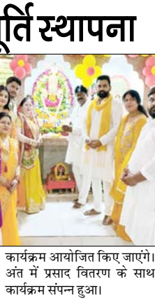
कार्यक्रम आयोजित किए जाएंगे। अंत में प्रसाद वितरण के साथ कार्यक्रम संपन्न हुआ।