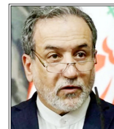
अराघची ने यह बात तेहरान में नार्वे के उप-विदेश मंत्री के साथ बैठक के दौरान कही

कहा: पश्चिम एशिया संकट को लेकर अमेरिका के कदम शांति कायम होने में सबसे बड़ी बाधा