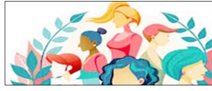
स्त्री को खुद लिखनी होगी अपनी परिभाषा