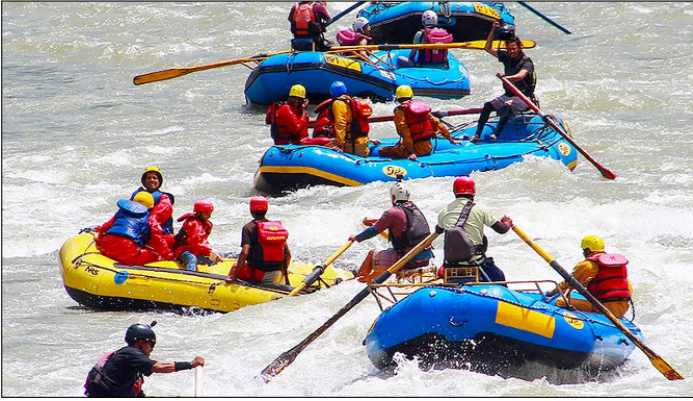
कुल्चू-मनाली। वीजा श्रुत के दौरान ब्यास नदी में रिवर राफ्टिंग का आनंद लेते पर्यटक।