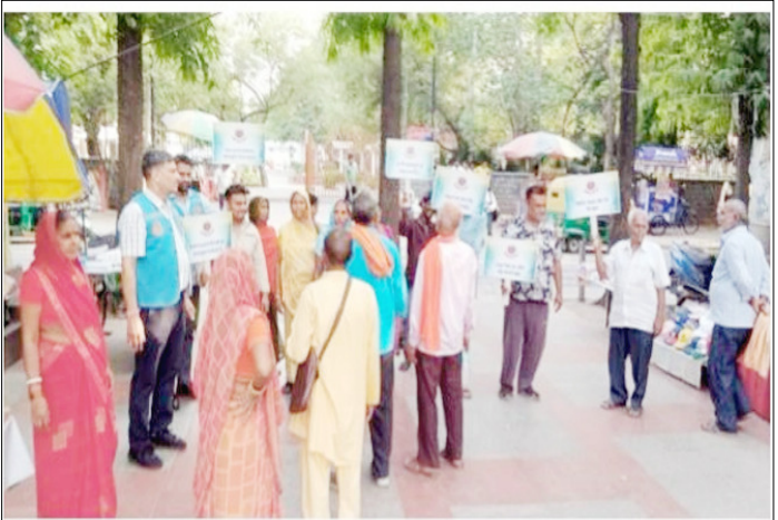
दिल्ली पुलिस की अपराध शाखा एएनटीएफ ने 'नशा मुक्त भारत अभियान' के तहत, गांधी दर्शन, में एक नशा-विरोधी जागरूकता कार्यक्रम आयोजित किया जिसमें भाग लेते आमजन।