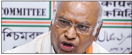
बुजुर्गों, विधवाओं व दिव्यांगों के साथ अन्याय कर रही है मोदी सरकार: खड़गे

नई दिल्ली, मुजफ्फरनगर, देहरादून, हल्द्वानी, मुरादाबाद, बरेली, मेरठ व लखनऊ से प्रकाशित