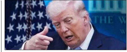
ट्रम्प के रक्षा बजट पर मचा बवाल, ईरान युद्ध पर अमेरिकी संसद में घमासान