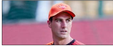
पैट कमिंस पर धीमे ओवर रेट के लिए 12 लाख रुपये का जुर्माना