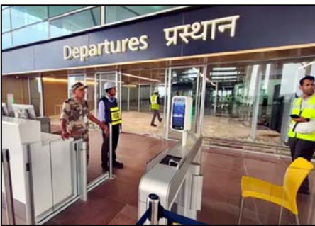
गंतव्यों की जानकारी जल्द जारी की जाएगी।

शाह टाइम्स संवाददाता यमुना सिटी। नोएडा अंत. राष्ट्रीय एयरपोर्ट (एनआईए) 15 जून 2026 से यात्रियों के लिए खुल जाएगा। एयरपोर्ट प्रशासन ने शुक्रवार को इसकी घोषणा की। उद्घाटन के बाद यहां से कर्मशियल उड़ानें शुरू हो जाएंगी। एयरपोर्ट को संचालन की मंजूरी नागरिक उड्डयन सुरक्षा ब्यूरो (बीसीएस) से एयरपोर्ट सिक्योरिटी प्रोग्राम (एएसपी) क्लियर होने के बाद मिली है। इसके साथ ही सुरक्षा बांचा, सिस्टम और ऑपरेशन सभी नियामकीय मानकों पर खरे पाए गए हैं। एयरपोर्ट से पहले कर्मशियल फ्लाइट इंडिया संघा. लित करेगी। इसके बाद जल्द ही अकासा एयरलाइन और एयर इंडिया एक्सप्रेस भी अपनी सेवाएं शुरू करेंगी। फ्लाइट शेड्यूल और