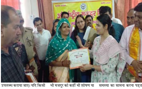
उपलब्ध कराया जाए। यदि किसी भी मजदूर को कहीं भी शोषण या समस्या का सामना करना पड़ता

मजदूर समाज की रीढ़ हैं और उनके बिना औद्योगिक विकास की कल्पना अधुनी है। उन्होंने स्पष्ट किया कि मजदूरों की समस्याओं को नजरअंदाज करना किसी भी स्तर पर स्वीकार्य नहीं होगा और प्रत्येक शिकायत का प्राथमिकता के आधार पर समाधान सुनिश्चित किया जाएगा। डीएम ने अधिकारियों को निर्देशित करते हुए कहा कि श्रमिकों से जुड़े मामलों में लापरवाही बढाते वाले अधिकारियों के खिलाफ भी कार्रवाई की जाएगी। प्रशासन का यह दायित्व है कि मजदूरों को सुरक्षित कार्यस्थल, समान वेतन, सामाजिक सुरक्षा और सम्मानजनक वातावरण