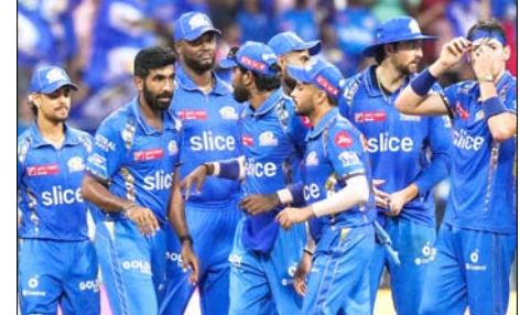
दोनों को तीन-तीन बार आउट कर चुके हैं, जो उन्हें एक बड़ा खतरा बनाता है। गायकवाड़ ने बोल्ट के खिलाफ छह पारियों में सिर्फ 34 रन बनाए हैं और तीन बार आउट हुए हैं। इस दौरान उनका स्ट्राइक रेट 110 है। जबकि बुमराह के खिलाफ गायकवाड़ ने चार पारियों में 29 रन बनाए हैं और एक बार भी आउट नहीं हुए और उनका स्ट्राइक रेट 153 रहा है। वहीं सैमसन का रिकॉर्ड बुमराह के खिलाफ 14 पारियों में 84 रन और दो बार आउट हुए हैं जबकि उन्होंने 114 की स्ट्राइक रेट से रन बनाए हैं। बोल्ट के खिलाफ आठ पारियों में उन्होंने 32 रन बनाए हैं और तीन बार आउट हुए हैं। उनका स्ट्राइक रेट 119 का रहा है। मुंबई के मिडिल ऑर्डर के सामने रिमसन की चुनौती मुंबई के मिडिल ऑर्डर सूर्यकुमार यादव, तिलक वर्मा और हार्दिक पंड्या को नूर अहमद और अकोल हुसैन जैसे स्पिनर्स के खिलाफ चुनौती का सामना करना होगा।

चेन्नई, वार्ता। आईपीएल 2026 के 44वें मैच में एक बार फिर दो पुराने राइवल आमने-सामने होंगे। चेन्नई सुपर किंग्स (सीएसके) अपने घर में मुंबई इंडियंस (एमआई) का सामना करेगी और सीजन में दूसरी बार उन्हें हराने की कोशिश भी करेगी। इस सीजन आठ में से छह मैच गुंवा चुकी मुंबई भी कोशिश करेगी कि अपने घर में मिली करारी हार का बदला चेपक में ले पाए। हालांकि, उनके लिए यह आसान नहीं होने वाला है। मुंबई के लिए यह मैच आखिरी उम्मीद बनाए रखने वाला मैच है जबकि एक जीत चेन्नई को संजु सैमसन को जल्दी आउट करने की कोशिश करेगी। बोल्ट पहले ही बुमराह और बोल्ट लेंगे सीएसके की सलामी जोड़ी की परीक्षा जसप्रीत बुमराह और ट्रेंट बोल्ट पावरप्ले में सीएसके की सलामी जोड़ी ऋतुराज गायकवाड़ और संजु सैमसन को जल्दी आउट करने की कोशिश करेगी। बोल्ट पहले ही