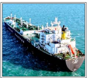
शांति के प्रयासों को झटका यूएई बोला: होर्मुज के मुद्दे पर ईरान पर नहीं किया जा सकता है भरोसा

लंदन/दुबई। पश्चिम एशिया में बढ़ते तनाव के कारण रणनीतिक होर्मुज जलडमरूमध्य से जहाजों की आवाजाही में भारी कमी आई है। समुद्री सुरक्षा अधिकारियों के आकलन के अनुसार, संघर्ष शुरू होने के बाद से यातायात 90 फीसदी से अधिक घट गया है। यह गिरावट अमेरिका और इजरायल के ईरान पर हमलों तथा तेहरान की जवाबी कार्रवाई के बाद हुई है।