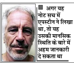
अगर यह नोट सच में एपस्टीन ने लिखा था, तो यह उसकी मानसिक स्थिति के बारे में अहम जानकारी दे सकता था

वाशिंगटन। यौन अपराधी जेफ्री एपस्टीन के मरने से पहले उसके सुसाइड नोट लिखने का दावा किया गया है। यह कथित सुसाइड नोट पिछले करीब 7 साल से न्यूयॉर्क की अदालत में सील है। इस वजह से इसे अब तक सार्वजनिक नहीं किया गया।