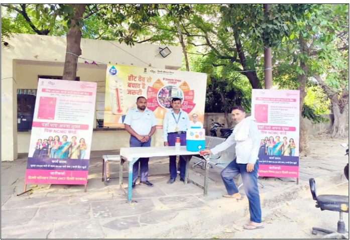
भीषण गर्मी के बीच प्रमुख बस टर्मिनलों पर तैनात 'जलदूत' यात्रियों व राहगीरों को मुफ्त पीने का शीतल पानी उपलब्ध कराते हुए।

शाह टाइम्स संवाददाता नई दिल्ली। अखिल भारतीय रेलवे खान-पान लाइसेंसधारक रेलवेफेर एसोसिएशन ने रेलवे मंत्रालय और रेलवे बोर्ड से रेलवे प्लेटफॉर्म पर संचालित खान-पान स्टॉल, ट्रेट्री, ट्रे, ढाबा और अन्य वेंडिंग यूनिट्स के लाइसेंसधारकों को तत्काल राहत देने की मांग की है। एसोसिएशन ने सरकार का ध्यान इस ओर भी दिलाया है कि देशभर में कमर्शियल गैस सिलेंडर की कीमतों में कचरीय एक हजार रुपये तक की बढ़ोतरी हो गई है ऐसे में वेंडरों के सामने भारी परेशानी खड़ी हो गई है। एसोसिएशन के अनुसार, देशभर में 20 से 30 प्रतिशत ढाबे, रेस्टोरेंट और होटल पहले ही इस आर्थिक संकट के कारण बंद हो चुके हैं। कई लाइसेंसधारकों ने अपनी 20% से 50% यूनिट्स तक सरेंडर करने के लिए आवेदन दे दिए हैं, क्योंकि वे लगातार भारी नुकसान झेल रहे हैं और कोविड-19 महामारी के वित्तीय प्रभाव से अब तक उबर नहीं पाए हैं।