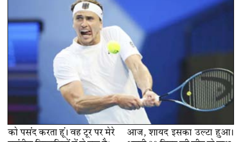
को पसंद करता हूं। वह दूर पर मेरे पसंदीदा खिलाड़ियों में से एक है। मेरे उसके साथ और उसके पिता के साथ बहुत अच्छे संबंध हैं। यह खेल है, खेल बहुत तेजी से बदल सकता है। म्युनिख में, उसने एक शानदार मैच खेला और मैंने बहुत अच्छा मैच नहीं खेला। आज, शायद इसका उल्टा हुआ। अपनी 90 मिनट की जीत के साथ, ज्वेरेव 1990 में इस सीरीज के शुरू होने के बाद से, सीजन के पहले चार मास्टर्स 1000 इवेंट में से हर एक के सेमीफाइनल में पहुंचने वाले सिर्फ चौथे खिलाड़ी बन गए हैं, उन्होंने रोजर फेडरर