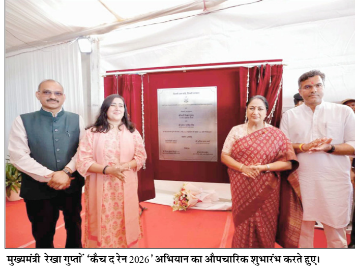
मुख्यमंत्री रेखा गुप्ता 'कैच द रेन 2026' अभियान का औपचारिक शुभारंभ करते हुए।

में काफी मशक्कत करती पड़ती है। कई बार स्थिति इतनी गंभीर हो जाती है कि फायर कर्मियों को 100 मीटर या उससे अधिक दूरी तक होज पाइप जोड़कर आग बुझाने का प्रयास करना पड़ता है। इससे समय की बर्बादी और आग के फैलने का खतरा भी कई गुना बढ़ जाता है। अनधिकृत कॉलोनियों में बिजली के तारों का जाल अव्यवस्थित तरीके से फेंका हुआ है। पुराने और जर्जर वायरिंग सिस्टम पर अत्यधिक लोड होने के कारण शॉर्ट सर्किट की घटनाएं आम हो गई हैं। अधिकारियों को प्रति तो दिल्ली में होने वाली 80 प्रतिशत से अधिक आग की घटनाएं शॉर्ट सर्किट के कारण होती हैं।