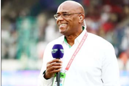
के नियंत्रण की बात करते हैं और साथ ही शरीर के नियंत्रण की भी। जब आप मैदान पर स्लाइड करने के बाद खड़े होने की कोशिश कर रहे हैं तो क्या वे ए मान रहे हैं कि उंगलियां गेंद के नीचे थीं। उन्होंने कहा कि क्योंकि हाथ का पिछला हिस्सा ऊपर की ओर था जिसका मतलब है कि गेंद मैदान की ओर थी। अब मेरे लिए संदेह की बात गेंद और जमीन को लेकर है क्योंकि जब तक आप स्लाइड करना नहीं रोक लेते हैं और जानस खड़े हो जाते हैं तब आपका शरीर

अहमदाबाद, वार्ता। पूर्व क्रिकेटर और कमेंटेटर इयान बिशप का मानना है कि गुजरात टाइटंस (जीटी) और रॉयल चैलेंजर्स बंगलुरु (आरसीबी) के बीच गुरुवार की रात खेले गए मैच में जेसन होल्डर द्वारा रजत पाटीदार का पकड़ा गया कैच पूरी तरह वैध नहीं था। इयान बिशप ने क्रिकइंफो के स्टूडियो में अभिनव मुकुंद के साथ होल्डर के कैच पर चर्चा के दौरान यह बात कही। उन्होंने कहा कि इस बारे में मेरी बहस इस चीज पर होगी: जेसन होल्डर ने पहले गेंद को पकड़ा जिसमें कोई समस्या नहीं थी। फिर शुरुआत में जब उनका हाथ स्लाइड कर रहा था तो उस पर विश्वास घटाना दिया जाना चाहिए था। इसके बाद हाथ