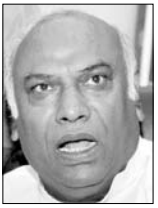
-मल्लिकार्जुन खड़गे, अध्यक्ष, कांग्रेस