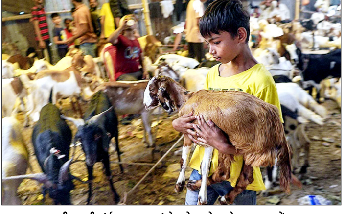
वाराणसी। बकरीट (ईद-उल-अजहा) के त्योहार से पहले पशु बाजार में बकरा खरीदने के बाद उसको गोद में उठाकर ले जाता एक बच्चा।

देश पर हमला अंतर्राष्ट्रीय कानून के खिलाफ है। बचाई ने कहा कि फरवरी के अंत में ईरान पर हुआ अमेरिका-इजरायल हमला और उसके बाद का युद्ध संयुक्त राष्ट्र चार्टर का खुला उल्लंघन है। उनके मुताबिक, संयुक्त राष्ट्र चार्टर किसी भी देश को मनमाने तरीके से दूसरे संप्रभु राष्ट्र पर बल प्रयोग का अधिकार नहीं देता। उन्होंने कहा कि संयुक्त राष्ट्र चार्टर में 'आवश्यक युद्ध' जैसी किसी अवधारणा को मान्यता नहीं दी गई है और अमेरिका अपने 'मनमाने और आक्रामक फैसलों' के आधार पर किसी अन्य देश पर हमला करने का अधिकार नहीं ले सकता। ईरानी प्रवक्ता ने कहा कि अमेरिका-इजरायल हमले को केवल 'आवश्यक युद्ध' कहकर कमतर नहीं आका जा सकता। उन्होंने इसे संयुक्त राष्ट्र चार्टर के अनुच्छेद 2(4) का स्पष्ट उल्लंघन और 'संप्रभु राष्ट्र के खिलाफ आक्रामक कार्रवाई' बताया। बचाई ने कहा कि जो देश कानून के शासन और संयुक्त राष्ट्र चार्टर का सम्मान करते हैं, उन्हें इस हमले की स्पष्ट निंदा करनी चाहिए और जवाबदेही तय करने की मांग करनी चाहिए। ईरान को इस्लामिक रिवायल्यूशनरी गार्ड फोर्स (आईआरजीसी) नौसेना ने दावा किया है कि पिछले 24 घंटों में 35 जहाज, जिनमें तेल टैंकर और कंटेनर पोत शामिल हैं, होर्मुज स्ट्रेट से गुजरे। आईआरजीसी ने कहा कि यह आवाजाही उसकी अनुमति और समन्वय से हुई।