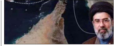
होर्मुज स्ट्रेट में जहाजों से फीस वसूलेगा ईरान