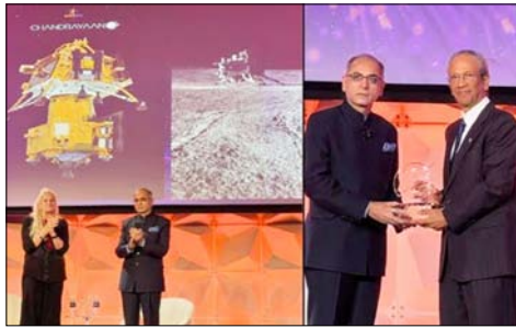
वाला दुनिया का पहला देश बना था। चंद्रमा का दक्षिणी ध्रुव वैज्ञानिक और रणनीतिक दृष्टि से बेहद महत्वपूर्ण माना जाता है। इस क्षेत्र को सतह पर इससे पहले कोई मिशन नहीं पहुंच पाया था। मिशन ने भविष्य के मानव चंद्र अभियानों के लिए अहम वैज्ञानिक आंकड़े उपलब्ध कराए। साथ ही चंद्रमा के दक्षिणी ध्रुवीय क्षेत्र की मिट्टी में कई महत्वपूर्ण रासायनिक तत्वों की मौजूदगी की पुष्टि की।

यह सम्मान 21 मई को वाशिंगटन डीसी में आयोजित कार्यक्रम के दौरान दिया गया। 23 अगस्त 2023 को चंद्रयान-3 ने इतिहास रचते हुए चंद्रमा के दक्षिणी ध्रुव के पास सफल सॉफ्ट लैंडिंग की थी। भारत ऐसा करने