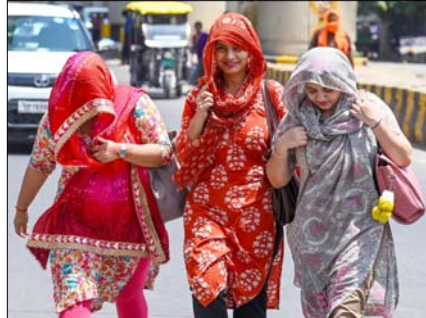
छत्तीसगढ़, हरियाणा, दिल्ली, मध्य प्रदेश, पंजाब, तेलंगाना, उत्तर प्रदेश और महाराष्ट्र में भी हीटवेव चलेंगे। असम, मेघालय, कर्नाटक, तमिलनाडु में भी भारी बारिश का अनुमान है। 24 मई को बिहार, दिल्ली, हरियाणा, उत्तर प्रदेश, मध्य प्रदेश, छत्तीसगढ़, पंजाब, राजस्थान और तेलंगाना में हीटवेव की स्थिति बनी रह सकती है। पश्चिम बंगाल, ओडिशा और तमिलनाडु के कुछ हिस्सों में गर्म और उमसभरा मौसम बना रह सकता है।

ओडिशा का बोलांगीर और बिहार का सासाराम सबसे ज्यादा गर्म रहा। भारतीय मौसम विभाग के मुताबिक देश के 35 शहरों में गुरुवार को रात का पारा 30 डिग्री सेल्सियस से ऊपर रहा। बिहार के पटना और गयाजी में गर्मी के कारण 22 से 26 मई तक 5वीं तक के स्कूल बंद किए गए हैं। मधेपुरा और सहरसा में गुरुवार को बिजली गिरने से 3 लोगों की मौत हो गई। पंजाब सरकार ने सरकारी दफ्तरों और स्कूलों का समय बदल दिया है। अब दफ्तर और स्कूल सुबह साढ़े 7 बजे खुलेंगे और दोपहर 1.30 बजे बंद होंगे। 23 मई को राजस्थान में गंभीर हीटवेव का अलर्ट है। रातों भी गर्म रहेंगी।