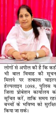
लोगों से अपील की है कि कहीं भी बाल विवाह की सूचना मिलने पर तत्काल चाइल्ड हेलपलाइन 1098, पुलिस या जिला प्रोबेशन कार्यालय को सूचित करें, ताकि समय रहते बच्चों के भविष्य को सुरक्षित किया जा सके।