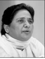
—सुश्री मायावती, अध्यक्ष, बसपा

सरकार को बिजली संकट से आमजन को निजात दिलाने के त्वरित उपाय करने चाहिए, बिजली संकट से गरीब, मध्यम वर्ग, किसान, छोटे व्यापारी और करोड़ों मेहनतकश लोगों का जीवन अति-कष्टदायी बन गया है, उत्तर प्रदेश जैसे विशाल आबादी वाले राज्य में भीषण गर्मी के इस मौसम में बिजली की कम आपूर्ति व कटौती आदि की आम शिकायतों को लेकर लोग विभिन्न रूपों में अपना आक्रोश भी प्रकट कर रहे हैं, जिसकी चर्चा समाचार माध्यमों में भी काफी व निरन्तर रहती है, सरकार बिजली आपूर्ति सम्बन्धी लोगों के कष्ट व परेशानियों को ध्यान में रखते हुए जरूरी उपाय तत्काल सुनिश्चित करे, साथ ही, नए बिजलीघर के माध्यम से भी आगे के लिए बिजली आपूर्ति को सुधारने का प्रयास करे तो यह व्यापक जनहित में उचित होगा।