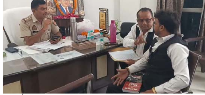
आरोप है कि जब पुलिस अधिकारियों से कथित एनबीडब्ल्यू और कानूनी प्रक्रिया के संबंध में जानकारी