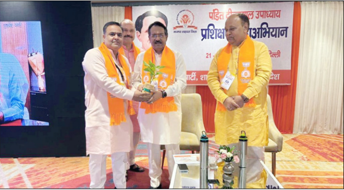
शाहदरा एवं मयूर विहार जिलों के दो दिवसीय संगठनात्मक प्रशिक्षण के लिए आयोजित रात्रि प्रवासिये पं. दीनदयाल उपाध्याय महाप्रशिक्षण अभियान सम्पूर्ण हुए।