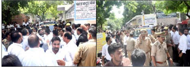
घटना के बाद हंगामा करने अधिकवक्तगण।

■ वकील का आरोप चेंबर में हमला करने आए थे तीन युवक ■ हंगामे को वीडियो सोशल मीडिया पर हुए वायरल