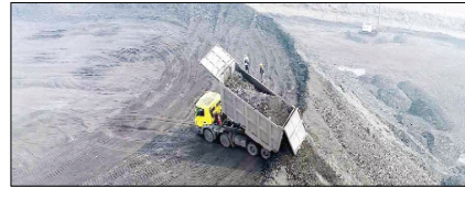
काला सोना या देश का हरा भविष्य? सम्पादकीय