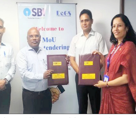
दिल्ली सरकार ने एकीकृत ई-पेमेंट सिस्टम शुरू करने के लिए एसबीआई के साथ एमओयू साइन किया।

सुबह छह बजे से शुरू होंगी। आमतौर पर रविवार को इन लाइनों पर सेवाएं सुबह सात बजे शुरू होती हैं, लेकिन इस बार एक घंटे पहले संचालन किया जाएगा। हाईकोर्ट ने भारतीय कुश्ती संघ को फटकारा नई दिल्ली। पहलवान विनेश फोगाट को घरेलू इवेंट्स में खेलने से अयोग्य घोषित करने लिए दिल्ली हाईकोर्ट ने शुक्रवार को भारतीय कुश्ती संघ को कड़ी फटकार लगाई। इसके साथ ही कोर्ट ने केंद्र को एक पैनल तैयार करने को कहा जो विनेश का मूल्यांकन करेगा।