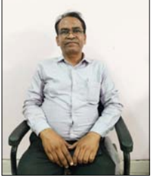
सुरक्षा विभाग ने स्पष्ट किया कि विद्युत सुरक्षा अनारपति प्रमाण पत्र लेने से पहले सभी सुरक्षा व्यवस्थाओं को दुरुस्त करना आवश्यक होगा। इसके लिए निवेश मित्र पोर्टल के माध्यम से ऑनलाइन आवेदन किया जा सकता है।