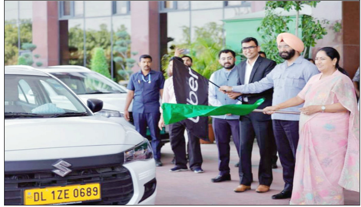
मुख्यमंत्री रेखा गुप्ता ने शहरी परिवहन को बढ़ावा देने को लेकर राइड-शेयरिंग सेवा को हरी झंडी दिखाकर रवाना करते हुए।

राइड-शेयरिंग सेवा का शुभारंभ ट्रैफिक जाम कम करने, वाहनों से होने वाले उत्सर्जन को घटाने तथा नागरिकों को साइरा और पर्यावरण-अनुकूल परिवहन अपनाने के लिए प्रेरित करने की दिशा में एक महत्वपूर्ण कदम है।