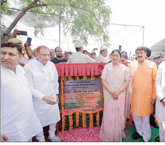
मुख्यमंत्री रेखा गुप्ता मुखमेलपुर में ऑक्सीजन पार्क का शिलान्यास करते हुए।

पार्क सैर, व्यायाम, योग, मनोरंजन और सामुदायिक गतिविधियों का एक आदर्श केंद्र बनेगा। मुख्यमंत्री ने कहा कि इस वर्ष दिल्ली सरकार 70 लाख से अधिक पेड़, झाड़ियाँ और हेंज लगाने का लक्ष्य लेकर चल रही है। मुख्यमंत्री ने क्षेत्र में मौजूद गंदे नालों को ढकने और अन्य स्थानीय विकास कार्यों के लिए भी आवश्यक वित्तीय सहायता उपलब्ध कराने का आश्वासन दिया। उन्होंने बताया कि सांसद एवं स्थानीय जनप्रतिनिधियों के सुझावों पर बुराड़ी विधानसभा क्षेत्र के लिए 20 करोड़ रुपये की विकास परियोजनाओं को स्वीकृति दी गई है, जिनमें सीवर लाइन और पेयजल पाइपलाइन से संबंधित कार्य शामिल हैं।