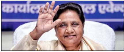
बिजली संकट से निजात दिलाने के उचित कदम उठाए सरकार: मायावती

नई दिल्ली, मुजफ्फरनगर, देहरादून, हल्द्वानी, मुताबाद, बरेली, मेरठ व लखनऊ से प्रकाशित