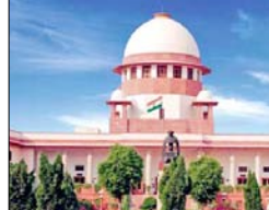
कहा: अगर संपन्न बच्चों के लिए फिर से आरक्षण मांगा जाए, तो हम कभी भी इस चक्र से बाहर नहीं निकल पाएंगे

जस्टिस बीवी नागरला और जस्टिस उज्वल भूइया की बेंच ने ये कमेंट तब किया। जब वे कर्नाटक हाईकोर्ट के एक फैसले के खिलाफ दायर याचिका पर सुनवाई कर रहे थे। याचिकाकर्ता को क्रीमी लेयर के आधार पर