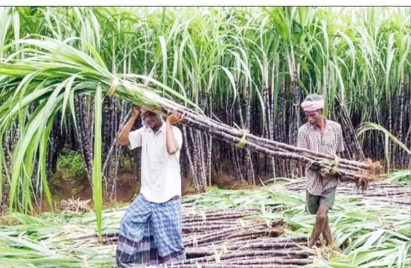
तथा उद्योग और किसानों के बीच संतुलित व्यवस्था को प्राथमिकता दी जानी चाहिए।

उर्वरकों पर खर्च करने की बारी आती है तब रिकवरी आधारित भुगतान की बात की जाती है। यह व्यवस्था किसानों के साथ न्यायसंगत नहीं कही जा सकती। बायो प्रोडक्ट उद्योग तेजी से विकसित हो रहा है। नई तकनीकों और उपयोगों के कारण गन्ने का औद्योगिक महत्व हर वर्ष बढ़ रहा है। इसलिए एक कानून स्थाई रूप से न बनाकर प्रत्येक 10 वर्ष बाद पुनः समीक्षा और संशोधन के साथ लागू किया जाना चाहिए। रिकवरी आधारित मूल्य निर्धारण किसानों के शोषण का कारण बन सकता है। वर्तमान व्यवस्था में कई मामलों में यह निर्णय उद्योगों और बाजार की आवश्यकता के अनुसार चलता है। यदि रिकवरी वास्तव में उद्योग के लिए हानिकारक होती तो देश में चीनी मिलों की संख्या लगातार ना बढ़ती और नई मिलें स्थापित करने की योजनाएं न बनती। अतः गन्ना अधिनियम 2026 बनाते समय किसानों के हितों की रक्षा, गन्ने से बनने वाले सभी उत्पादों का आर्थिक मूल्यांकन, मिट्टी की उर्वरता की वास्तविक लागत