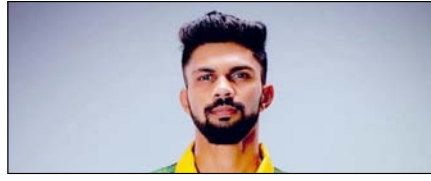
सीएसके के कप्तान गायकवाड़ पर लगा 2.4 लाख का जुर्माना