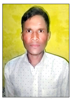
मृतक का फाइल फोटो।

शाह टाइम्स संवाददाता फलावदा। थाना क्षेत्र के निकटवर्ती गांव बातनौर में शुकुवार शाम एक दिल दहला देने वाला हादसा सामने आया है। यहां घेर में पशुओं का दूध निकालने के लिए नल से बाल्टी में पानी भरते समय एक युवक की करंट की चपेट में आने से गंभीर रूप से तड़पकर मौत हो गई। परिजन उसे महलका में स्थित एक प्राइवेट अस्पताल ले गए थे। वहां डॉक्टरों ने उसे मृत घोषित कर दिया।