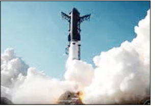
■ लगभग एक घंटे बाद स्टारशिप स्पेसक्राफ्ट हिंद महासागर में सुरक्षित लैंड करने में कामयाब रहा

टेक्सास। दुनिया के सबसे ताकतवर राकेट स्टारशिप पर के नए और बड़े वर्जन (वी-3) का पहला लॉन्च सफलताओं और नकारात्मकताओं का मिश्रण-जुला सफर रहा। टेक्सास के दक्षिणी छोर पर स्थित स्टारबेस लॉन्चिंग पैड से उड़ान भरने के बाद इंजन में खराबी आ गई। इस कारण राकेट के नष्ट होने का खतरा मंडरा रहा था। इसके बावजूद लगभग एक घंटे बाद स्टारशिप स्पेसक्राफ्ट हिंद महासागर में सुरक्षित लैंड करने में कामयाब रहा। स्टारशिप सीरीज के पहले भी कई लॉन्च हो चुके हैं, लेकिन इस तीसरी पीढ़ी (वी-3) के अपग्रेड राकेट का पहला ही टेस्ट था और स्टारशिप का 12वां टेस्ट था। इसे भारतीय समय के अनुसार 23 मई की सुबह लॉन्च किया गया। दुनिया के सबसे अमीर कारोबारी इलान मस्क की कंपनी स्पेसएक्स ने इस राकेट को बनाया है। स्टारशिप स्पेसक्राफ्ट (ऊपरी हिस्सा) और सुपर हेवी बुस्टर (निचला हिस्सा) को कलॉकविली 'स्टारशिप' कहा