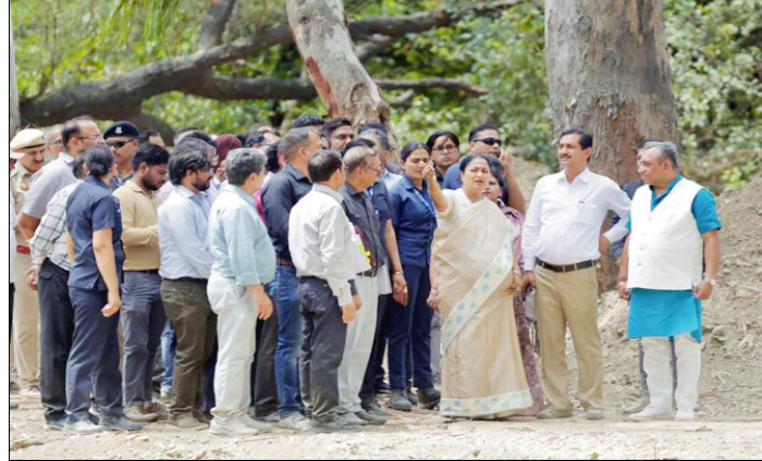
मुख्यमंत्री रेखा गुप्ता शालीमार बाग में विकास कार्यों का निरीक्षण करते हुए।

कमी आएगी, सार्वजनिक स्थलों की उपयोगिता बढ़ेगी और क्षेत्र का स्वरूप भी बेहतर होगा। मुख्यमंत्री ने एपी ब्लॉक, पीतमपुरा में विभिन्न विकास कार्यों का उद्घाटन किया। इनमें बाउंड्री वॉल निर्माण, सड़क एवं नाली निर्माण तथा बाजार क्षेत्र में आधारभूत ढांचे के विकास से जुड़े कार्य शामिल हैं। मुख्यमंत्री ने कहा कि तेजी से विकसित हो रहे शहरी क्षेत्रों में आधारभूत सुविधाओं का विस्तार समय की आवश्यकता है।