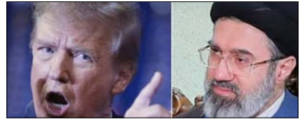
ट्रम्प की धमकियों पर ईरान का पलटवार