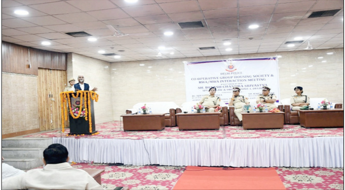
पूर्वी जिला पुलिस आरडब्ल्यूए तथा सहकारी समूह आवास समितियों के साथ संवाद बैठक करते हुए।