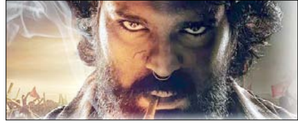
'पेड़ड़ी' दे सकती है रामचरण के करियर को नई पहचान