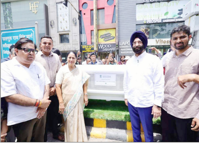
मुख्यमंत्री रेखा गुप्ता 'अल्ट्रा-मॉडर्न' एयर प्युरीफायर्स का ग्राउंड निरीक्षण करती हुईं।

नई दिल्ली। करोल बाग, राजेंद्र नगर, पटेल नगर और पूसा संस्थान आने-जाने वाले लोगों को जल्द राहत मिलने वाली है। लोक निर्माण विभाग दक्षिण-पश्चिम दिल्ली के इन इलाकों से जुड़ी पांच प्रमुख सड़कों पर सुदृढ़ीकरण नए सिरे करेगा। इसके लिए एक करोड़ रुपये का बजट स्वीकृत किया गया है। पीडब्ल्यूडी के एक अधिकारी ने बताया कि इस काम के तहत पूसा रोड पर पूसा गोल चक्कर से दयाल चौक तक, आईएआरआई की आंतरिक सड़क रतनपुरी चौक से पूसा एम्प्लॉयमेंट एक्सचेंज गेट तक, नारायण क्षेत्र से गुजर रहे ओपी भारतीय मार्ग पर सुधार कार्य कराया जाएगा।