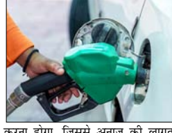
इसके अलावा दिल्ली-एनसीआर में सीएनजी की कीमतें 1 रुपये किलो बढ़ गई हैं। इस बदलाव के बाद दिल्ली में सीएनजी अब 81.09 प्रति किलो मिलेगी। पिछले 10 दिन में यह तीसरी बढ़ोतरी है। इससे पहले सरकार ने 15 मई को सीएनजी के दाम 2 रुपये और फिर 18 मई को 1 रुपये बढ़ाए थे। नई कीमतें 23 मई से लागू हो गई हैं। ईंधन की कीमतों में 9 दिन में यह तीसरी बढ़ोतरी है। 4 दिन पहले 19 मई को पेट्रोल और डीजल के दामों में एक्सेज 90 पैसे प्रति लीटर की बढ़ोतरी की गई थी। जबकि, 15 मई को भी कीमतों में 3 प्रति लीटर का इजाफा किया गया था। पेट्रोल और डीजल की कीमतों में वृद्धि से ट्रेक और टेम्पो का क्रिया बंद जाएगा, जिससे दूसरे राज्यों से आने वाली सब्सिडी, फल और राशन महंगे हो जाएंगे। ट्रेक्टर और पीपिंग सेट चलाने के लिए किसानों को ज्यादा खर्च

पेट्रोल 87 पैसे, डीजल 91 पैसे और सीएनजी एक रुपये किलो तक हुई महंगी