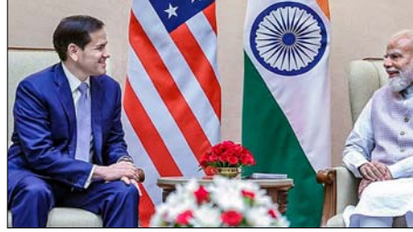
जयशंकर, राष्ट्रीय सुरक्षा सलाहकार अजित डोभाल, भारत एलिसन हूकर भी मौजूद थीं। रुबियो की यह यात्रा अमेरिकी में अमेरिकी राजदूत सर्जियो गोर और अमेरिकी अंडर सेक्रेटरी

नई दिल्ली। अमेरिकी विदेश मंत्री मार्को रुबियो ने शनिवार को प्रधानमंत्री नरेंद्र मोदी से सेवा तीर्थ में मुलाकात की। इस दौरान उन्होंने अमेरिकी राष्ट्रपति डोनाल्ड ट्रम्प की तरफ से पीएम मोदी को अमेरिका आने का न्योता दिया। दोनों नेताओं ने रक्षा, व्यापार, ऊर्जा, रणनीतिक तकनीक और इंडो-पैसिफिक सहयोग समेत कई मुद्दों पर चर्चा की। बैठक में परिचय एशिया की स्थिति और ईरान संकट पर भी बातचीत हुई। बैठक में विदेश मंत्री एस