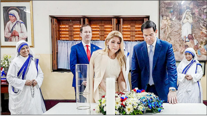
कोलकाता। भारत में अमेरिकी राजदूत सर्जियो गोरो और अमेरिकी विदेश मंत्री मार्को रूबियो ने सेंट टेरेसा मिशनरीज ऑफ चैरिटी के मुख्यालय मदर हाउस का दौरा करते हुए।