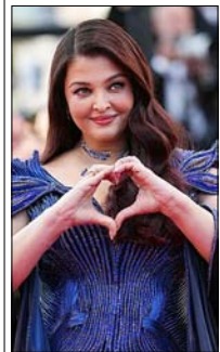
ऐश्वर्या राय बच्चन फ्रांस के कांस में आयोजित 79वें अंतर्राष्ट्रीय फिल्म महोत्सव में फिल्म द बर्थडे पार्टी के प्रीमियर के दौरान।

सुप्रीम कोर्ट ने मामलों की लिस्टिंग को लेकर नया आदेश किया जारी नई दिल्ली। ईद-उल-अज़हा (बकरीद) की छुट्टी में बदलाव के कारण सुप्रीम कोर्ट प्रशासन ने मामलों की लिस्टिंग को लेकर नया आदेश जारी किया है। सोनीआई के निदेशानुसार, अब 28 मई को अदालत में छुट्टी रहेगी और 27 मई को नियमित कामकाज होगा। अधिवक्ता और वादकारी ध्यान दें कि 28 मई के सुनवाई मामले अब एक दिन पहले यानी 27 मई को ही सुनवाई के लिए टेक-अप किए जाएंगे।