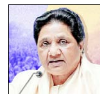
यूपी विधानसभा व आमचुनाव की तैयारियों में किसी भी प्रकार की कोताही न बरतने की कार्यकर्ताओं को हिदायत

शाह टाइम्स ब्यूरो लखनऊ। उत्तर प्रदेश की पूर्व मुख्यमंत्री और बहुजन समाज पार्टी की राष्ट्रीय अध्यक्ष एवं उत्तर प्रदेश की चार बार मुख्यमंत्री रहें मायावती ने रविवार को लखनऊ में बसपा उत्तर प्रदेश इकाई की बड़ी बैठक में पार्टी संगठन की समीक्षा की। लखनऊ में 12 माल एव्यू स्थित प्रदेश कार्यालय में हुई इस विशेष बैठक में पोलिंग बूथ स्तर तक संगठन की जमीनी मजबूती, विधानसभा आमचुनाव की तैयारियों और जनाधार बढ़ाने पर गहन चर्चा हुई। मायावती ने पिछली बैठक के निर्देशों की प्रगति रिपोर्ट पर संतोष जताया। साथ ही कहा कि देश में चुनाव जिस तरह नई-नई चुनौतियों के बीच हो रहे हैं, उसे देखते हुए पार्टी की तैयारियों को हर स्तर पर और अधिक चुस्त-दुरुस्त व मुस्तैद बनाने की जरूरत है। उन्होंने कहा कि पार्टी के पक्ष में बढ़ते जन रुझान को चलेते यूपी में पांचवां बार सर्वजन हितैषी सरकार बनाने का मिशन। री लक्ष्य सुनिश्चित करना है। बैठक में विधानसभा, जिला एवं स्टेट कमिटी के पदाधिकारियों और पोलिंग बूथ स्तर के प्रमुख प्रभारियों ने भाग लिया। मायावती ने यूपी विधानसभा आमचुनाव की तैयारियों में किसी भी प्रकार की कोताही न बरतने की हिदायत दी। उन्होंने कहा कि धुरंधर विरोधियों की हर चाल का मुकाबला सन 2007 की तरह ही पूरी तरह से आत्मबल से ही करना है। प्रत्याशियों के चयन में बरती जा रही सावधानी को उन्होंने देश और जनहित में उचित बताया। मायावती ने कहा कि कुल मिलाकर 'हाथी पर बटन दबाना है, सत्ता में वापस आना है' के