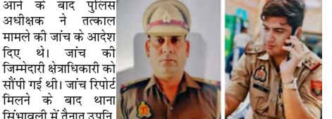
सिंभावली में तैनात उपनि.