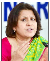
सुप्रिया श्रीनेत, चेयरमैन, कांग्रेस सोशल मीडिया विभाग

उप्र के सभी 75 जिलों में बिजली कटौती से विकराल स्थिति उत्पन्न हो गई है, जनता तकलीफें झेलने को मजबूर है, देश के 50 सबसे गर्म शहरों में से 26 शहर उत्तर प्रदेश के हैं, लेकिन भीषण गर्मी के बीच लोगों को 24 घंटे में केवल सात-आठ घंटे ही बिजली मिल पा रही है, मेरठ से लेकर बलिया तक लोग बिजली संकट से परेशान हैं और कई जगहों पर लोग रात में घरों से निकलकर सड़कों पर सोने को मजबूर हैं, राजधानी लखनऊ तक में घंटों बिजली गुल रहने से अस्पतालों की सेवाएं प्रभावित हो रही हैं, एक्स-रे और स्कैन जैसी सुविधाएं ठप पड़ गई हैं, कानपुर देहात के मेडिकल कॉलेज के छात्रों को देर रात तक बिजली नहीं मिलने के कारण धरने पर बैठना पड़ा।