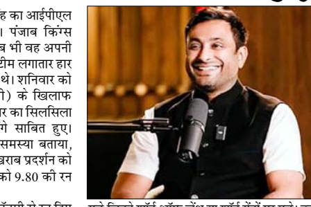
पड़े जितने शॉर्ट ऑफ लेंथ या शॉर्ट गेंदों पर पड़े। उन्हें इस बात का ध्यान रखना होगा, क्योंकि फिलहाल उनकी शॉर्ट गेंद में पहले जैसी धार नहीं दिख रही। शायद शरीर थका हुआ है या कुछ महीने पहले जैसी ऊर्जा नहीं बची। लेकिन इसकी भरपाई उन्हें फुल गेंदबाजी करके करनी होगी। दिलचस्प बात यह है कि आईपीएल 2025 की तुलना में इस सीजन अर्शादीप को फुल या लुथ गेंदों पर कम सफलता मिली है।