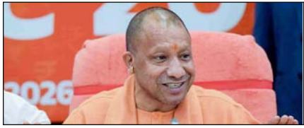
बिजली आपूर्ति में लापरवाही बर्दाश्त नहीं: योगी पेज 2

नई दिल्ली, मुजफ्फरनगर, देहरादून, हल्द्वानी, मुगदाबाद, बरेली, मेरठ व लखनऊ से प्रकाशित