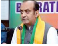
भारत को अस्थिर करने के खतरनाक मंसूबों वाली मानसिकता का सरआम प्रदर्शन