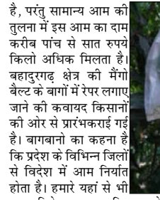
यहां से पैकिंग में तैयार किया जा रहा है आम, दिल्ली, मुंबई शहरों की मंडी में जाकर वहां से विभिन्न देशों के लिए जाएगा। इसको लेकर उन्होंने उद्यान विभाग सहित मंडी के व्यापारियों से भी संपर्क करना शुरू कर दिया है। क्योंकि स्थानीय आम मार्किट में आ चुका है।

आम के काफी संख्या में बाग हैं। आम के बागों में वर्तमान में पेंडों पर फसल लगी हुई है। ऐसे में यहां के किसान अपनी अपनी फसलों को सुरक्षित करने में लगे हुए हैं। जिसको लेकर बहादुरगढ़ क्षेत्र की मँगो बैल्ट के बागों में रेंपर लगाए जाने को कागज से तैयार रेंपर में लपेटा जा रहा है, जिसका असल उद्देश्य घृष एवं बारिश में भीगकर काले पड़ने वाले आम की चमक को बरकरार रखना है। इसके अल लगाए जाने से पेंडों पर लगी आम कोड़े मकौड़ों के हमले के साथ ही पक्षियों की चोंच से भी पूरी तरह सुरक्षित हो जाता है, जो विदेशों में निर्यात होने के लिए रेंपर पहली और बेहद अहम शर्त होती है। पेंड पर लगे एक आम को रेंपर से लपेटे जाने में एक से लेकर दो से तीन रुपये की रकम खर्च होती