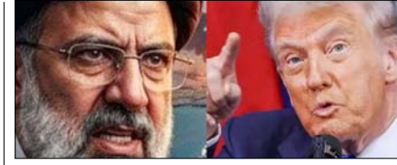
ईरान का अमेरिका को यूरेनियम सौंपने से इन्कार पेज 12