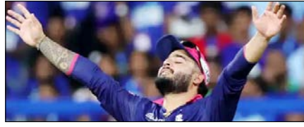
एमआई को हरा शान से प्ले ऑफ में पहुंची आरआर खेल टाइम्स