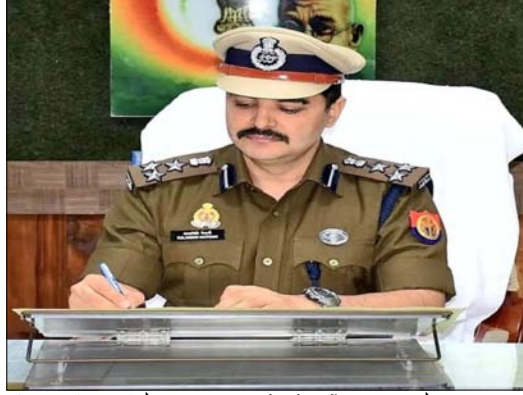
भी निगरानी बढ़ा दी है। अधिका. रियों को निर्देश दिए गए हैं कि स्पष्ट किया है कि त्याहार के