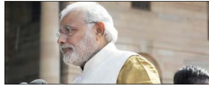
मीडिया: हमको आईना दिखाना है, दिखा देते हैं सम्पादकीय