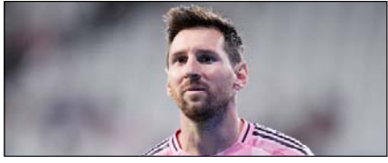
फीफा विश्वकप से पहले मेसी के पैर में लगी चोट खेल टाइम्स