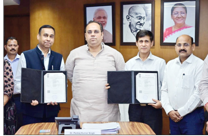
हेल्थकेयर सेक्टर स्किल काउंसिल व चौ. ब्रह्म प्रकाश आयुर्वेद चरक संस्थान ने एमओयू पर हस्ताक्षर किए।