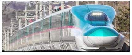
भारत की पहली बुलेट ट्रेन परियोजना: प्रगति का नया अध्याय सम्पादकीय