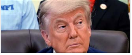
ईरान के साथ ओबामा जैसी डील नहीं करूंगा: ट्रम्प पृष्ठ 12