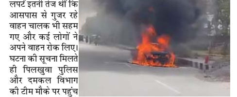
लपटें इतनी तेज थीं कि आसपास से गुजर रहे वाहन चालक भी सहम गए और कई लोगों ने अपने वाहन रोक लिए। घटना की सूचना मिलते ही पिलखुवा पुलिस और दमकल विभाग की टीम मौके पर पहुंच गई। दमकल कर्मियों ने काफी मशक्कत के बाद आग पर काबू पाया, लेकिन तब तक कार पूरी तरह जल चुकी थी। गनीमत रही कि हादसे में कोई हताहत नहीं हुआ। भीषण गर्मी के चलते वाहनों में आग लगने की घटनाएं लगातार बढ़ रही हैं। विशेषज्ञों के अनुसार उससे पहले आग तेजी से फैल गई। देखते ही देखते कार धु-धु कर जलने लगी और उसमें से धमाके जैसी आवाजें आने लगीं। आग की लपटें इतनी तेज थीं कि आसपास से गुजर रहे वाहन चालक भी सहम गए और कई लोगों ने अपने वाहन रोक लिए। घटना की सूचना मिलते ही पिलखुवा पुलिस और दमकल विभाग की टीम मौके पर पहुंच गई। दमकल कर्मियों ने काफी मशक्कत के बाद आग पर काबू पाया, लेकिन तब तक कार पूरी तरह जल चुकी थी। गनीमत रही कि हादसे में कोई हताहत नहीं हुआ। भीषण गर्मी के चलते वाहनों में आग लगने की घटनाएं लगातार बढ़ रही हैं। विशेषज्ञों के अनुसार उससे पहले आग तेजी से फैल गई। देखते ही देखते कार धु-धु कर जलने लगी और उसमें से धमाके जैसी आवाजें आने लगीं। आग की

शाह टाइम्स संवाददाता हापुड़। जनपद में बढ़ती गर्मी अब हादसों की वजह बनने लगी है। रविवार को पिलखुवा हाईवे पर एक चलती कार अचानक आग का गोला बन गई। कार से पहले धुआं उठा और कुछ ही देर में आग ने पूरी गाड़ी को अपनी चपेट में ले लिया। हादसे के दौरान कार में सवार तीन लोगों ने सूझबूझ दिखाते हुए समय रहते बाहर निकलकर अपनी जान बचा ली। घटना के बाद हाईवे पर अफरा-तफरी का माहौल बन गया। प्रत्यक्षदर्शियों के मुताबिक कार हाईवे पर गुजर रही थी तभी बोट से धुआं निकलता दिखाई दिया। चालक कुछ समझ पाता उससे पहले आग तेजी से फैल गई। देखते ही देखते कार धु-धु कर जलने लगी और उसमें से धमाके जैसी आवाजें आने लगीं। आग की