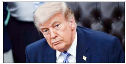
■ ट्रम्प बोले: मुस्लिम देश इजरायल से रिश्ते सुधारें, ये सभी देश अब्राहम समझौते में शामिल हों

वाशिंगटन। अमेरिकी राष्ट्रपति डोनाल्ड ट्रम्प ने सोमवार को कहा कि वे ईरान के साथ ओबामा जैसी डील नहीं करेंगे। उन्होंने कहा कि या तो अच्छा समझौता होगा या फिर कुछ भी नहीं होगा। ट्रम्प ने ईरान के साथ होने वाले समझौते की आलोचना करने वाले नेताओं पर नारा जगी जताई। उन्होंने सोशल मीडिया पर लिखा-जिन्हें ईरान के साथ होने वाले समझौते के बारे में कुछ भी नहीं पता है, वे भी इसकी बुराई कर रहे हैं। ट्रम्प ने कहा कि वे लोग कमजोर हैं और सिर्फ देश को बांटते हैं। ट्रम्प ने यह भी कहा कि उनका संभावित समझौता 2015 के परमाणु समझौते जैसा नहीं होगा। ट्रम्प ने ओबामा के समझौते को आपदा बताया और दावा किया कि उससे ईरान के लिए परमाणु हथियार तक पहुंचने का रास्ता खुल गया था। अभी तक अमेरिका और ईरान के बीच समझौते पर दस्तखत नहीं हो सके। इससे पहले कई मीडिया रिपोर्ट्स में दावा किया गया था कि रिविचर को ही दोनों देश सीजफायर बढ़ाने और होमरुज खोलने को लेकर समझौता कर सकते हैं। ईरान ने ओबामा के जरिए अपना मौखिक संदेश अमेरिका तक पहुंचाया। ईरान के उप विदेश मंत्री काजेम गरीबावदी ने कहा है कि उन्होंने ईरान के विदेश मंत्री अब्बास अराबची का एक मैसेज ओबामा के विदेश मंत्री तक पहुंचाया। ईरान के राष्ट्रपति मसूद पजशकियान ने कहा कि ईरान में कोई भी बड़ा फैसला सुप्रीम लीडर की मंजूरी के