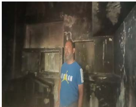
ग्रामीणों ने पीड़ित परिवार को सलाह देते हुए प्रशासन से आर्थिक सहायता दिलाने की मांग की है। गांव के लोगों का कहना है कि गरीब परिवार के लिए यह नुकसान बहुत बड़ा है और प्रशासन को तत्काल राहत उपलब्ध करानी चाहिए।

दौरान घर के अंदर अचानक शॉर्ट सर्किट हुआ और आग लग गई। देखते ही देखते आग ने पूरे कमरे को अपनी चपेट में ले लिया। घर से उठती आग की लपटें देखकर आसपास के ग्रामीण मौके पर पहुंचे और बाल्टियों व अन्य साधनों से आग बुझाने में जुट गए। काफी प्रयासों के बाद आग पर काबू पाया जा सका, लेकिन तब तक घर में रखा सामान पूरी तरह जल चुका था। हादसे में बेटी की शादी के लिए खरीदे गए कपड़े, आभूषण, घरेलू सामान, बिस्तर और करीब 30 हजार रुपये की नकदी जलकर राख हो गई। परिवार के लोगों का कहना है कि यह सामान उन्होंने वर्षों की मेहनत और बचत से जुटाया था। घटना के बाद परिवार का रो-रोकर बुरा हाल है।