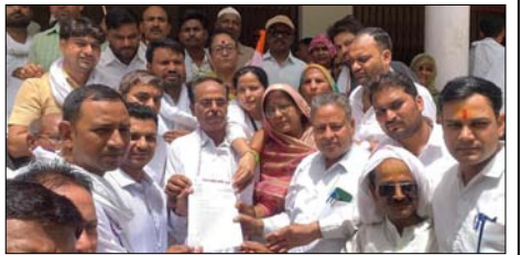
एक नीट की तैयारी कर रही छात्रा के साथ कोचिंग से लौटते समय अपहरण कर 16 दिनों तक बंधक बनाकर उसके साथ अत्याचार किए गए तथा उसे गंभीर शान्तनाए दी गई और दबाव में शादी कराने की कोशिश की गई। उन्होंने इस घटना को अत्यंत निंदनीय बताते हुए इसकी कड़ी निंदा की। कांग्रेस नेताओं ने कहा कि प्रदेश में दलितों और कमजोर वर्गों के खिलाफ ऐसी घटनाएं घिंता का विषय हैं और सरकार कानून-व्यवस्था बनाए रखने में विफल रही है।

efkga उत्तर प्रदेश कांग्रेस नेतृत्व के आह्वान पर जिला कांग्रेस कमेटी मथुरा ने महोबा जनपद में एक दलित छात्रा से जुड़ी कथित गंभीर आपराधिक घटना के विरोध में शांतिपूर्ण सां. केतिक प्रदर्शन किया। प्रदर्शन के बाद राज्यपाल के नाम संबोधित ज्ञान जिलाधिकारी को सौंपा गया।